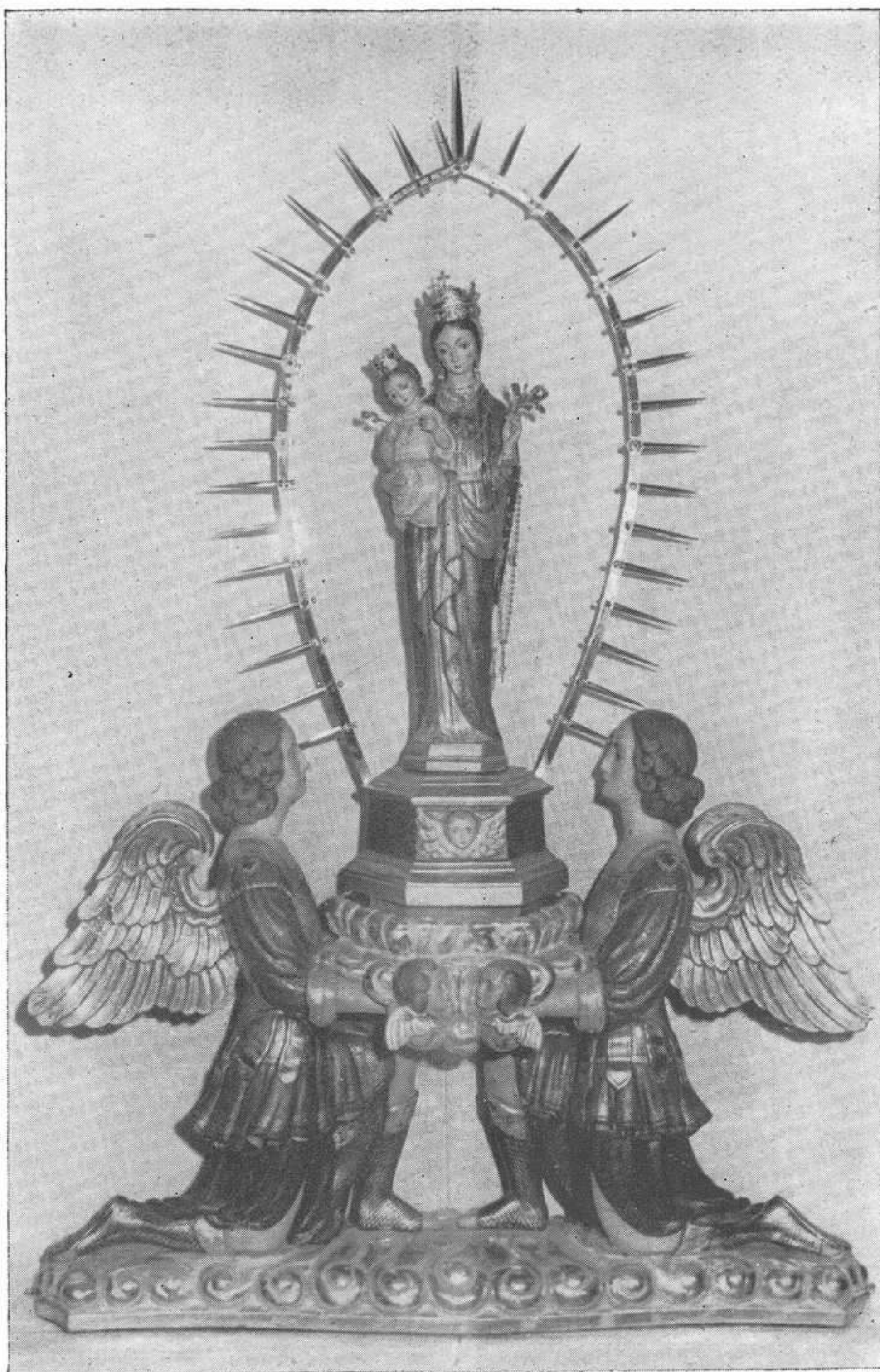
IMAGEN DE NUESTRA SEÑORA DE GRACIA PRECIOSAMENTE CORONADA Y CIRCUNDADA DE AUREOLA.