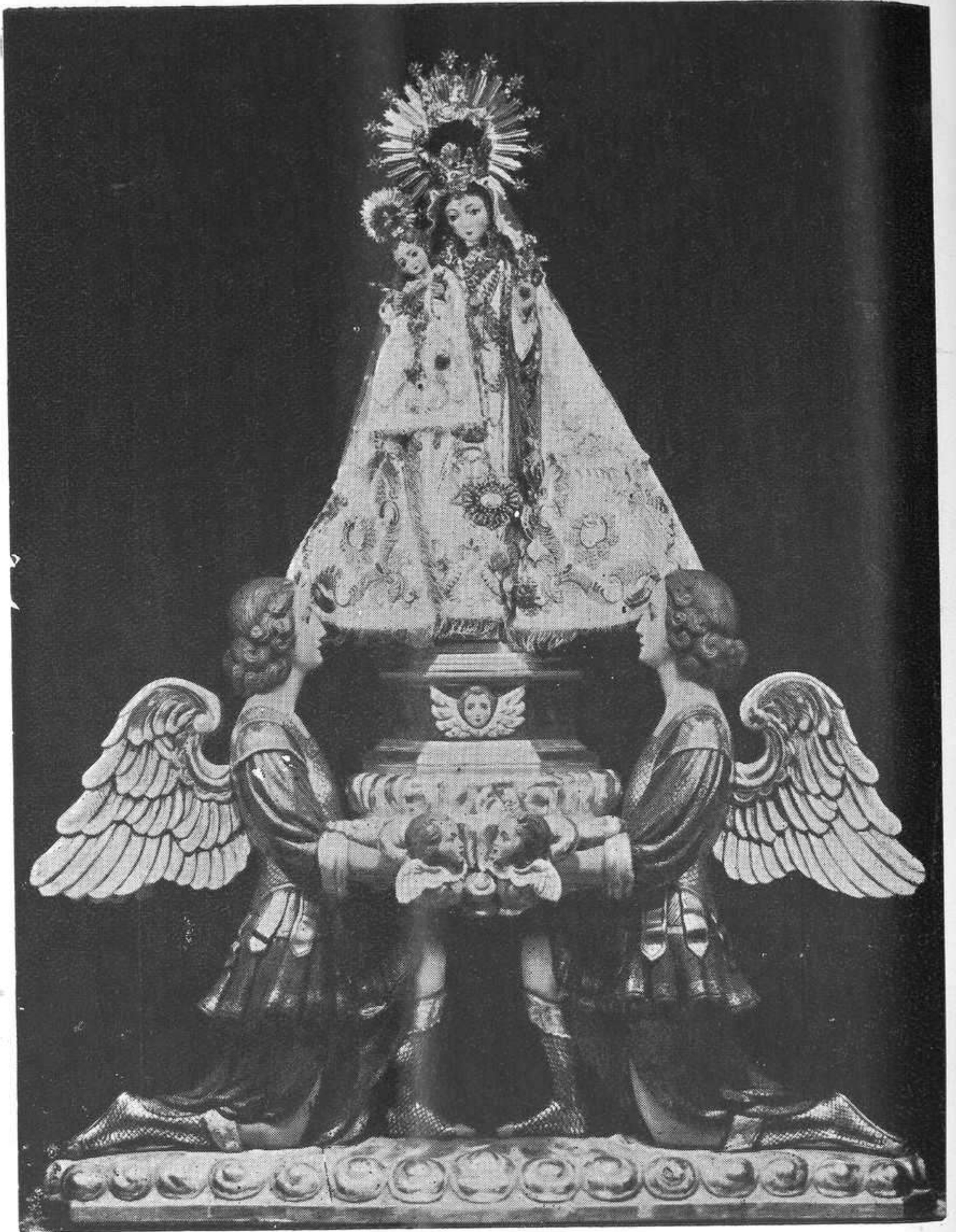
IMAGEN DE NUESTRA SEÑORA DE GRACIA ANTES DE LA CORONACIÓN.