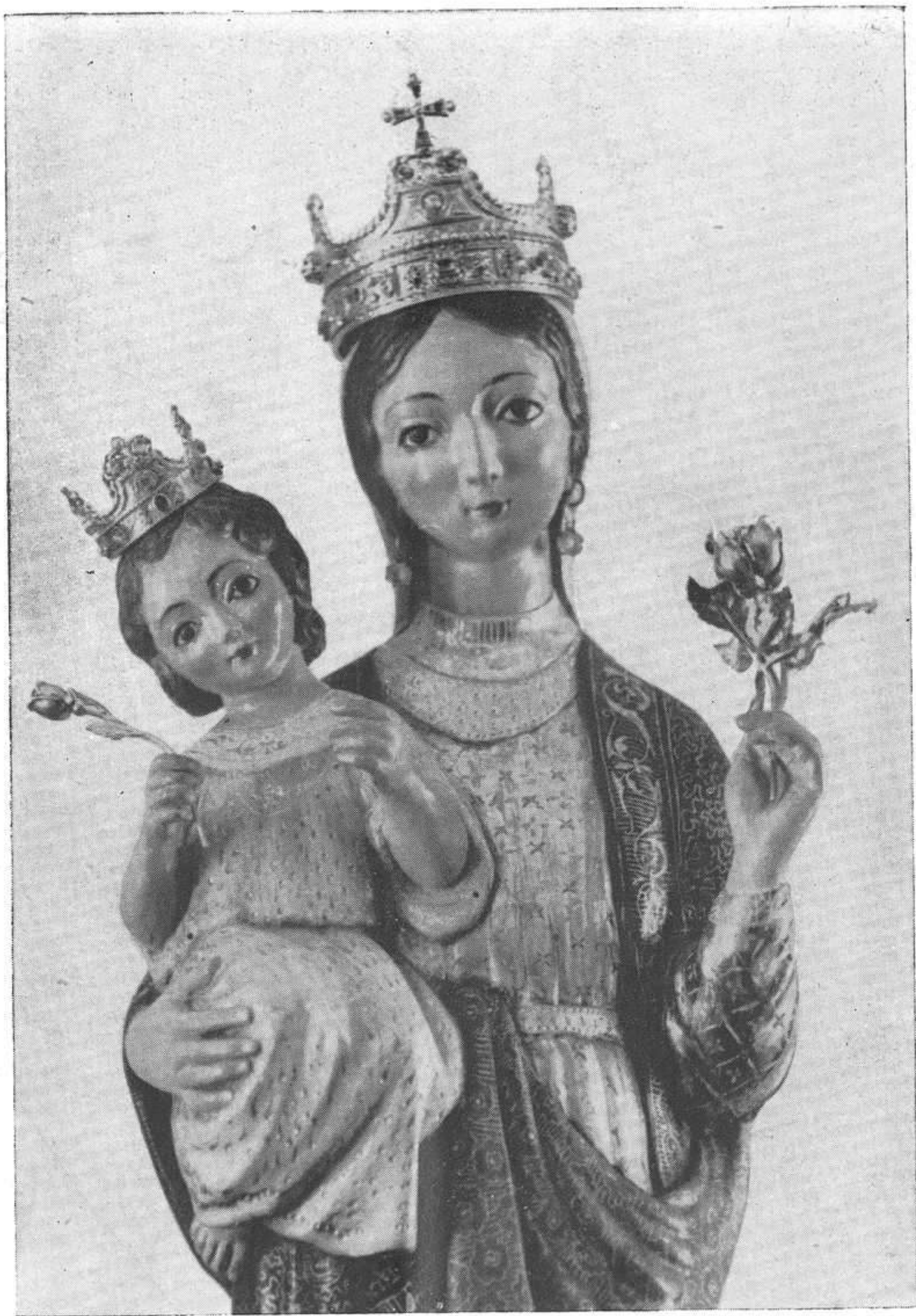
LAS CORONAS DE ORO Y PIEDRAS PRECIOSAS DEL NIÑO JESÚS Y DE LA VIRGEN MADRE.