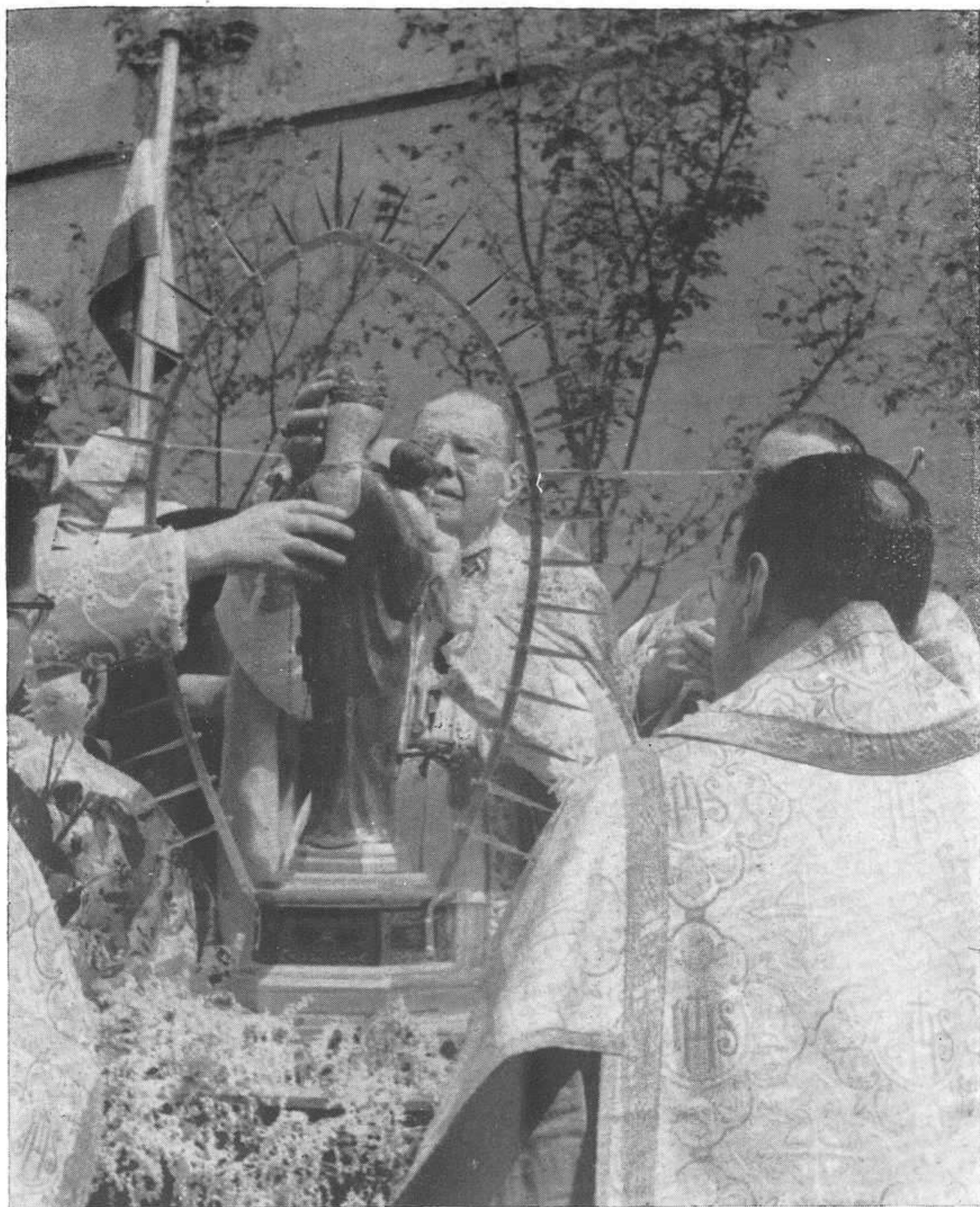
EL ACTO DE LA CORONACIÓN EN LA PLAZA DEL GENERALÍSIMO.