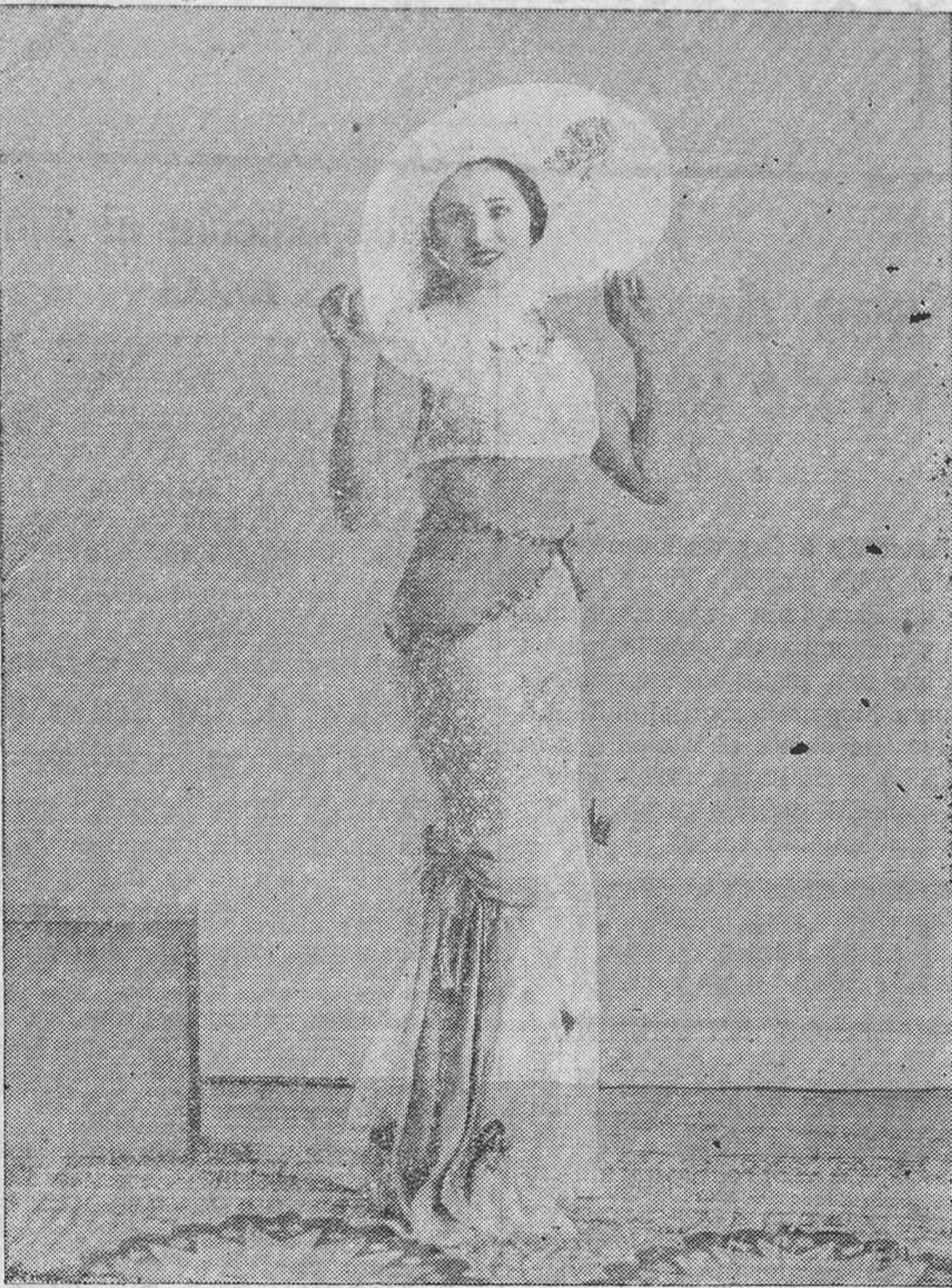
La bellísima Estrella de la Canción, "Condesita del Turia", cuya actuación en Santander constituye un éxito clamoroso.

La mejor tienda Miguel Guerra TORRELAVEGA