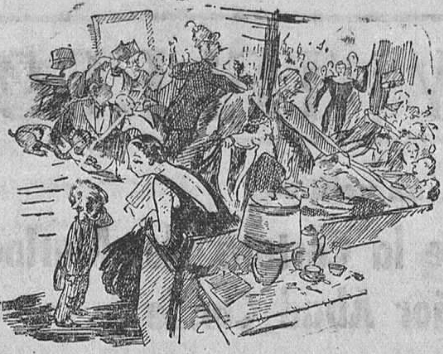
--¡Mamá!... En mi cama hay una porción de gente.