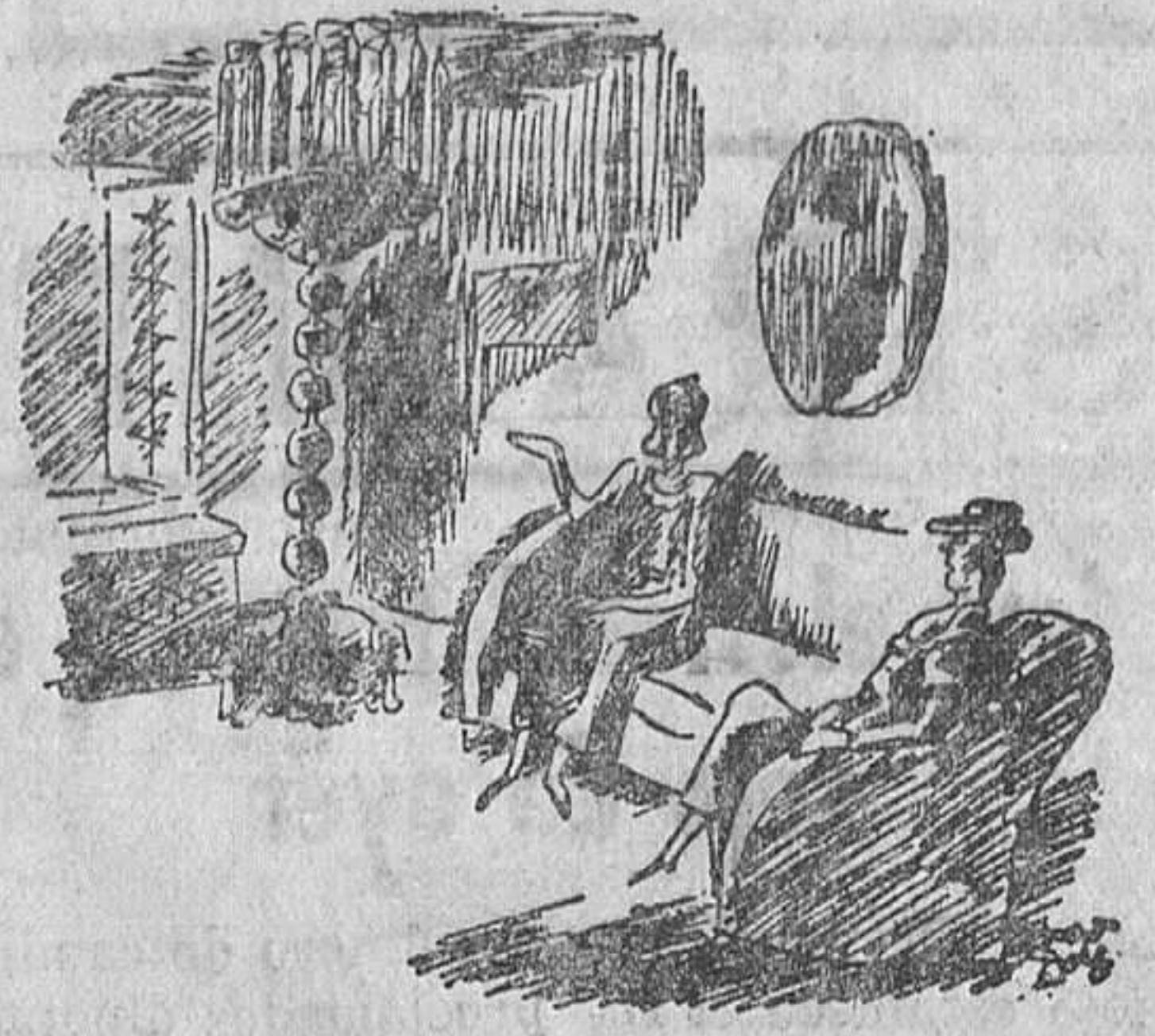
--Nos lo han regalado los Jackson. Como hacía trescientos años que lo tenía la familia, ya se han cansado de él.