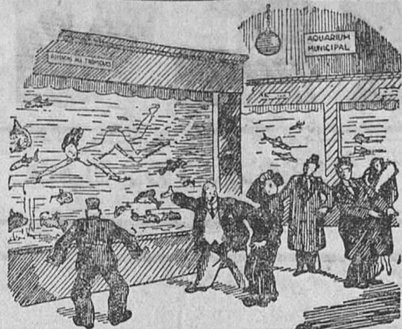
—Me tiene sin cuidado saber como ha entrado en el acuarium. Lo importante es hacerla salir. (De "Candide")

Sólo con acudir al estudio de Variedades "MONTFERRER" ATARAZANAS, 17, 1. Enseñanza gratis (Horas de 4 a 8 tarde)