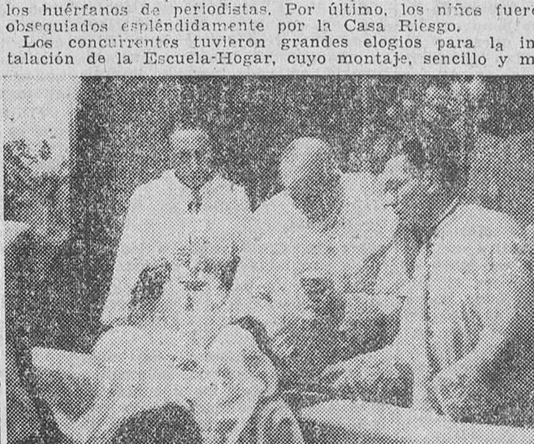
Emocionante acto de administrar la comunión a los acogidos.