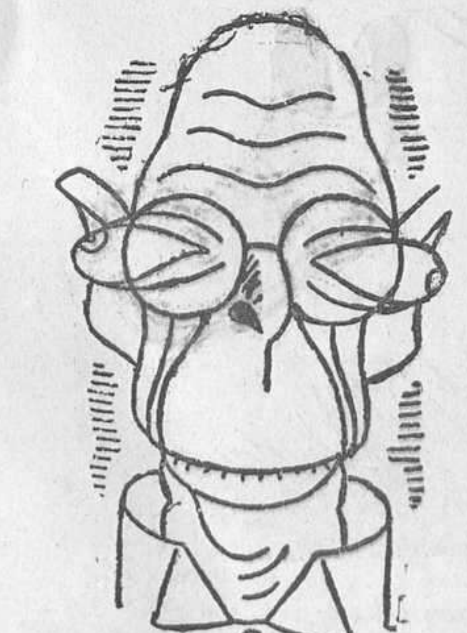
—Ai, senyor! Jo que ja li començava a trobar gust al càrrec!

Fracassa el Tribunal de Garanties (?). Cau el Govern Samper, de trista memòria. S'esmicola la Lliga. Catalunya i el partit que defensa la seva dignitat, resten en peu.