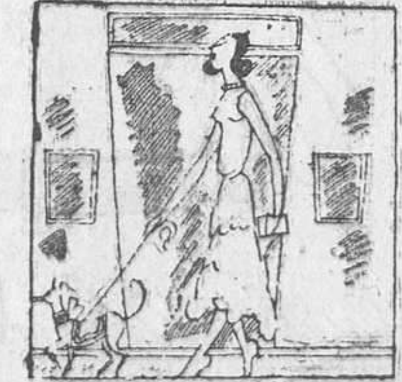
—Té! Ara em toca passejar el gos. I per això vaig votar la Lliga?

Mentre Catalunya i Euscadi formin part de l'Estat Espanyol, no cal somniar en restauracions monàrquiques (Paraules del diputat basc Aguirre).