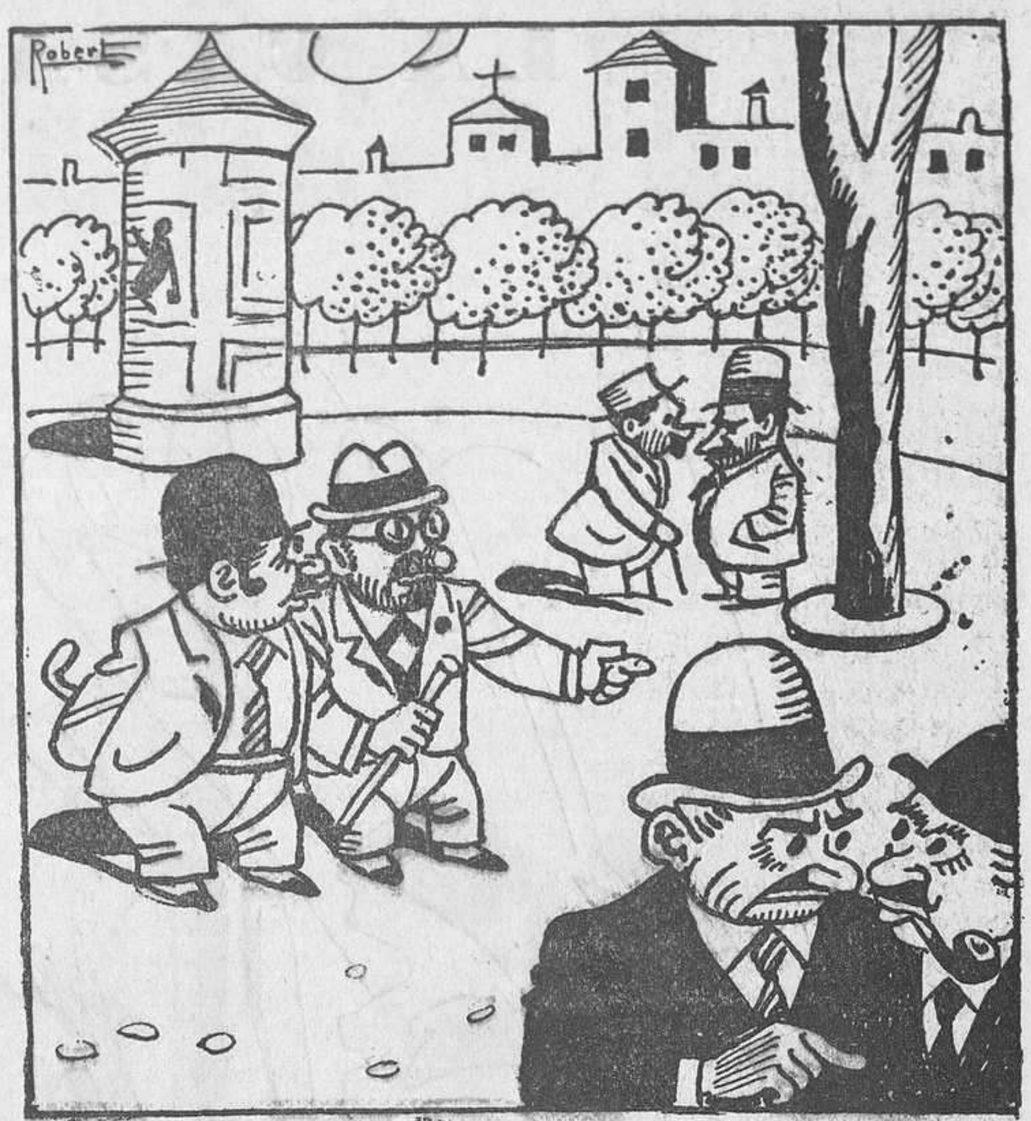
—Noi, quin fracàs això de l'homenatge a Lerroux! —No m'estranya. Com que els capellans, que per agraïment havien de contribuir-hi, han fet l'orni!