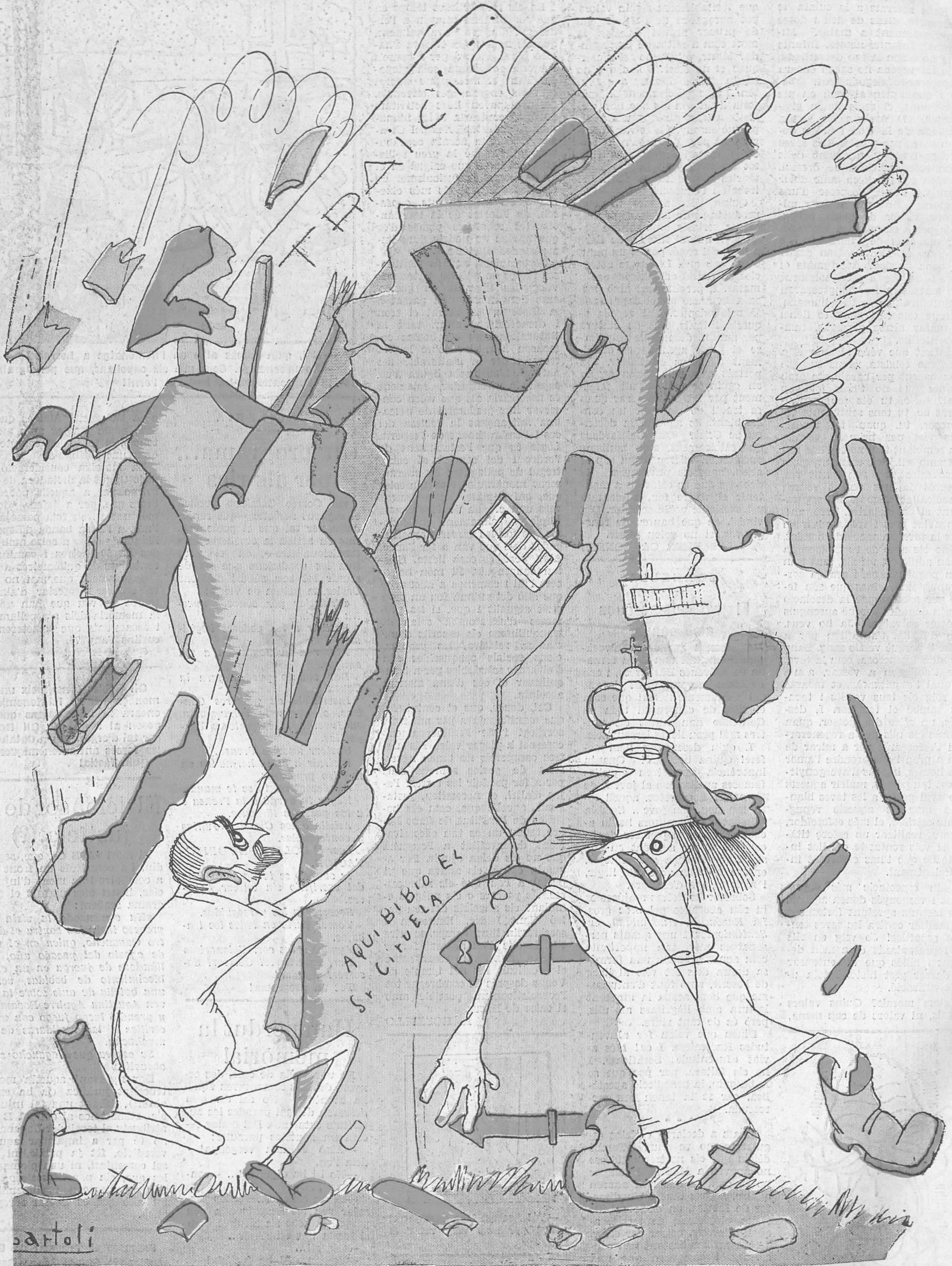
— Això se'n va per terra. — Es culpa del pes que té al damunt!