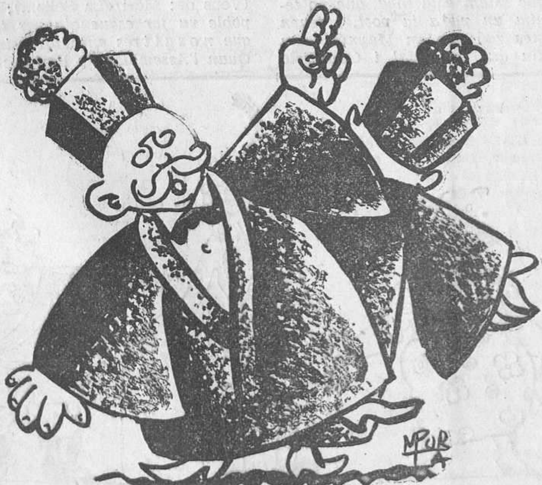
Que bé s'hi està a Barcelona!

Que aprenguin; però, sobretot, que ens deixin estar tranquils, perquè nosaltres, amb els botxins del poble i amb la gent reaccionària centralista no volem saber-ne res.