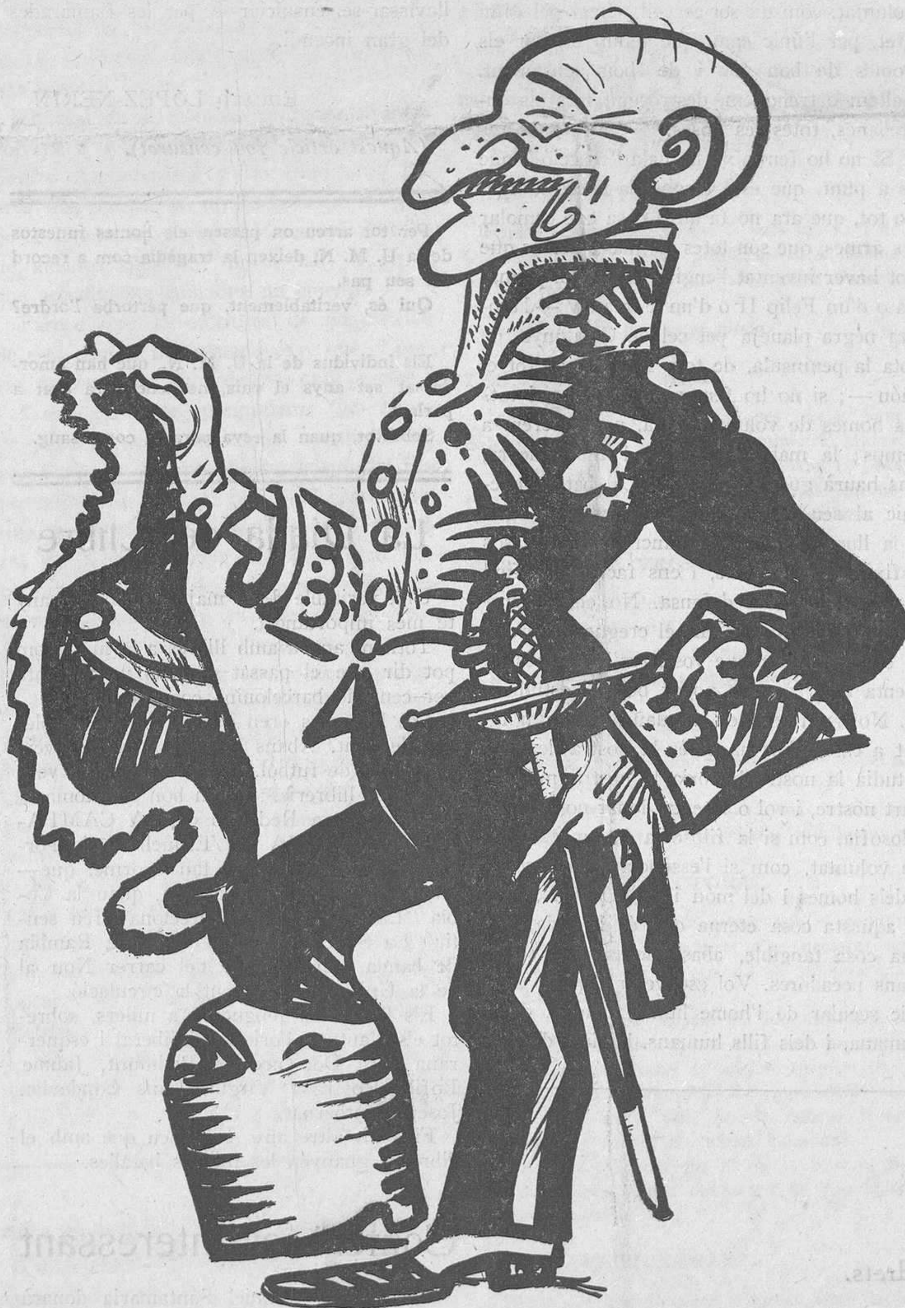
Les aficions del coix

La nació que avui triomfa a casa nostra és Anglaterra. Com que els devem algun reconeixement, ens esforcem a posar noms anglesos als establiments, revistes, atraccions i mil coses més. No seria estrany que, de persistir aquesta penetració, la nostra terra esdevingués una colònia d'aquelles illes orgulloses. No sembla sinó que els devem algunes atencions.