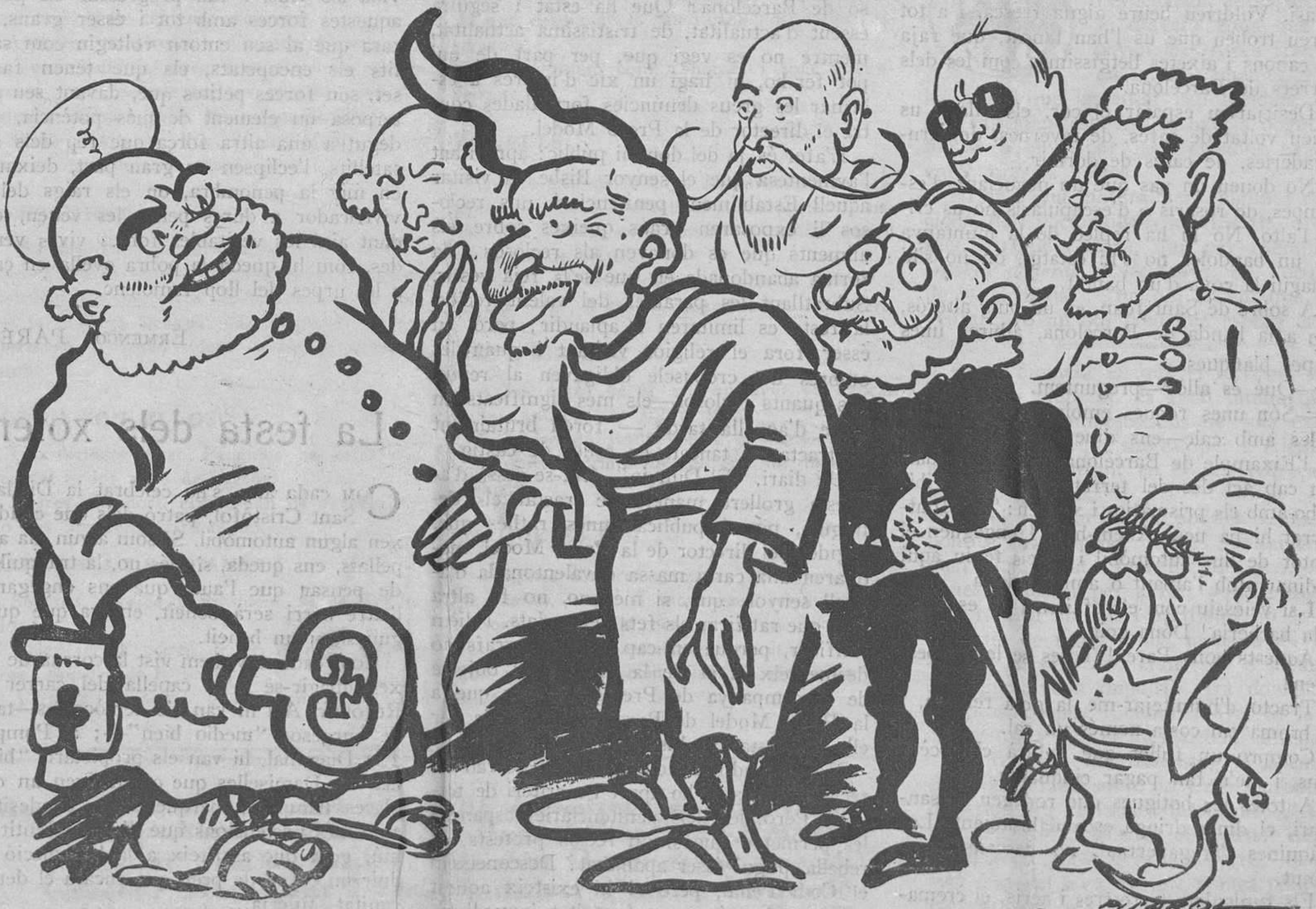
—Ja que tots els antics polítics tornen a actuar, nosaltres protestem perquè tenim més dret que ells. Així és que ens haurà de deixar baixar.

Per això ens vénen a la memòria mil actes de la seva vida exemplar; i acceptem que si per nosaltres aquell home fou quelcom, devia ésser-ho pels altres, aquells que es complagueren en menysprear el seu nom, les seves obres i els seus records. Però aquells no eren més que quatre gats incultes, sortosament.