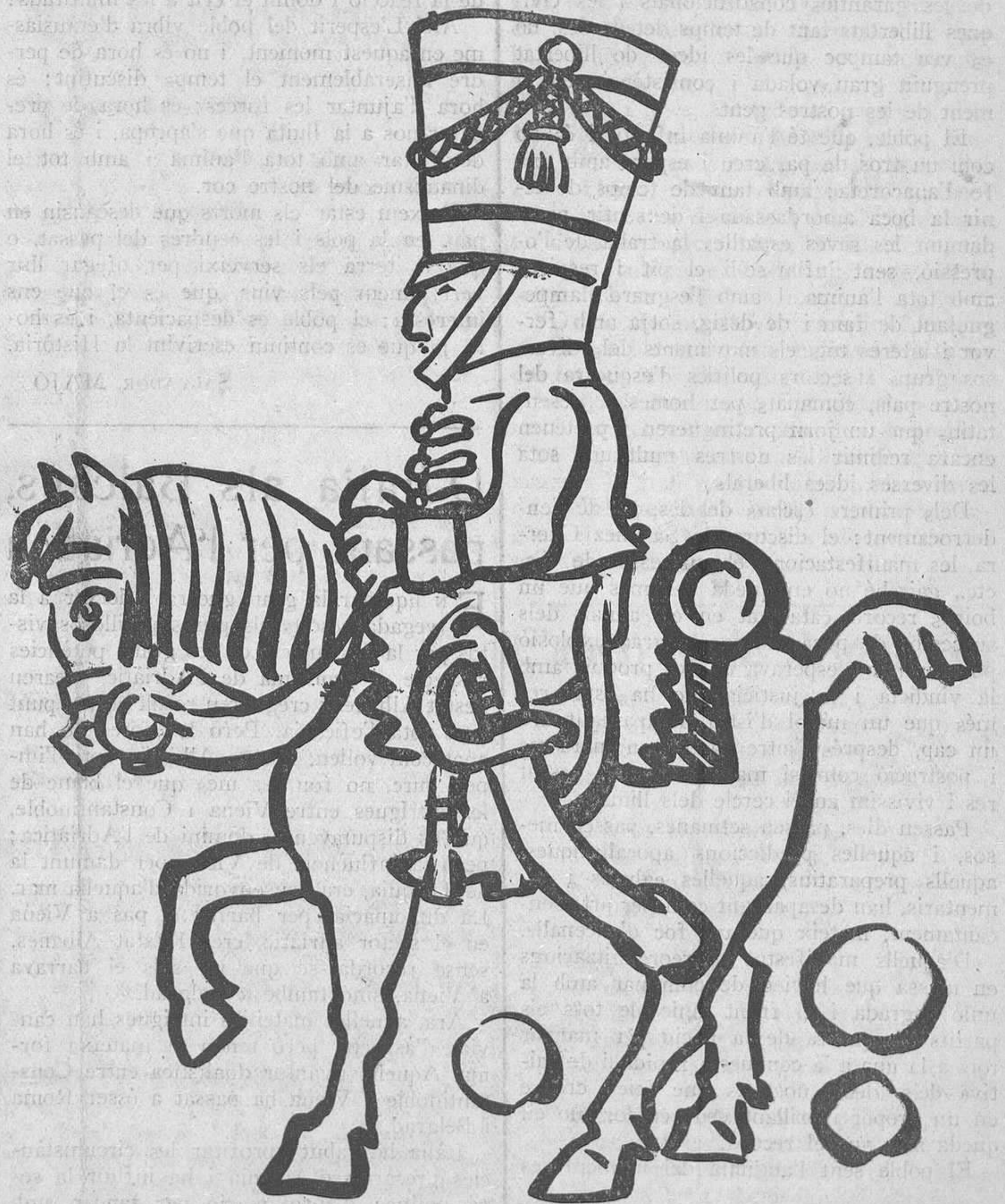
L'ombra de la dictadura