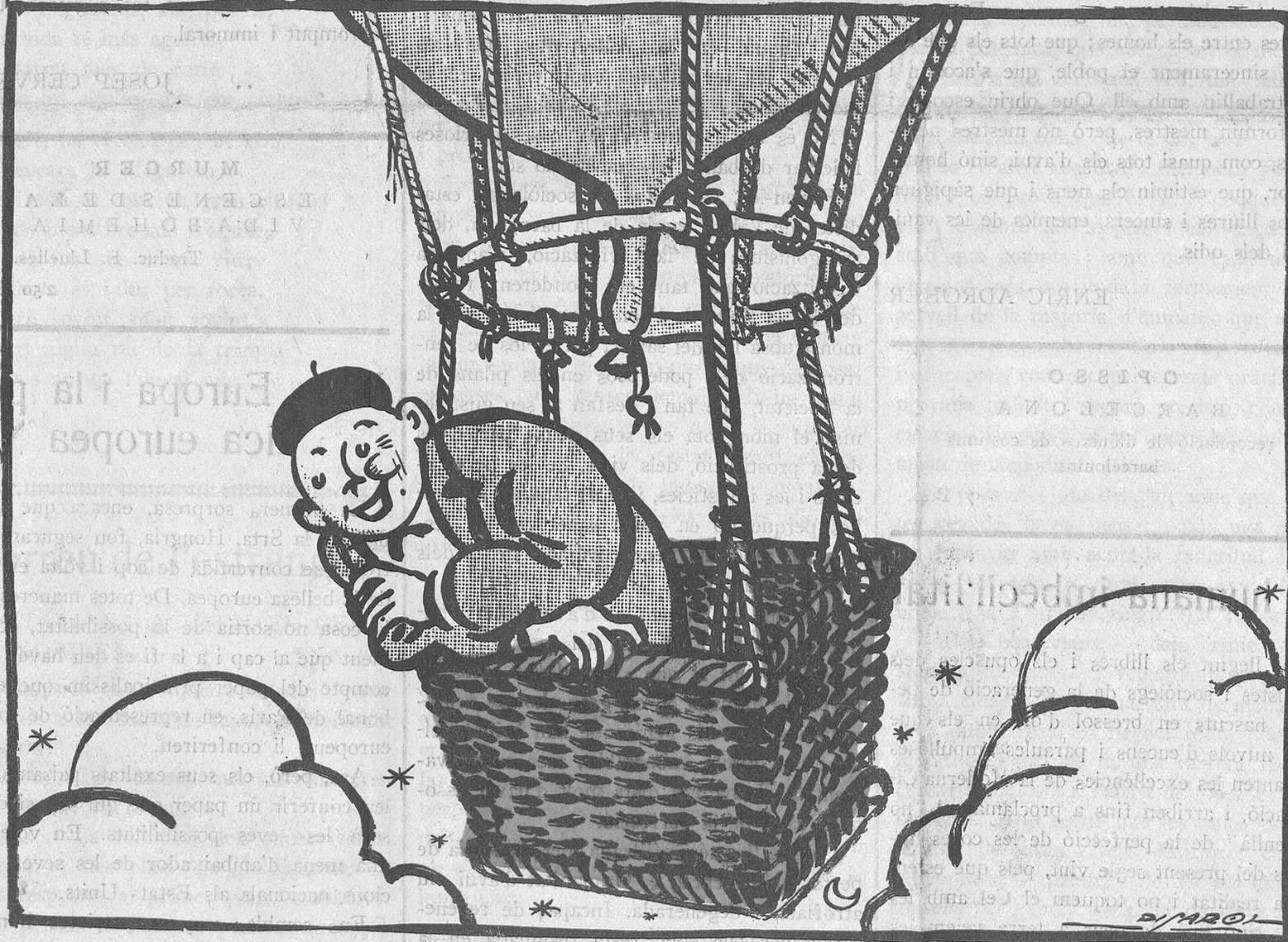
UN QUE FA EL VIU

EL PRESENT NÚMERO HA ESTAT VISAT PER LA CENSURA GOVERNATIVA