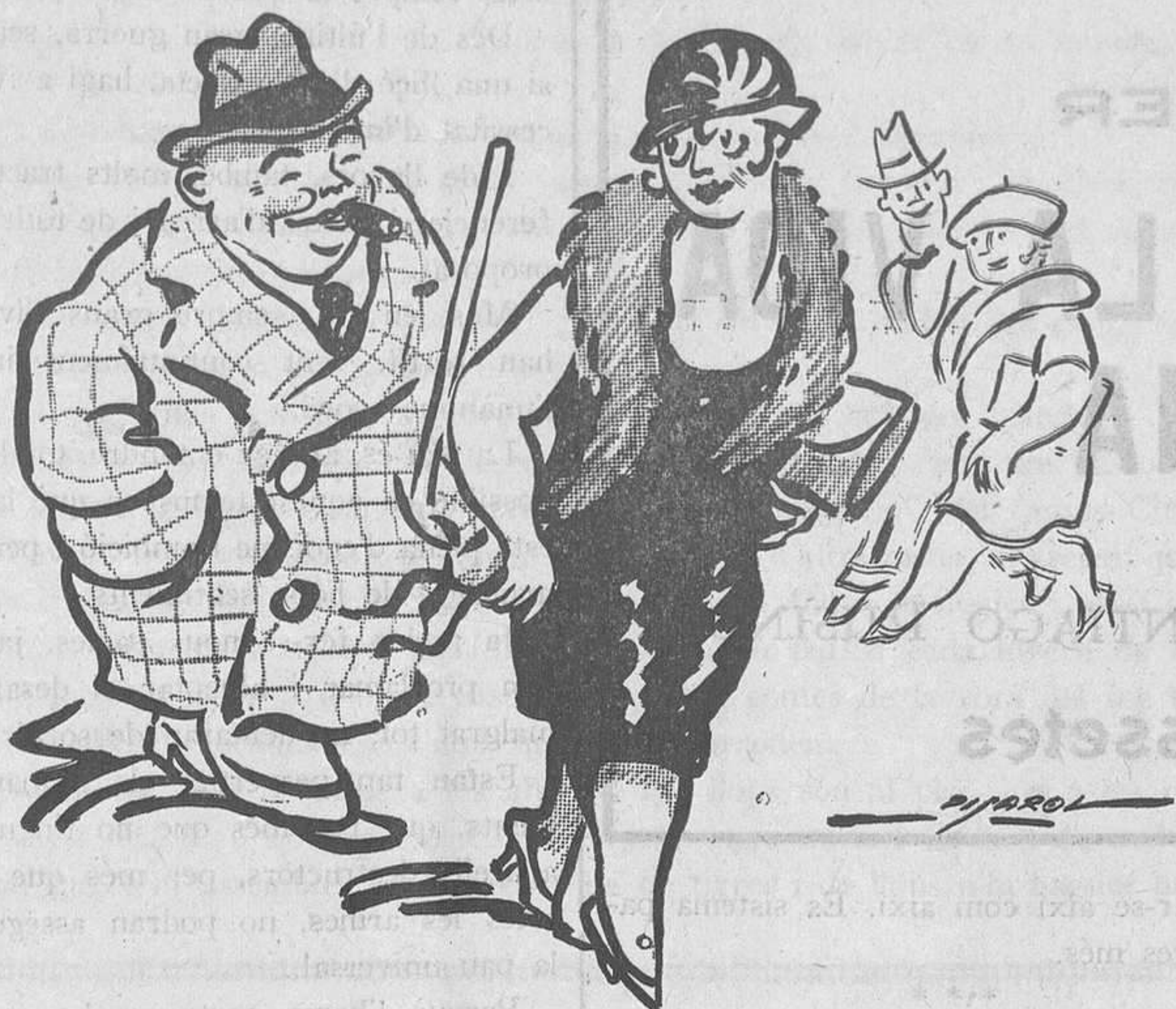
EL "CORRIDO" PRACTIC

—Vull aprofitar tot l'estranger abans que s'aprovin els nous aranzels.