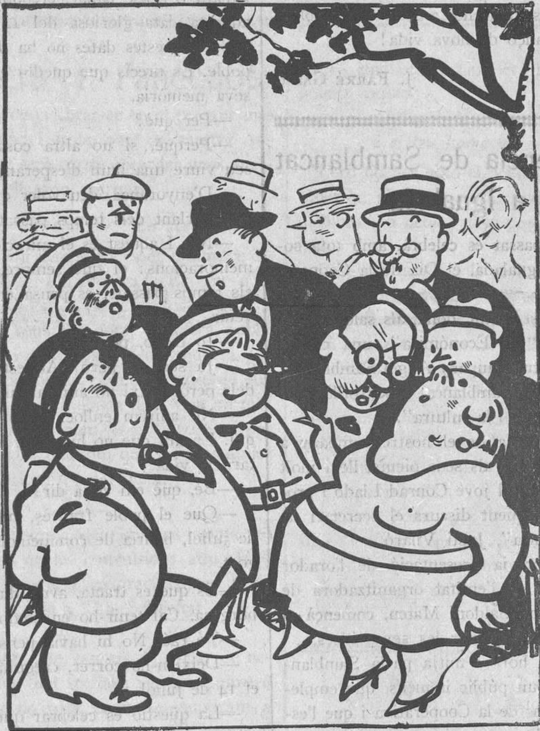
UNA "PINYAD D'ALTURA

—M'ofego, jove, m'ofego. —Per mi ja es pot ofegar.