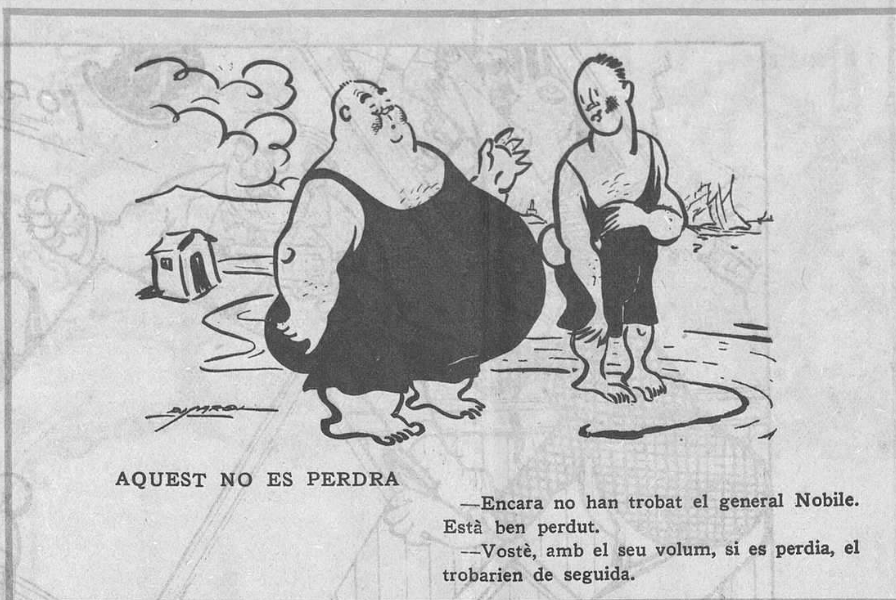
AQUEST NO ES PERDRA

Al abandonar Tortosa, donde el sufragio ha demostrado que no soy indeseable; al abandonar Tortosa, no pido rectificació de la orden: consigno mi protesta y espero, seguro y sereno, la hora de la justicia histórica que llegará para todos.—Marcellino Domingo. — Tortosa, 6 junio 1928."