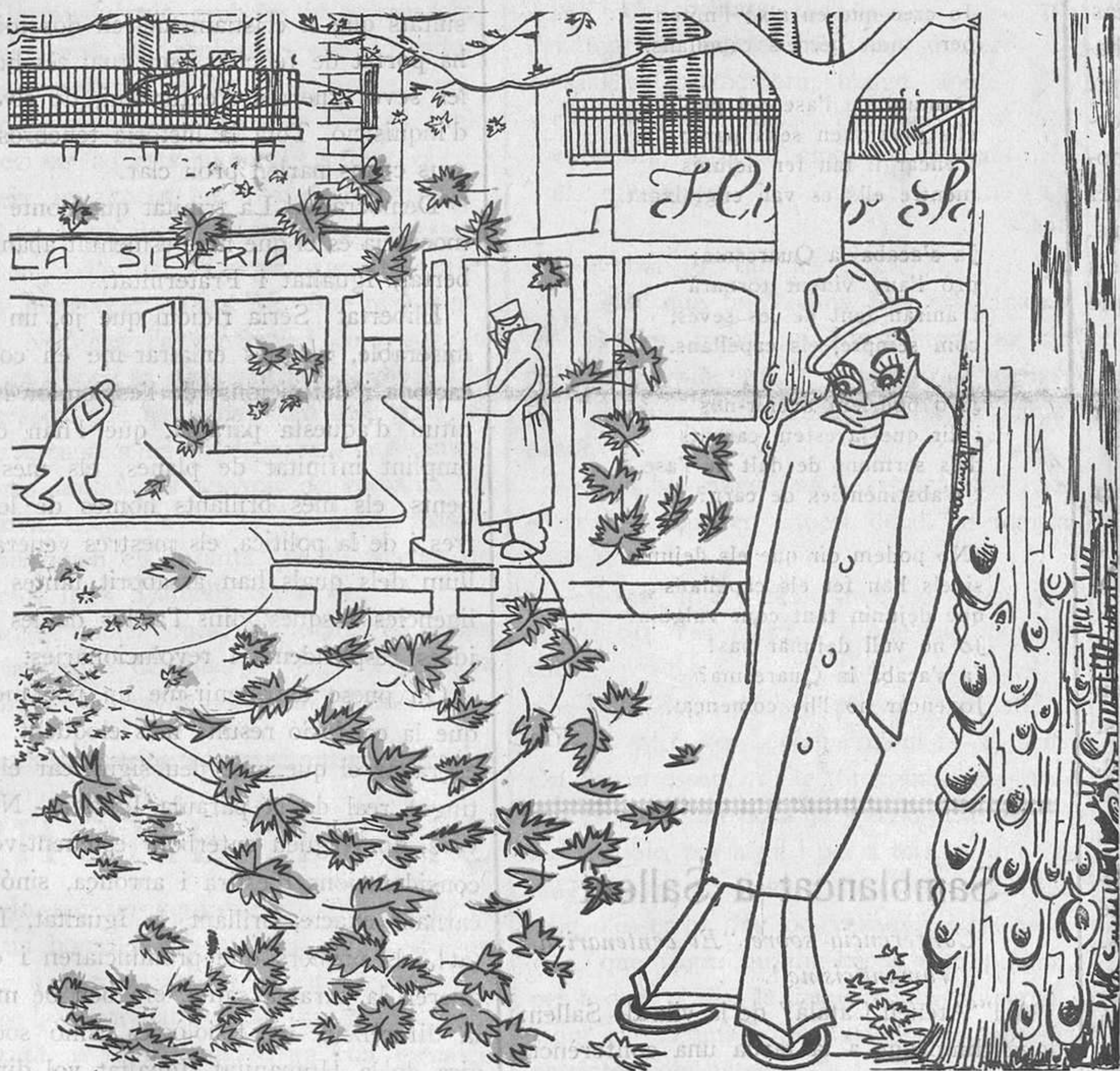
LA PREGUNTA QUE ENS FEM TOTS

PREUS DE SUBSCRIPCIÓ Fora de Barcelona cada trimestre. ESPANYA, pessetes 1'50. — ESTRANGER, 2'50