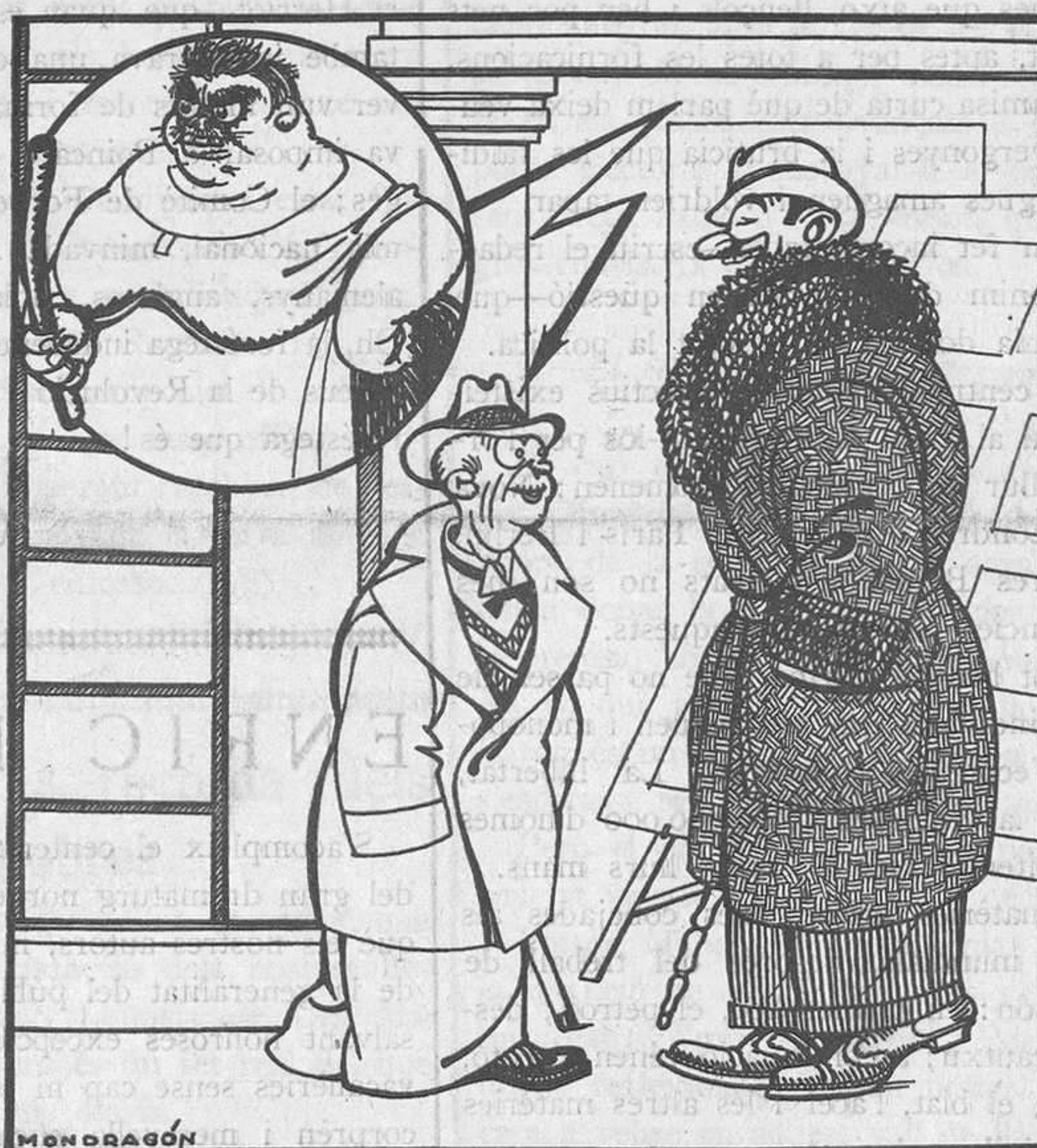
LA QUESTIO DEL DESARMAMENT

—Fa estona que estem discutint del desarmament. Diga'm l'hora que és, que si arribo tard a casa la dona em pegarà.