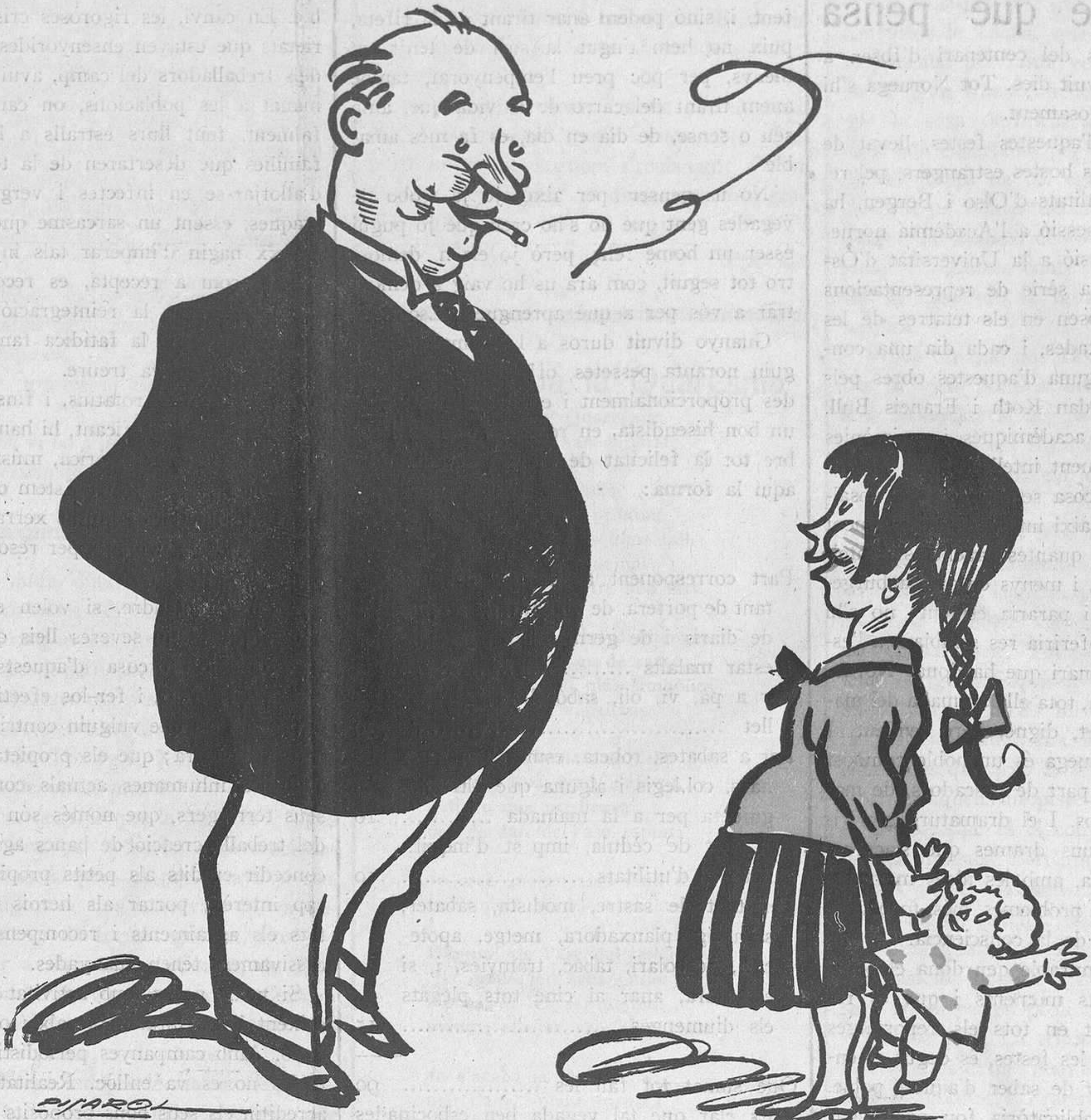
LES CRIATURES TERRIBLES

Es precis que també siguem exercitants. Es precis que ens dediquem a l'exercici d'escombrar, que tenim la casa molt bruta!