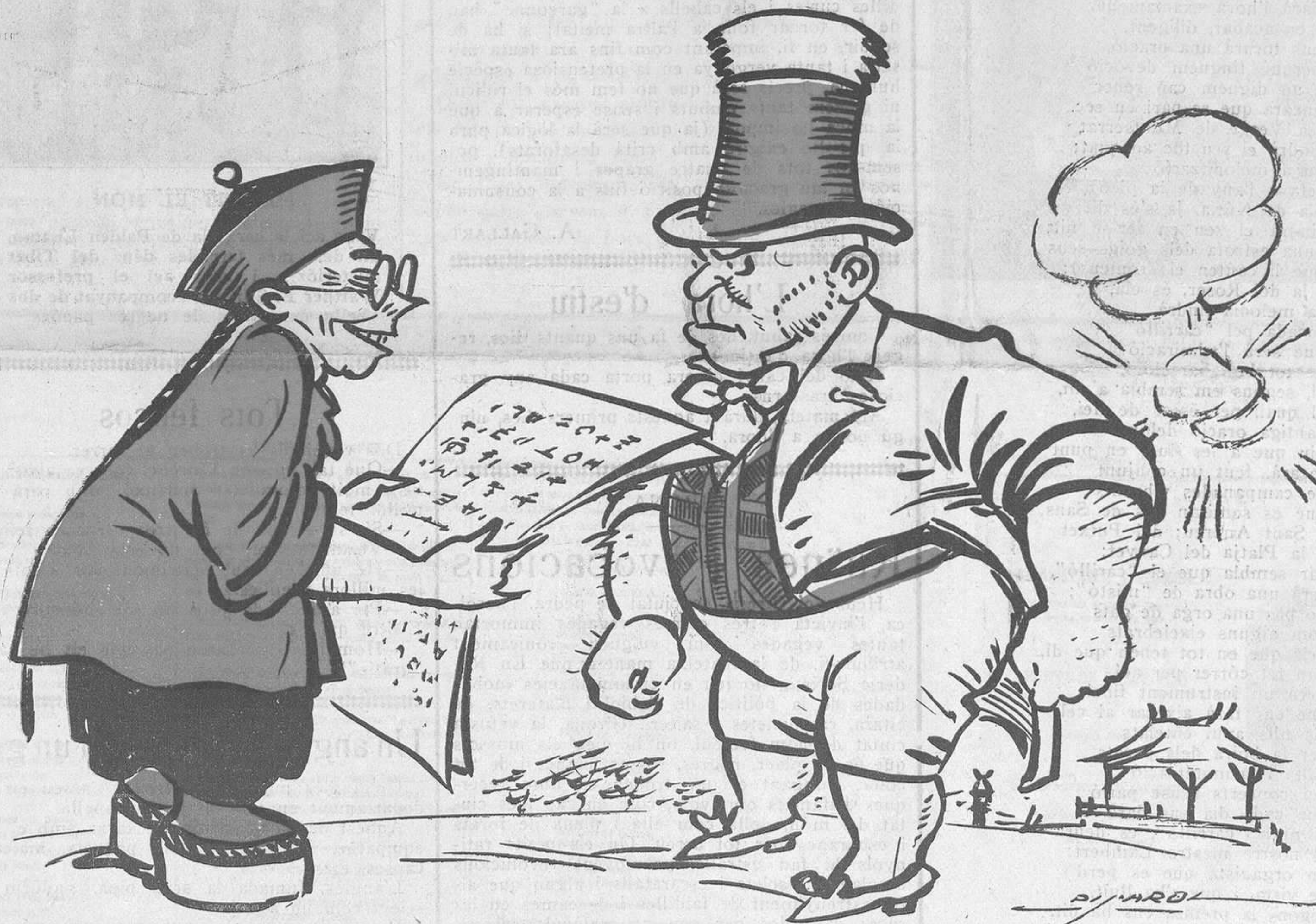
ENTRE GROCS I BLANCS

PREUS DE SUBSCRIPCIÓ Fora de Barcelona cada trimestre: ESPANYA, pessetes 1'50. — ESTRANGER, 2'50