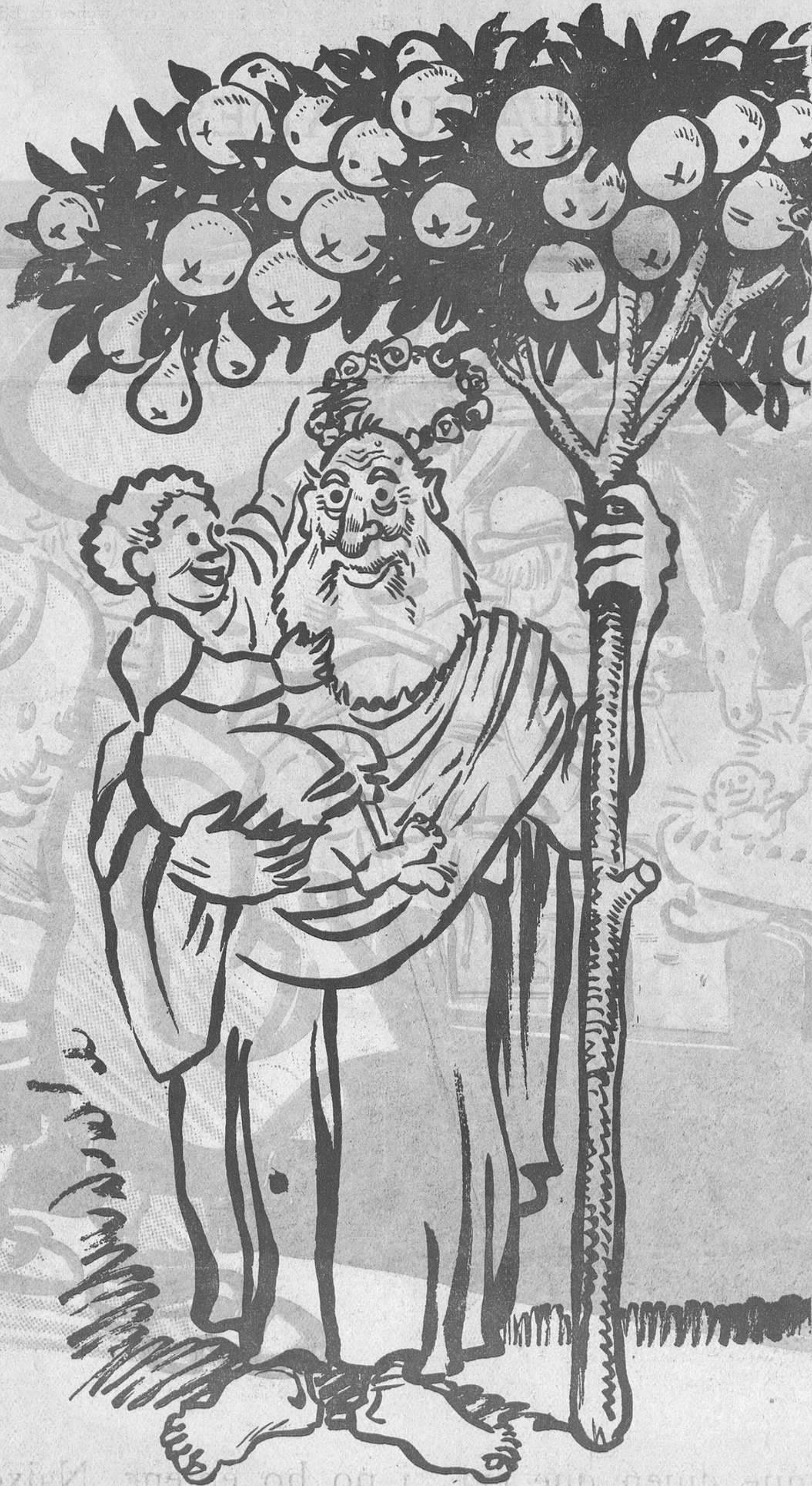
L'ARBRE DE NOEL

—No les toquis, petit, que encare son verdes.