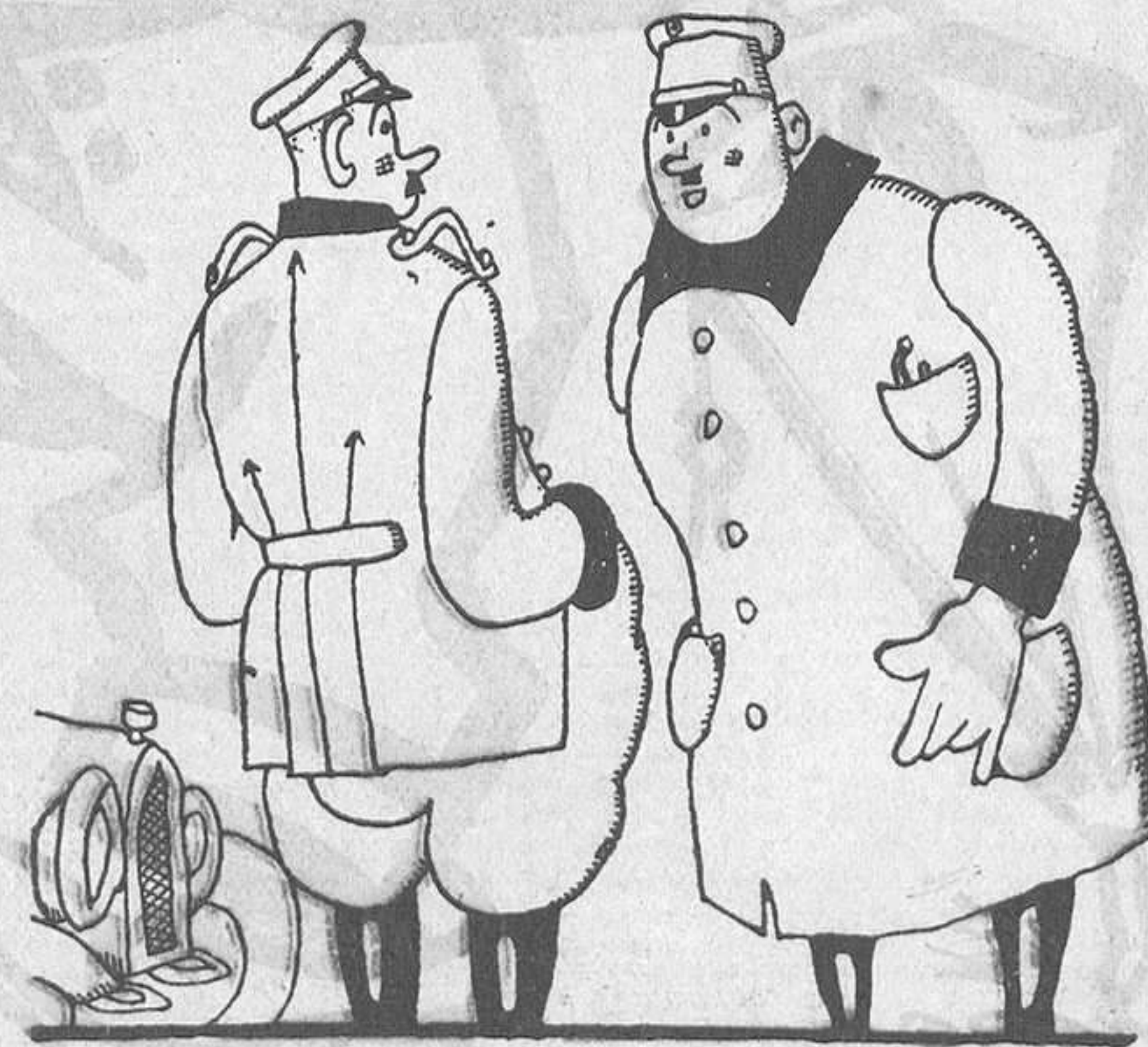
LA PORTA DEL "LICEO"

L'escombriaire.—I pensar que sense mi els teus senyors no podrien menjar.