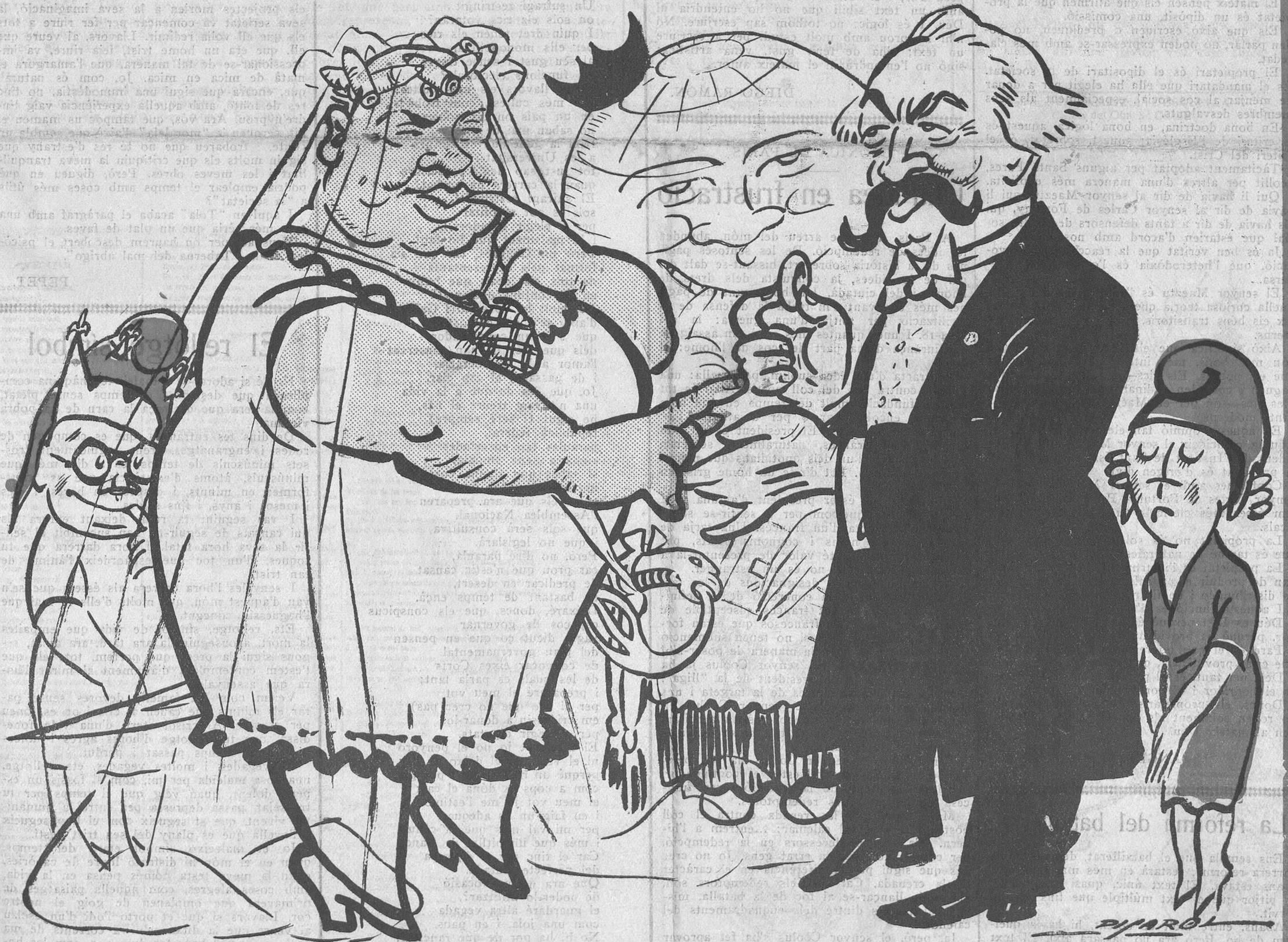
La tendra aliança de Briand i Stresseman