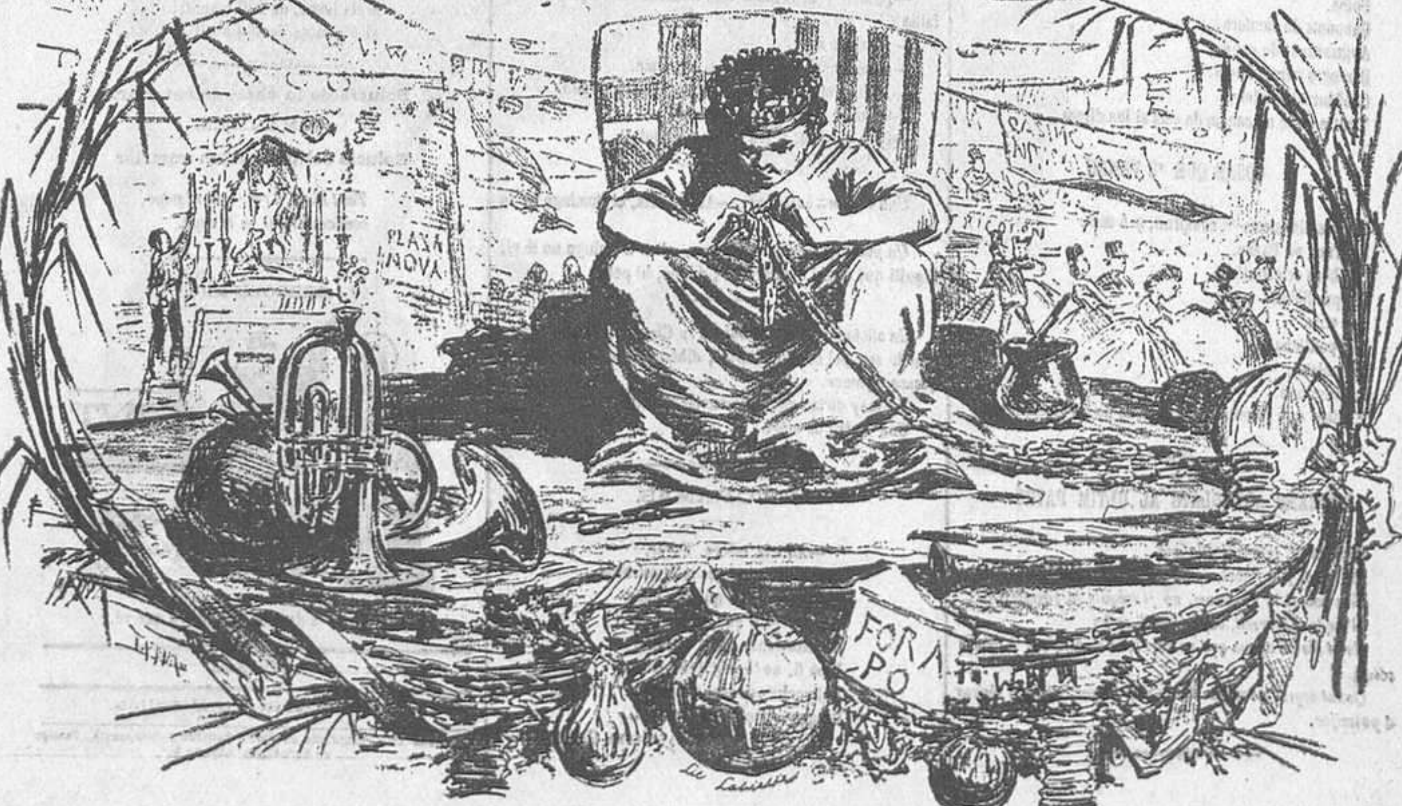
i Ay Ciutat condal, qui t'ha vist y te veu!