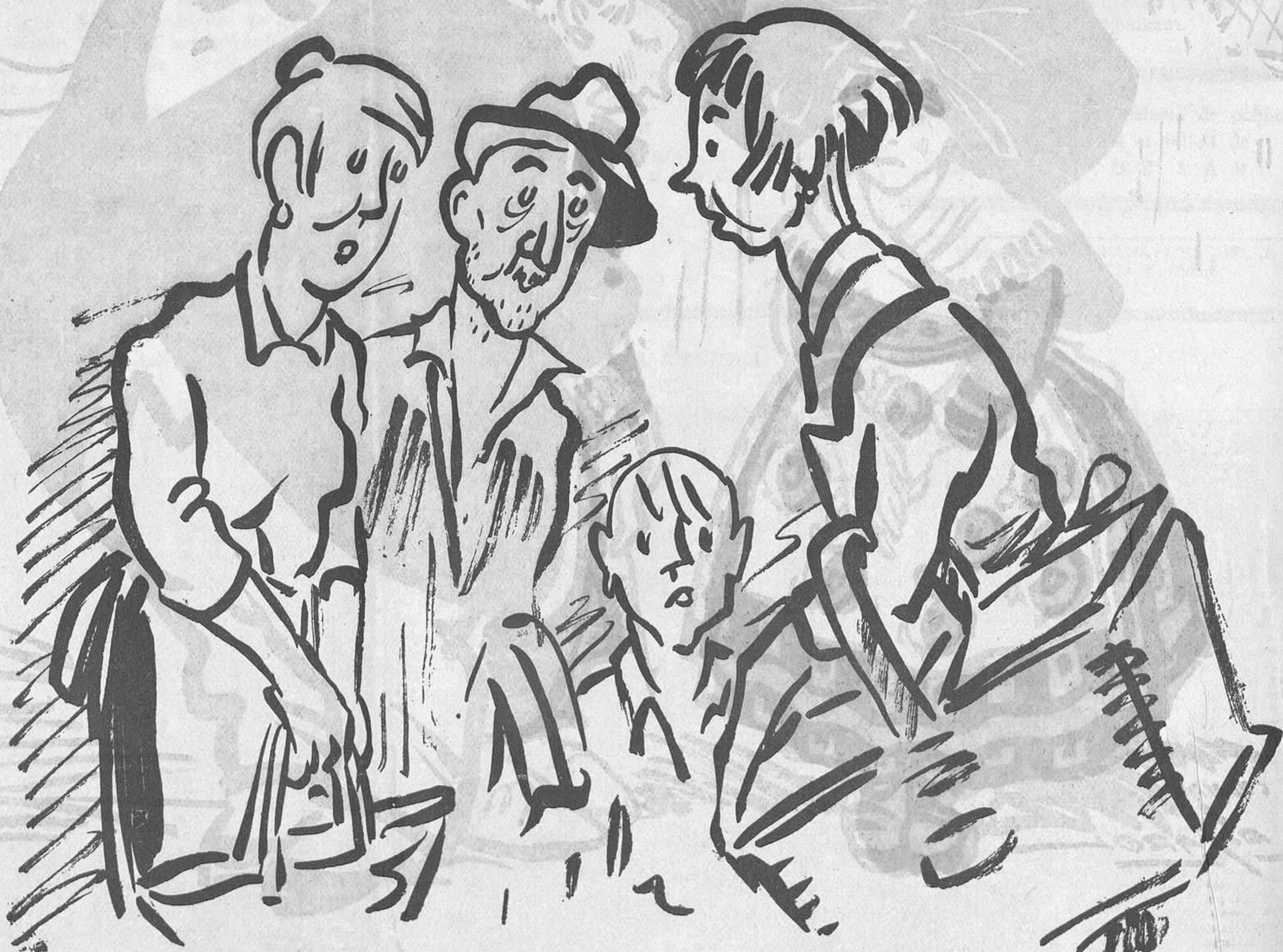
CASES BONES I DOLENTES

—Es una mala casa. Els senyorets sols em donen dos duros per anar a la compra. —Pitjor és la nostra, de casa; on no ens dona ningú ni dos cèntims!