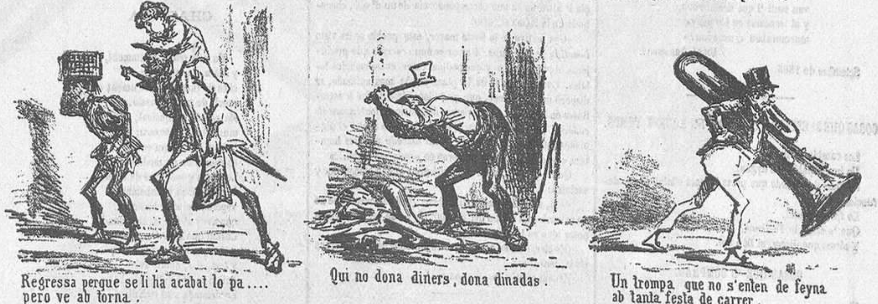
Regressa perquè se li ha acabat lo pa... pero ve ab torna.