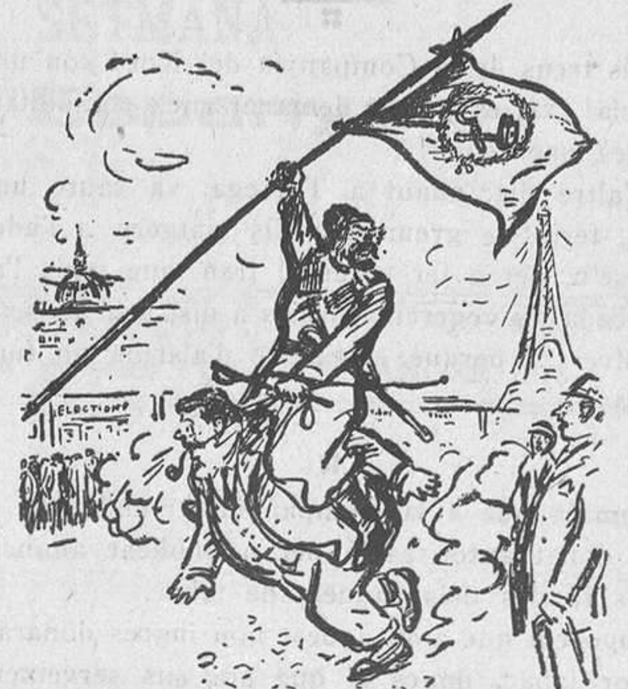
L'arribada del vencedor.