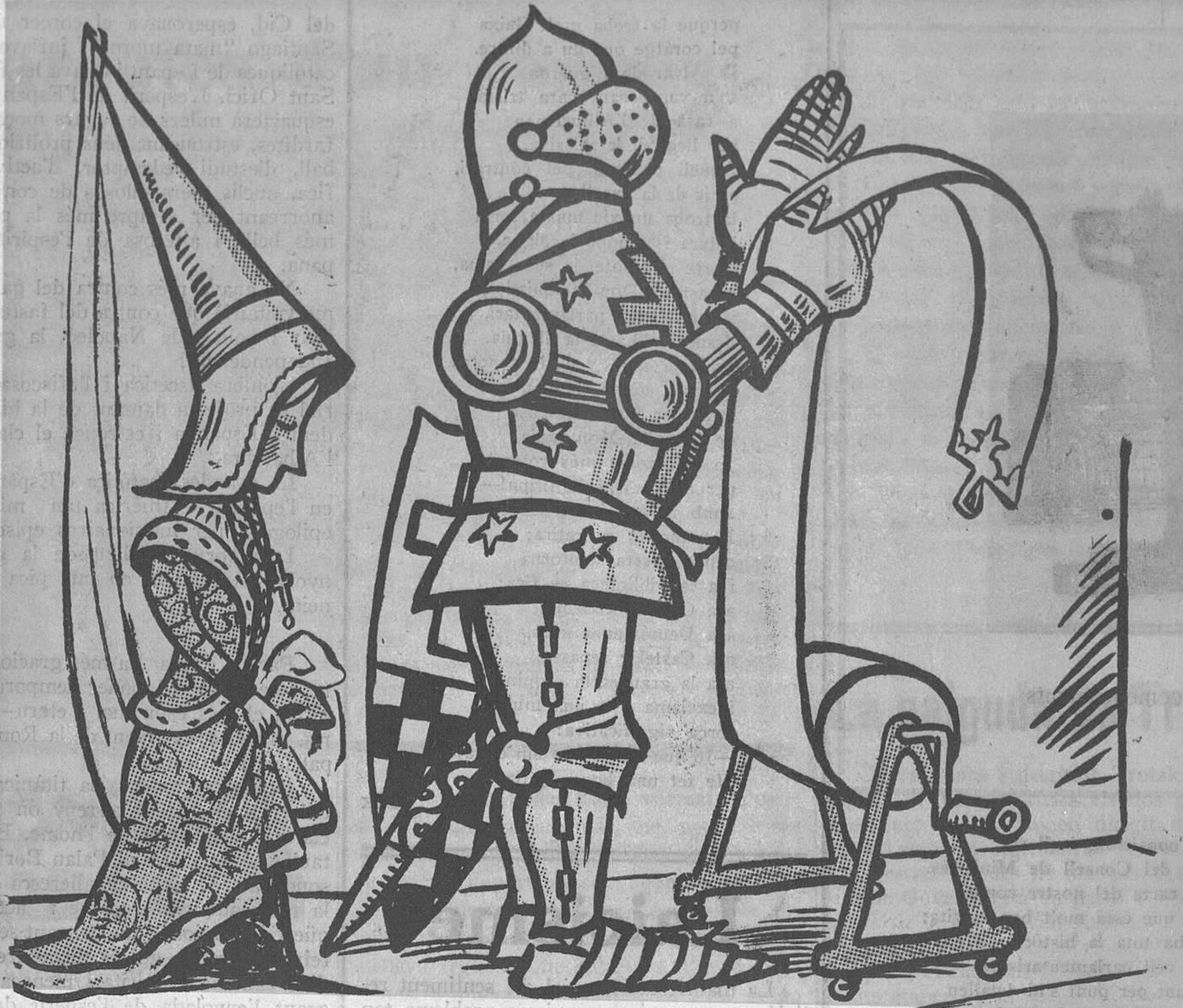
RECORD DE L'EDAT MITJA

aeris ja no estan sotsmeses a la nostra voluntat, sinó a la voluntat de les estrelles i les estrelles potser sí que mengem, però el que és nosaltres!