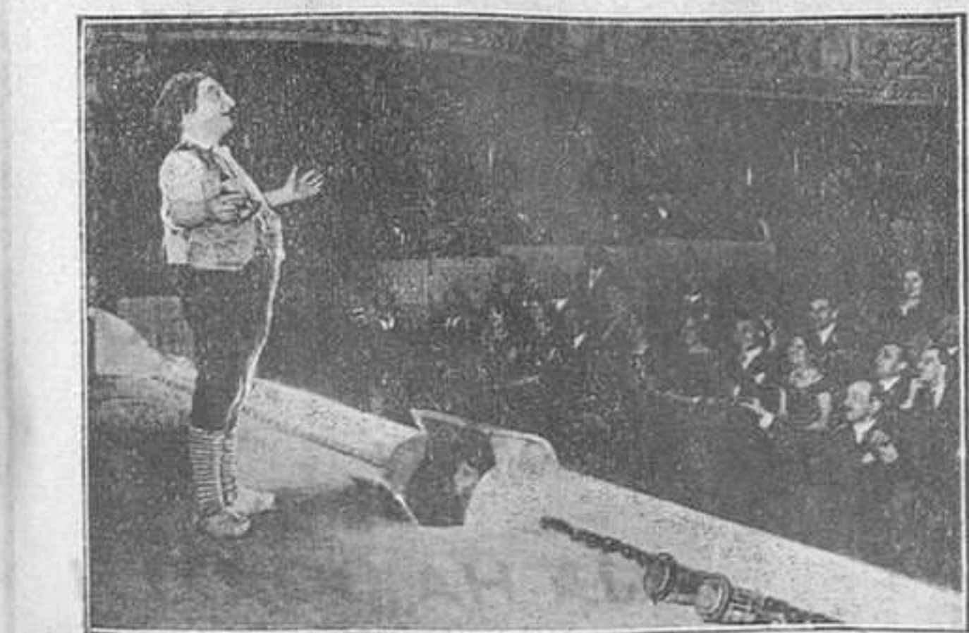
Cantant al «Trianon Lyrique»

grafia de "The Sphere", en la que apareixen tres noies contemplant, des de Londres, l'eclipsi de sol. Però és que a Londres el sol es pot eclipsar?