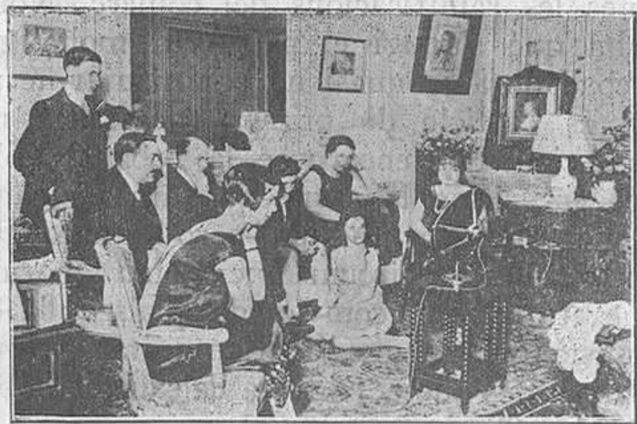
Escollant la raditelefonia

Així, la gent més humil des de casa sent música, per un preu baratíssim. Però d'això no