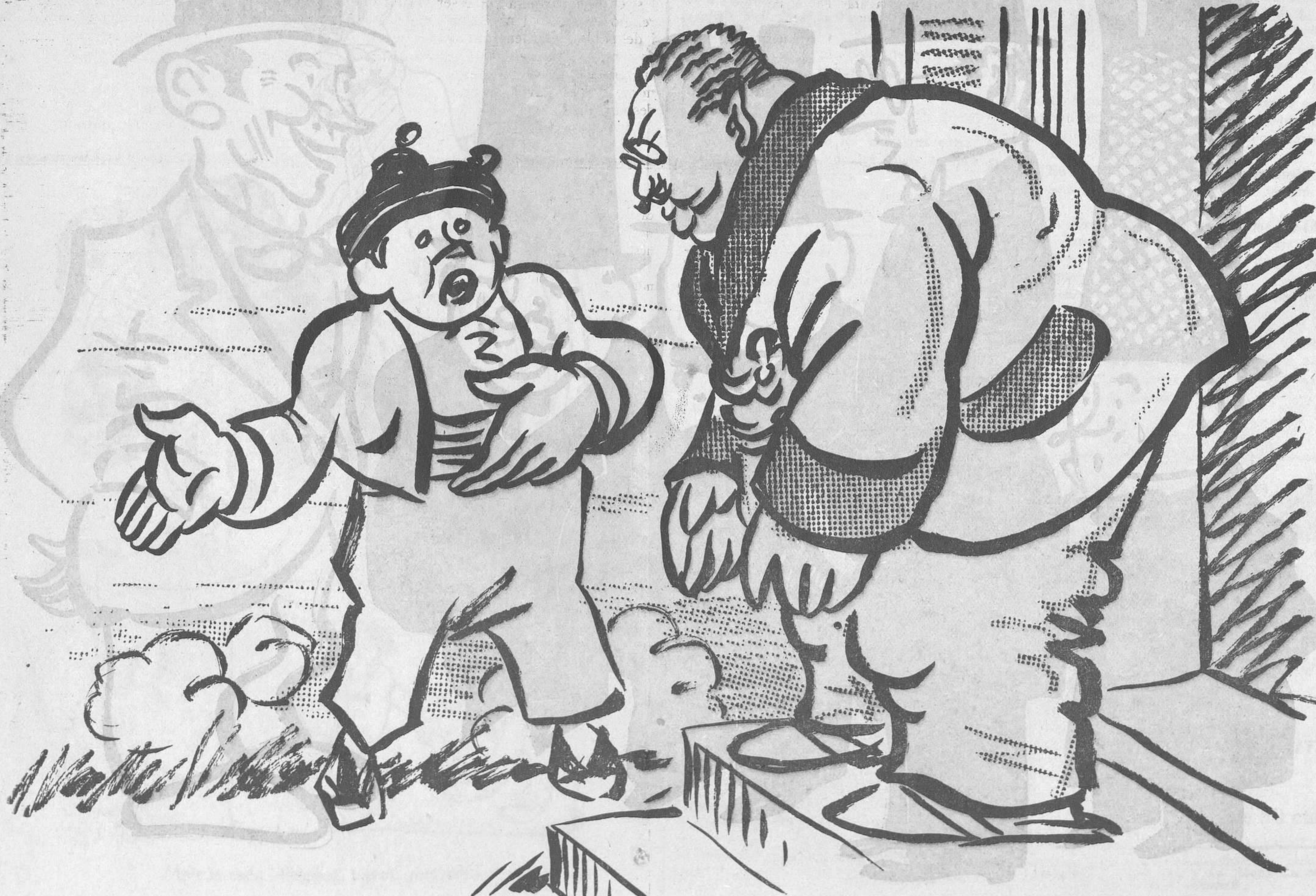
El poble. —Jo encara sóc lerrouxista. Lerroux. —Jo, no!