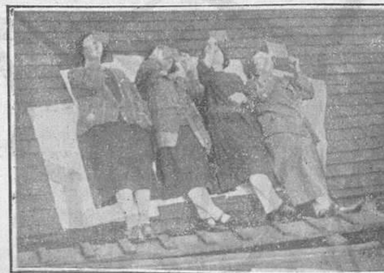
Contemplant l'eclipsi de sol a Londres

Ve't aquí perquè ens fa gràcia aquesta foto-