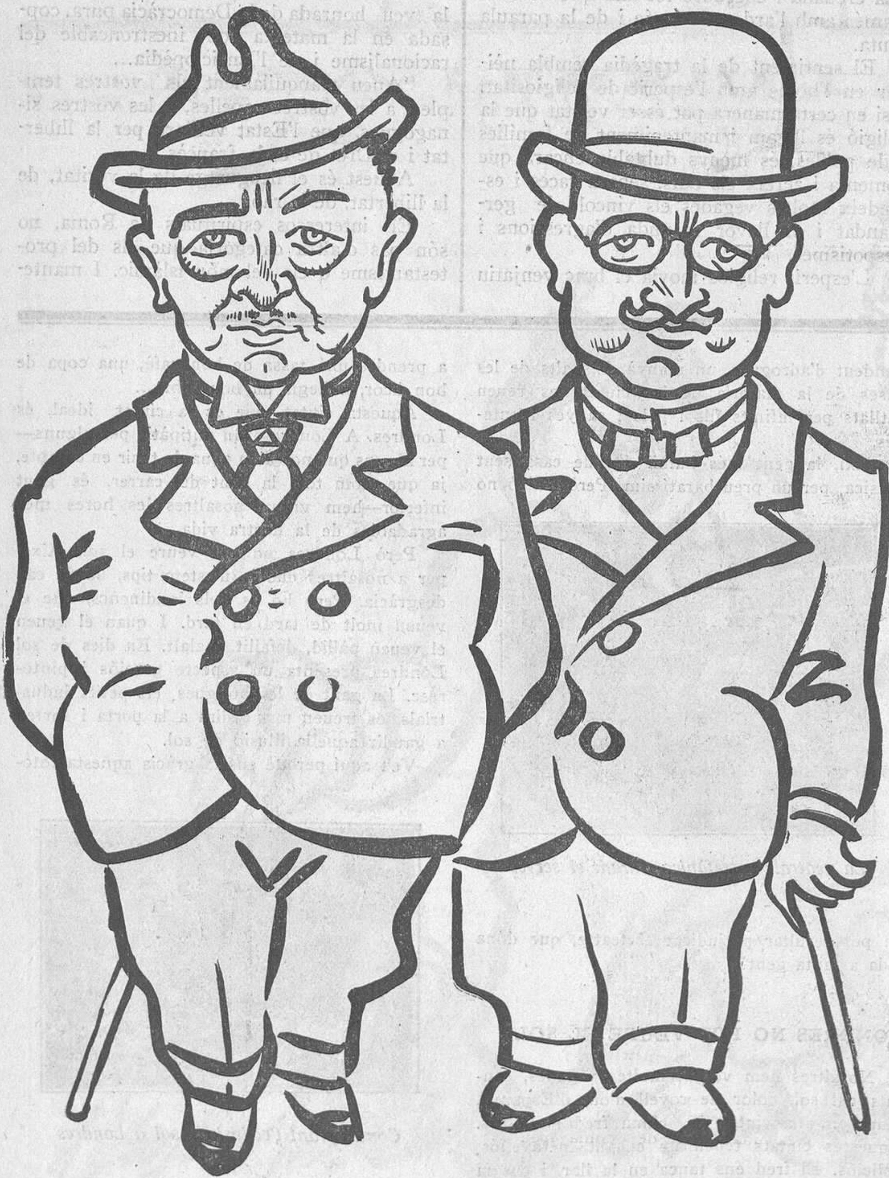
DOS QUE TORNEN

Les substències estan tan amunt que ja no és recorden de la terra. Voltant pels espais