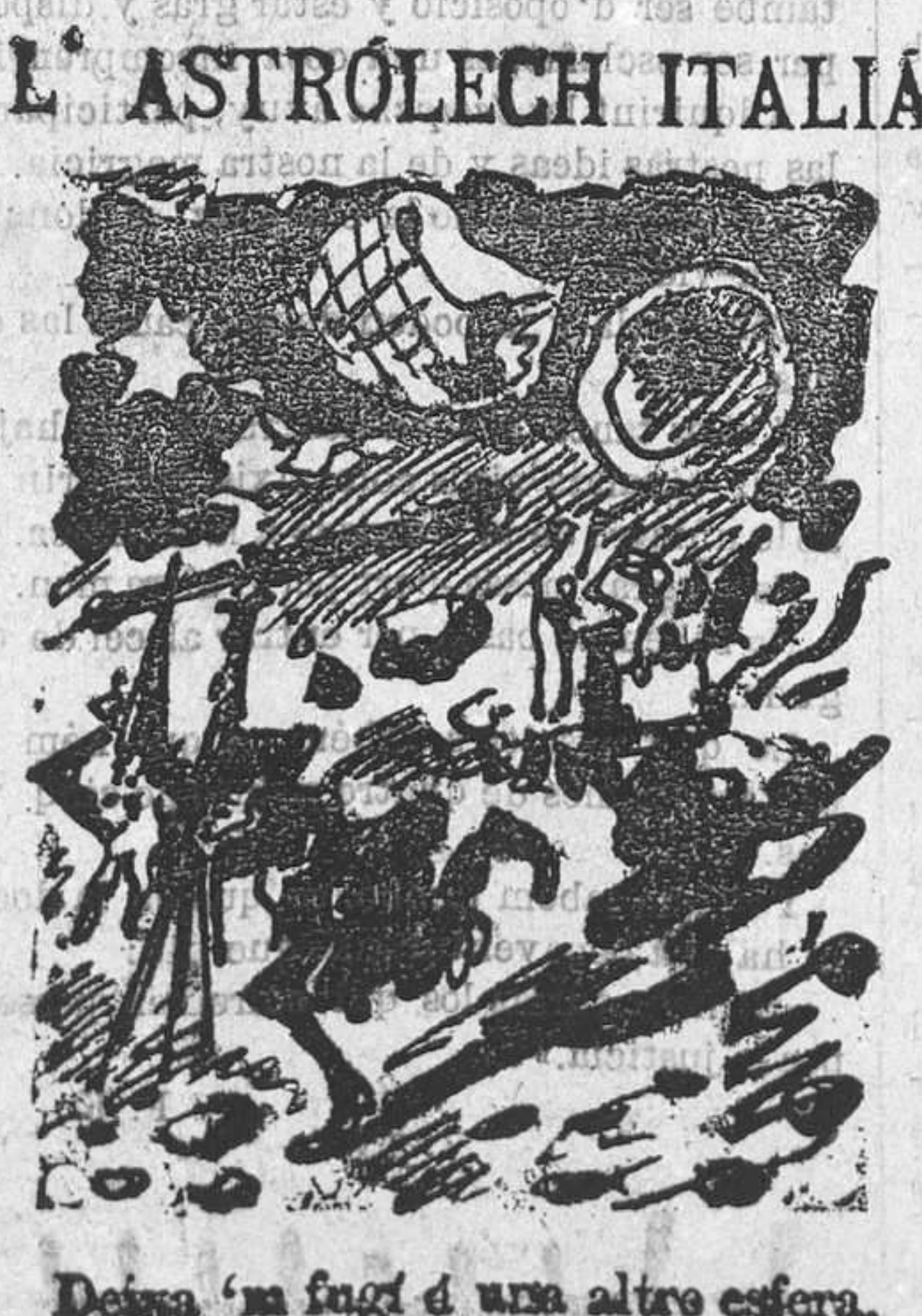
L' ASTROLECH ITALIA. Deina 'm fagi d' una altre esfera, que aquí 'm romporán l' ullera.