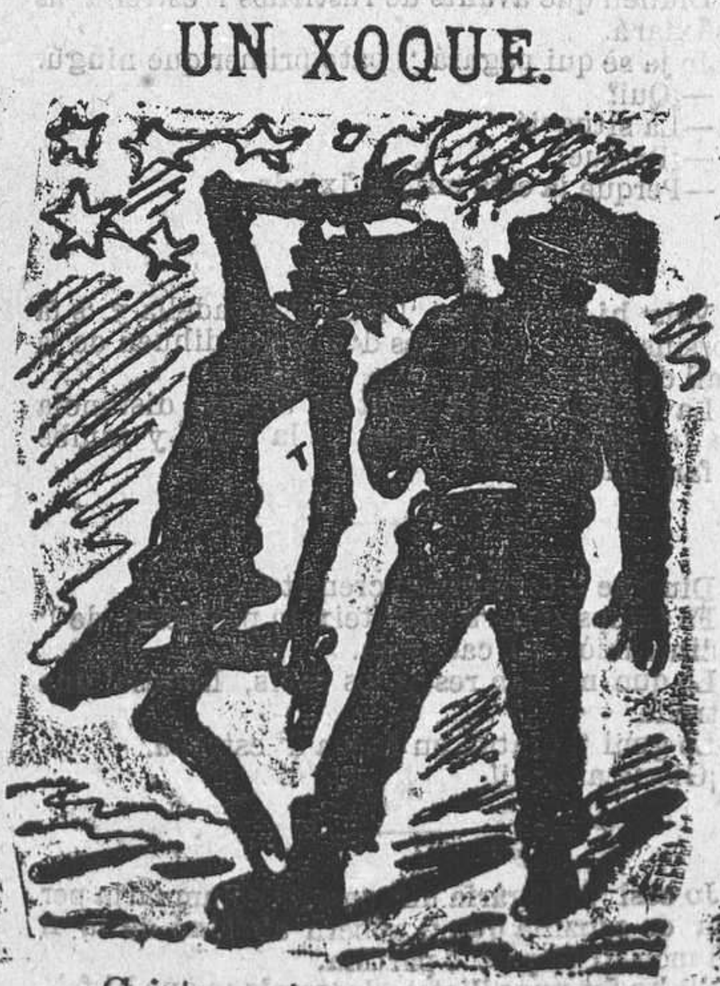
UN XOQUE. Cristo quina trofijada! M' ha fet vore las estrellas!