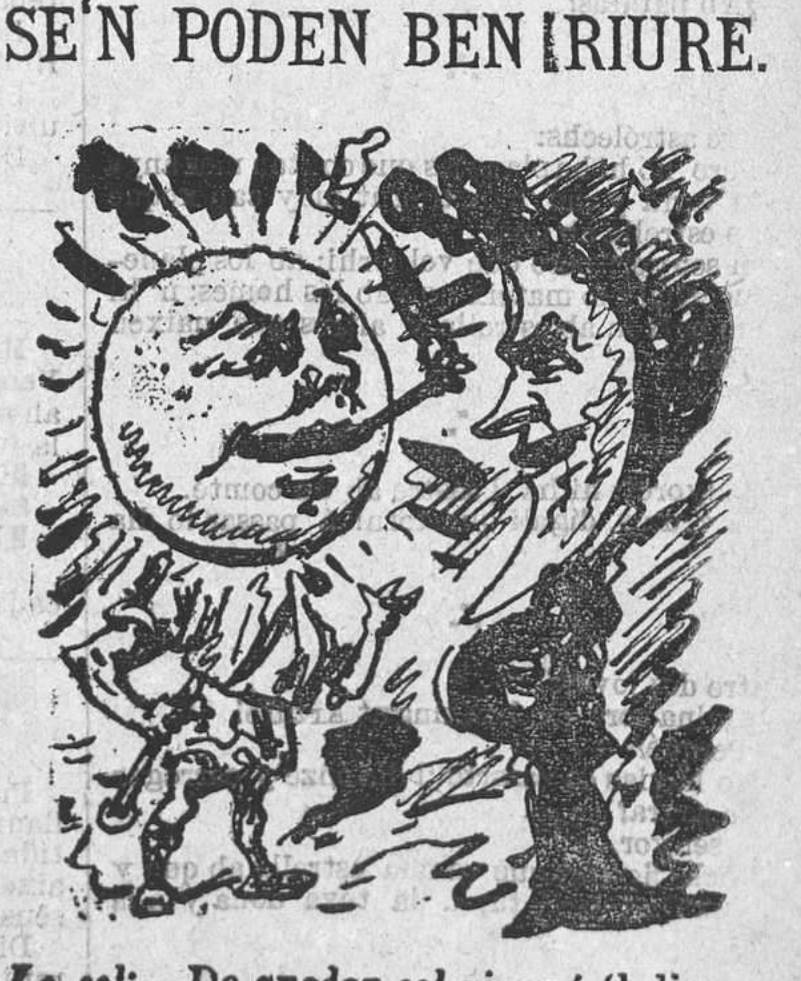
SE'N PODEN BEN IRIURE. Lo sol:—De quedar sol vingué 'l dia. La luna:—S' vols, jo 't faig companyia.