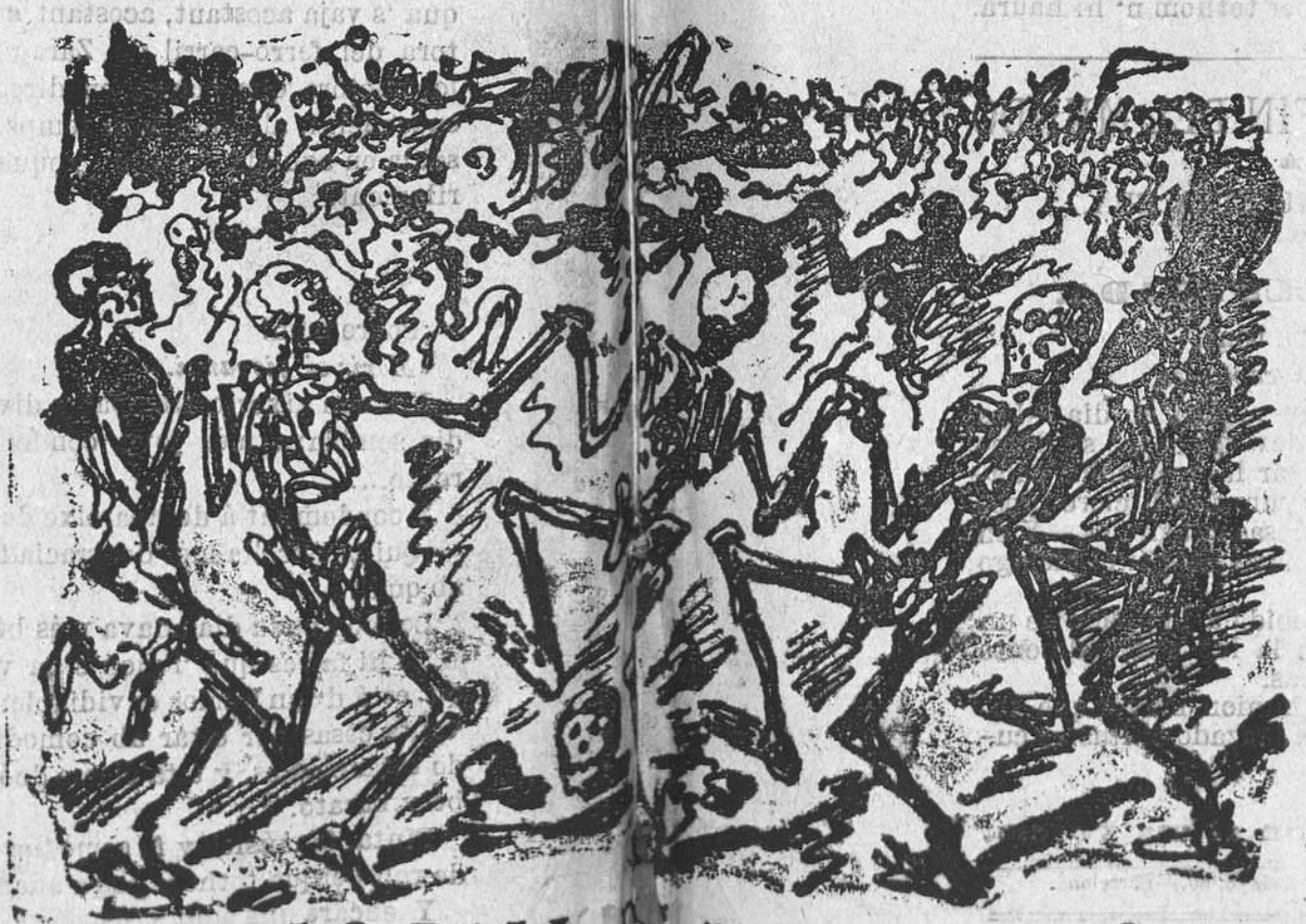
LO BALL DE JOSAFAT.