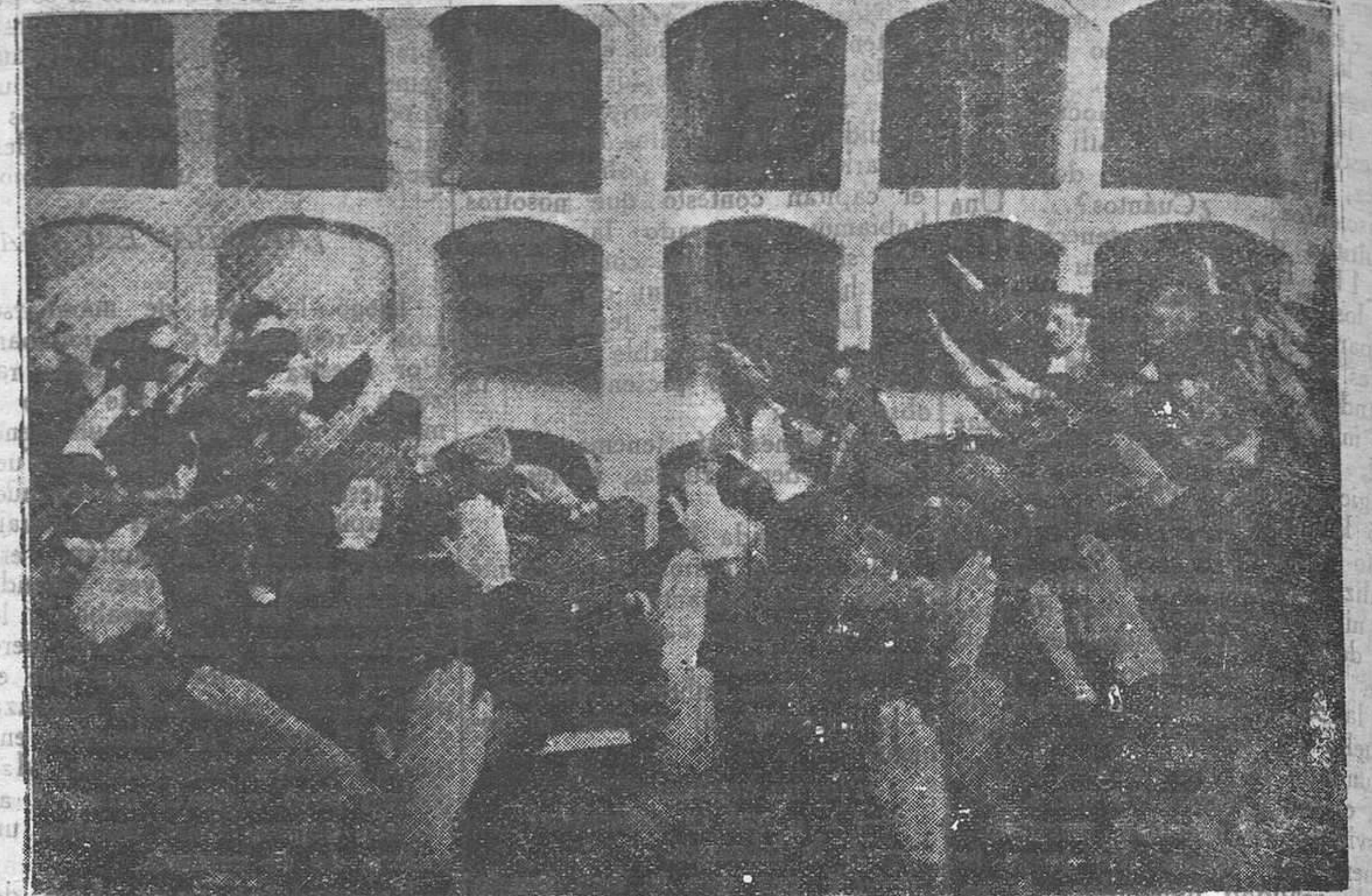
Momento de dar sepultura a los restos del General Mola

La ansiedad con que devoraron nuestro menú fué extremada y nos demostró el hambre que pasan—no oculto por ellos—. Contemplo en un sargento de ellos su uniforme desastroso, y el que a pesar de su graduación llevo una estrella en el gorro, y una cultura poco