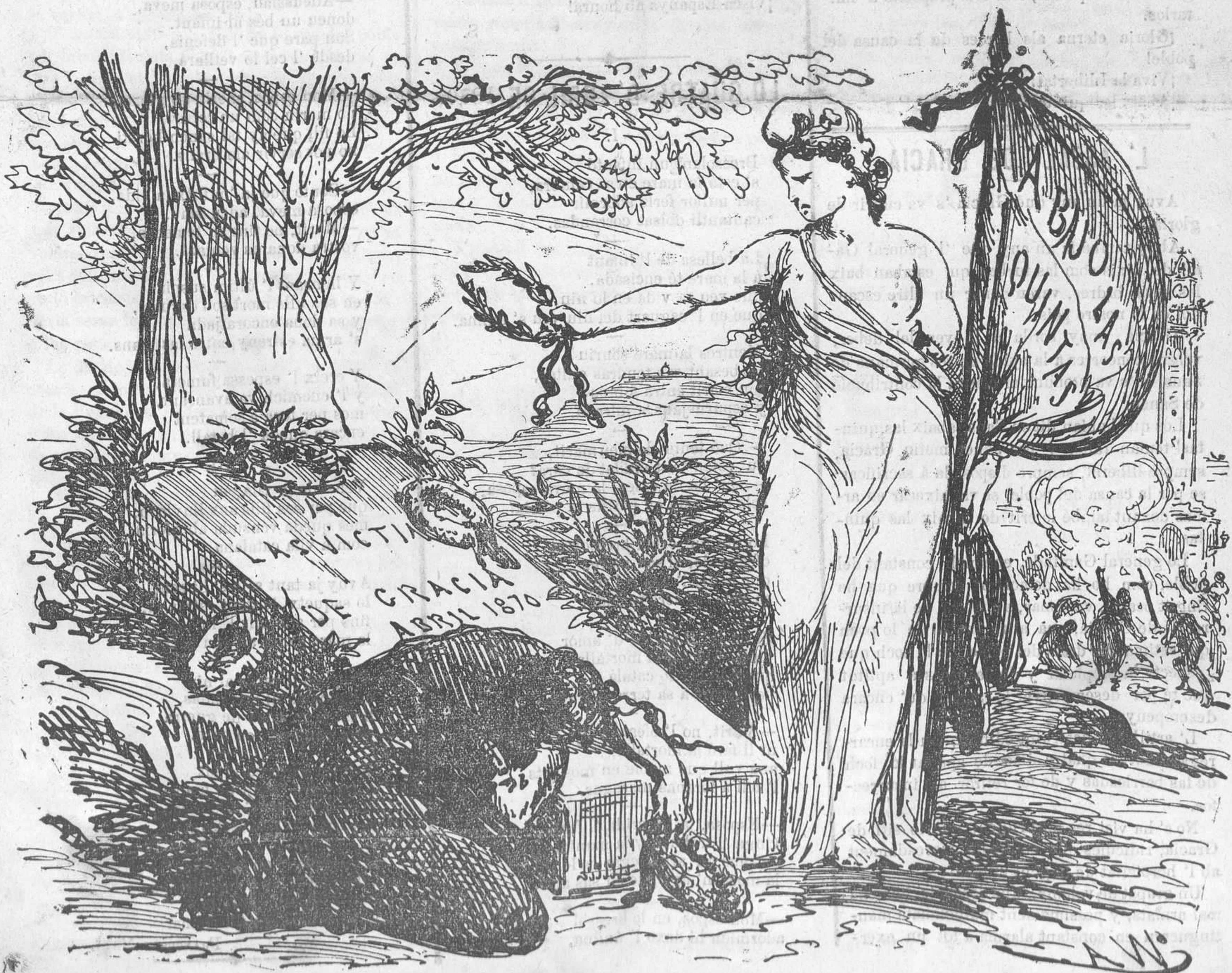
ANIVERSARI DEL SITI DE GRACIA.