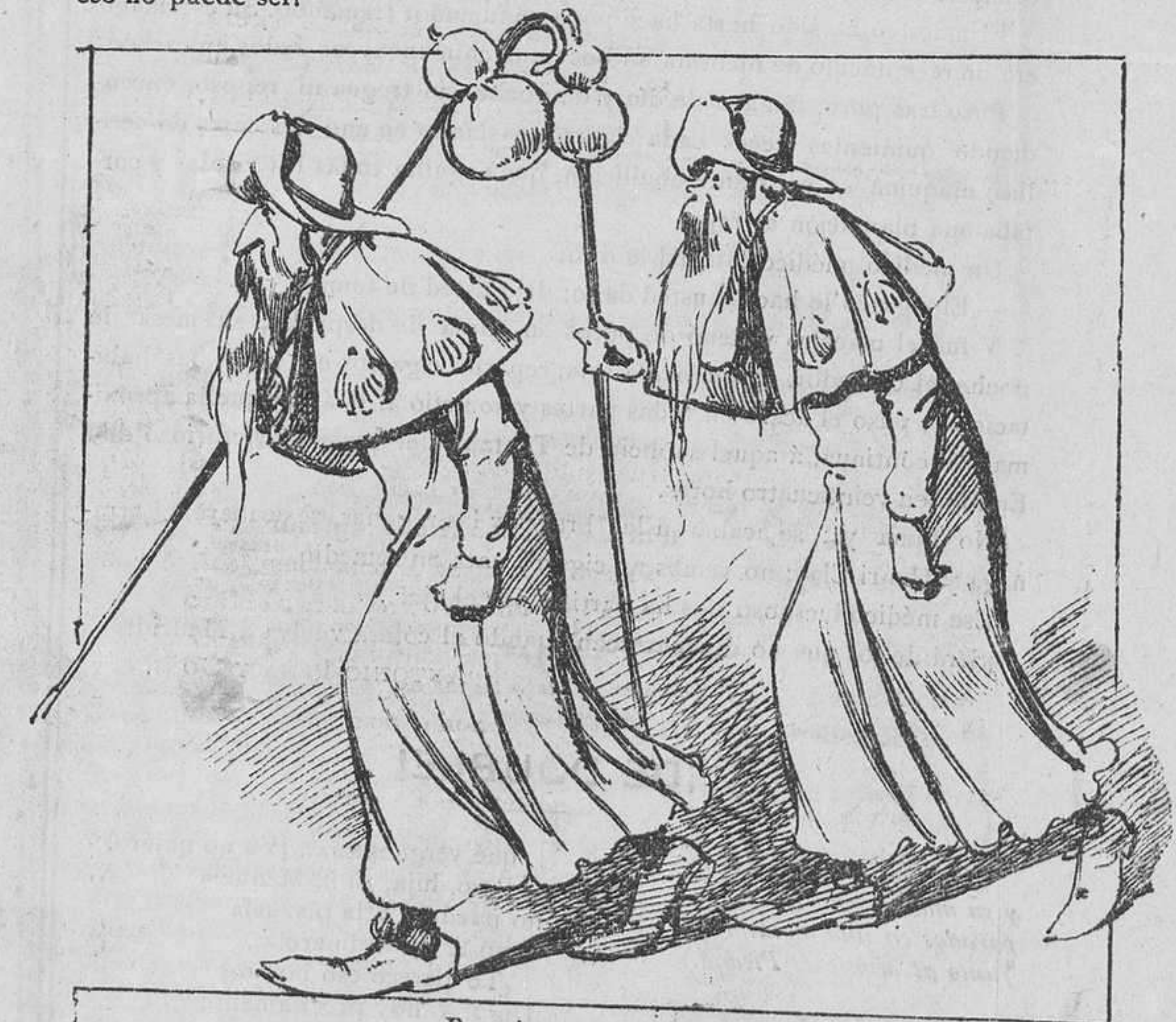
Por cierto voto han salido del pueblo, y se van á orar á Roma. ¡Y el voto ha sido de vivir sin trabajar!