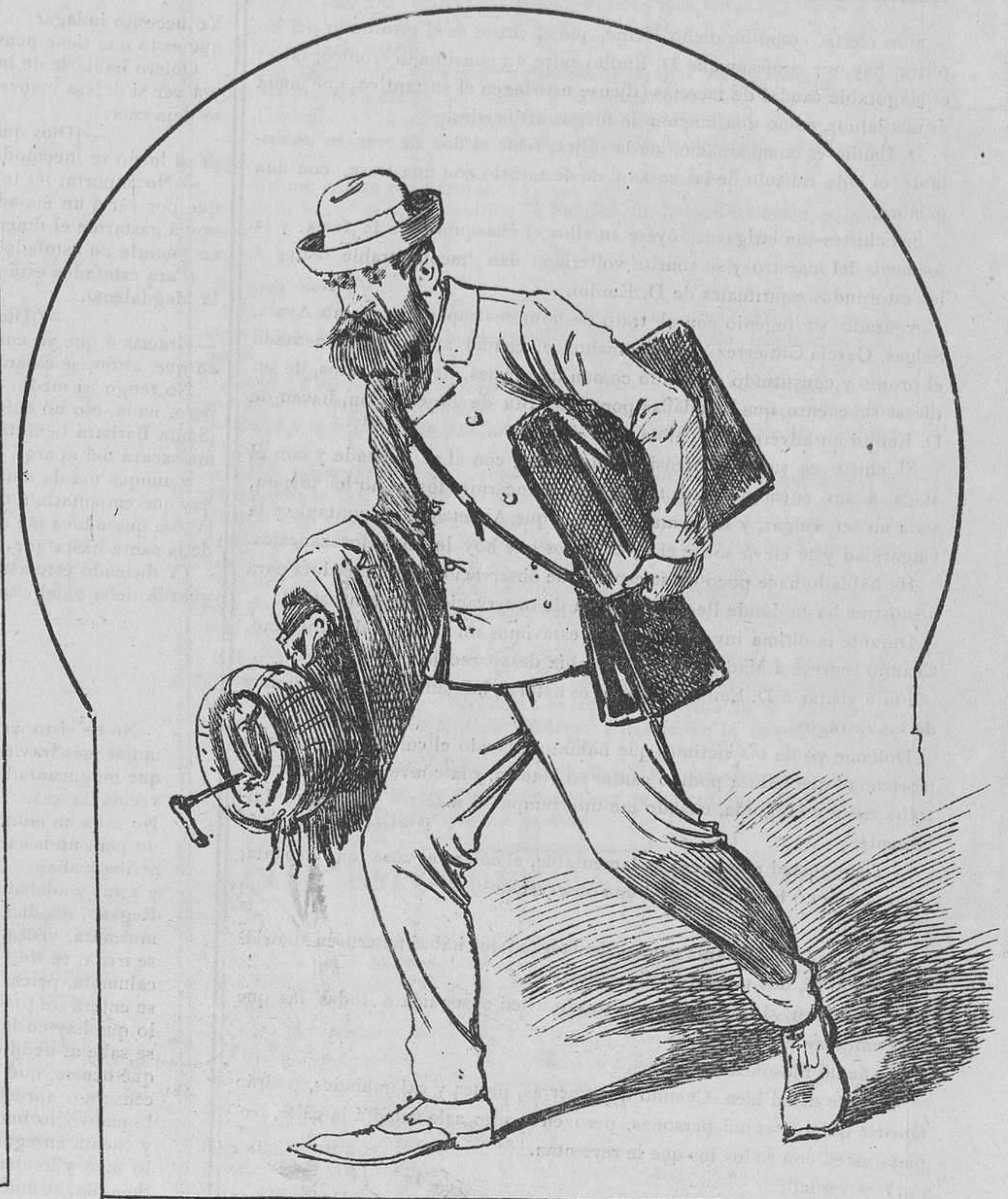
Comisionista de una fábrica francesa de plumas de acero. Viene expresamente á nombrar un representante en Navalperal, porque se susurra que allí se surten de plumas alemanas.... ¡Y eso no puede ser!