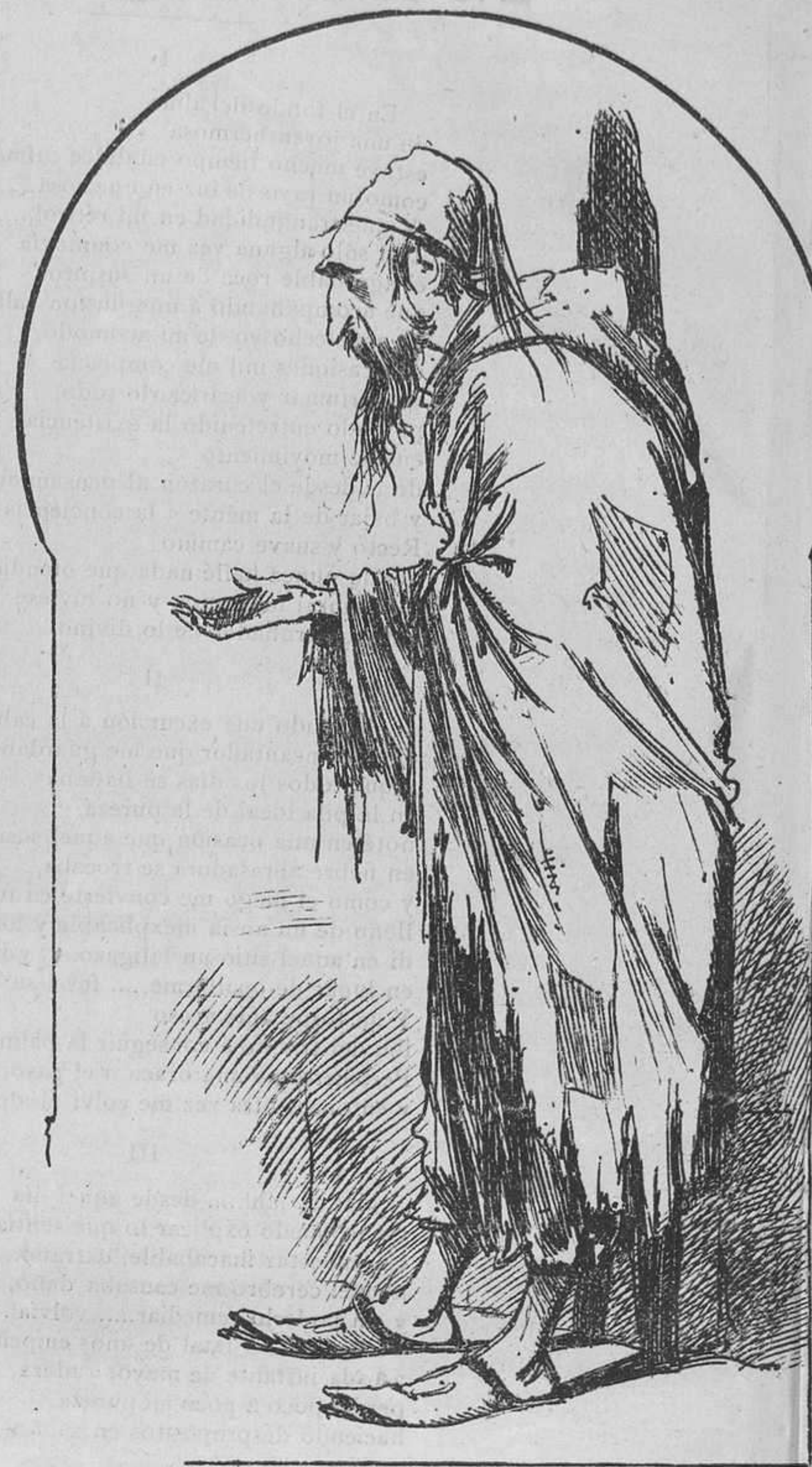
Quando creáis que este moro masculla alguna oración, resultará que es un terno de San Felit de Guixols.