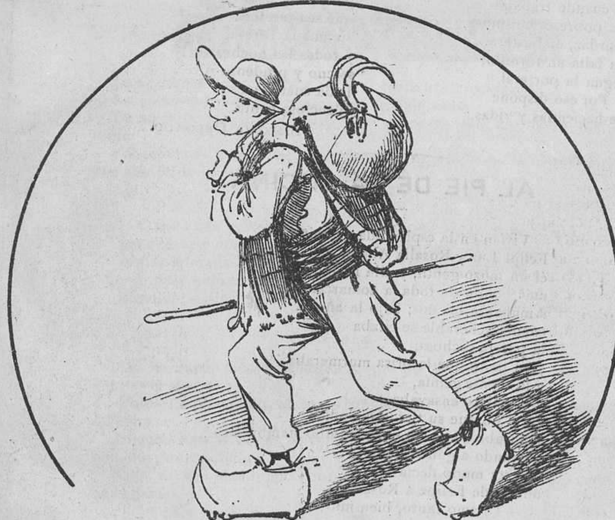
Cruza con muchos apuros el río, el llano, la sierra.... y luego vuelve á su tierra con catorce ó quince duros.