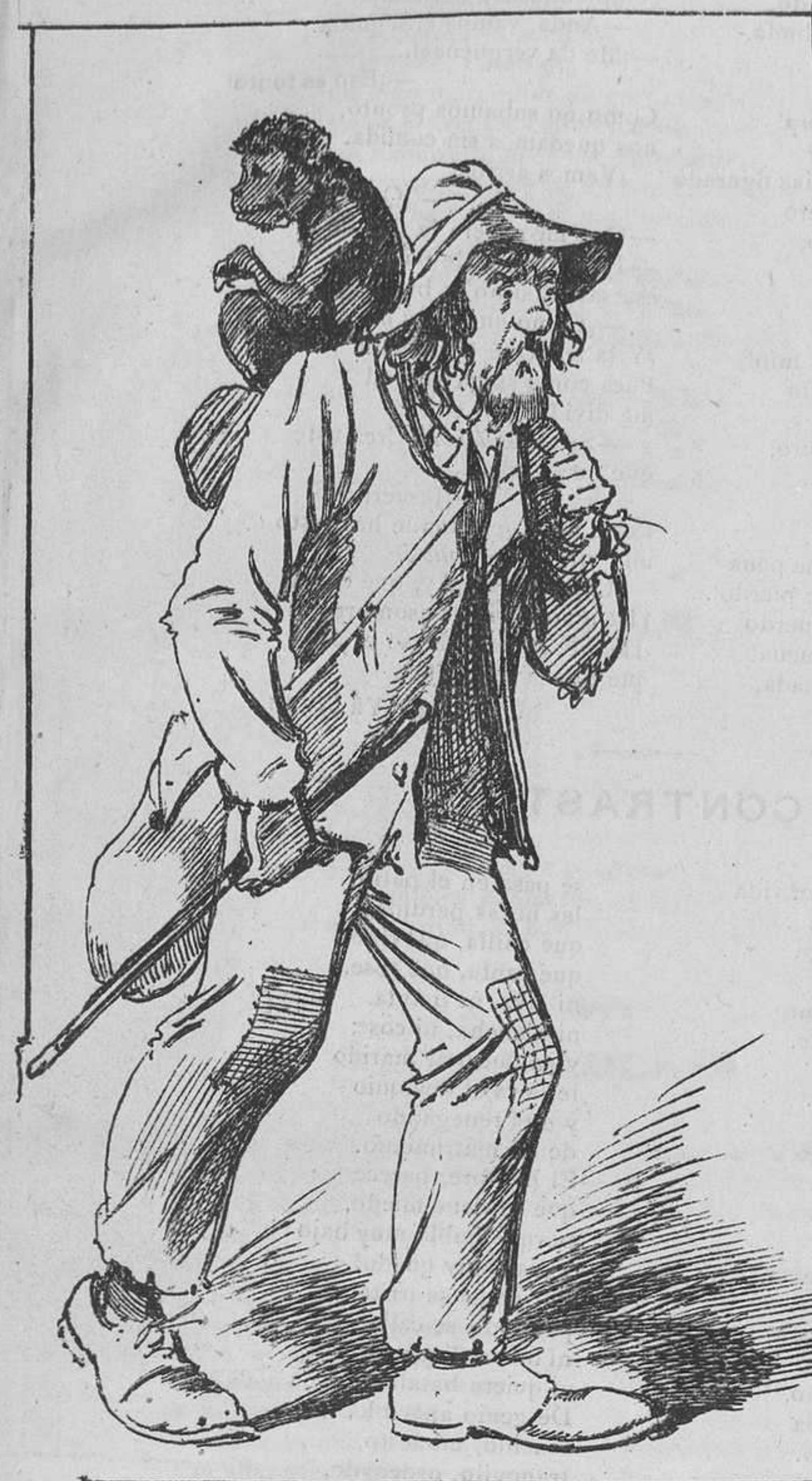
Hace habilidades por un perro chico, y no comen nunca ni el hombre ni el mico.