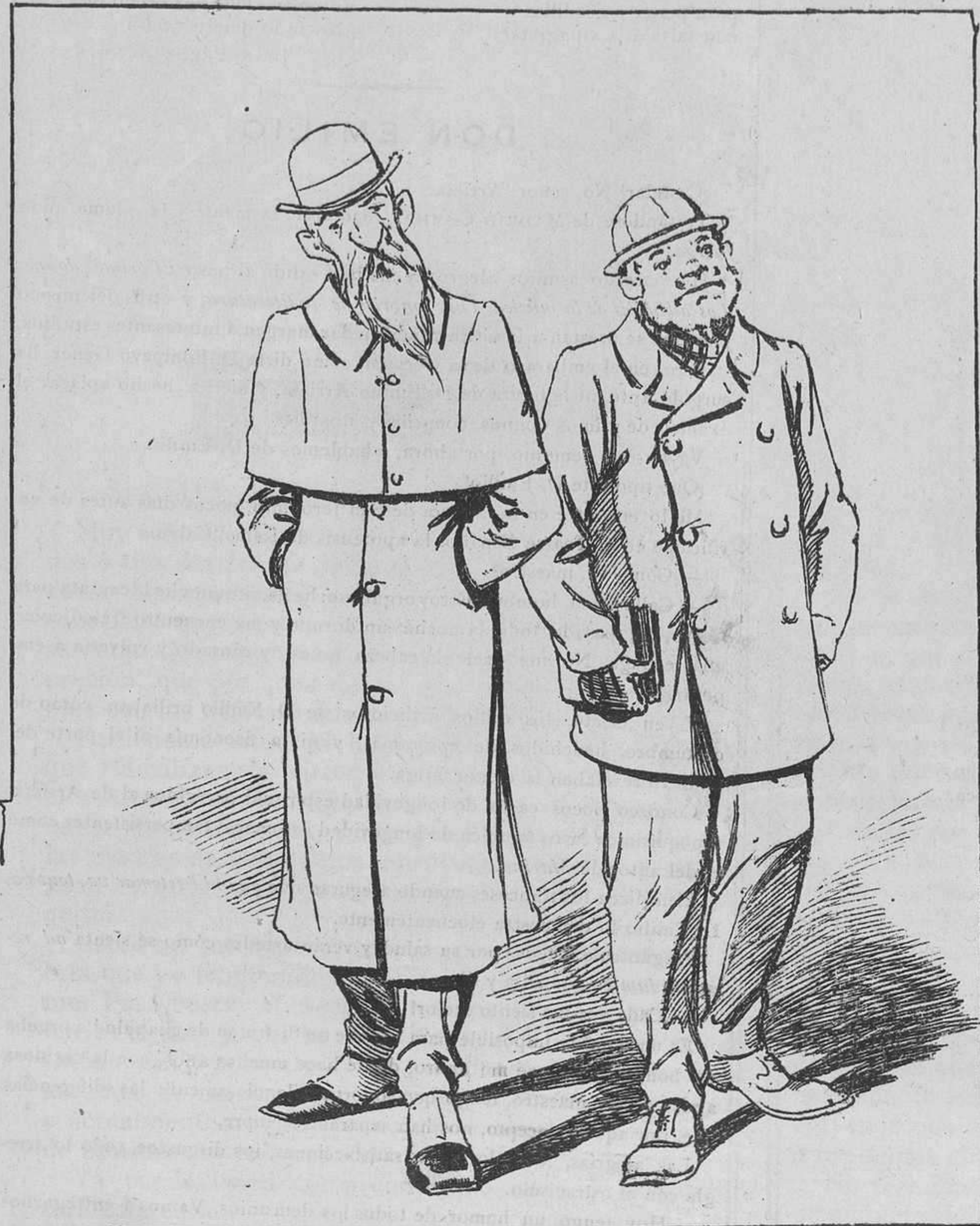
Recorren, con la guía bajo el brazo, viajando sin cesar, el mundo entero, sin que entiendan de nadie una palabra y sin que nadie les entienda á ellos.