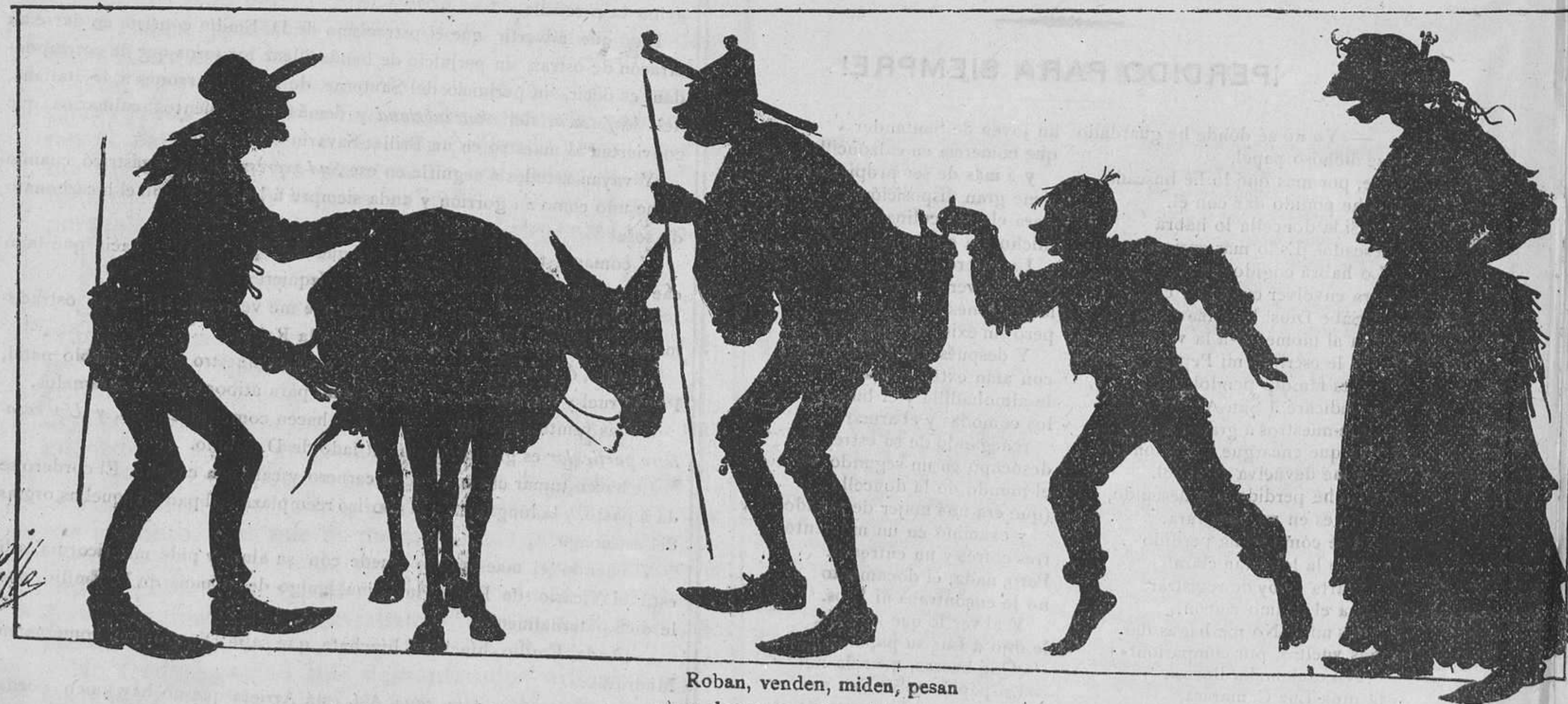
Roban, venden, miden, pesan y no descansan ni un día.... ¡Dichosos los que profesan la andante gitanería!