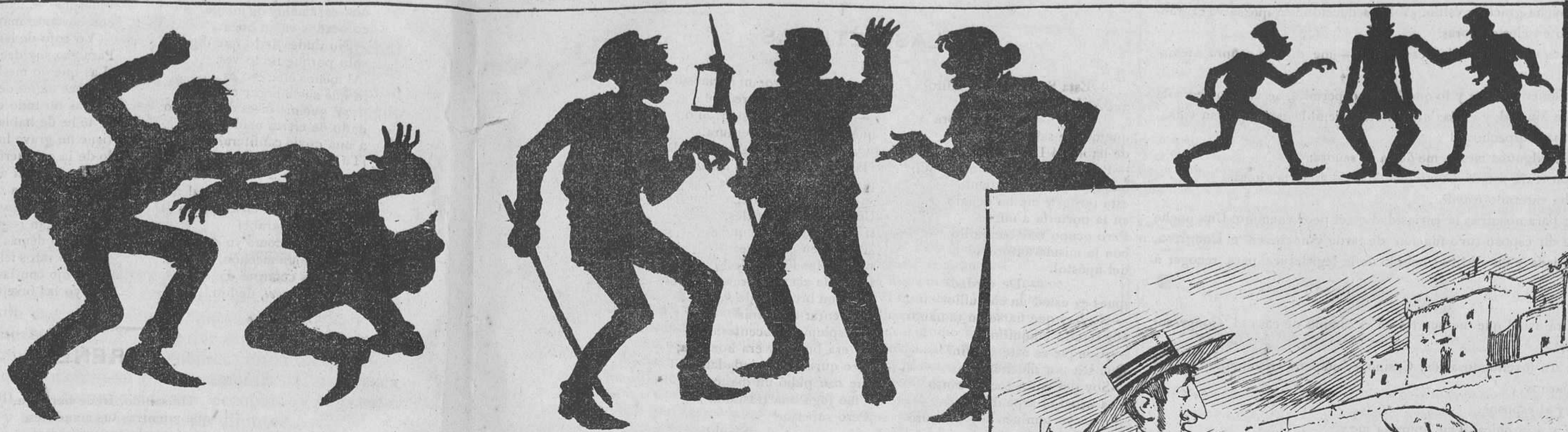
Madrid pacífico.—Altas horas de la noche y primeras de la madrugada.

—Ya no queda un caballero que distinga á una señora ¡y precisamente ahora que se me acaba el dinero! ¡Triste de mí! ¿Á quién le pido que me pague el reservado si aquí ya no se ha quedado nadie... más que mi marido?