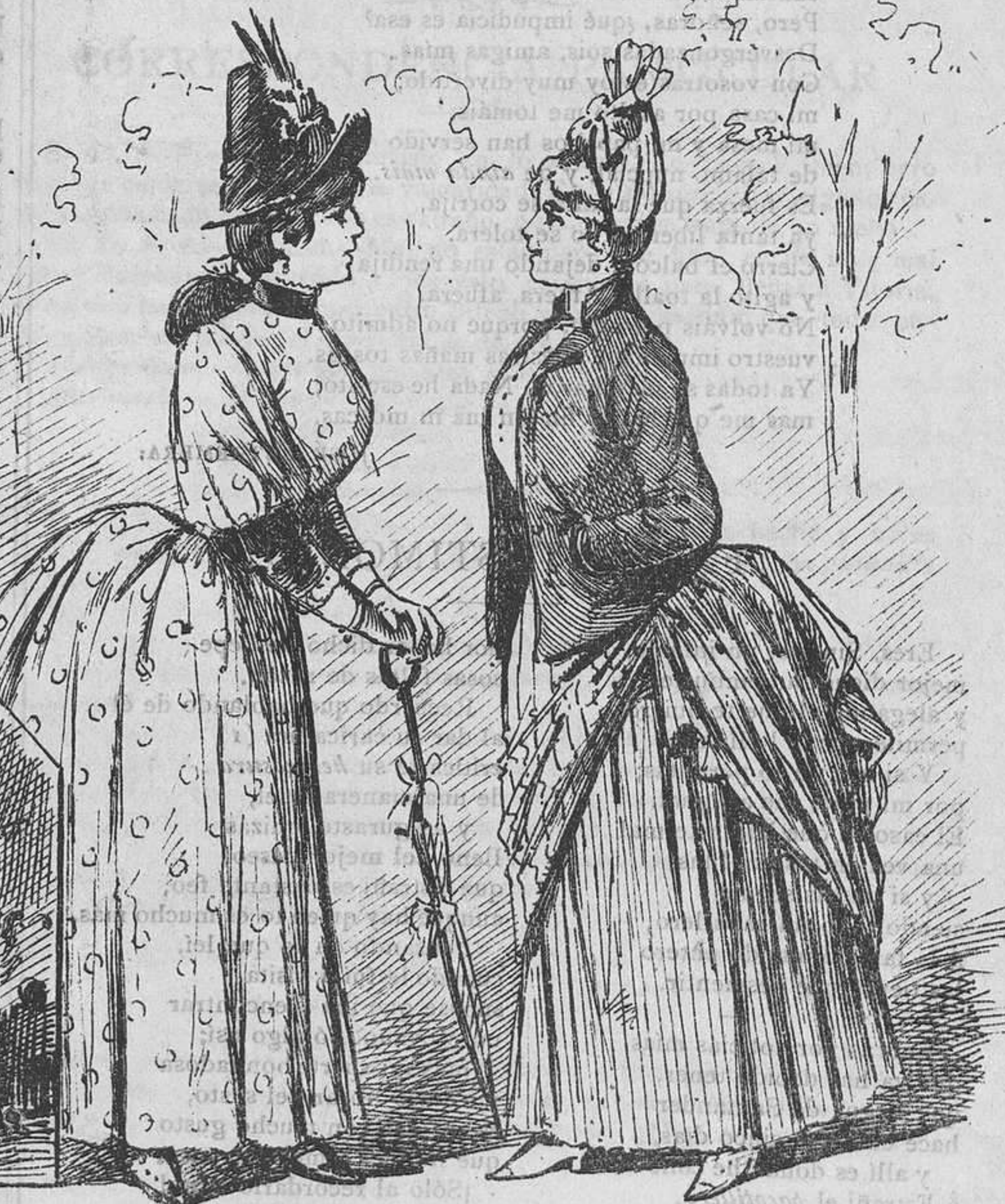
¡Y luego dice uno que no le vengán con alicantinas! ¡No caerá esa breva!