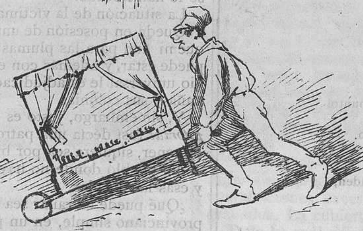
Refrescos en tartana.