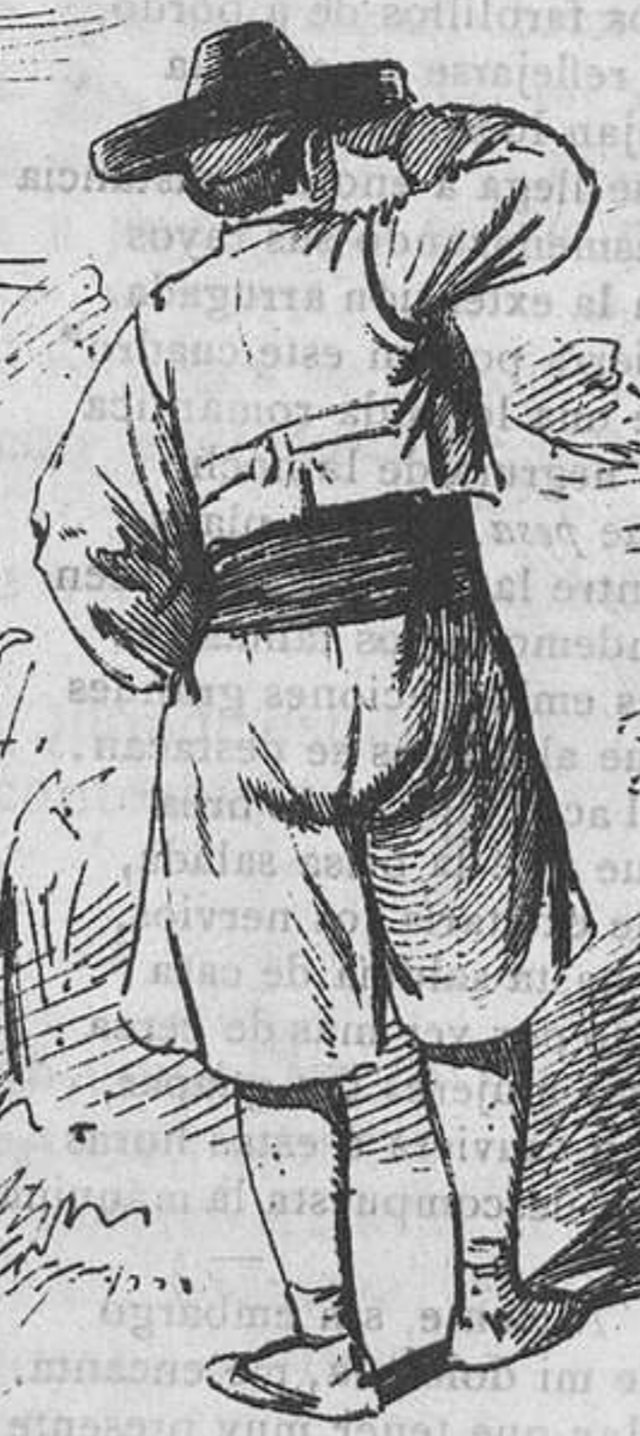
—¡Un conejo! ¡Si tuviera aquí la escopeta le trincaba el cap!