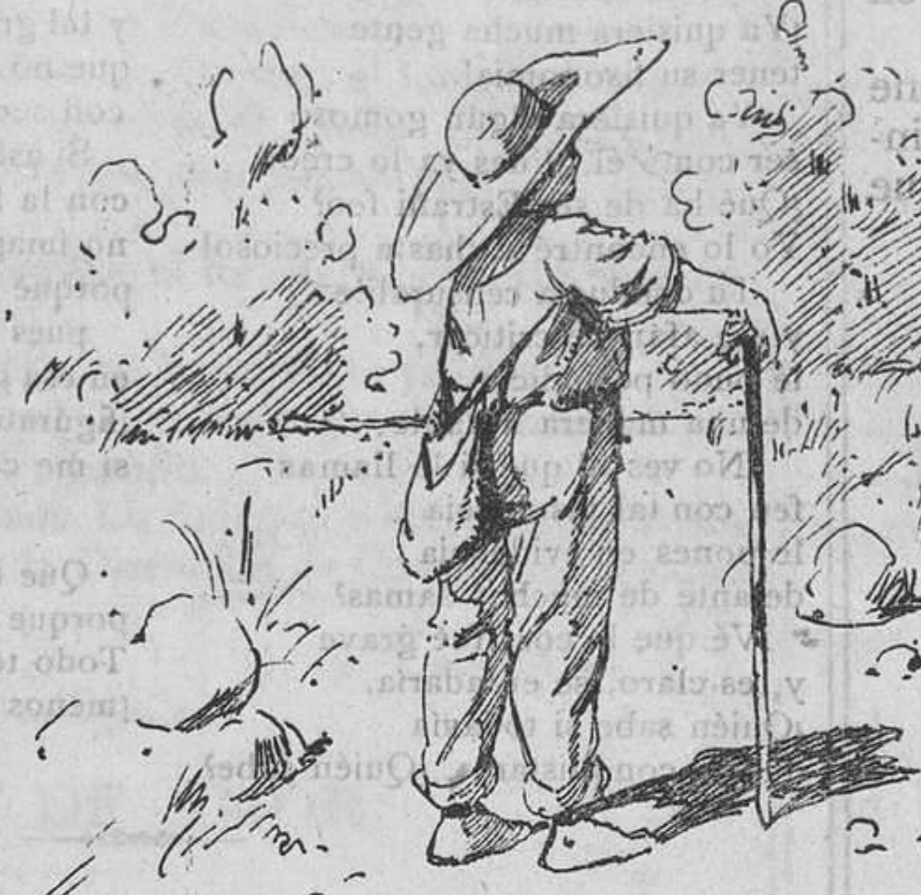
Ya saben desde ahora los eruditos, la figura que tienen los pastorcitos.