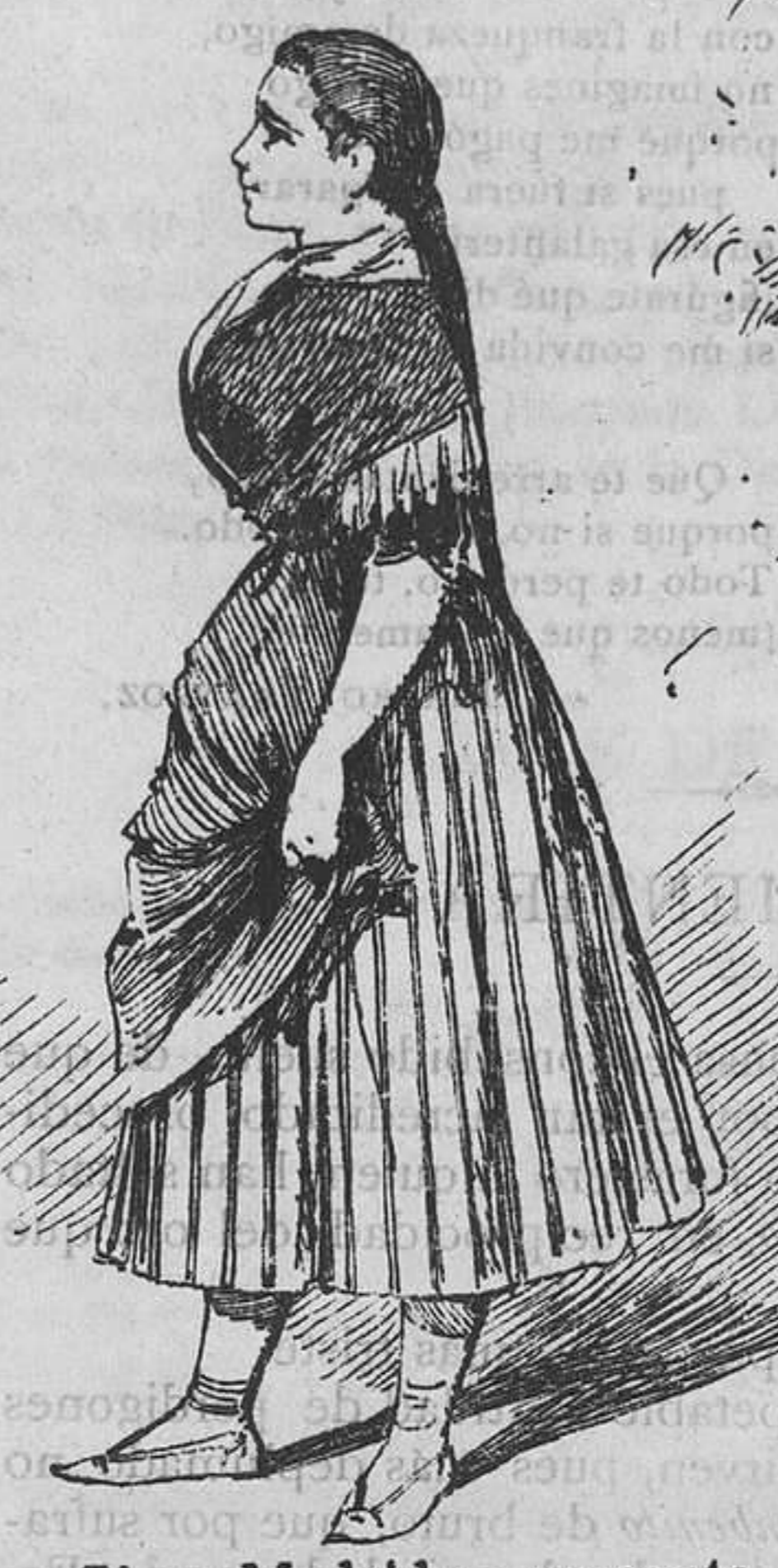
Si en Madrid se presenta con esa gracia, boca abajo en seguida la aristocracia!