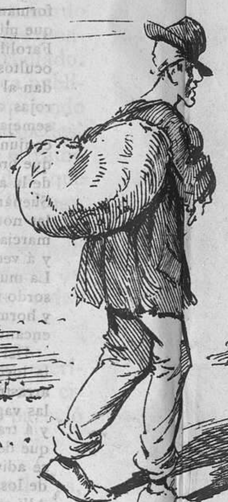
—¡Drapets, quin te pera vendre!