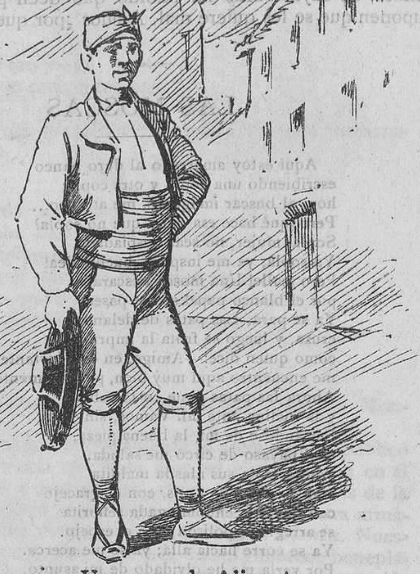
Un mozo de Alicante garrido por detrás y por delante.