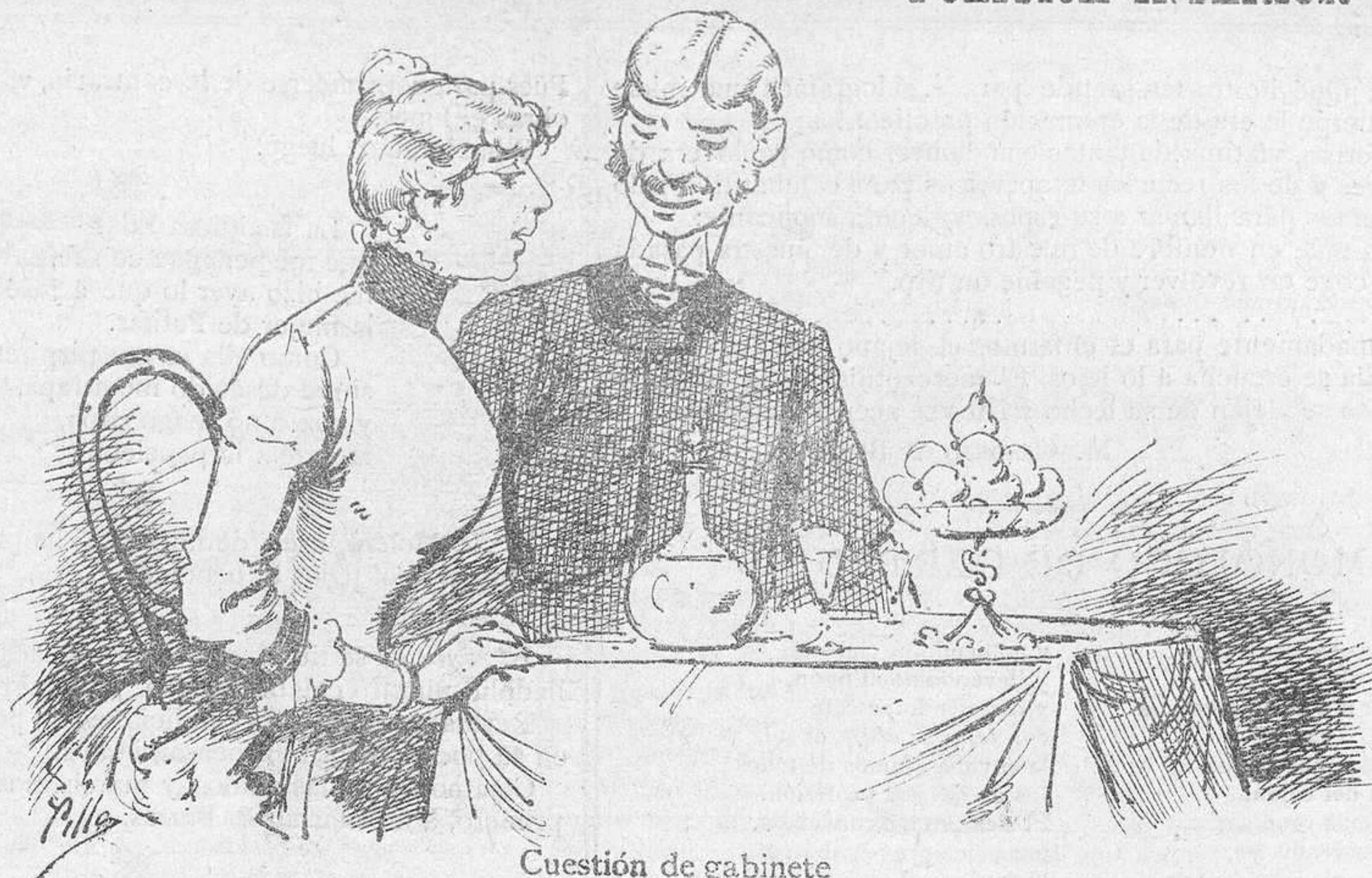
Cuestión de gabinete que á bastantes señoras compromete.