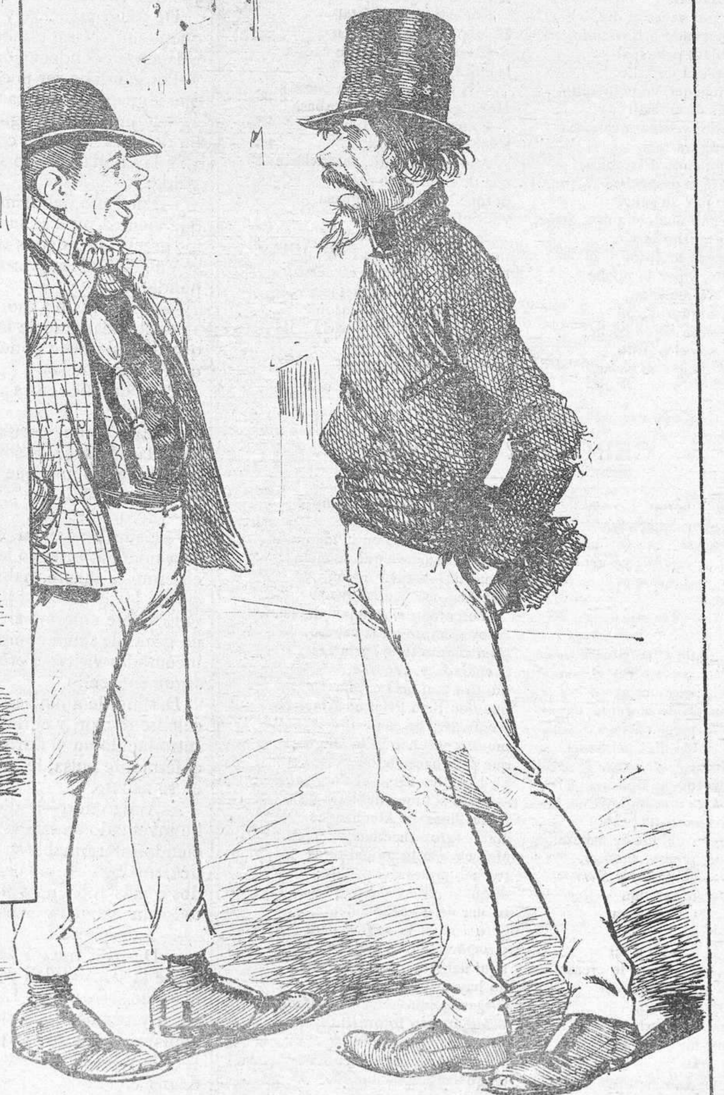
EN LA CALLE DE SEVILLA

—No tengo más que lo puesto y estoy en el púrgatorio. —¡Yo traigo debajo de esto la ropilla del Tenorio!