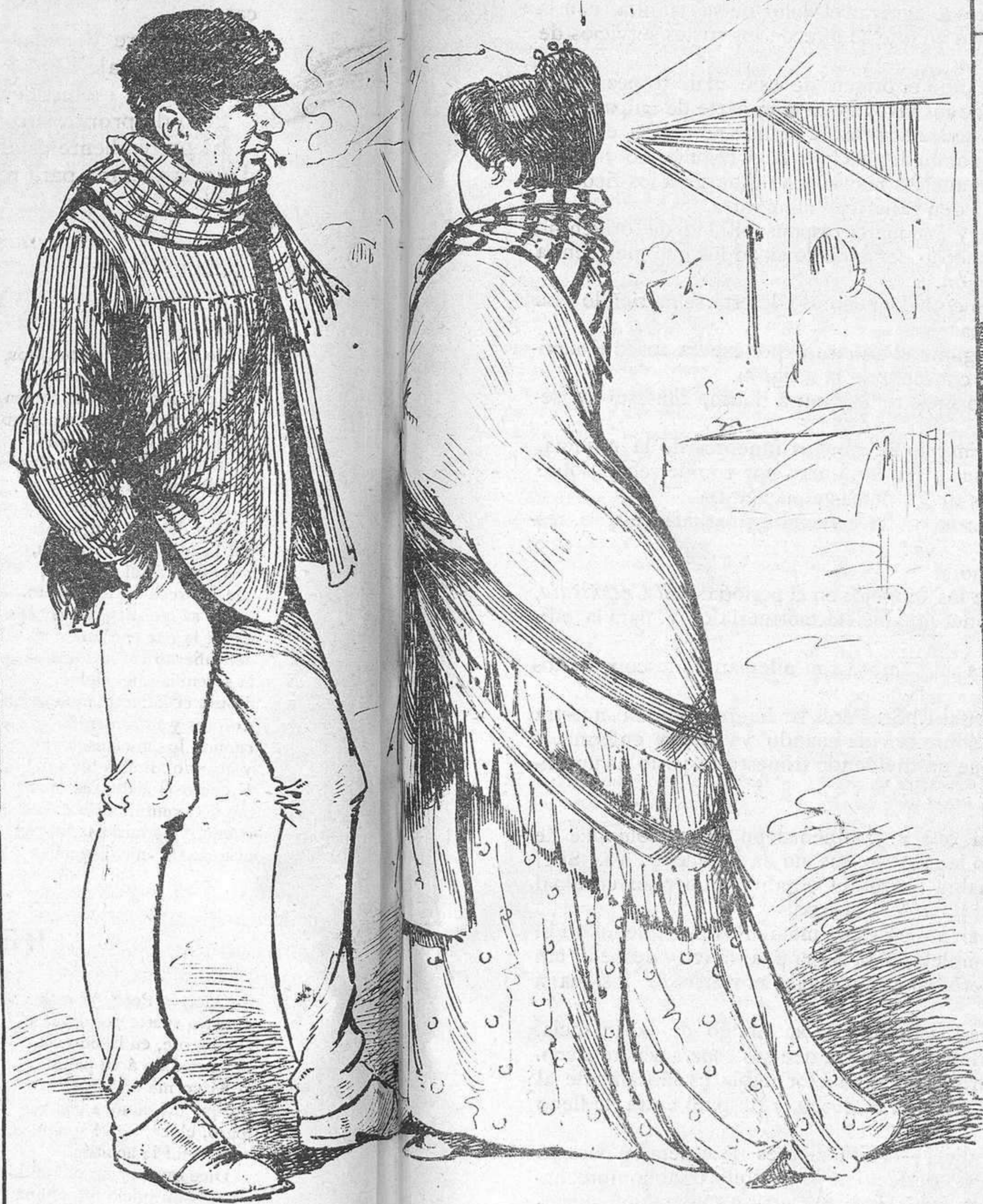
EN EL CASTRO

—Míá tú, con franqueza; mi madre dice que te desprecie porque eres probe y no tiés ná. —¡Maldita siál que no tengo ná!