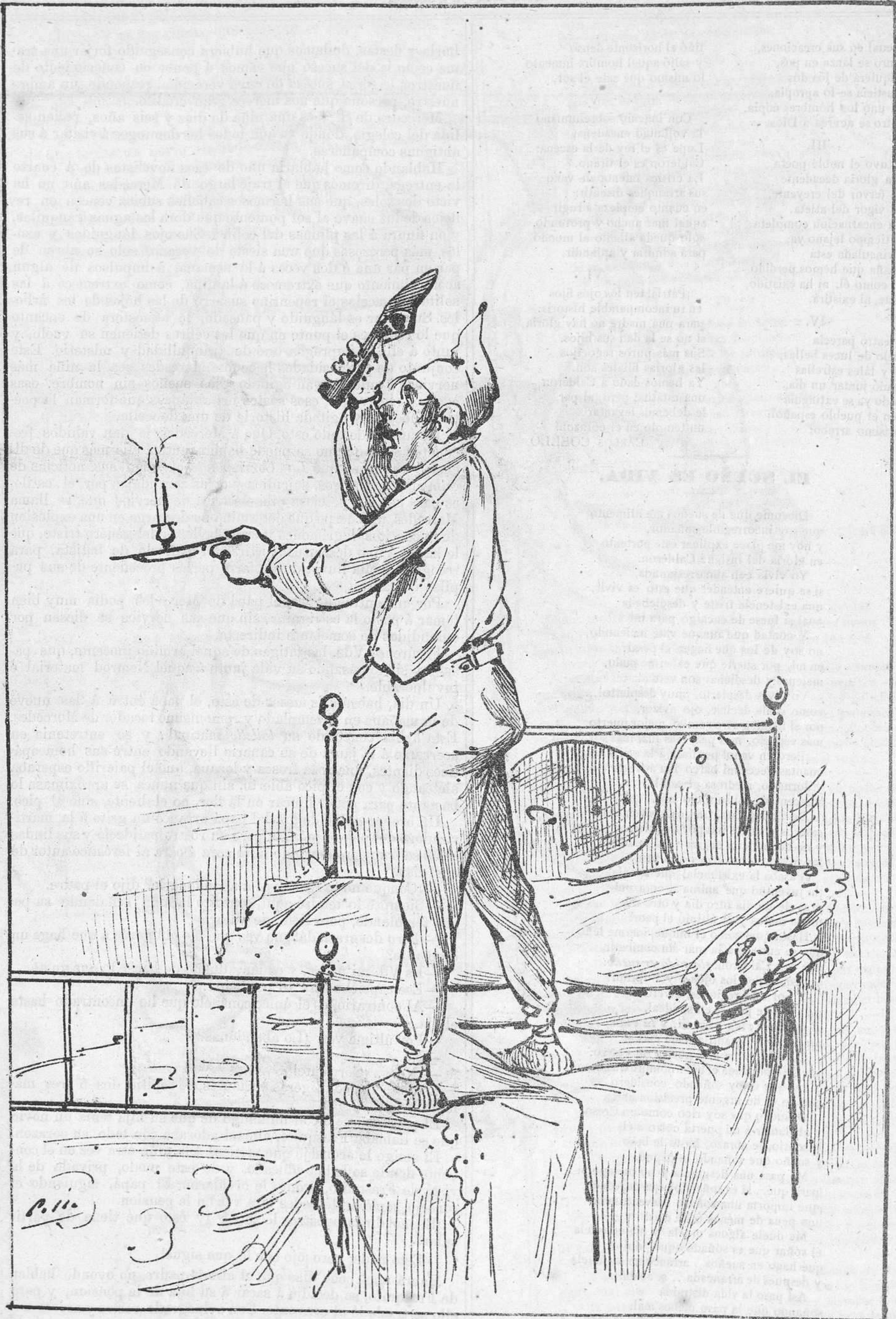
VELADA LITERARIA Y CASI MUSICAL.