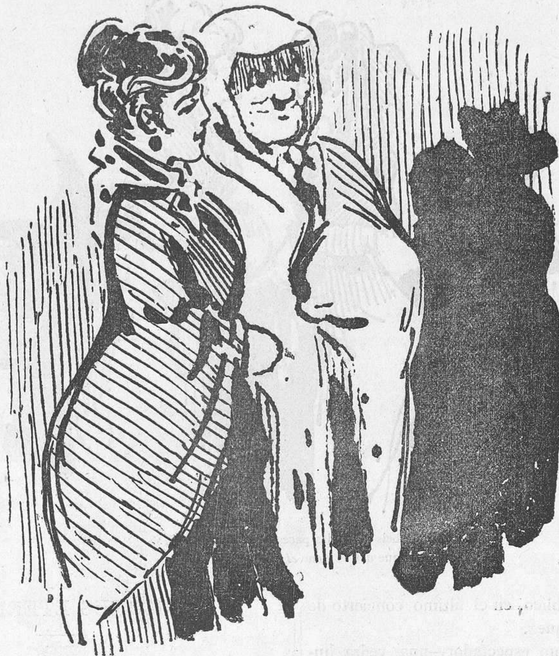
Hay noches muy desgraciadas.—Vamos á casa, porque si entramos en el café—ya no quedarán tostadas.

Entonces fundó su grandioso Depósito de los pobres de la candela .