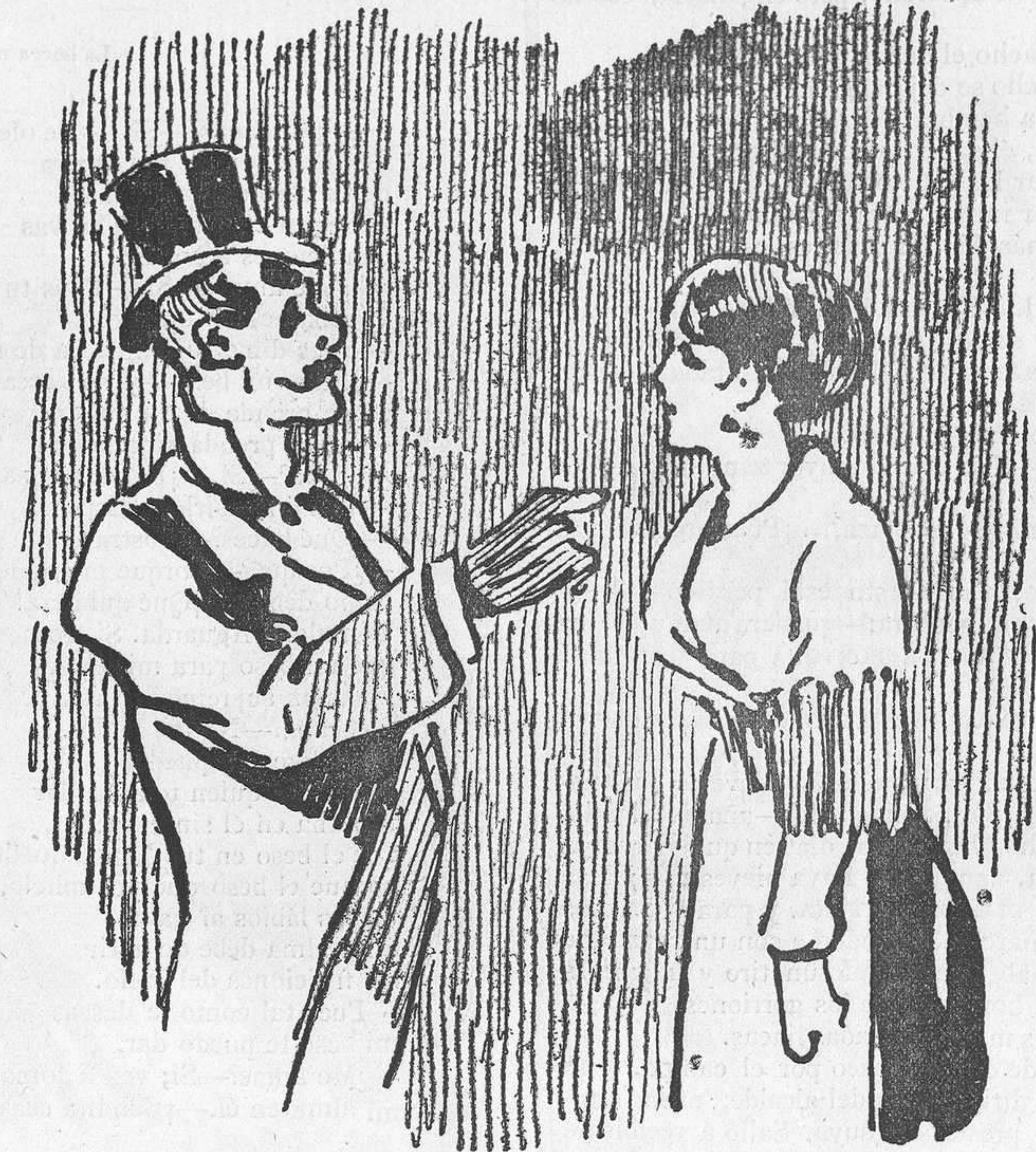
¿Dice usted que hoy ha venido?—¿Dice usted que es de Tarrasa? ¿Dice usted que no ha servido?...—Pues bien, servirá usted en casa.