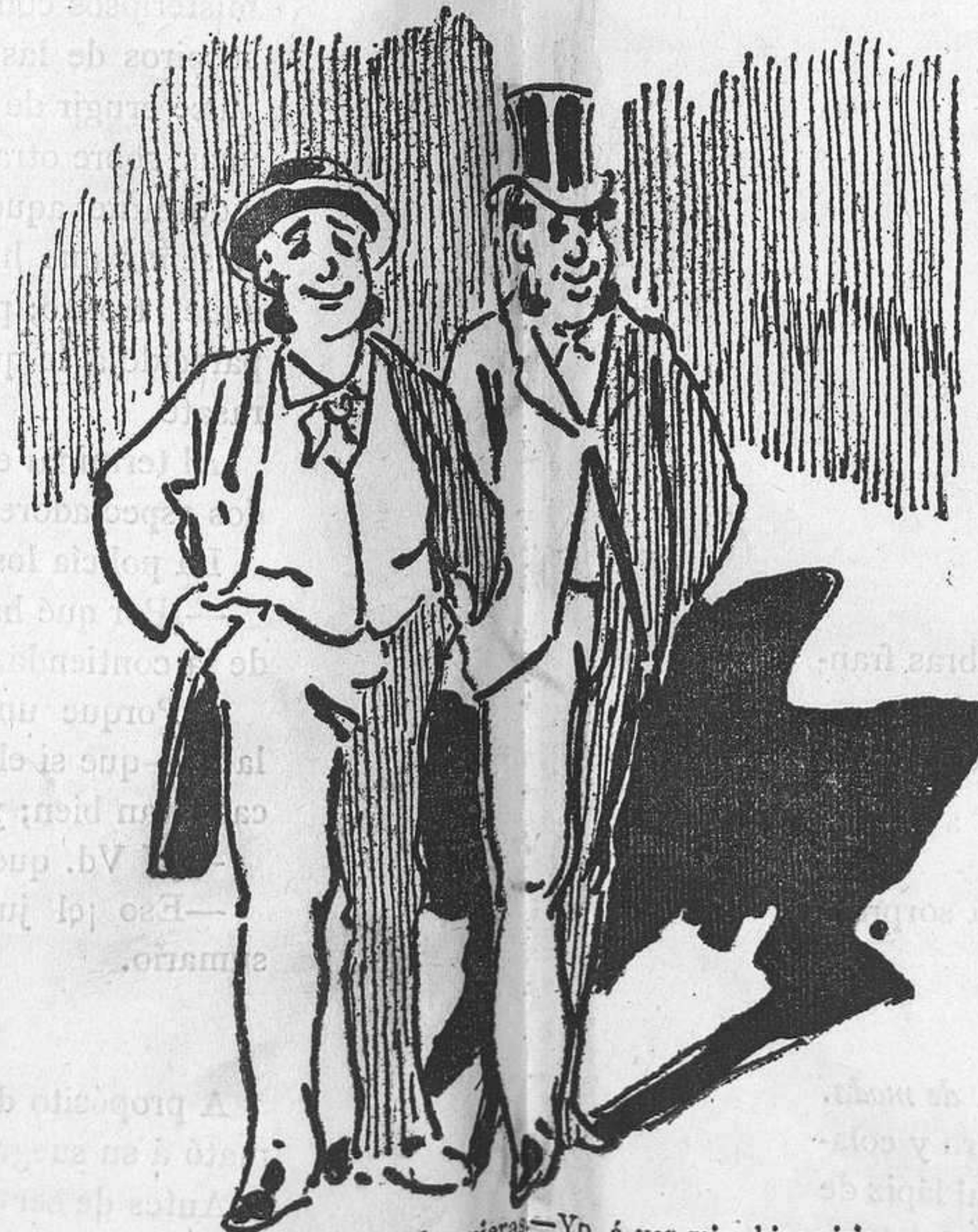
—¿Dónde vamos?—Donde quieras.—Yo, á ver mis chicos iría. —(Este va á ver las niñas!)—(Este, ¿as amas de crial!)

El médico entró: —¿Vive aún? preguntó D. Segundo con ansiedad.