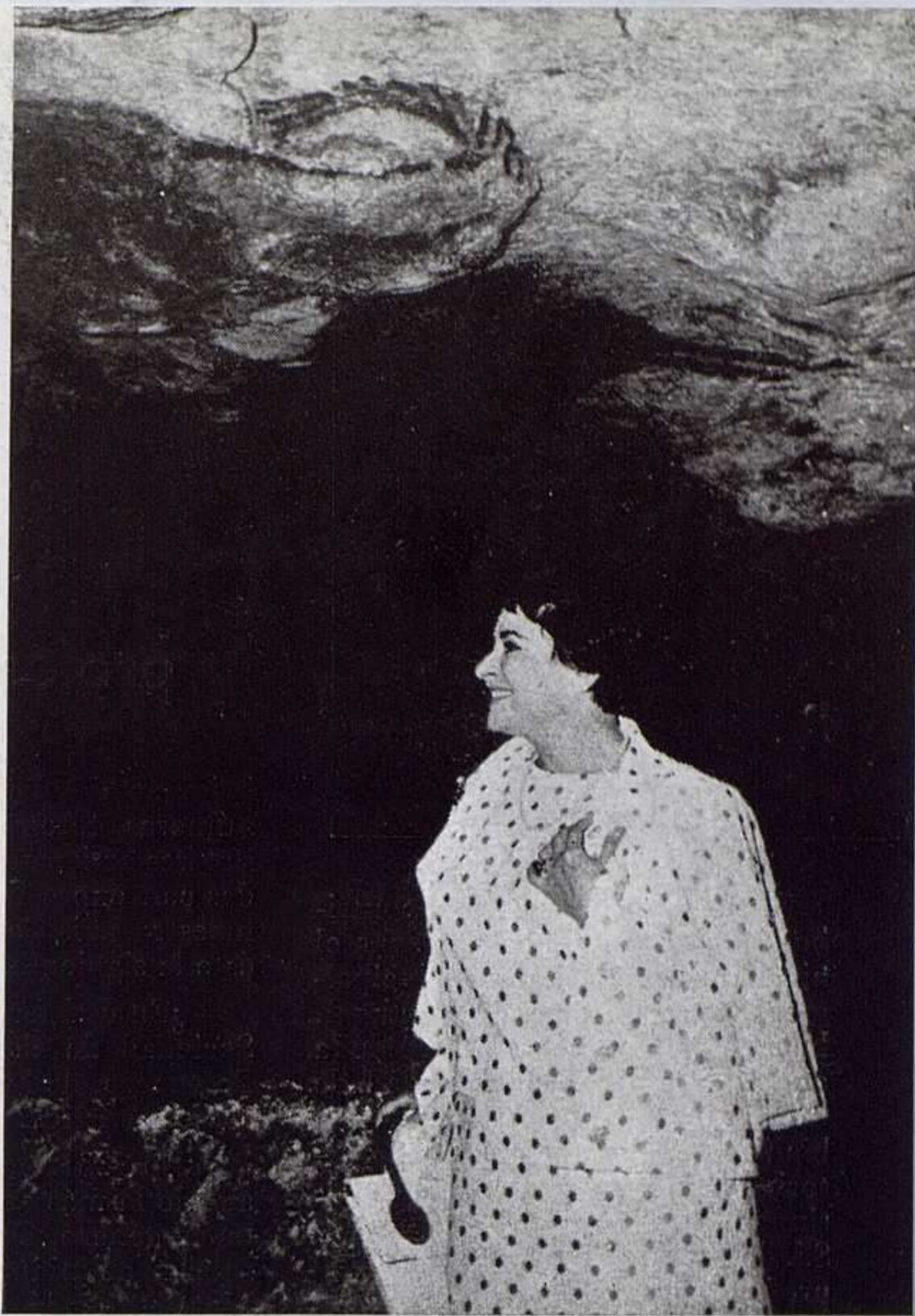
Victoria de los Angeles visitando las Cuevas de Altamira, en Santillana del Mar.

El que ha oído cantar a Victoria de los Angeles una sola vez, ya cree en Dios para siempre.