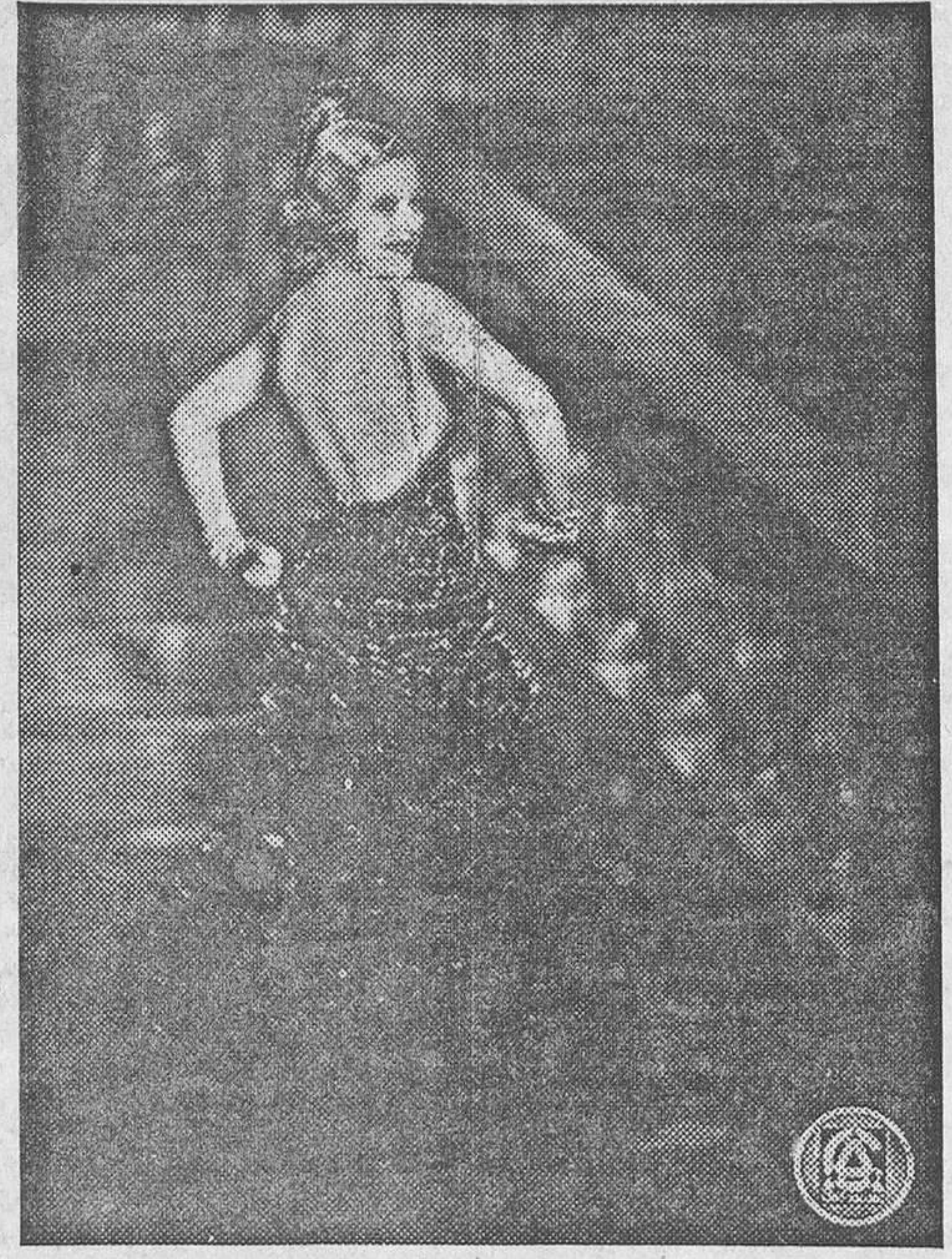
La bellísima cantante Maria Eggerth, que reaparece hoy en el Avenida como protagonista de la deliciosa opereta «Una Carmen rubia»

Nada se ha regateado en la comedia de Rubio y Moreno: atrezzo lujosísimo, bellas decoraciones, rico vestuario... Todo ello nos hace prever un éxito apoteósico para «Te quiero porque te quiero», comedia andaluza que el miércoles 14 se estrena en el Ascaso.