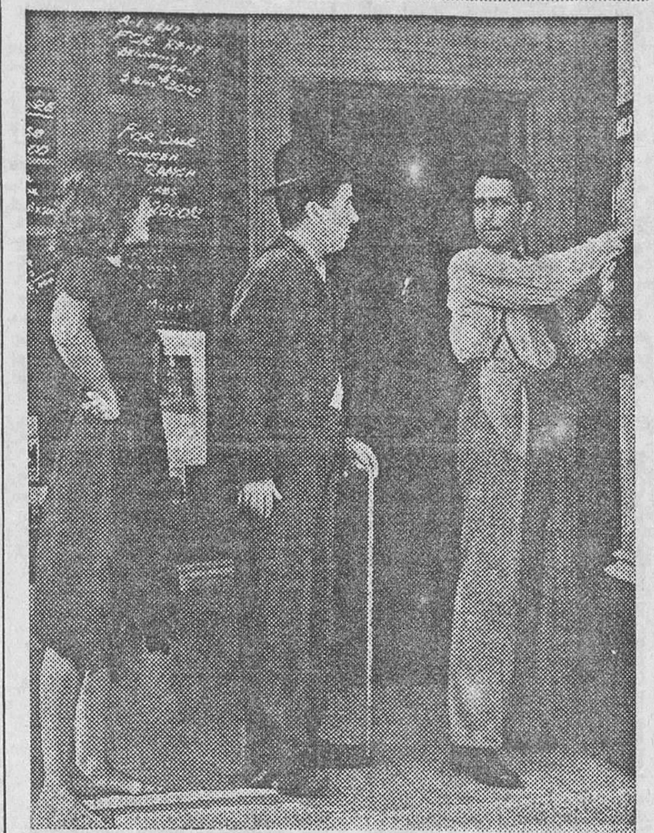
El genial Charles Chaplin, «Charlot», en una escena de «Tiempos modernos», la famosa superproducción que hoy se presentará al público en el Capitol.