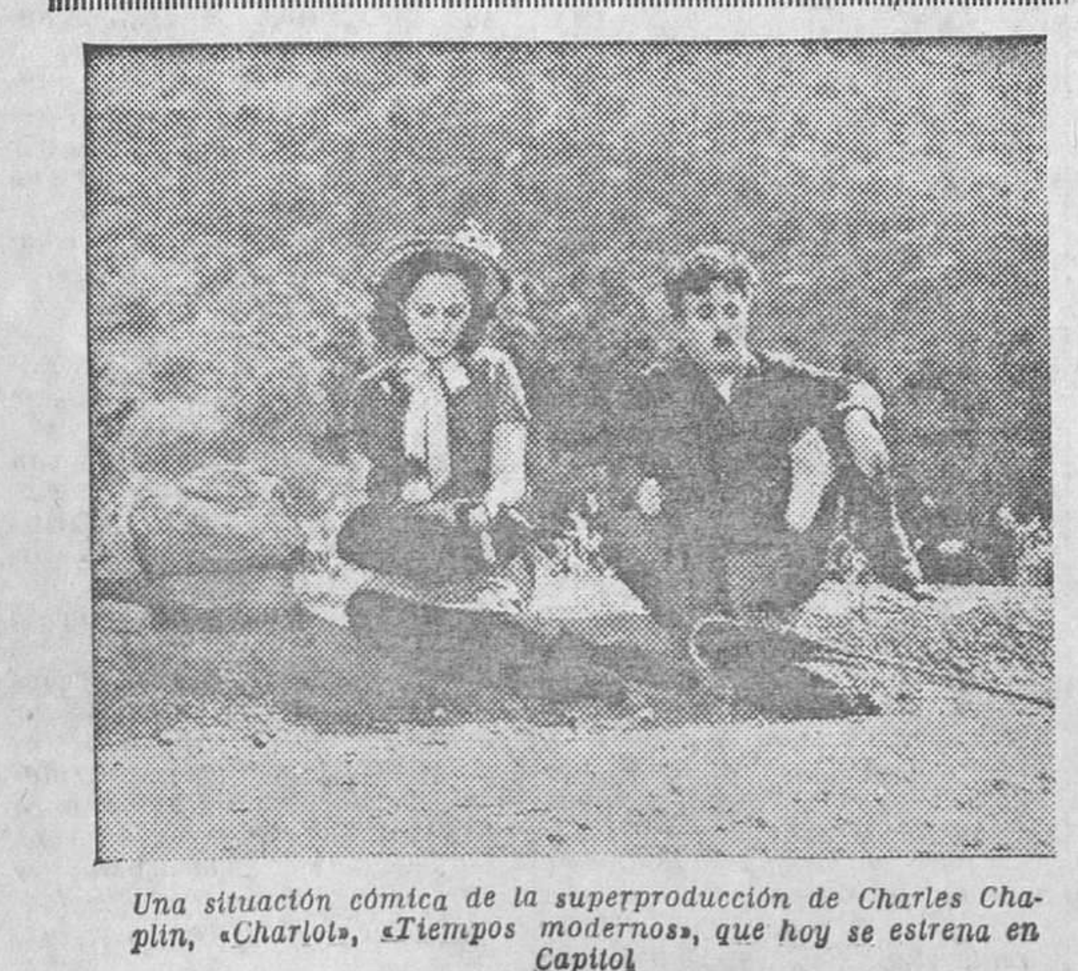
Una situación cómica de la superproducción de Charles Chaplin, «Charlot», «Tiempos modernos», que hoy se estrena en Capitol