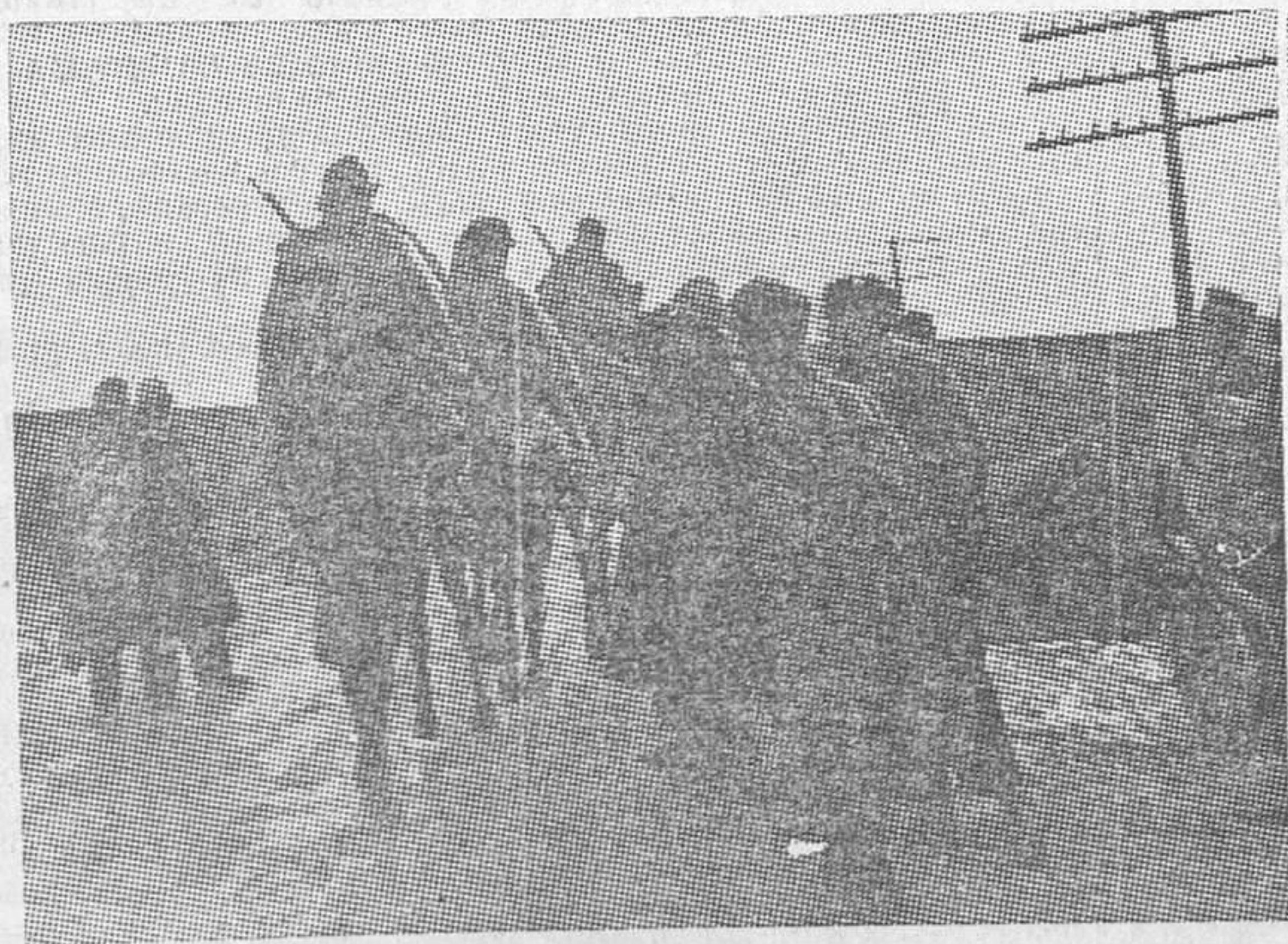
Caballería y artillería leal avanzan por campos de la Alcarria tras de las fuerzas dispersas de las divisiones italianas

Fueron llevados hasta las puertas del cementerio y allí ejecutados. El alcalde de Palma estaba tan enfermo que hubo que ponerle inyecciones para que pudiera ponerse en pie. Para fusilarlo tuvo que sentarse sobre una piedra, única manera de que no cayese al suelo.»