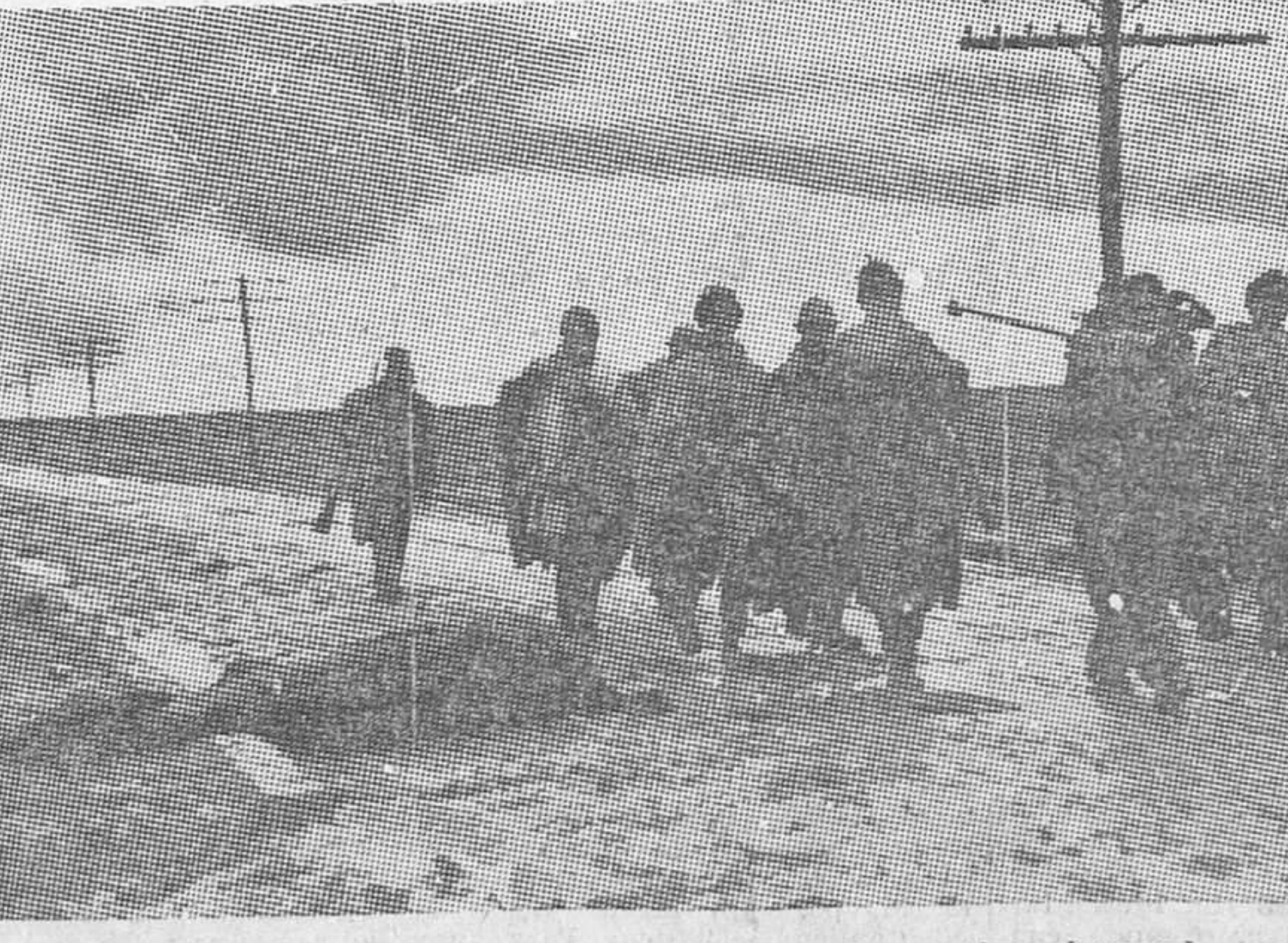
Por la carretera de Aragón nuestros soldados caminan buscando a los invasores extranjeros