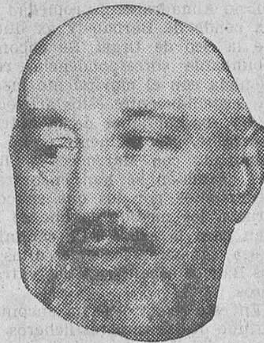
El delegado español en la Sociedad de Naciones Sr. Ossorio y Gallardo, que ha sido elegido vicepresidente de una Comisión jurídica de dicho organismo

No tendrá más de dieciséis años. Y si tiene más, la estatura es la de un muchacho. Viene pálido, con los ojos febriles y las manos temblorosas.