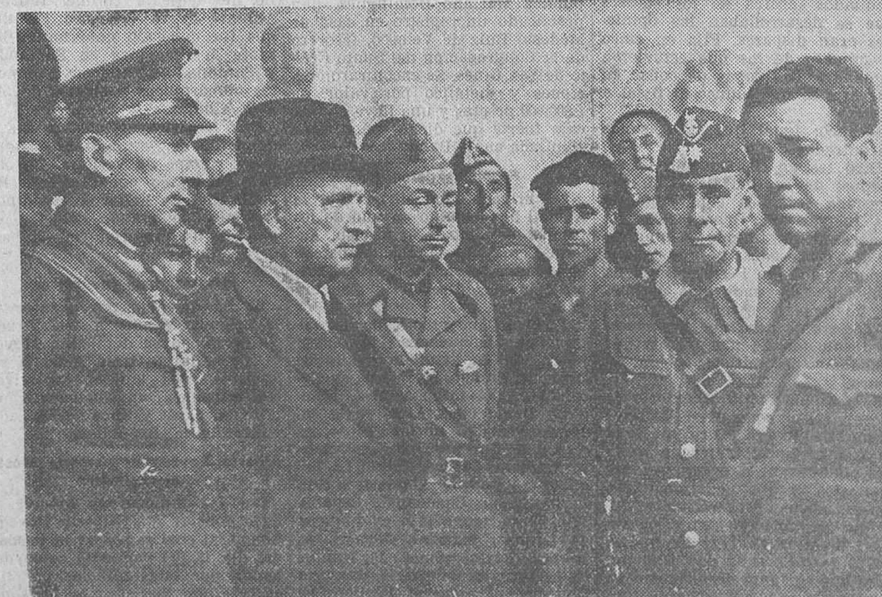
El presidente del Consejo y ministro de la Guerra, acompañado de su Estado Mayor, visita los sectores de Talavera y Santa Olalla

—Regresamos. Nuestro coche se convierte en una estafeta de Correos.