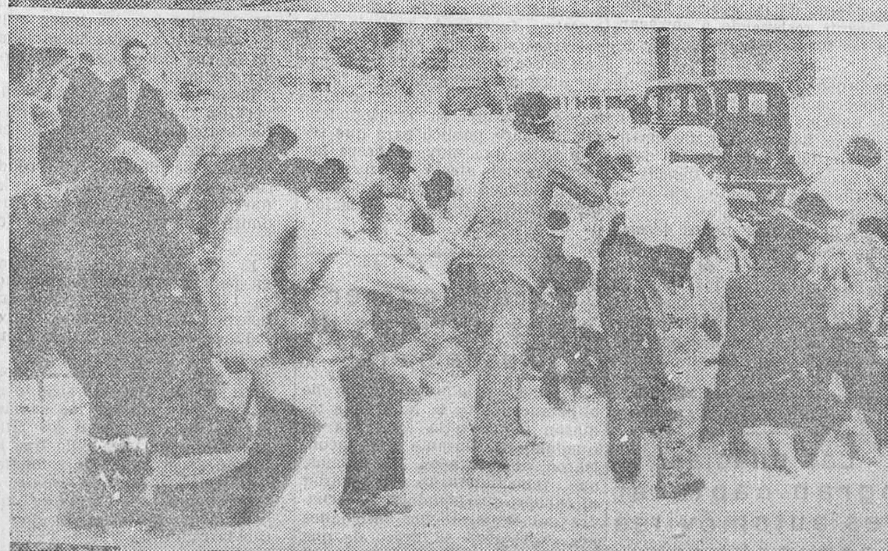
ASPECTOS DE LA HEROICA LUCHA SOSTENIDA POR LAS FUERZAS LEALES EN TOLEDO.—1. Las milicias armadas hacen fuego desde la torreta de la Puerta de Bisagra sobre la plaza de Zocodover.—2. Otro grupo de milicianos, situados en las casas altas que dominan a los sediciosos, sostiene nutrido tiroteo con los que aún se resisten en las afueras de la capital.—3. Toledo es tomada por las fuerzas leales. Esta brava muchacha, con dos compañeros parapetados tras un automóvil, se baten heroicamente minutos antes de la rendición de la imperial ciudad.—4. He aquí el momento de la entrada a Toledo de las tropas y milicias, que se adueñan de Zocodover. Tendidos sobre el suelo y de rodillas disparan sobre los últimos que ofrecen resistencia

Desde esta altura se ve cómo con fuego de ametralladora y fusil avanzan en guerrilla los leales. Suben los guerrilleros pegado su cuerpo al suelo. Les cuesta conseguir los objetivos que se les han señalado; pero no retroceden. Avanzan y avanzan, disparando miles de tiros por minuto. Los cañones, elevando sus tiros sobre las guerrillas, protegen la subida de los infantes.