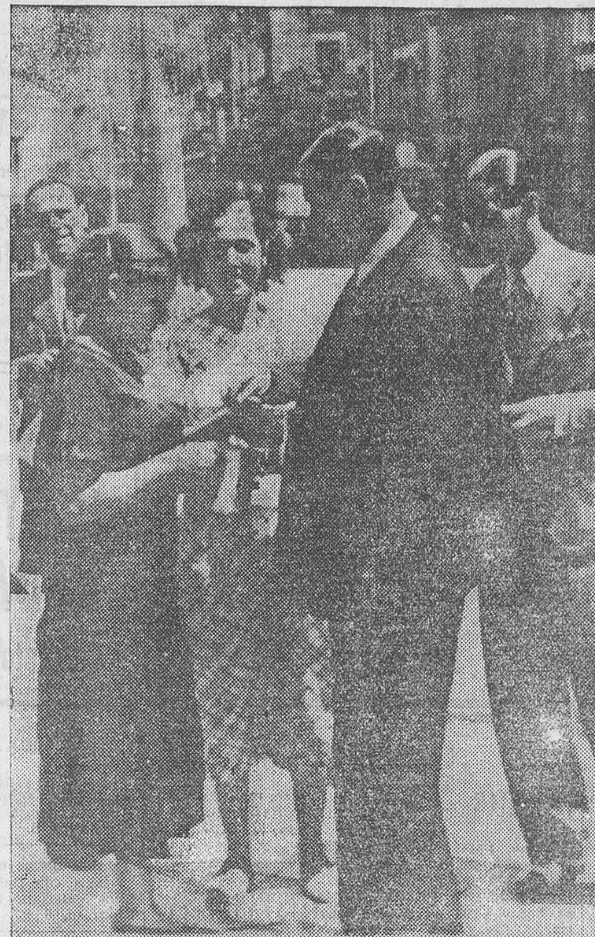
Un grupo de señoritas postula en la calle de Alcalá, de Madrid, para el Socorro Rojo Internacional. En la foto aparecen dos bellas postulantes, pertenecientes a la entidad Rosa de Luxemburgo, portadoras de huchas, en las que los transeúntes depositan su dinero en abundancia

concediendo valor a la placa y carnet, que son los únicos distintivos, registrando domicilios de otros y amenazándoles a ellos y sus familiares. Y esto no puede tolerarse, debiendo ser perseguidos los que tal hagan, pues, como queda expresado, este Cuerpo, sin excepción hasta ahora, trabaja a nuestro lado con absoluta lealtad, y no sólo necesitan ayuda en su actuación, sino para contribuir a que ésta siga siendo tan satisfactoria debemos hacer llegar al ánimo de esos funcionarios la tranquilidad de que sus familias y domicilios están perfectamente garantizados mientras ellos buscan, persiguen y capturan a los autores del criminal atentado contra la República.»