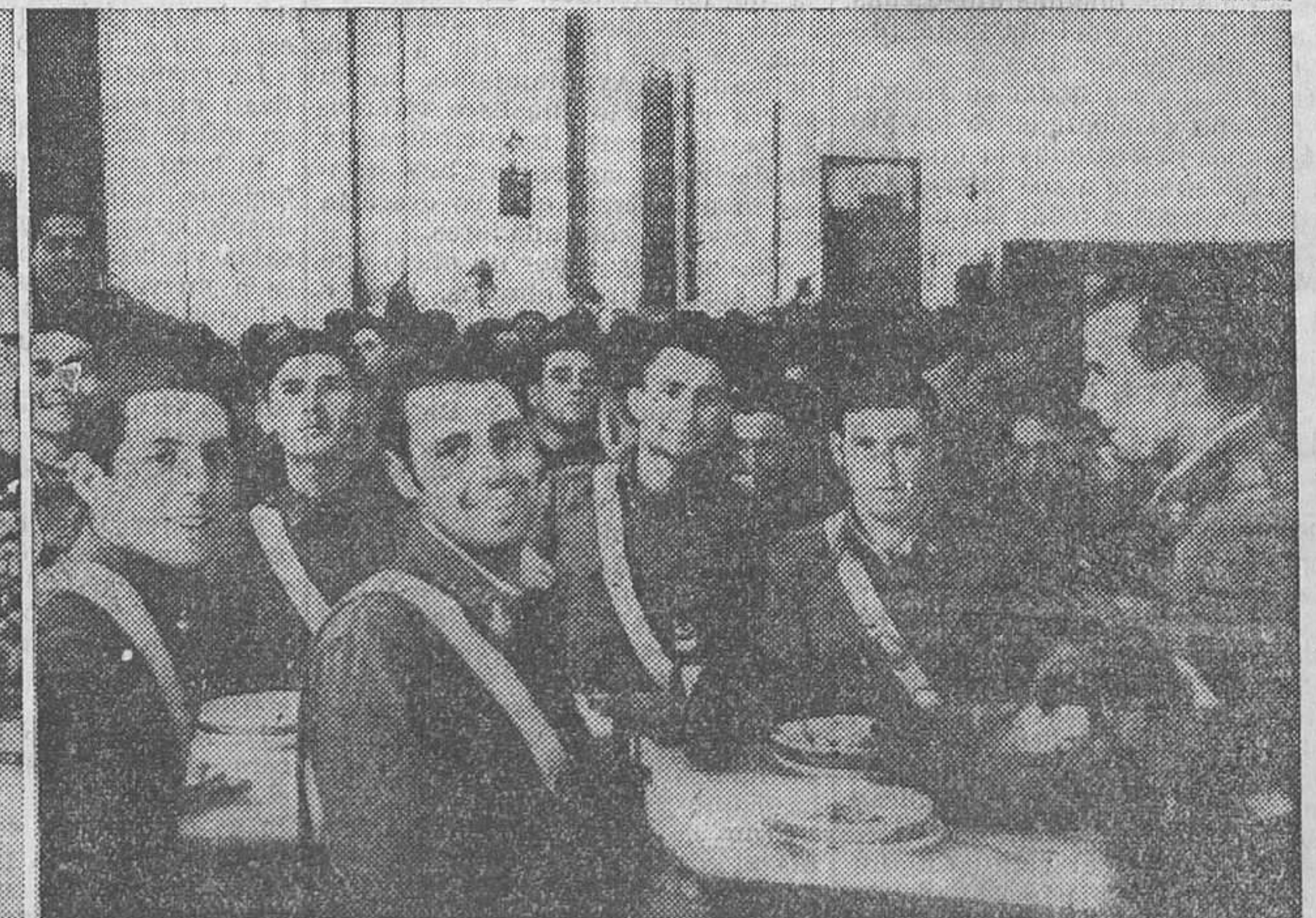
LA LUCHA CONTRA LOS FACCIOSOS.—Las milicias armadas y tropas leales continúan con todo entusiasmo sus preparativos para marchar al frente. Las fotografías muestran lo siguiente: 1. Milicias y soldados del regimiento número 2 de Artillería de Vicálvaro, preparando las piezas en el cuartel de la Moncloa.—2. La hora de la comida en el cuartel de la Moncloa.—3. Piezas de Artillería del regimiento número 2, de Vicálvaro, dispuestas para marchar al campo de batalla.—4. Grupo de soldados del mismo regimiento en el comedor del cuartel, en la mañana de ayer