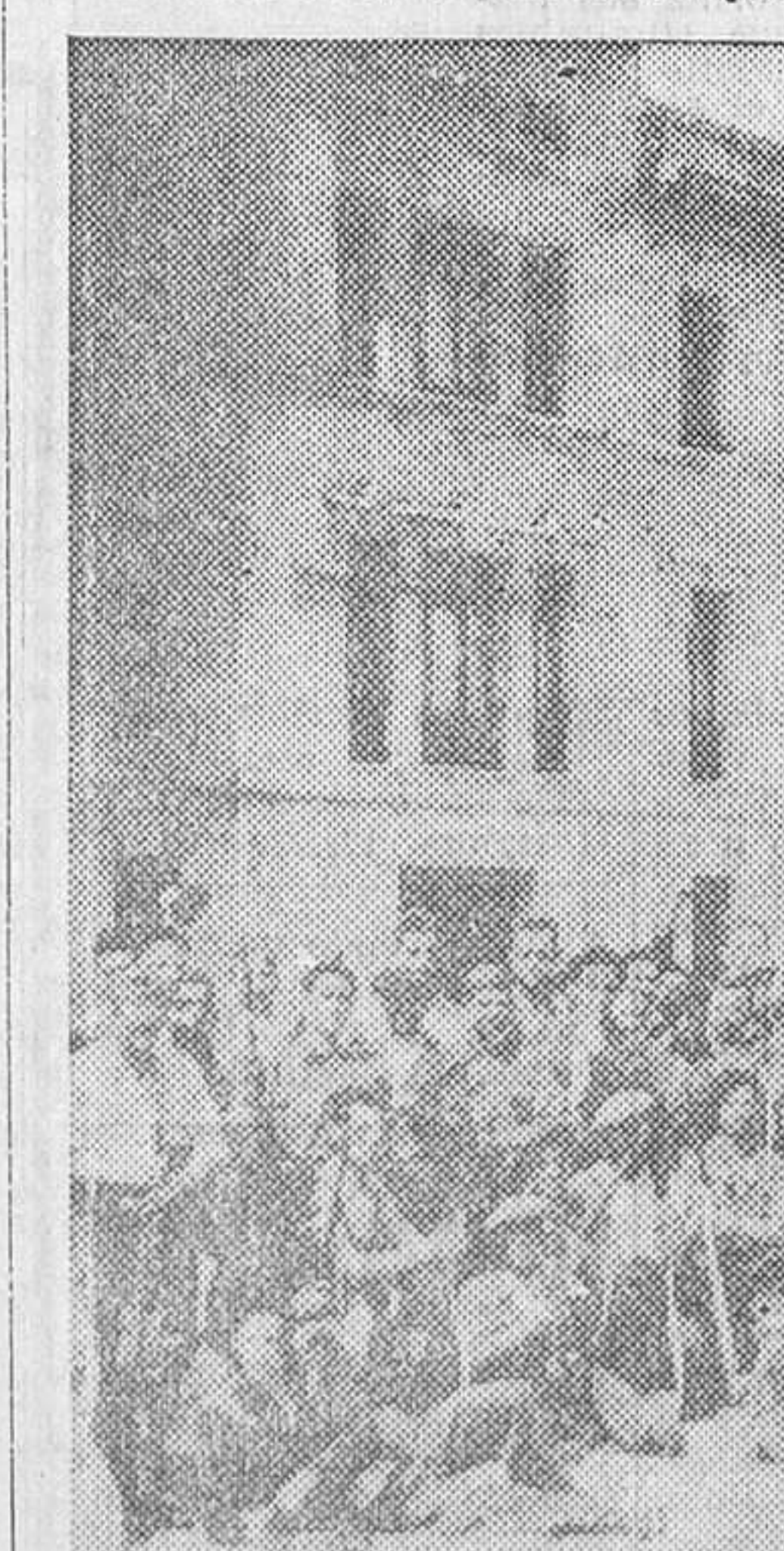
Grupo de milicianos tranviarios, concentrados en el cuartel de la Moncloa, dispuestos para salir a combatir a los facciosos

«El ministro de la Gobernación desea hacer saber que el Cuerpo de Investigación y Vigilancia, que con Asalto y Seguridad forma parte de la Policía gubernativa, dependiente de la Dirección de Seguridad, está dando muestra constante de adhesión entusiasta al régimen republicano, y sus funcionarios se multiplican para acudir a todas aquellas necesidades de su delicado cometido. En las Comisarias, en las Brigadas y en la Dirección general de Seguridad, sin hora de descanso, hacen registros y detenciones y son un vivo ejemplo de lealtad, entusiasmo y compenetración. Al registrar esta nota de satisfacción y de justo reconocimiento de mérito para tan abnegados cooperadores, tanto más apreciables cuanto que lo hacen sin distintivos ni uniformes que