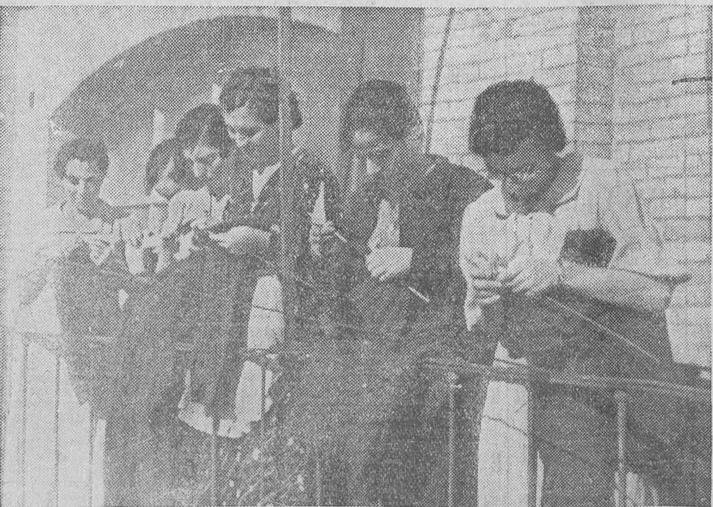
El punto, que siempre fué entretenimiento de nuestras burguesitas en sus largas horas de inactividad casera o recurso heroico para matar el tiempo en los balnearios, se ha transformado por causa de la guerra en labor intensa y eficaz que protegerá a los valientes milicianos de la crueldad del invierno. En la fotografía aparece un grupo de bellas señoritas que acuden todos los días al Monte de Piedad para elaborar jerses.

La Sociedad de Carpinteros de Taller de Madrid nos remite la siguiente nota: «Le ha sido arrebatado el carnet de Carpinteros de Taller, la cartera, documentos, el control del revólver y dos billetes de diez pesetas, por unos desconocidos que se han fingido milicianos, a las siete y media de la tarde, a un afiliado a esta Sociedad.»