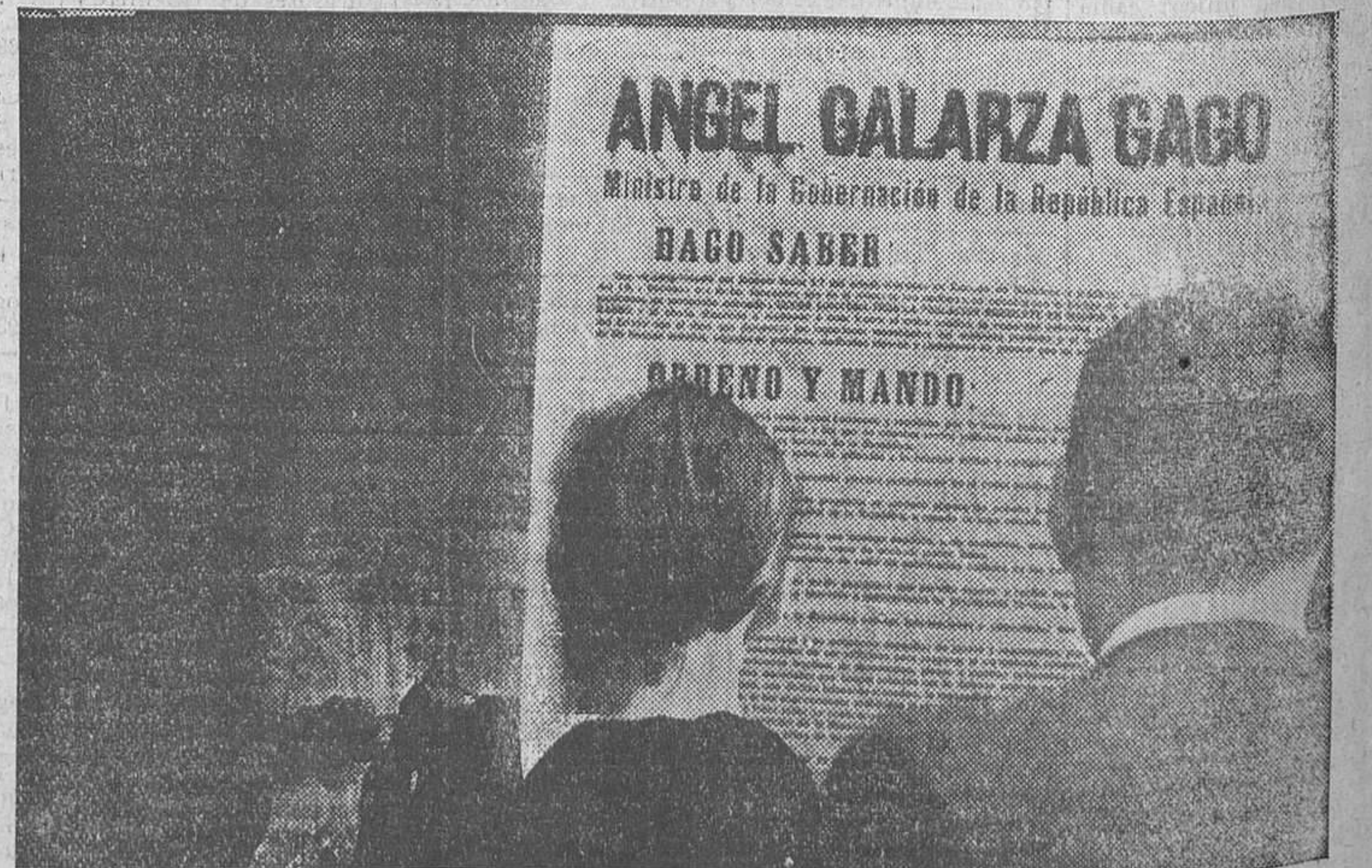
El público lee con gran interés el bando dictado por el ministro de la Gobernación para organizar la seguridad y disciplina de la retaguardia.