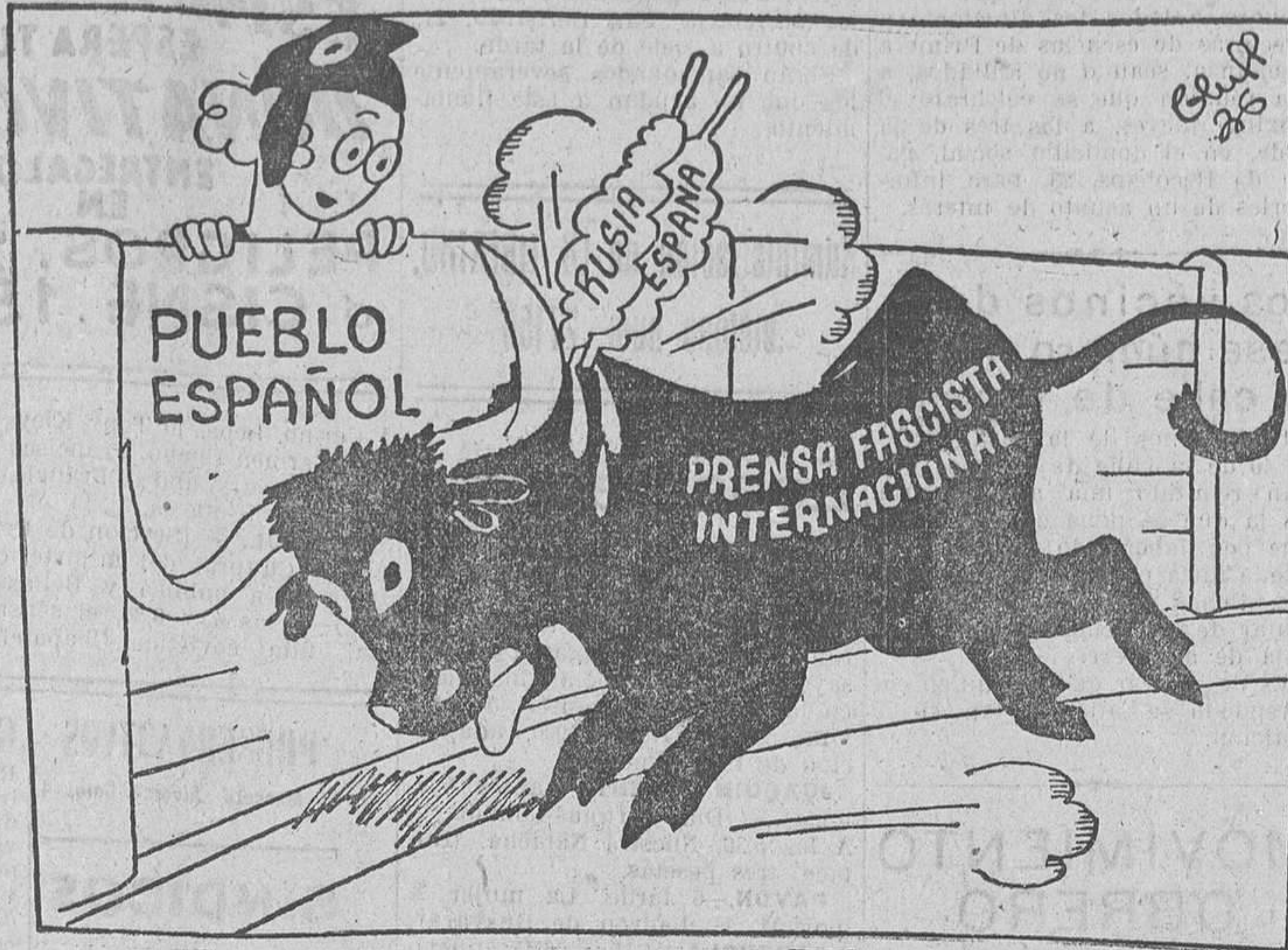
DERROTAS INUTILES, por Bluff

«Le Temps» subraya que Alemania ha sabido ganar por completo la amistad y la confianza italiana, razón de simpatías de regímenes y «gratitud italiana por