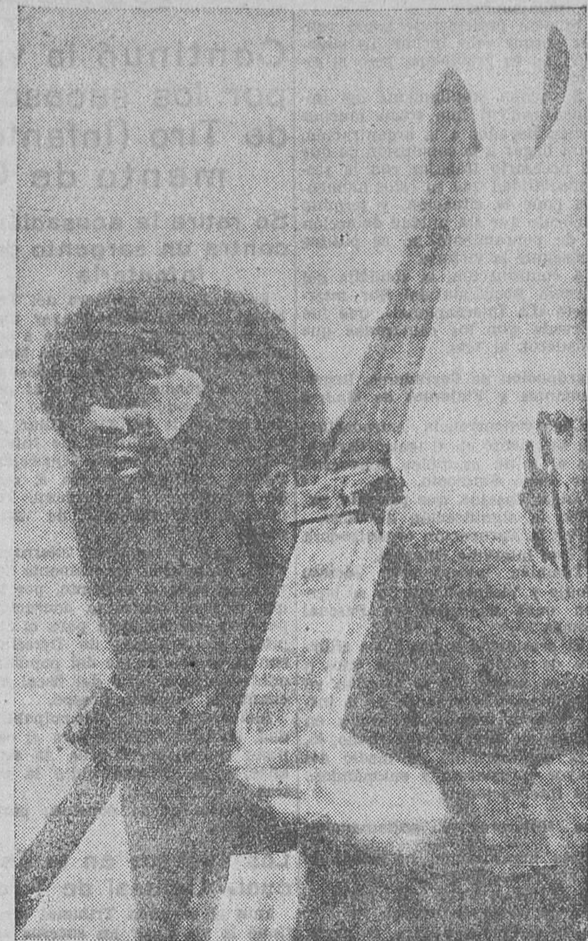
Este bravo miliciano pertenece al batallón Alpino, que en la vecina Sierra, ya cubierta de nieve, presta inestimables servicios. Concedores estos soldados de los secretos de las montañas y de sus ventisqueros, pueden dedicarse a su deporte favorito del esquí; pero ahora en defensa de la República y de la causa del pueblo

Constatan que, a despecho del acuerdo de no injerencia, tras de las potencias firmantes del mismo continúan proporcionando a los rebeldes en armas, municiones y oficiales instructores, y estiman que son incontestables los hechos denunciados de intervención directa por parte de dichas potencias. Consideran dichos hechos como