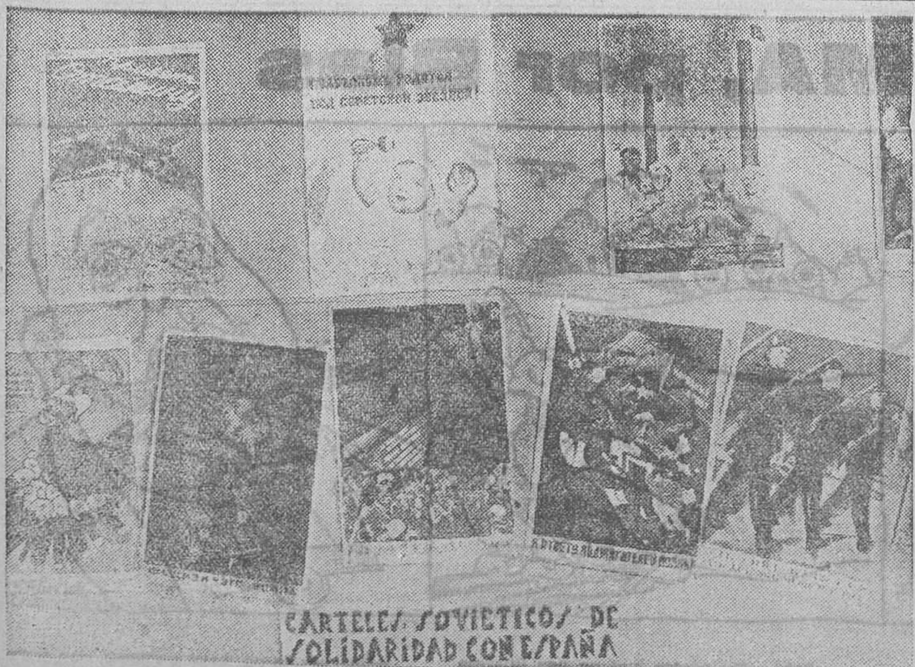
Altavoz del Frente ha inaugurado una interesante Exposición de los carteles soviéticos que se han grabado en Rusia como propaganda de solidaridad con España en la lucha contra el fascismo

Tras un intercambio de criterios, durante el cual los delegados examinaron detenidamente el carácter de esta proposición, el Subcomité decidió por unanimidad, y a propuesta del presidente, que los componentes del mencionado Subcomité pidan a sus Gobiernos respectivos instrucciones acerca de cierto número de