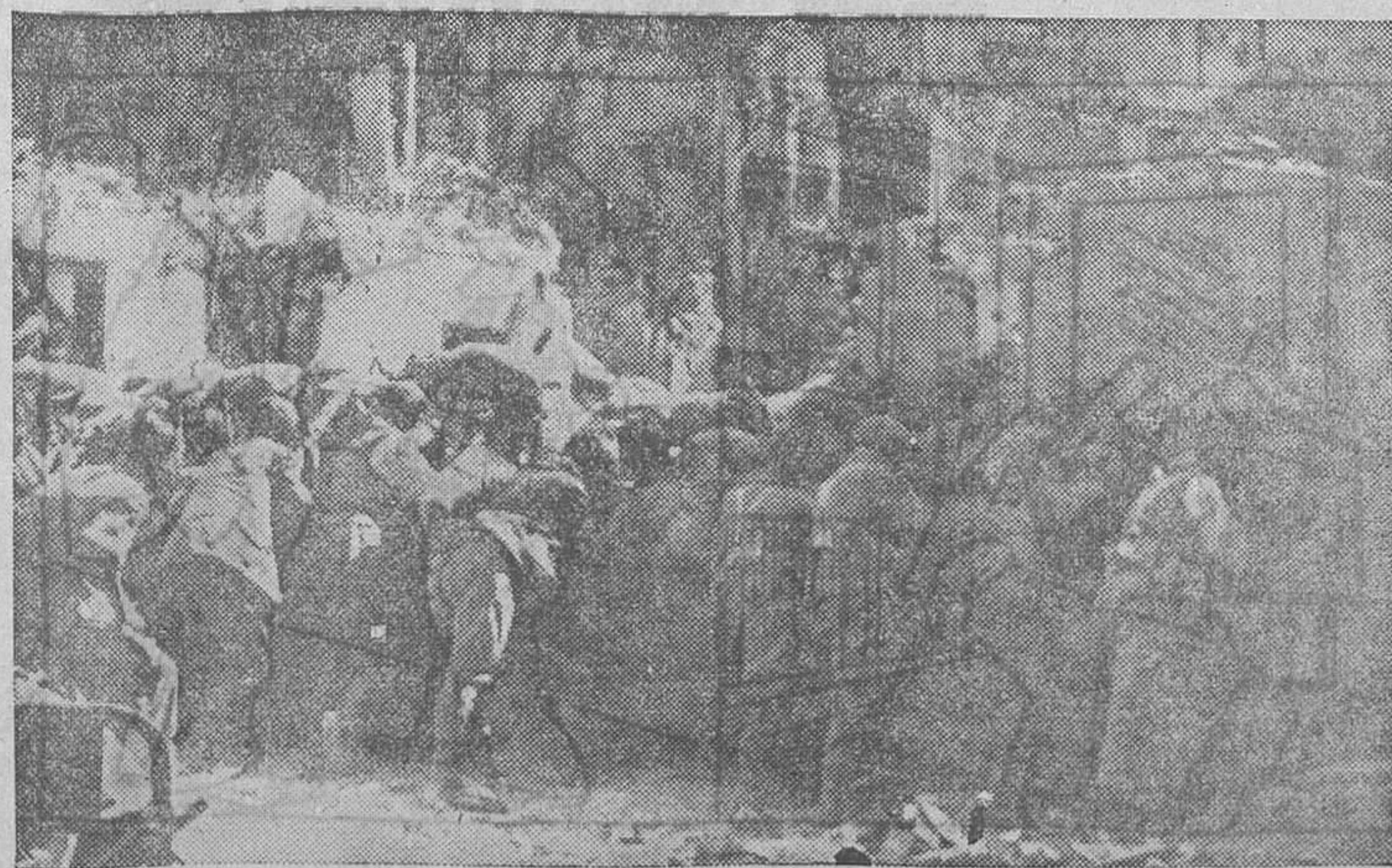
EN UNO DE LOS SECTORES DEL CENTRO.—Este parapeto, que antes sirviera para que los facciosos defendiesen las ruinas del pueblo, es utilizado ahora por las tropas de la República en su avance para expulsar a los rebeldes de sus últimas posiciones