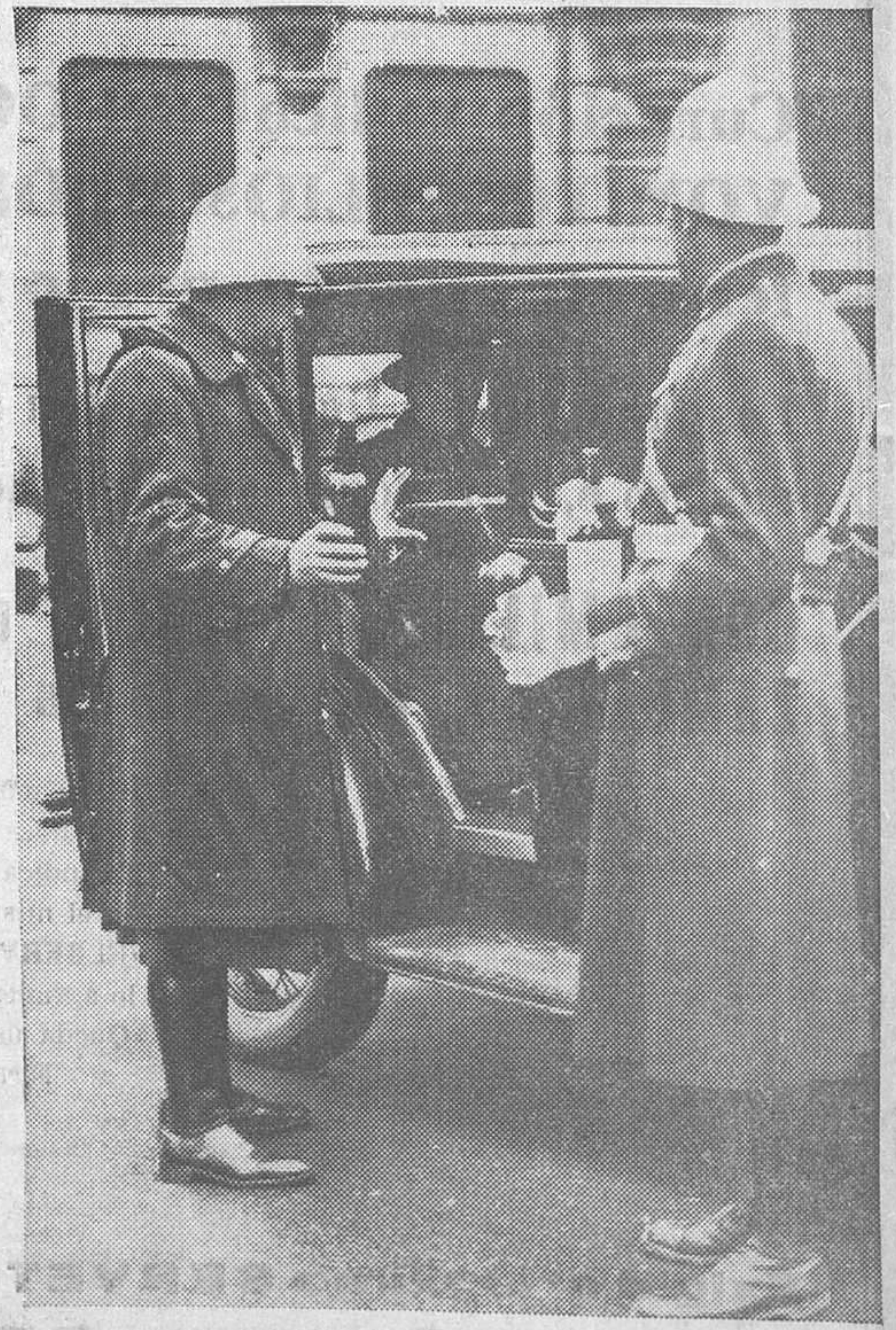
EL AGUINALDO A LOS GUARDIAS DE LA CIRCULACION.— Con motivo de las fiestas de Navidad, y siguiendo la costumbre iniciada el año anterior, ayer comenzaron algunos automovilistas a obsequiar a los agentes del tráfico, que durante todo el año sufren en la calle las inclemencias del tiempo

Todos tenemos derecho a un buen vivir. Está bien que en la noche tradicional, el «policeman» neoyorquino o londinense de la circulación trinche un ave y sienta en los labios el cosquilleo del champagne. Es justo que su vida densa de poste incommovible en medio del tráfico