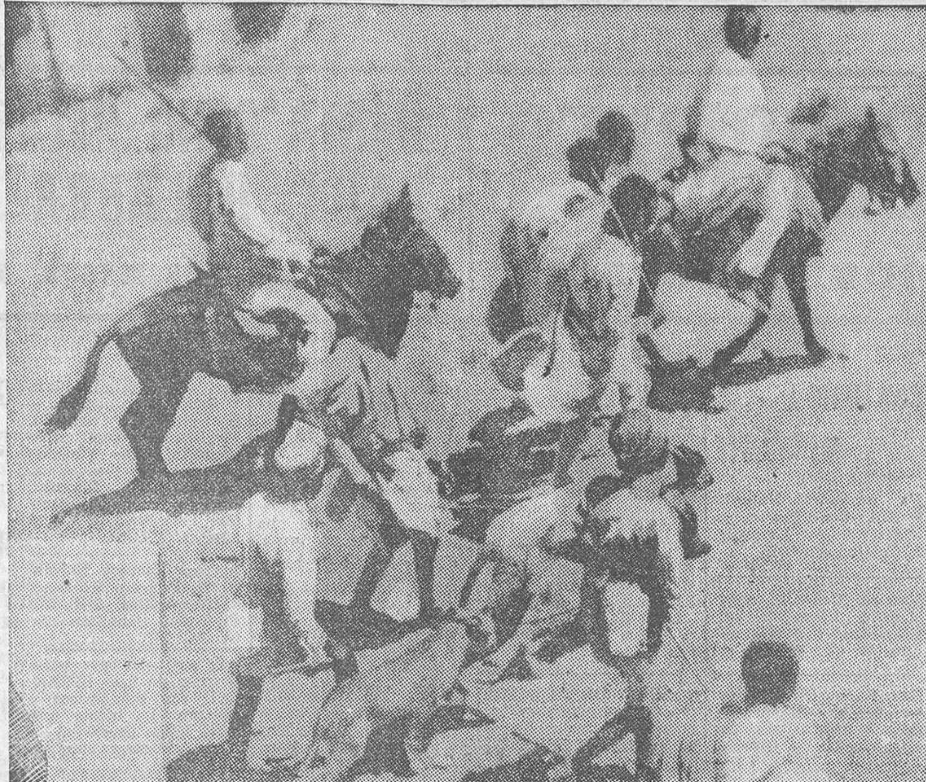
Soldados abisinios especializados en domesticar leones, a los cuales emplean como poderosos auxiliares en la guerra, sobre todo en terreno montañoso

Tres camiones cargados de material marcharon, uno para el frente del Norte y los otros dos para el Sur.