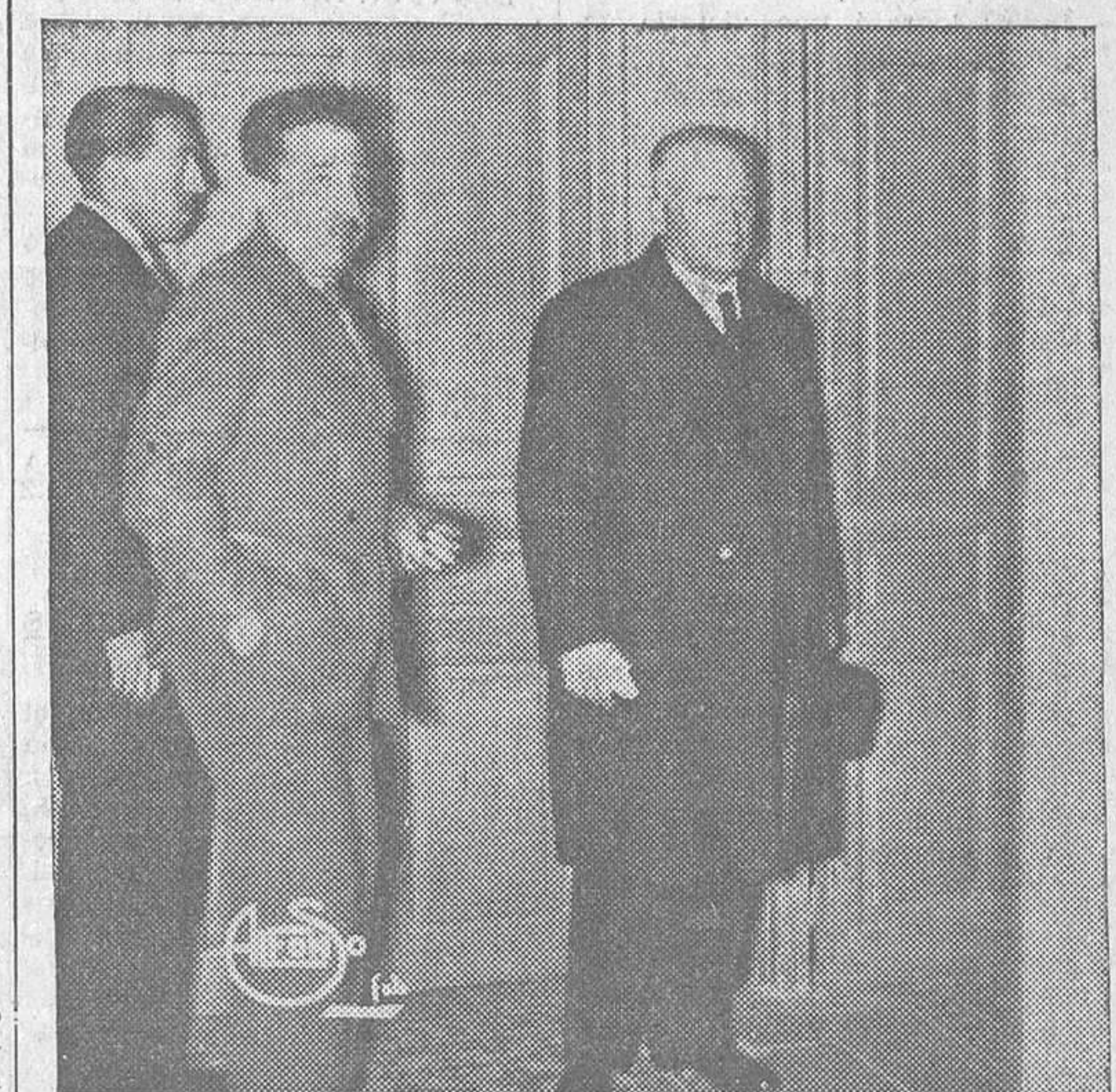
... entra de nuevo en su celda de la Cárcel Modelo.