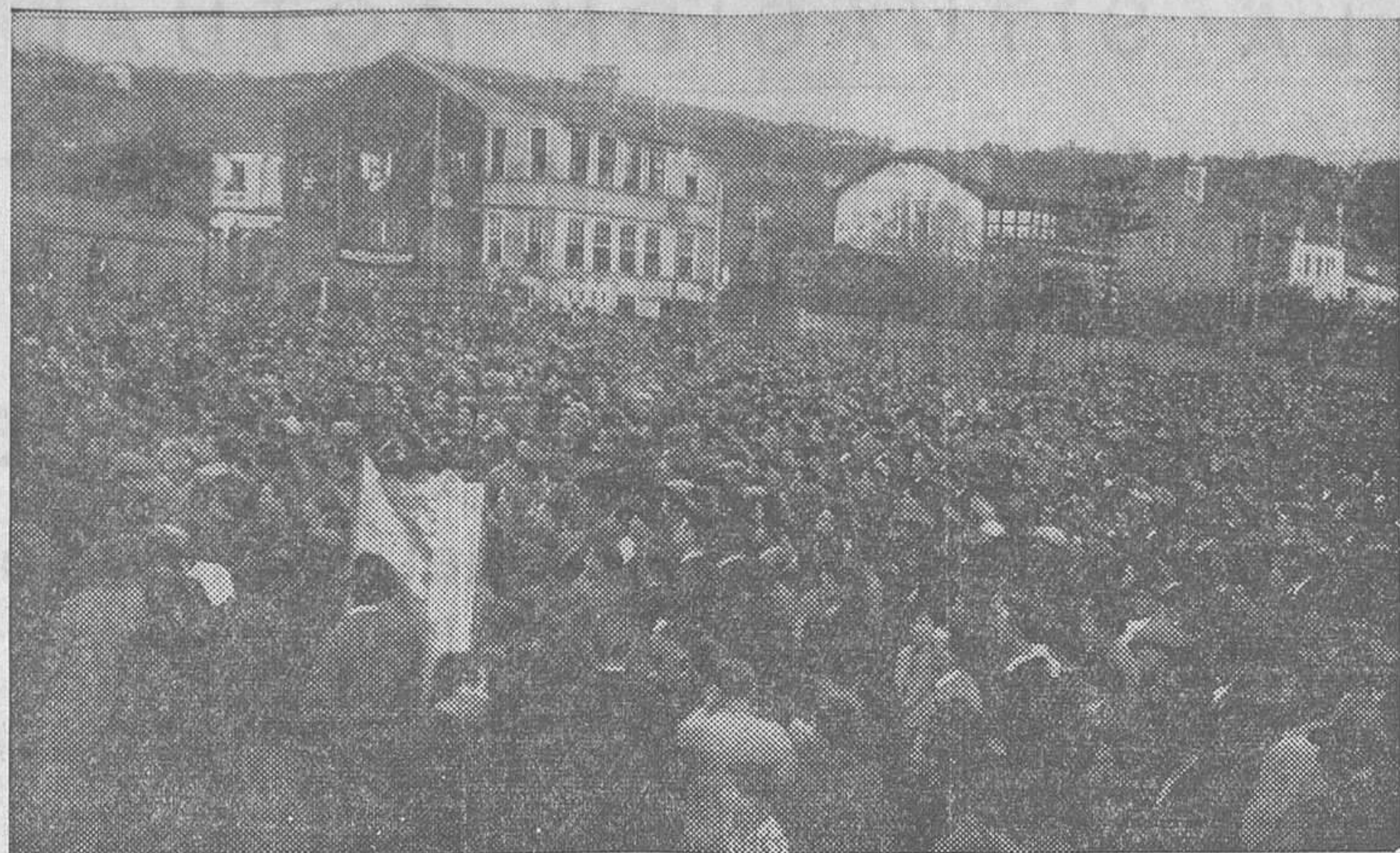
En el campo de Barreiro (Pontevedra) se celebró el pasado domingo un mitin antifascista, al que asistió enorme concurrencia y en el que se pronunciaron discursos a favor del frente único.—Un aspecto del campo durante la celebración del acto

Ayer, a las seis menos diez de la tarde, ingresó en la Cárcel Modelo el ex ministro socialista don Francisco Largo Caballero. Llegó a la Prisión Celular en un coche de la Dirección general de Seguridad, acompañado por el ex ministro D. Domingo Barnés y el comisario de la Brigada Social, señor Sánchez Gracia. El vehículo se detuvo ante el primer rastrillo. Descendió el señor Largo Caballero, que vestía de luto riguroso; se despidió de los acompañantes, y después de cumplidas las formalidades de rigor ingresó nuevamente en la prisión.