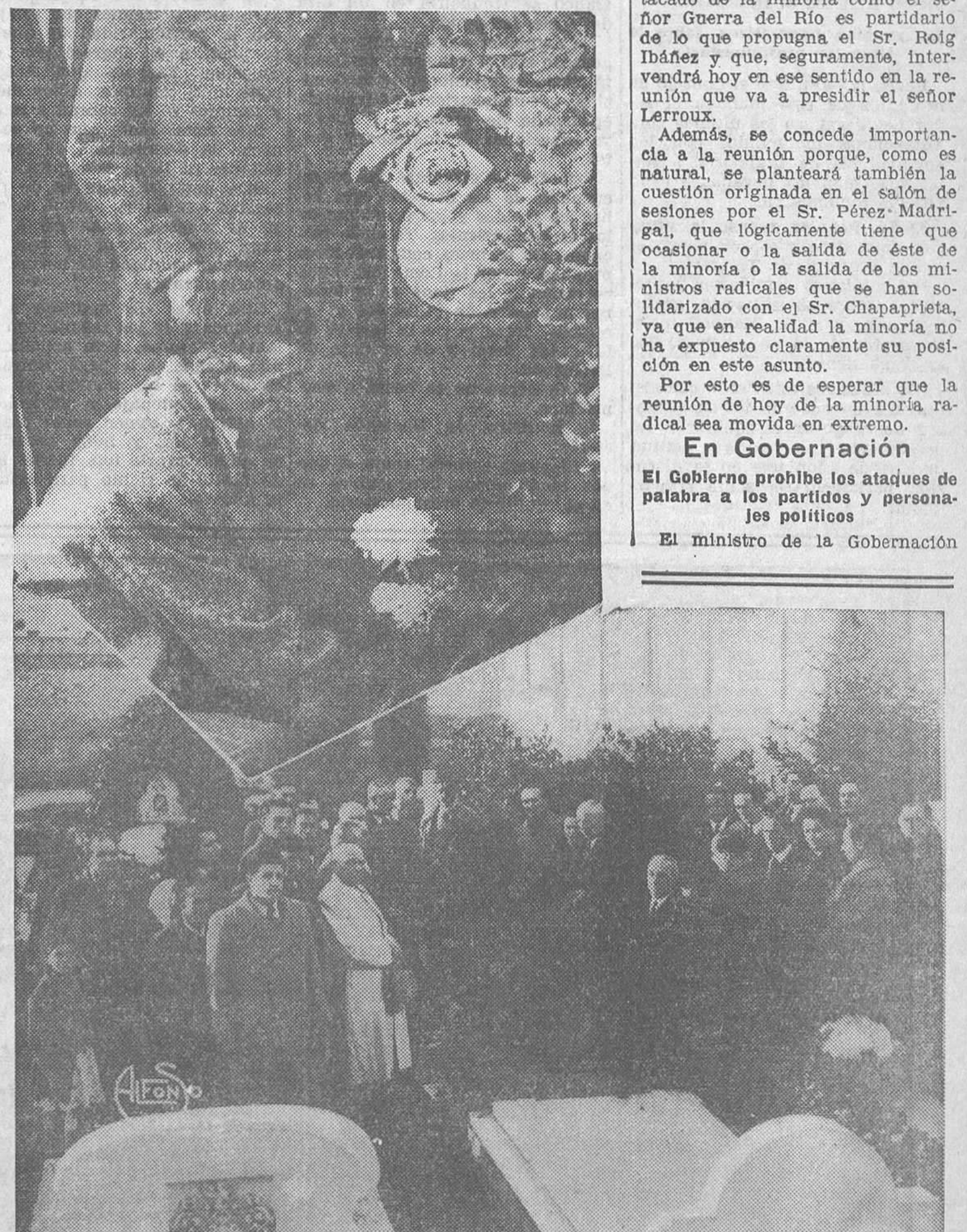
AYER EN EL CEMENTERIO CIVIL.—Con motivo del aniversario de la muerte de D. José Nakens, elementos republicanos le han rendido un sentido homenaje. He aquí dos instantáneas obtenidas ante la tumba de Nakens, en la tarde de ayer