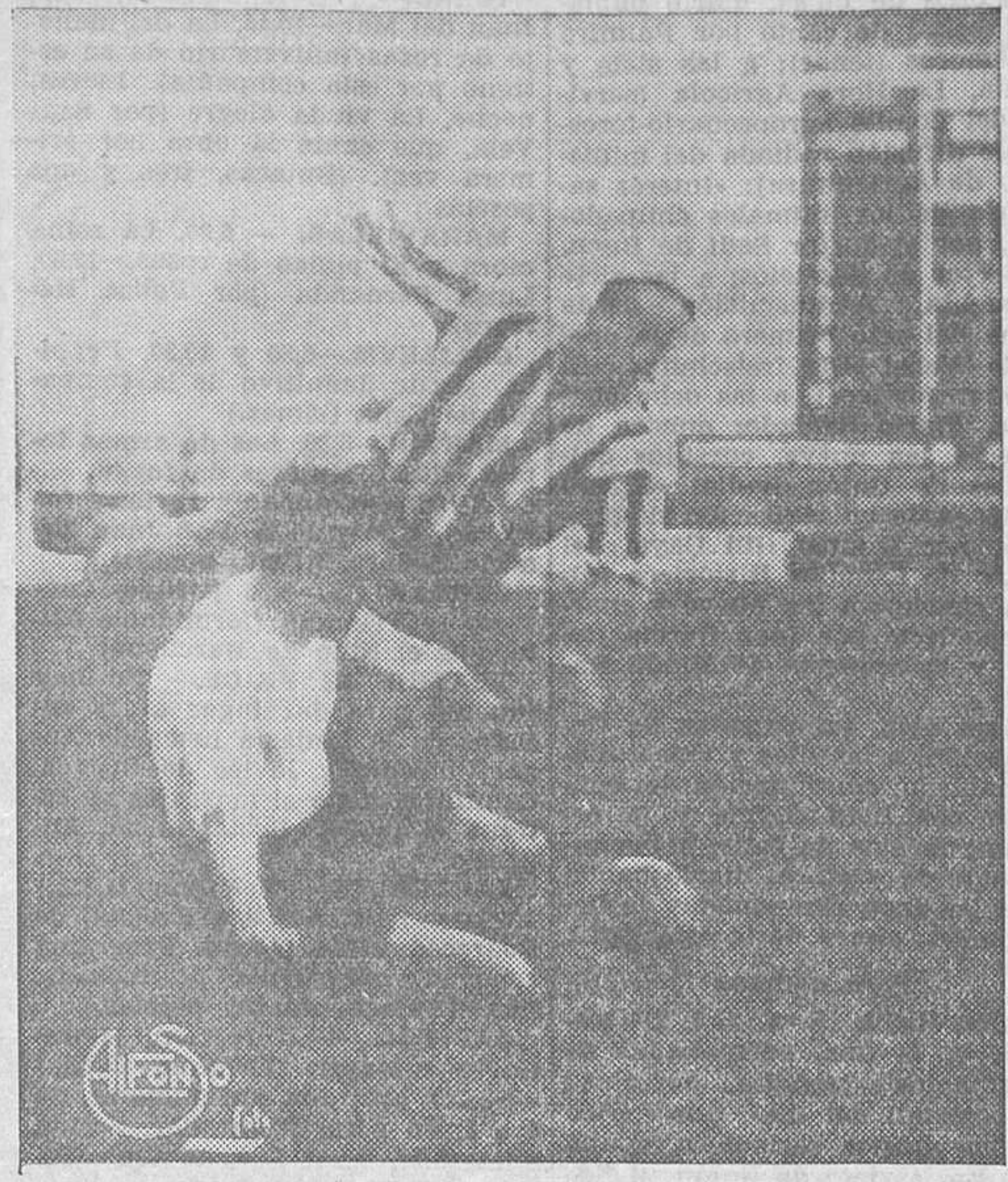
LOS PARTIDOS DEL DOMINGO.—Un momento del encuentro Athlético-Racing

En esta prueba podrán participar corredores federados y no federados, como igualmente equipos militares, institutos armados, etcétera, siempre que sean inscritos por sus respectivas Sociedades o regimientos. También podrán participar corredores independientes.