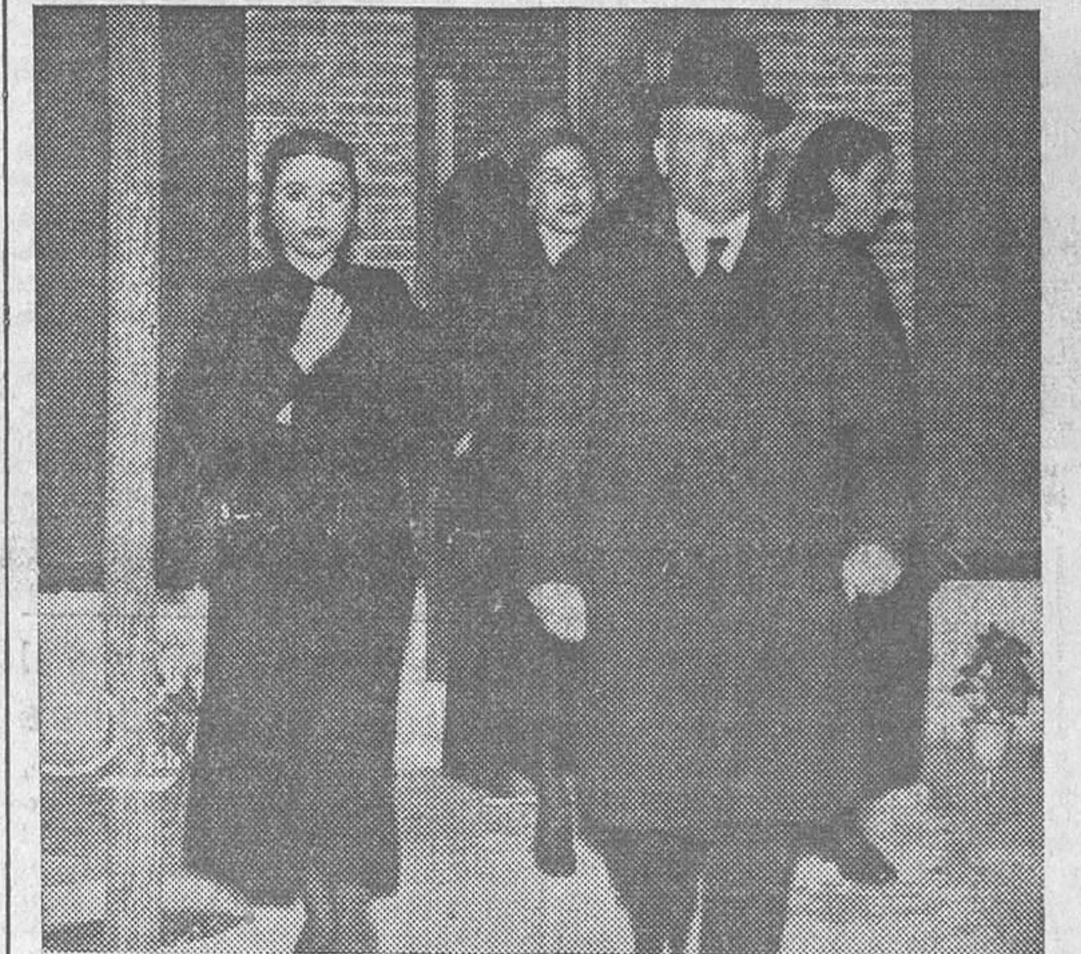
... se dispone a acompañarle a la Cárcel Modelo. El señor Largo Caballero sale de su casa, dejando en ella a sus hijas, y...