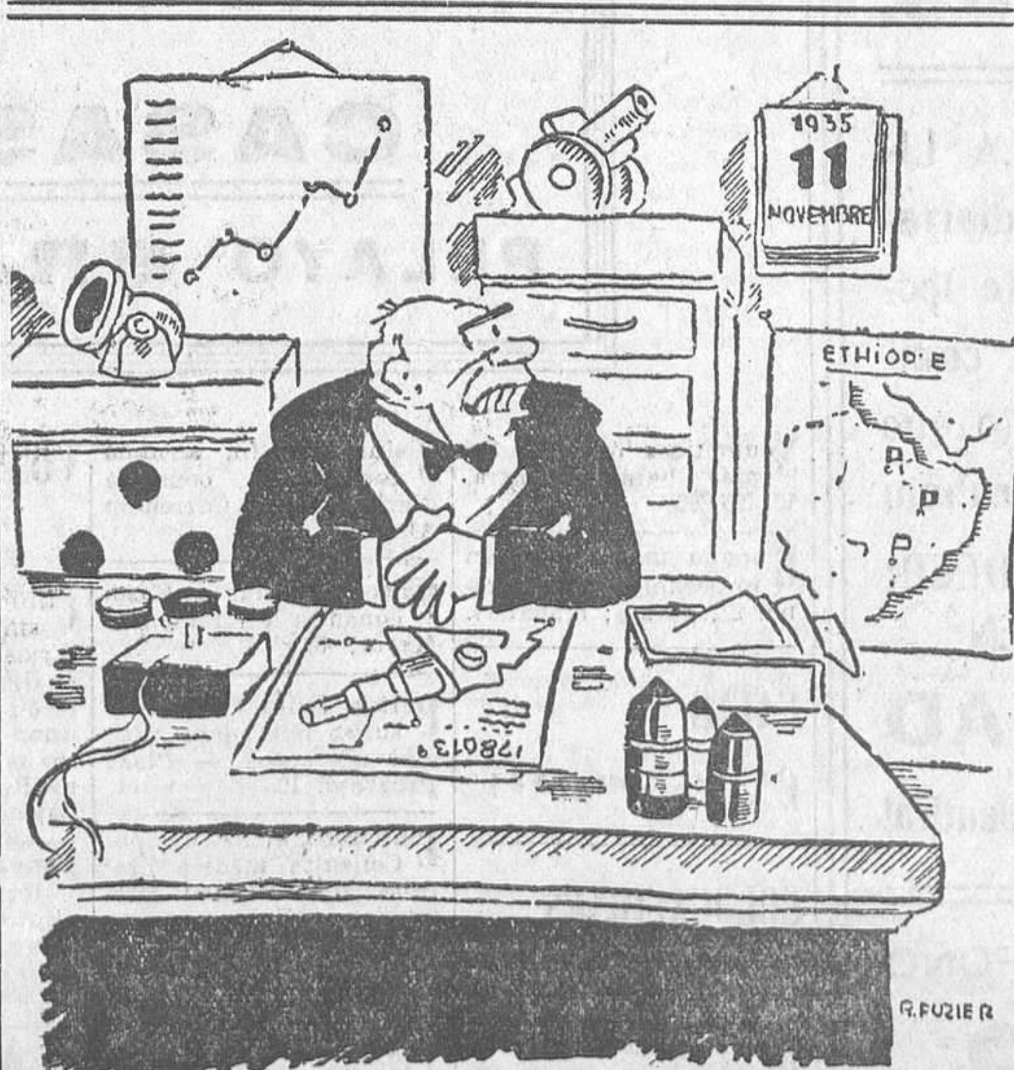
«Diecisiete años de crisis... ¿A dónde llegaríamos, si no fuese por el fascismo?» (De «Le Populaire».)

En los círculos franceses causaría satisfacción el que dentro de un mes se llegara a un acuer-