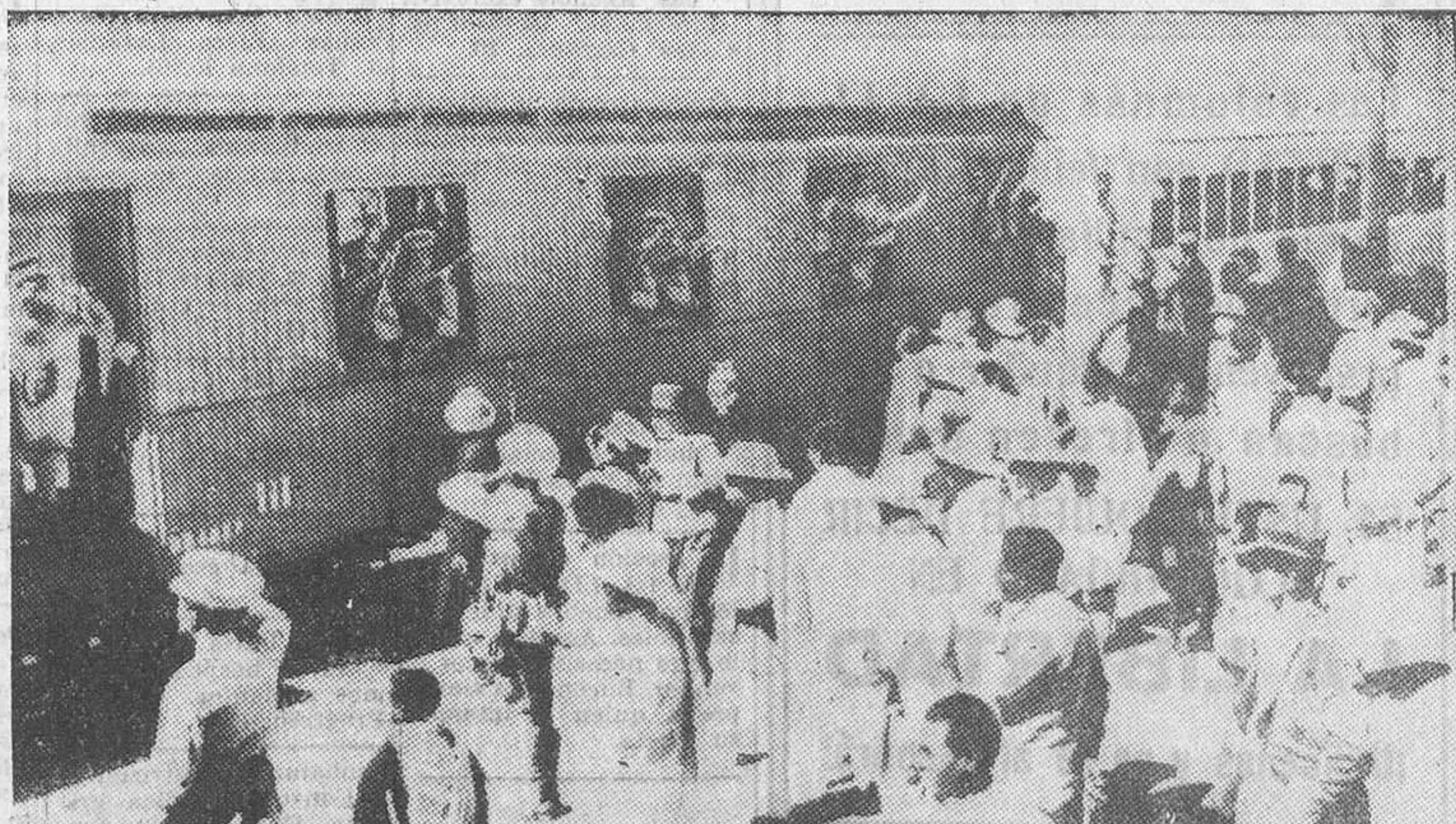
Representantes y funcionarios consulares italianos han cruzado extensos territorios abisinios, sometidos a una guerra cruel por el afán imperialista de un régimen nefasto, y los «salvajes» que el «duce» quiere civilizar prestan guardia de honor y salvaguardan las vidas de aquellos que representan el espíritu de un hombre que en estos momentos cierra sobre el Mediterráneo la sombra negra de su locura. En esta fotografía aparecen los diplomáticos del «duce» en el tren que ha de llevarlos a la frontera

«El avance comenzó a las seis de la mañana en el frente del Tigré. El cuerpo indigena llegó a la zona de Hausien a la una de la tarde».