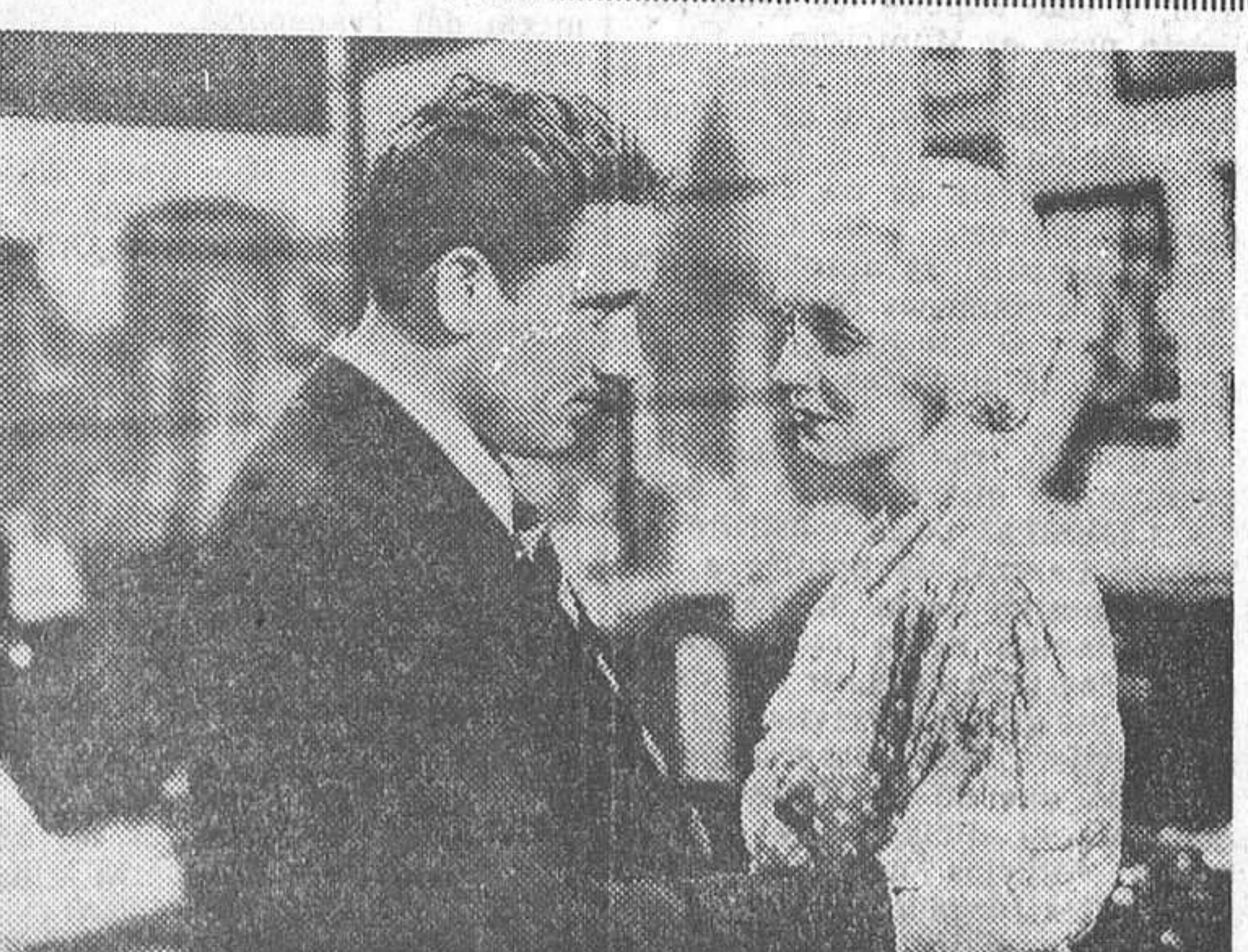
Spencer Tracy y Virginia Bruce en el film policíaco «La voz que acusa», que el próximo lunes se estrenará en el Figaro