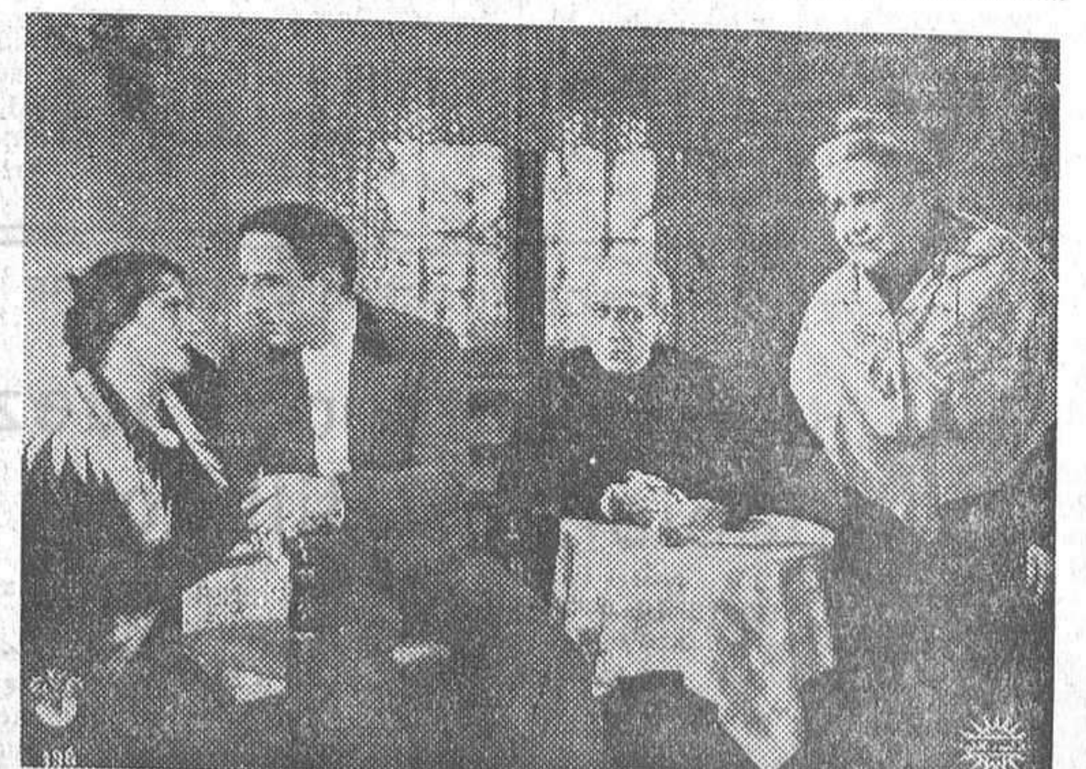
Una escena del film nacional E. O. E. «Currito de la Cruz», que el próximo lunes se proyectará en el Salamanca