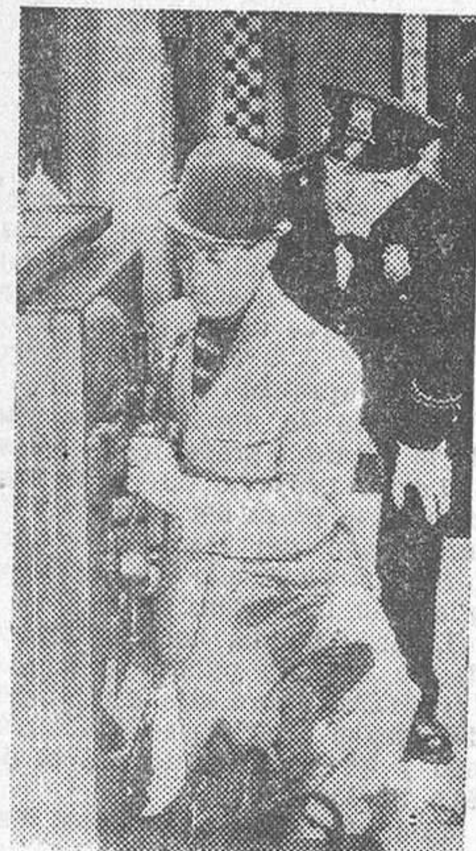
Una graciosa escena de «Los ases de la mala pata», film Metro-Goldwyn-Mayer, de Stan Laurel y Oliver Hardy, que desde el próximo lunes se proyectará en el San Miguel

Se ha publicado el número 22 de esta importante revista cine-