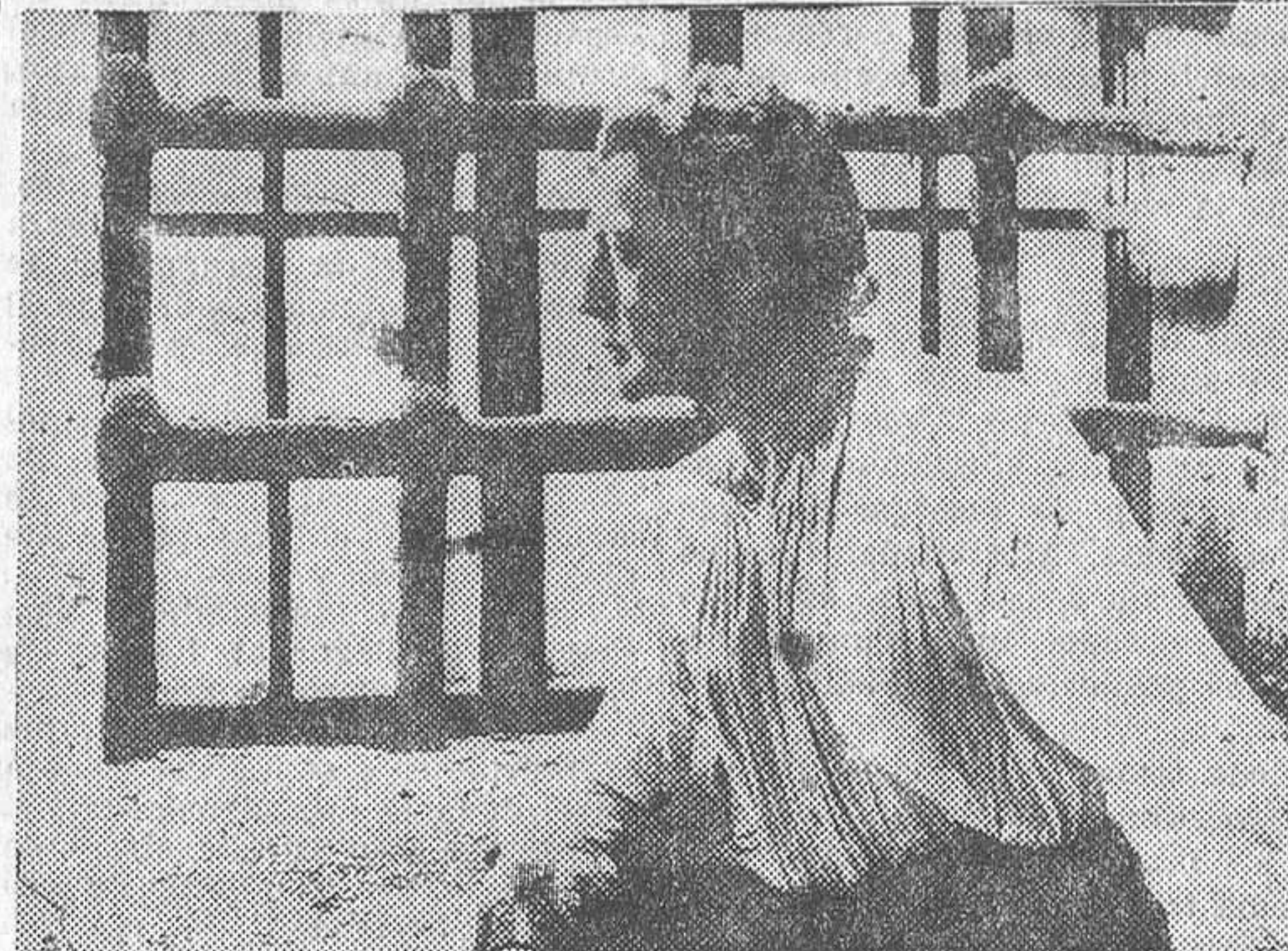
Clive Brook, intérprete de «El consejero del rey», film Selecciones Capitolio que el próximo lunes se estrenará en el Palacio de la Música