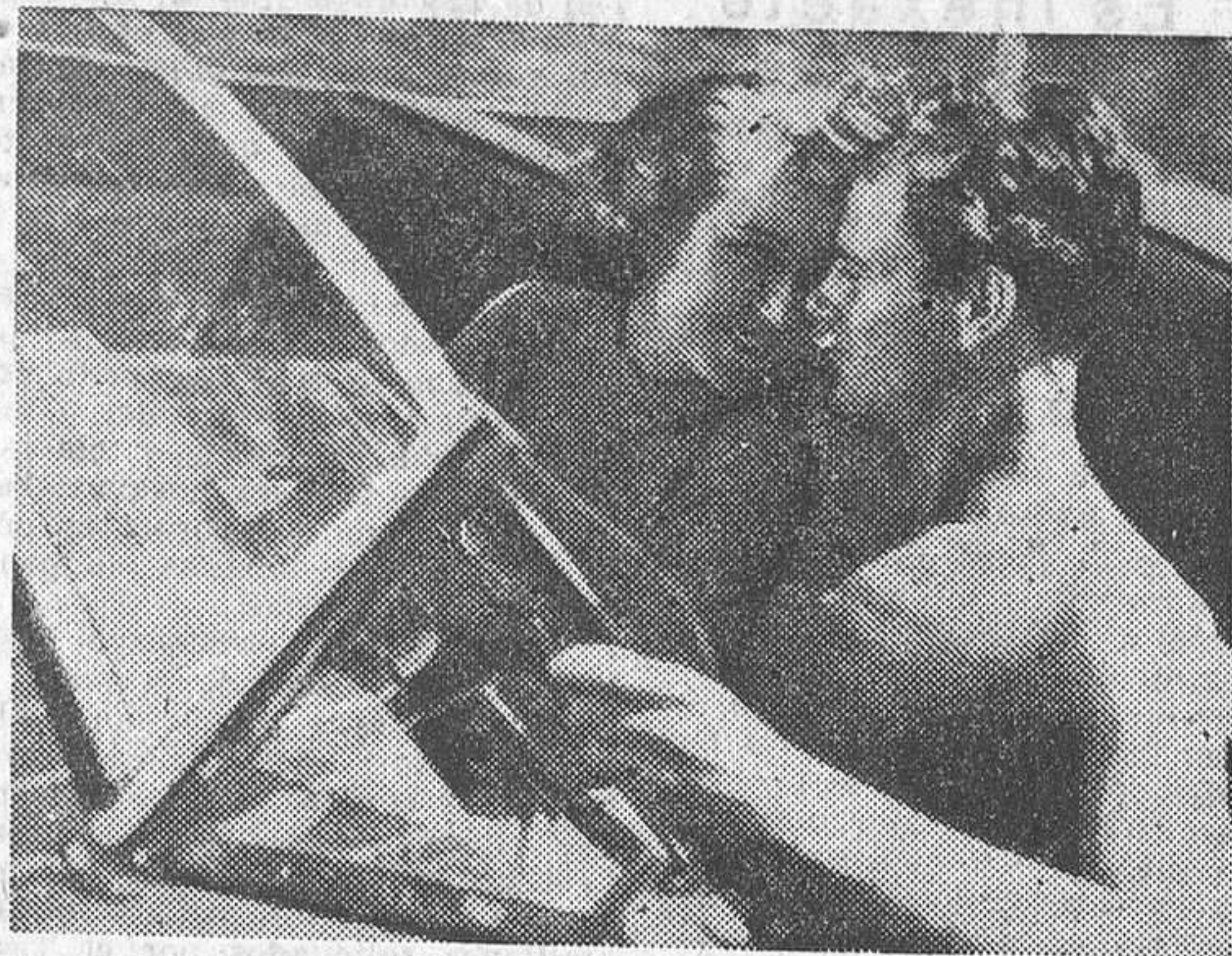
Una escena de «La Venus de oro», film Radio que el próximo lunes se estrenará en el Avenida

«La Venus de oro» es una preciosa comedia realizada por Radio Films, de gran valor en su forma y en su fondo, en la que Miriam Hopkins, Fay Wray y Joel Mac Crea nos hacen, de manera admirable, la verdadera revelación de una página grande de una vida de mujer.