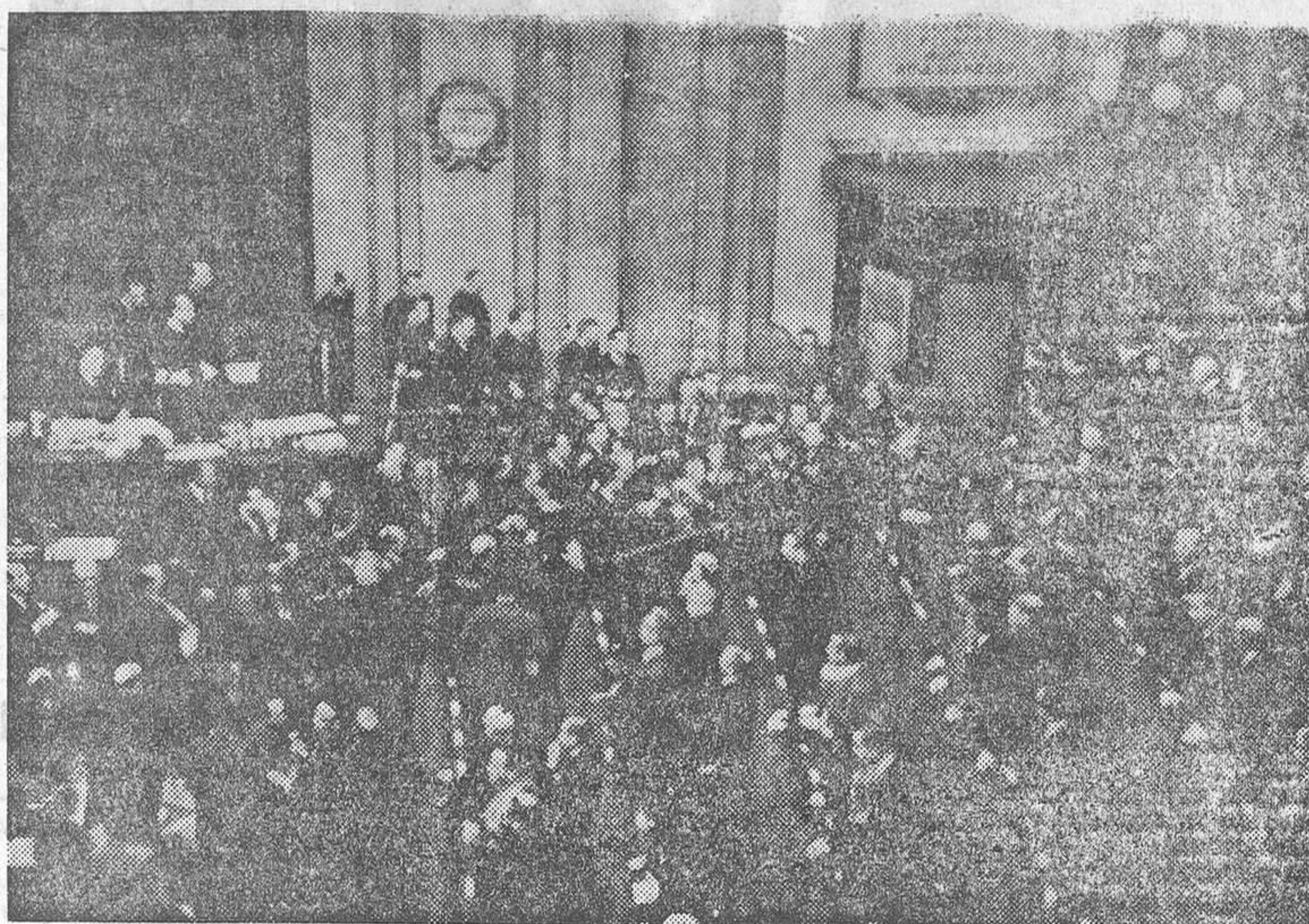
EL INCIDENTE DE AYER EN EL CONGRESO. - El solemne momento de las bofetadas.