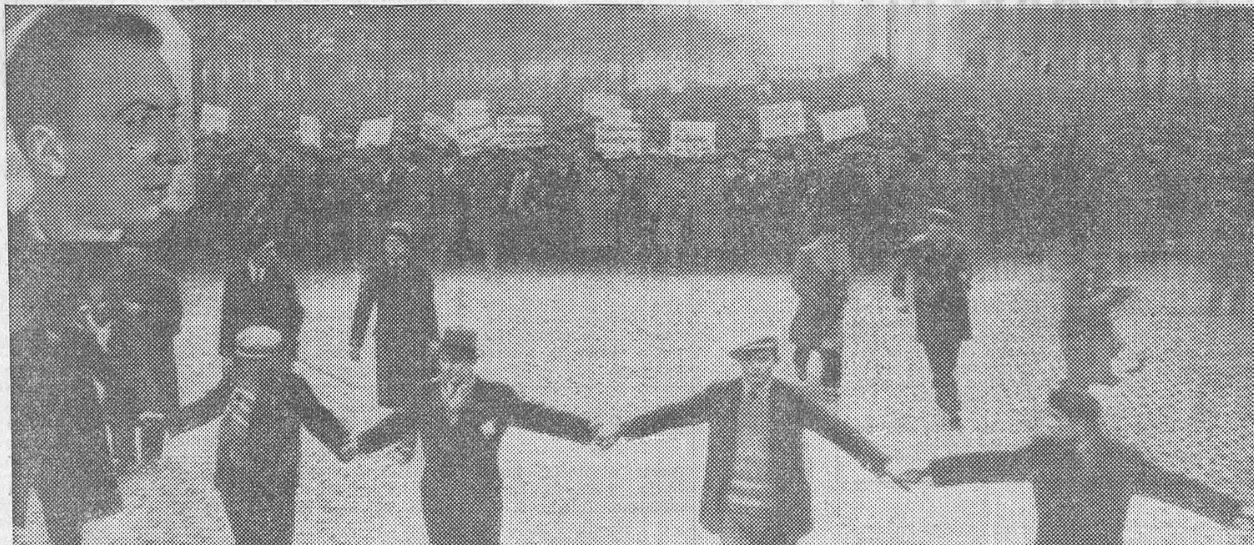
Gaston-Frank Bergery.—Manifestación en masa de las Asociaciones antifascistas

plean la palabra patria para lanzar a unos hombres contra otros en luchas espantosas, sembrando de luto, de sangre, y de lágrimas el Mundo, y dando rienda suelta a abominables codicias de oro y de poder.