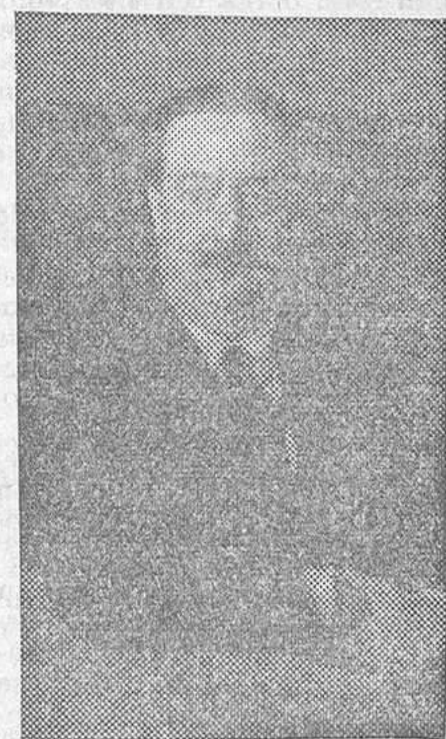
Don Manuel Luxán y Zabay, ilustre arquitecto que ayer dió una interesante conferencia en la inauguración del nuevo Museo de Tapices del Palacio de El Pardo

Al encargarse el Patrimonio de la República de la conservación y custodia de los palacios, creyó indispensable dar a conocer al público aquellas habitaciones que habían estado de hecho substraídas al conocimiento general, y una de las más importantes era