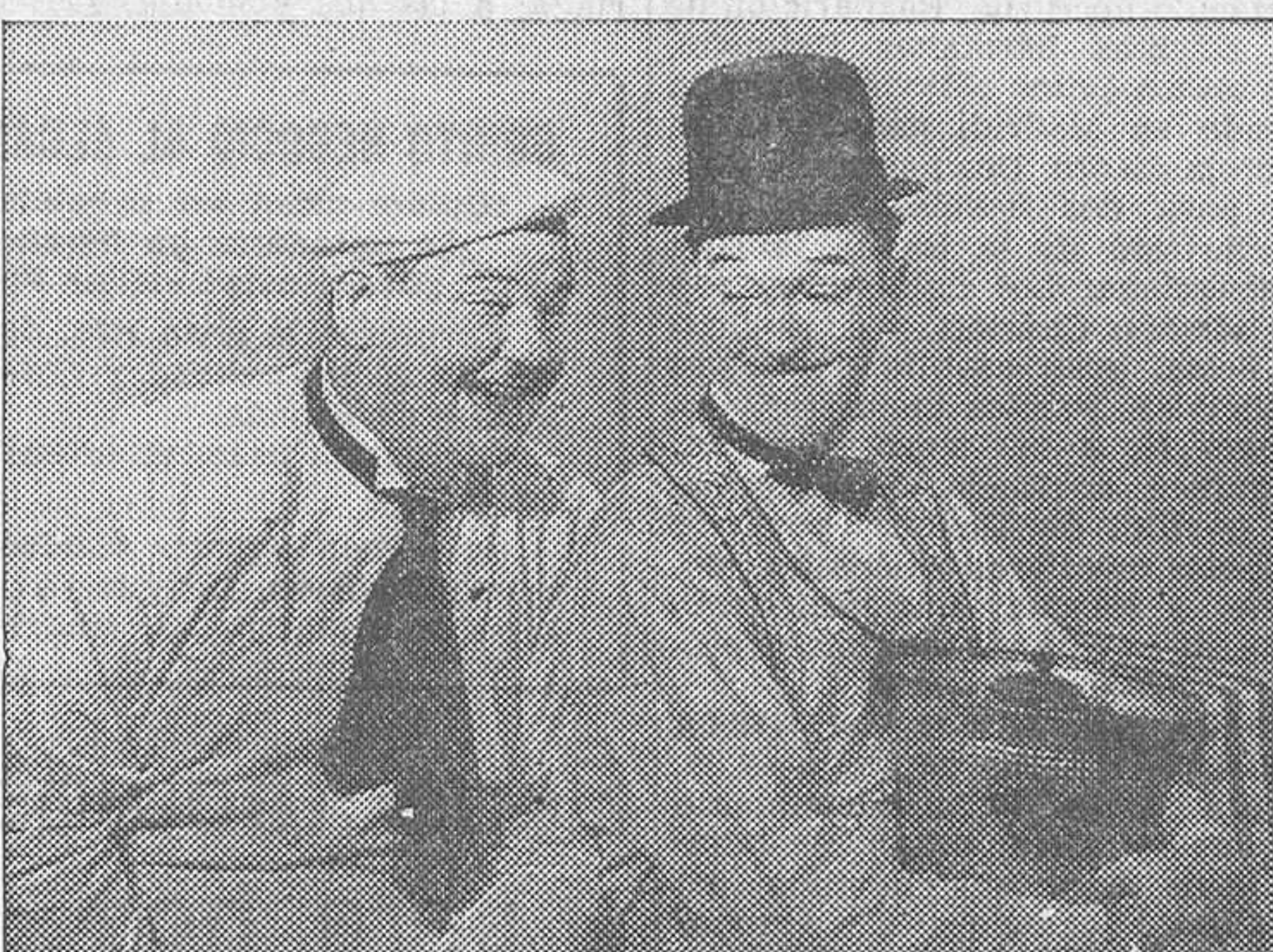
Los graciosísimos Stan Laurel y Oliver Hardy en «La estropeada vida de Oliverio VIII», film Metro-Goldwyn que se proyecta con gran éxito en Capitol

La obra elegida para su debut no podía ser otra que la maravillosa tragicomedia de Carlos Arniches, titulada «Es mi hombre», adaptada al cine por el propio