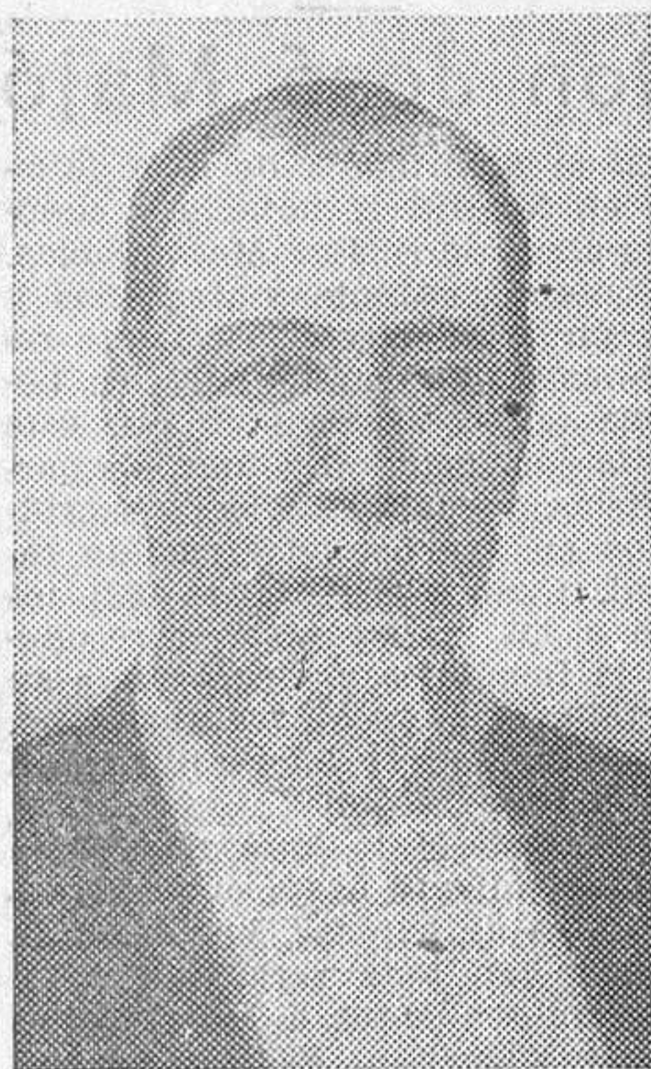
El general Justo Rufino Barrios

Guatemala celebra con gran animación y entusiasmo el 19 de Julio de este año el primer centenario del nacimiento de uno de sus hijos más ilustres y a la vez una de las figuras de más relieve en Hispanoamérica, Justo Rufino Barrios, apellidado par sus contemporáneos y por las generaciones posteriores «el reformador». Fué, en efecto, durante dieciséis años, hasta 1875 en que murió en el campo de batalla en los