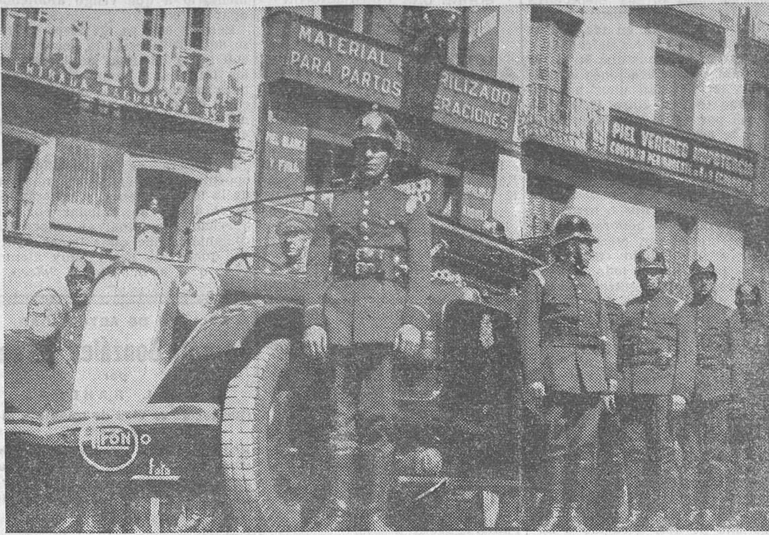
La guardia de honor del cadáver del bombero muerto en el incendio de la calle de Fuencarral

Mañana seguiremos hablando del PATRONATO DEL TEATRO ESPAÑOL