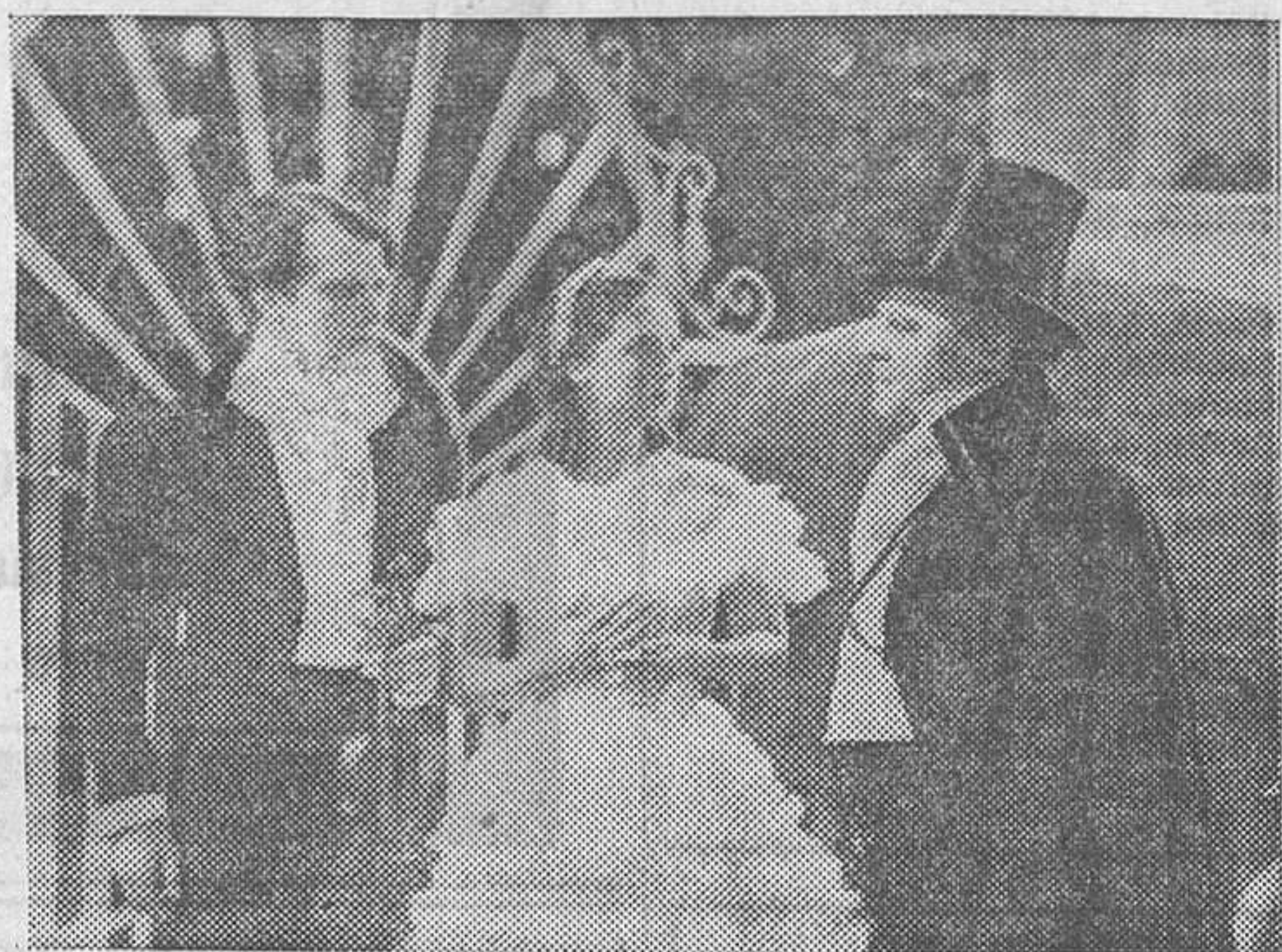
Esmond Knight, Jessie Matthews y Edmund Gwenn en «Valses de Viena», superproducción de la Gaumont British que el lunes se estrenará en el Palacio de la Música

En la interpretación figuran actores de la talla de Fay Compton y Edmund Gwenn. Pero, con todo, el mayor interés está en la reaparición de la sin par artista Jessie Matthews, cuya consagración definitiva espera el público madrileño.