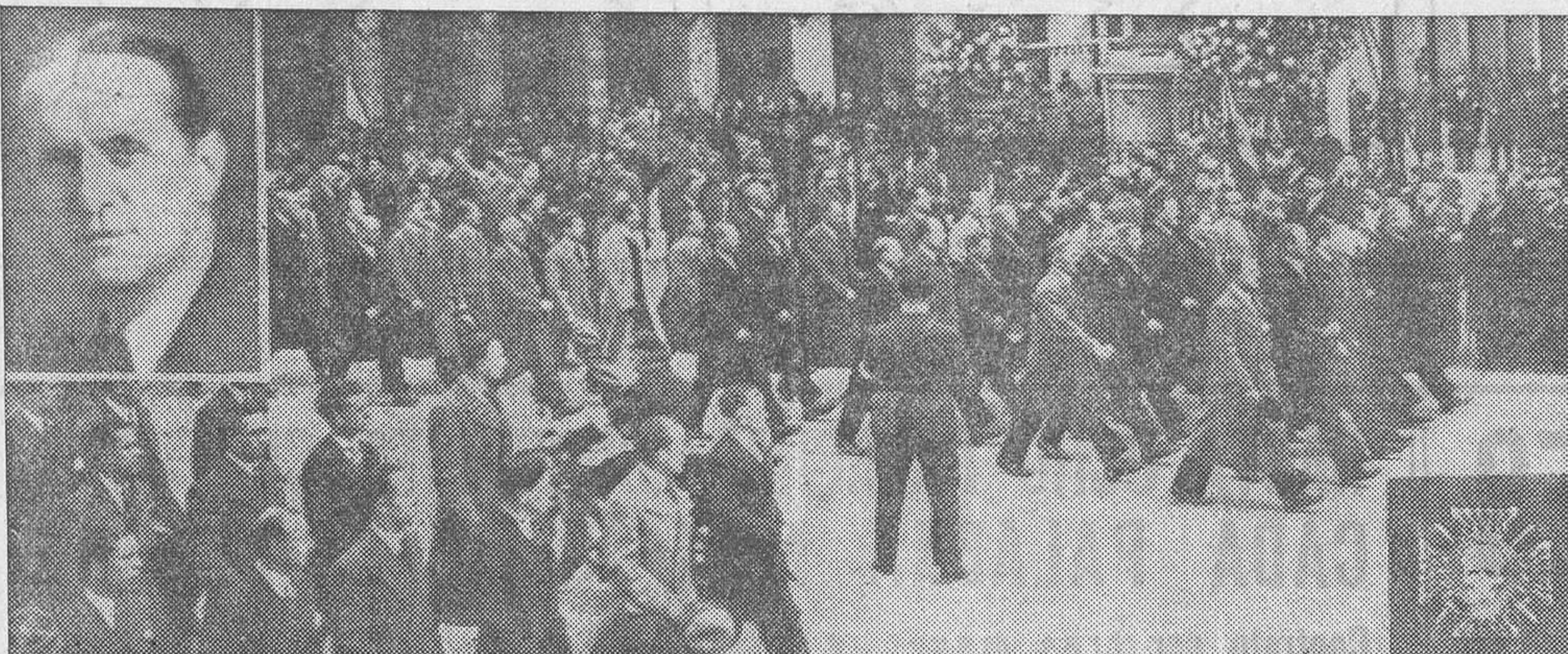
El coronel conde de La Roque.—Desfile de los Cruces de Fuego.—Insignia de los Cruces de Fuego

ciso, derribar las nuevas Bastillas que quieren alzar los enemigos de siempre.