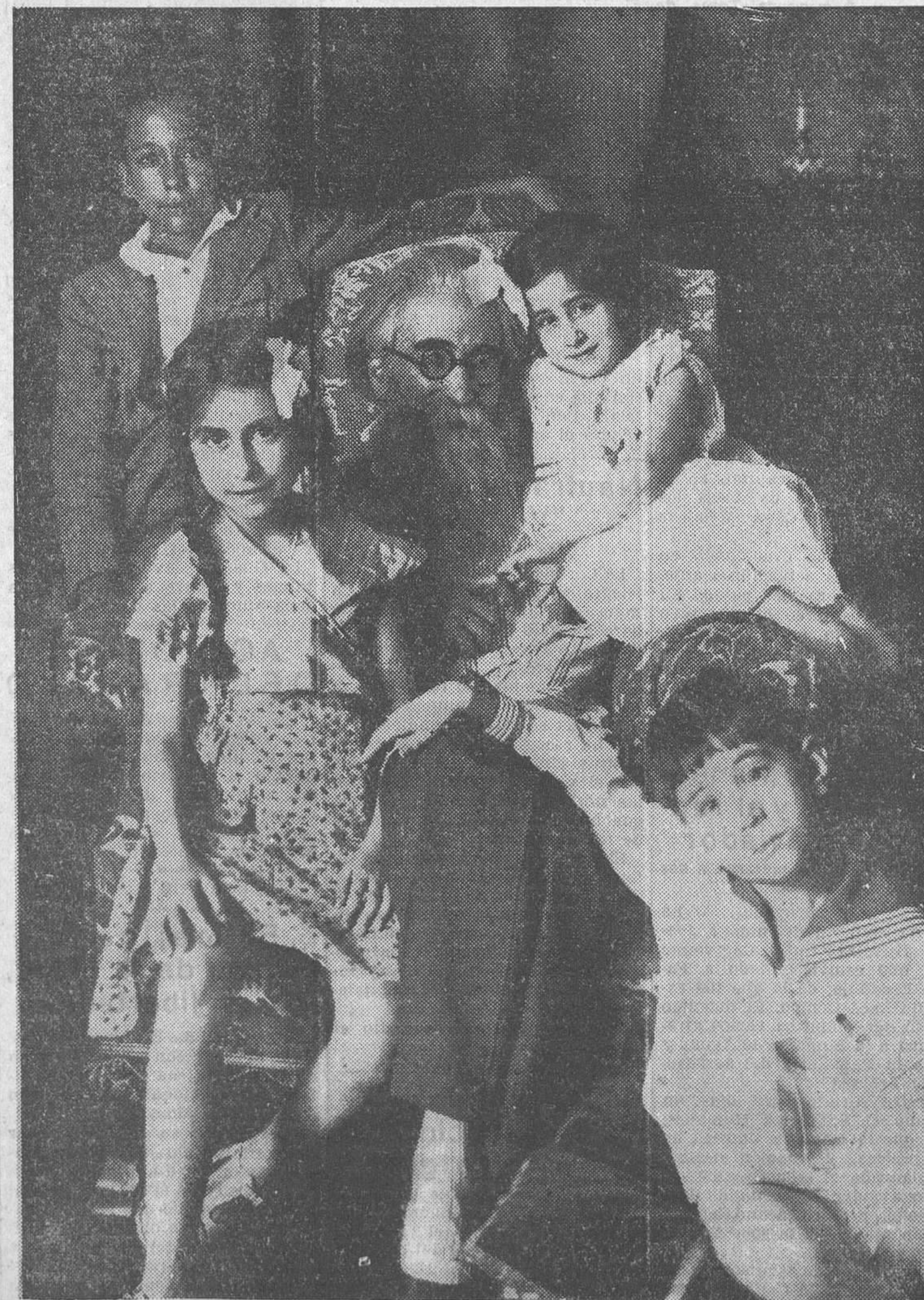
Valle-Inclán, en la intimidad de su hogar, acompañado de sus hijos