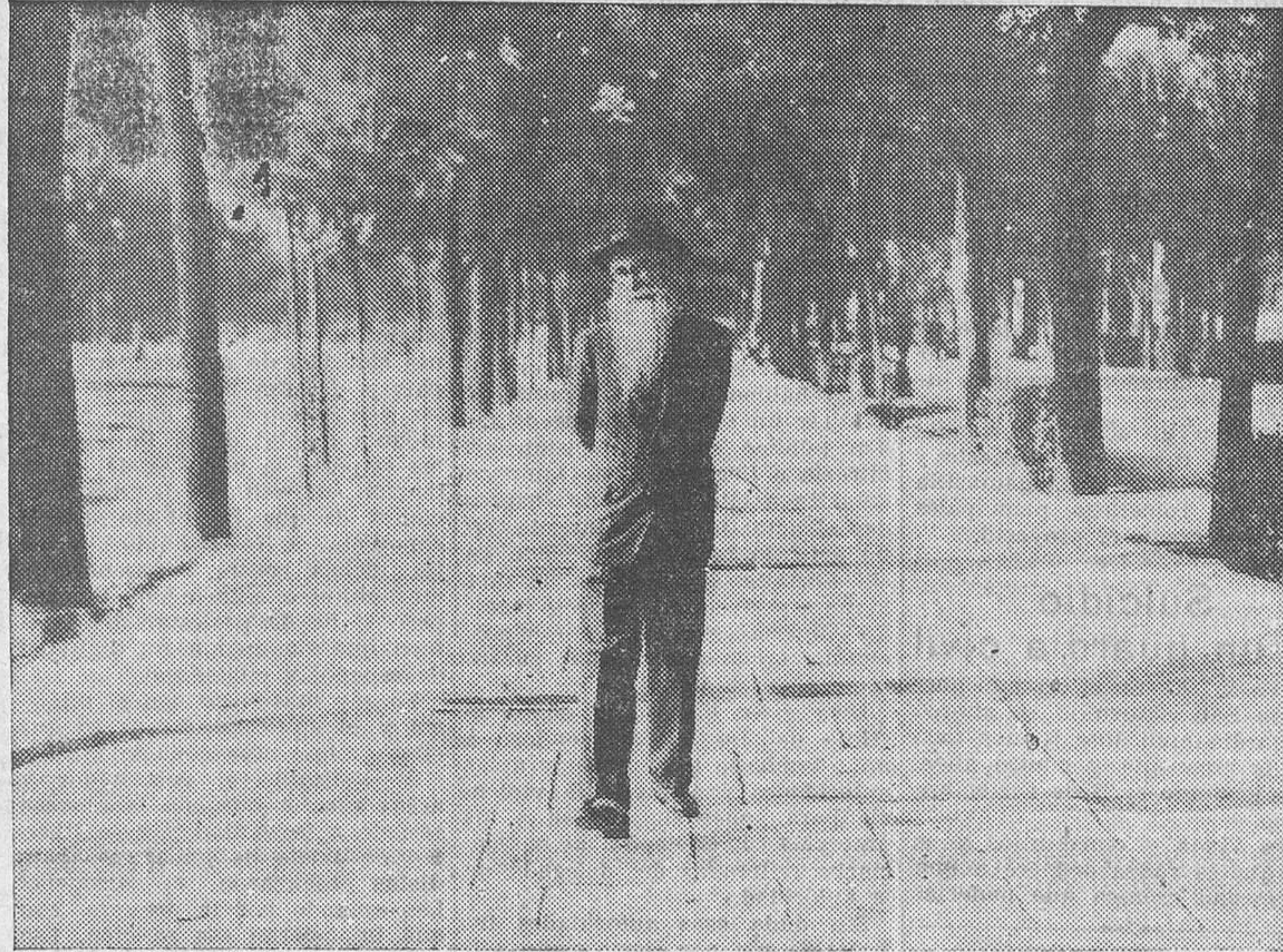
Valle-Inclán en uno de sus acostumbrados paseos, a pie, por el paseo de la Castellana