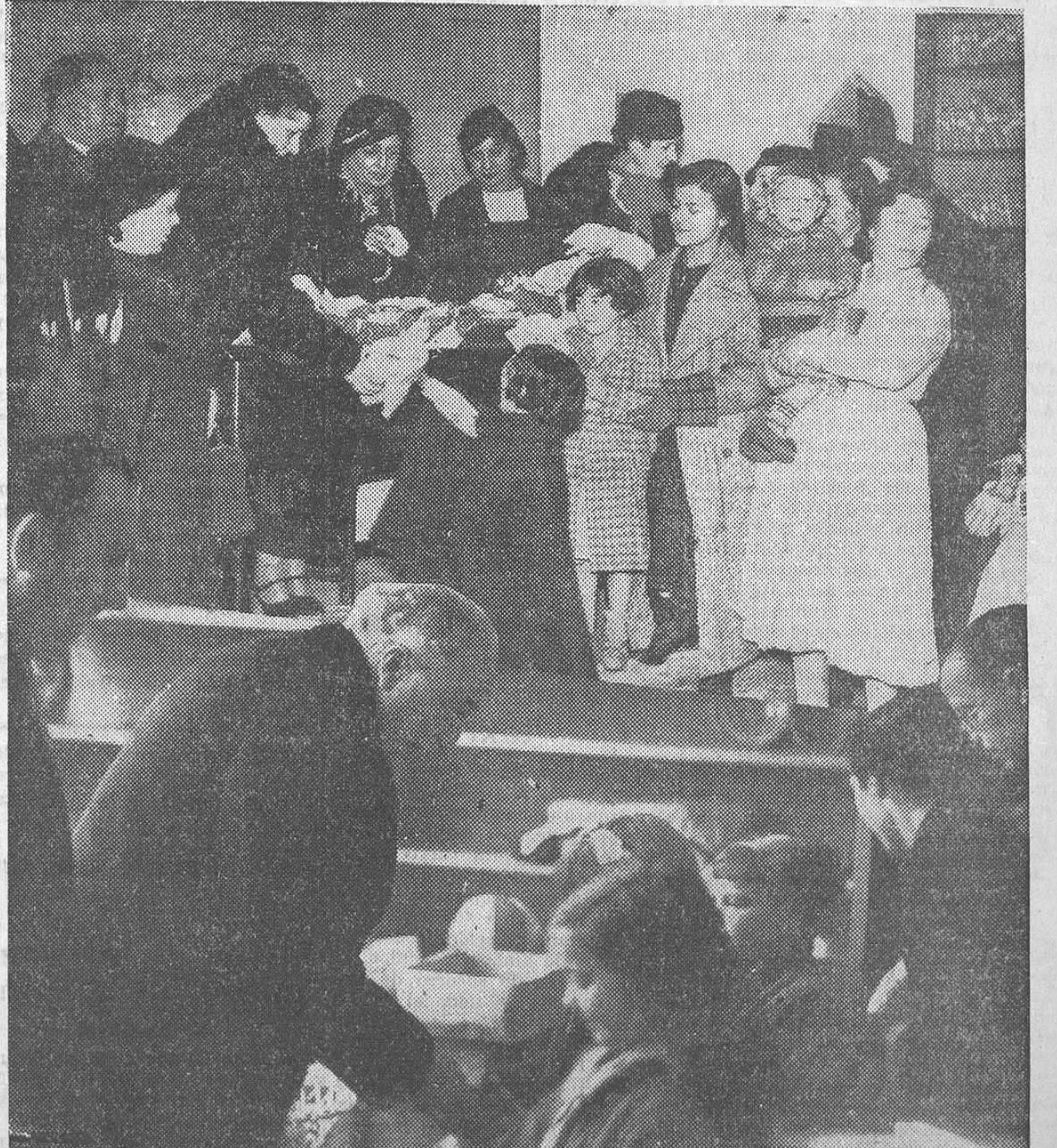
LA FESTIVIDAD DE REYES.—Arriba, las mujeres republicanas de izquierda repartiendo ropitas entre los hijos de las reclusas de la Cárcel de Mujeres.—Abajo, su excelencia el presidente de la República entregando juguetes a los niños del grupo escolar Giner de los Ríos