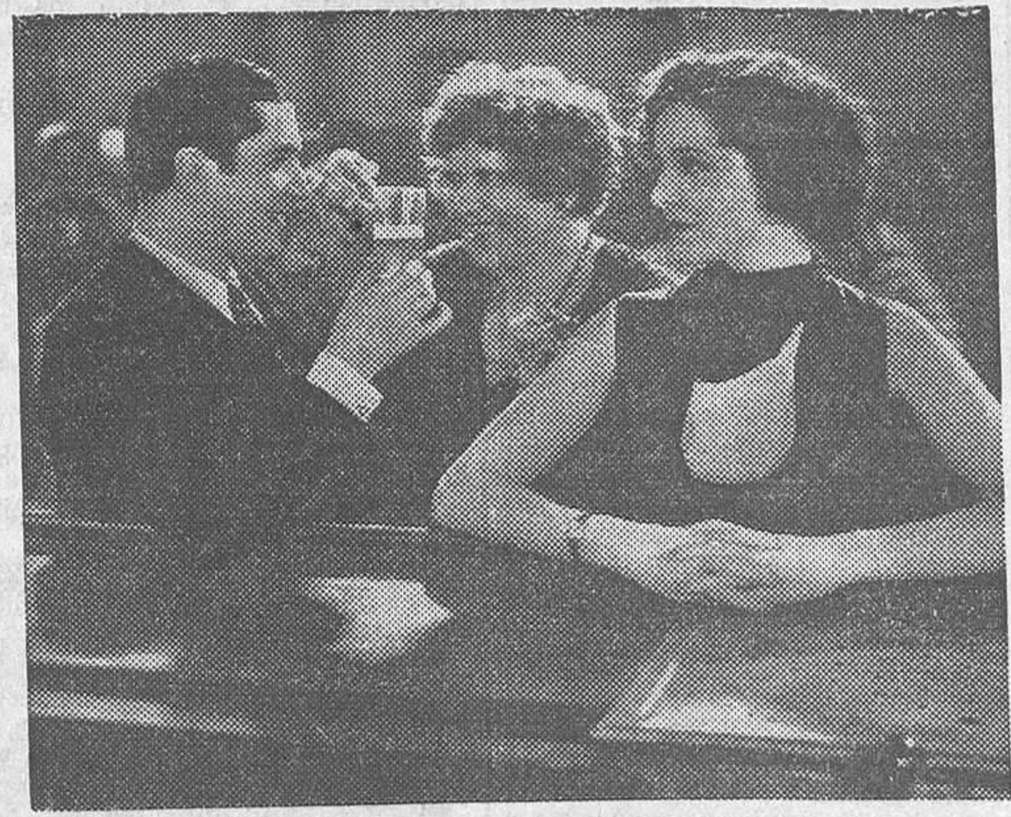
Carlos Gardel y Mona Maris en «Cuesta abajo», film Paramount que el lunes se estrenará en Rialto.

«Un premio en metálico a quien facilite una captura peligrosa.» La que nos ocupa sucedió hace doscientos años, en Junio de 1734. El premio consistía en 400 guineas de oro, y era ofrecido por Jorge II, rey de Inglaterra, para estimular la persecución y captura de Dick Turpin, el extraño bandolero que sembraba la inquietud en los campos y caminos de las Islas Británicas. El legendario personaje ha pasado después a la literatura universal y es hoy familiar a la juventud de todos los países. No podía faltar en el cine sonoro una reconstrucción de su leyenda, y la han acometido los ingleses con el acierto y la escrupulosidad a que nos tienen acostumbrados. Basta decir que es la Gaumont British la editora de la película