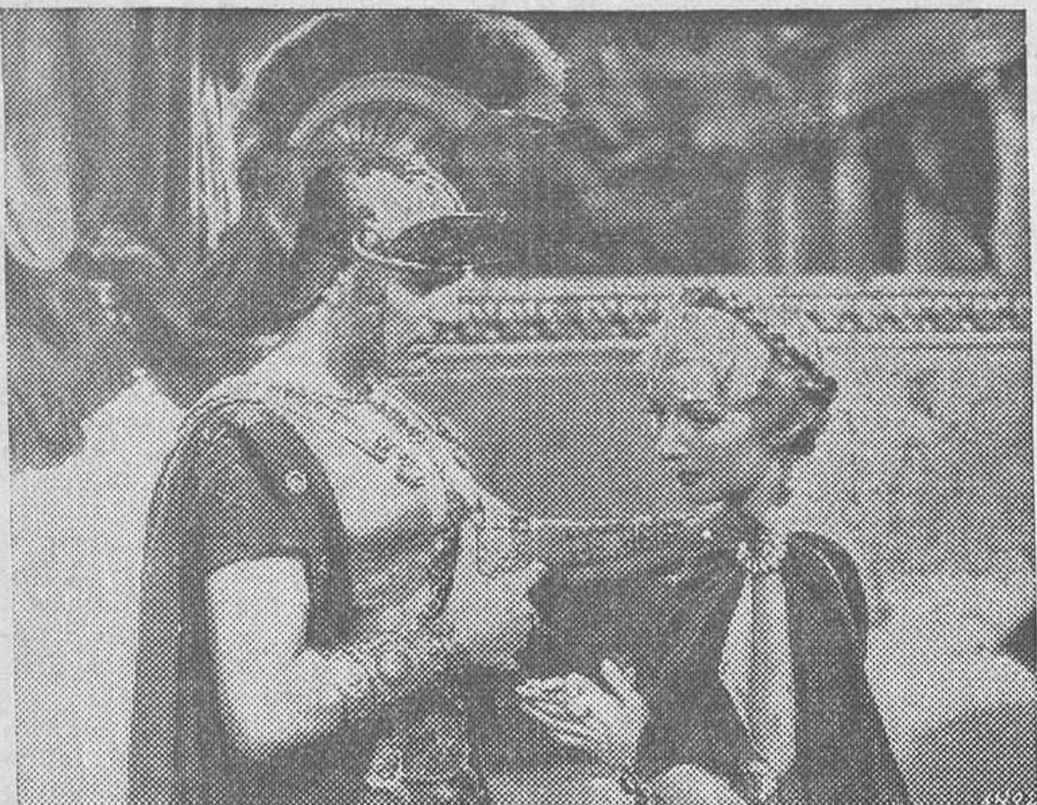
Warren William en una escena de «Cleopatra», film Paramount que el lunes se estrenará en el cine del Callao