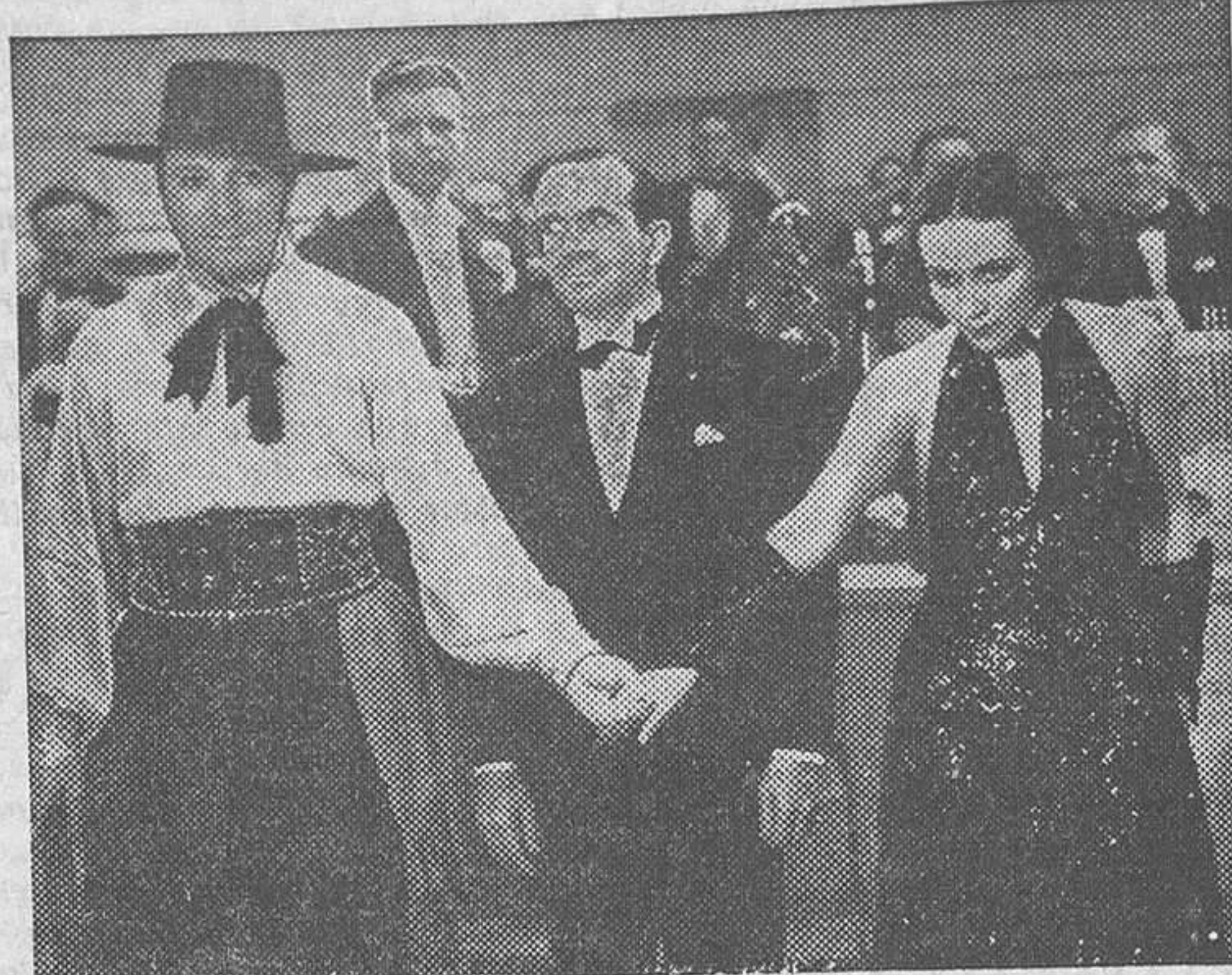
Dolores del Río, Al Jolson y Ricardo Cortez en «Wonder Bar», film Warner Bros que se estrenará próximamente en Capitol