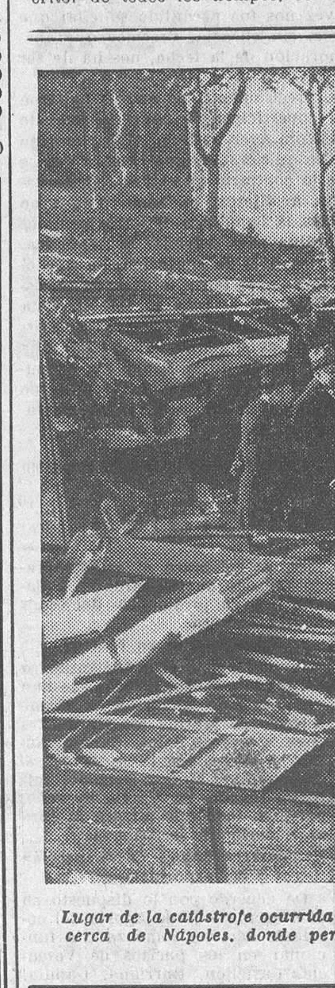
Lugar de la catástrofe ocurrida en la línea férrea Tel Vesubio, cerca de Nápoles, donde perdieron la vida siete personas