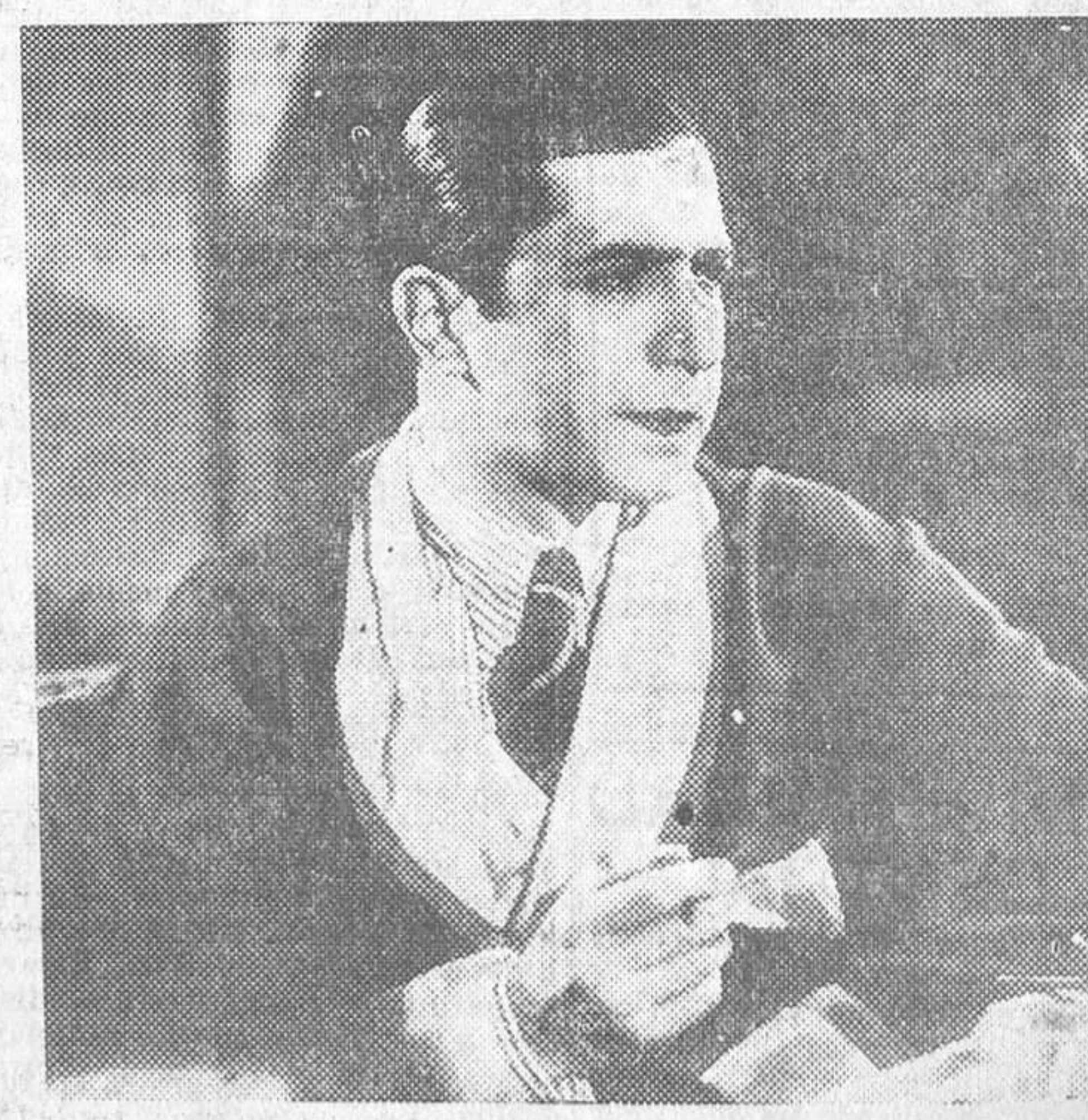
CARLOS GARDEL, QUE, CON IMPERIO ARGENTINA, ACTUA EN EL FILM PARAMOUNT «MELODIA DEL ARRABAL», QUE EL LUNES SE ESTRENARÁ EN LA PRENSA