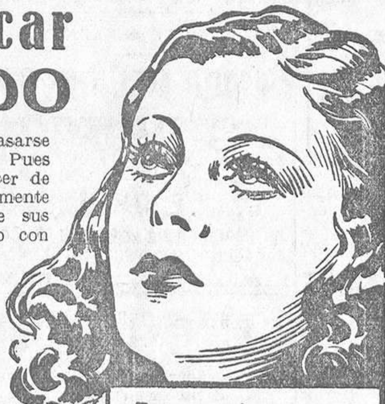
Esta es la joven que podría casarse con un millonario en 1934

¿Desea usted de veras casarse espléndidamente este año? Pues entonces es necesario conocer de antemano lo que precisamente atraerá más al hombre de sus ensueños.