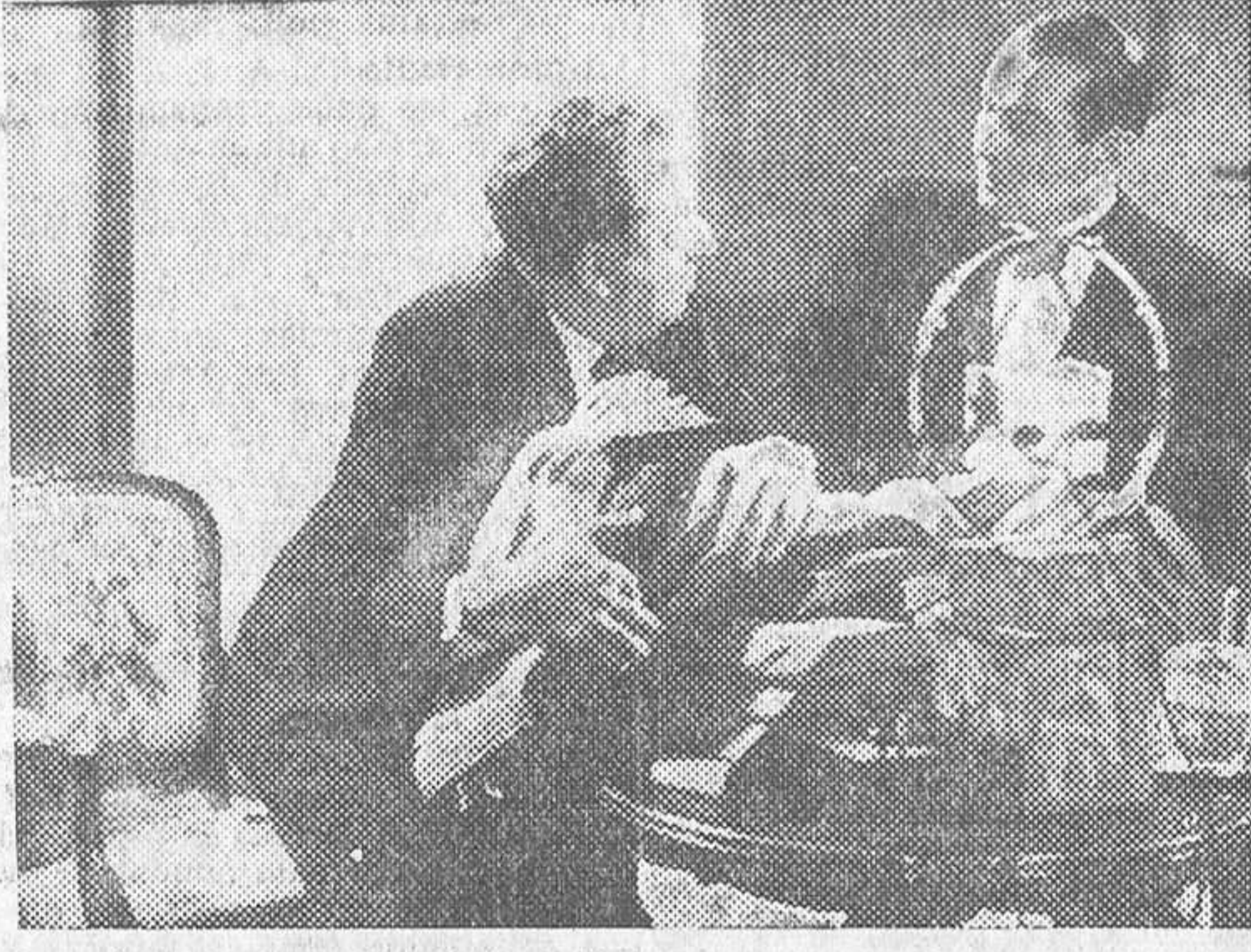
EL GRAN TENOR JAN KIEPURA Y EL GRACIOSISIMO LUCIEN BAROUX EN «TODO POR EL AMOR», PELICULA UFILMS QUE SE PROYECTA CON EXITO EN EL CAPITOL