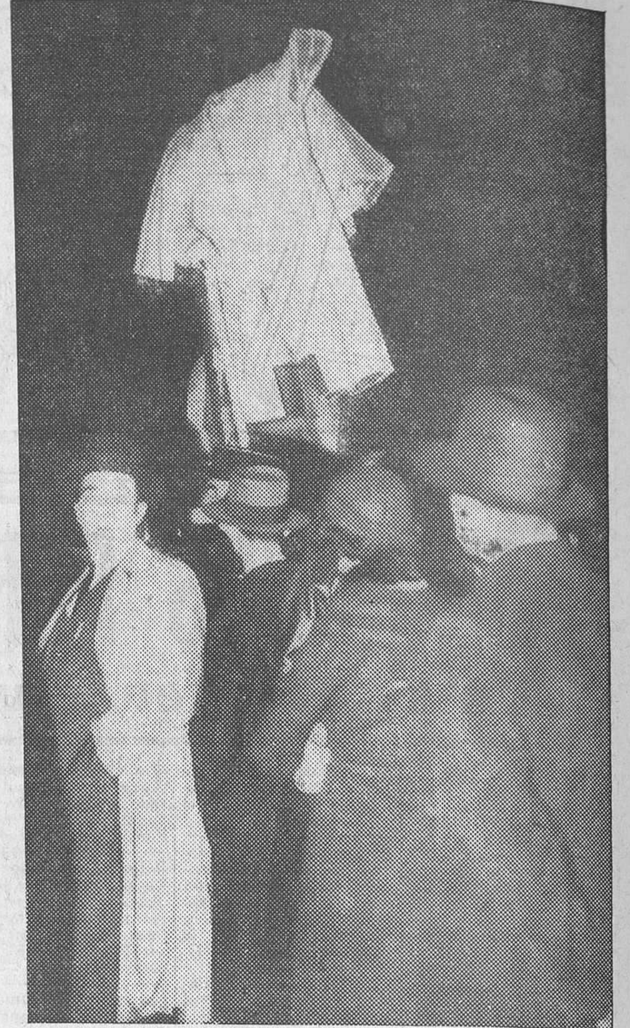
El público examinando la estatua de Déroutède, en el «square» Laborde, que ha sido decapitada y manchada de tinta por un individuo, en venganza de otra injuria causada a la estatua de Briand

Los franceses, menos apasionados que los españoles, atribuyen a tales noticias la importancia fundamental que realmente tienen. Puesto que se trata de agrupaciones campesinas para la suma de los esfuerzos individuales, es claro que los pequeños propietarios no tienen nada que temer de la colectivización de la tierra. Allí, lo mismo que en España, no tiene la agricultura más enemigo que el detentador de grandes extensiones de tierra. Para hacer posible todo el rendimiento del maquinismo agrícola basta con distribuirlo. No hay razón, ni moral ni social, que autorice el que el «amo» de la tierra se beneficie con una parte del esfuerzo de cada