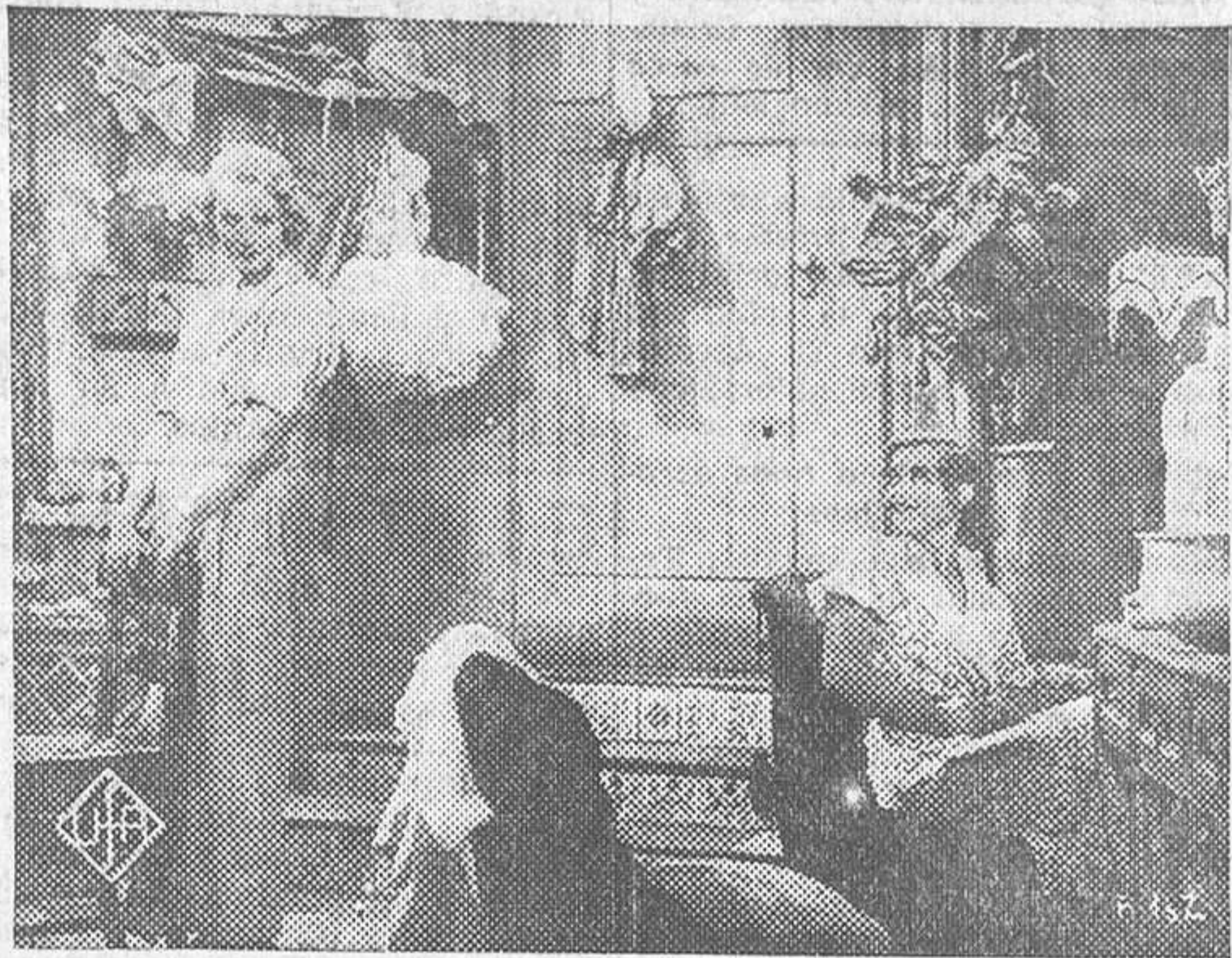
BRIGITTE HELM EN «ESTRELLA DE VALENCIA», FILM REALIZADO POR LA U. F. A. EN ESPAÑA QUE EL LUNES SE ESTRENARÁ EN EL AVENIDA

Ha sido preciso idear un nuevo método a fin de caracterizar a los artistas que toman parte en «Los crímenes del museo», ya que han de actuar unas veces como actores de carne y otras como figuras de cera. Los departamentos encargados de la caracterización de los artistas, tras largos y concienzudos estudios, han logrado encontrar una substancia que, aplicada con cuidado extremo sobre las facciones de aquél o aquella que ha de representar un personaje histórico en el museo de figuras de cera, puede modelarse fácilmente las facciones requeridas y puede al propio tiempo dar movilidad a la máscara