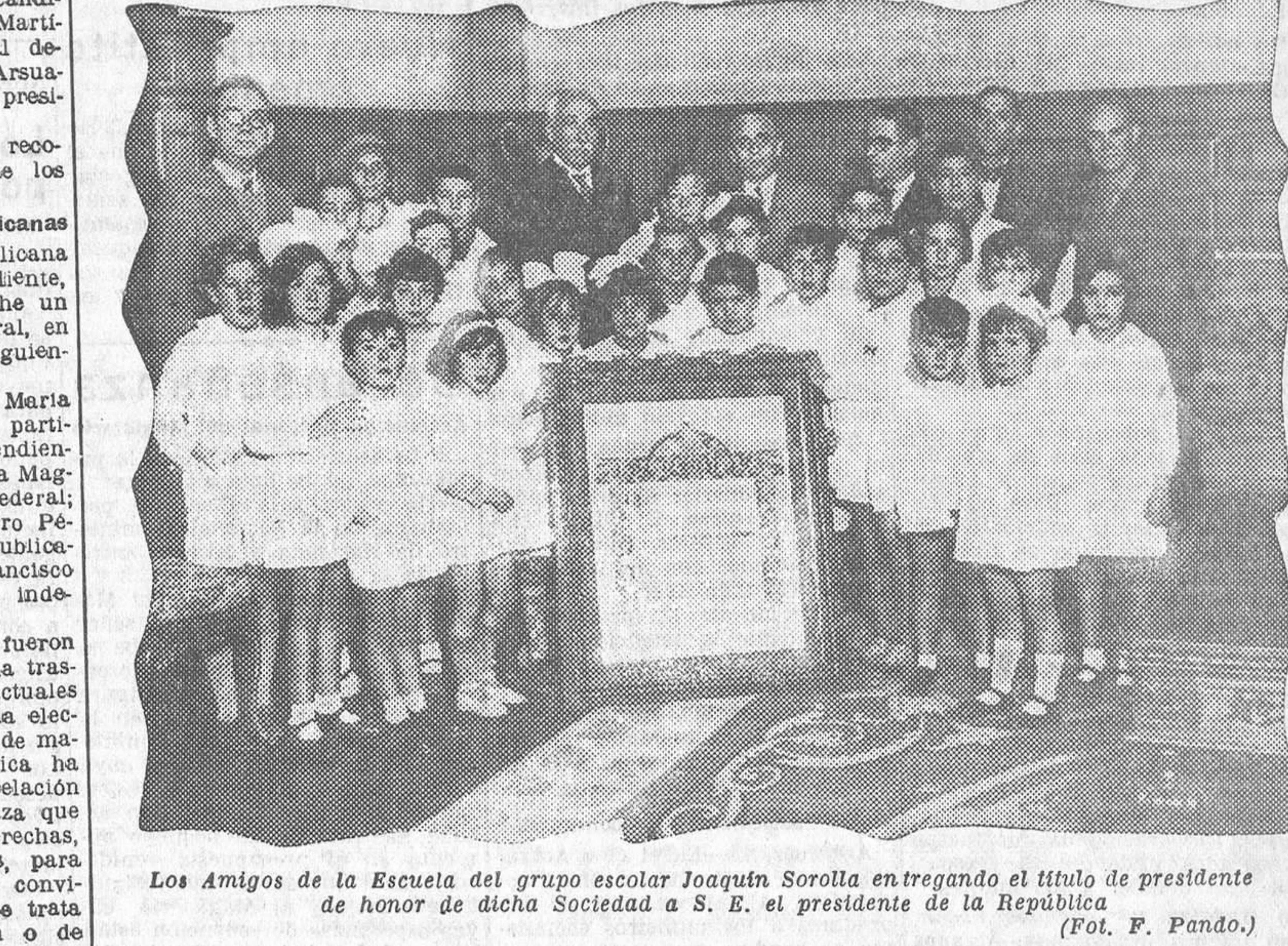
Los Amigos de la Escuela del grupo escolar Joaquín Sorolla entregando el título de presidente de honor de dicha Sociedad a S. E. el presidente de la República