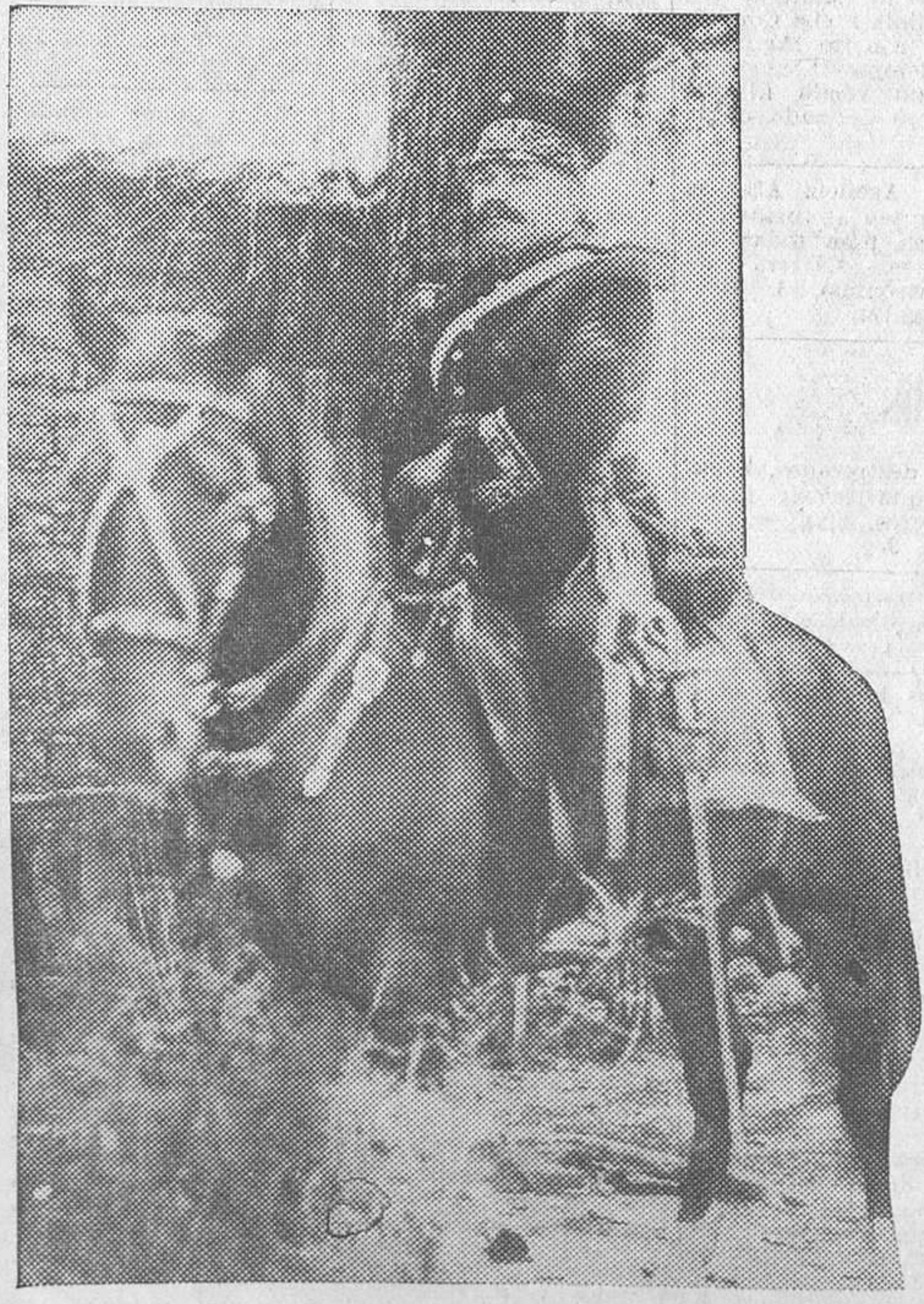
MORELOS.—El general Genovevo de la O, lugarteniente de Zapata, que manchó con muchos hechos de sangre el ideal agrario de Emiliano Zapata