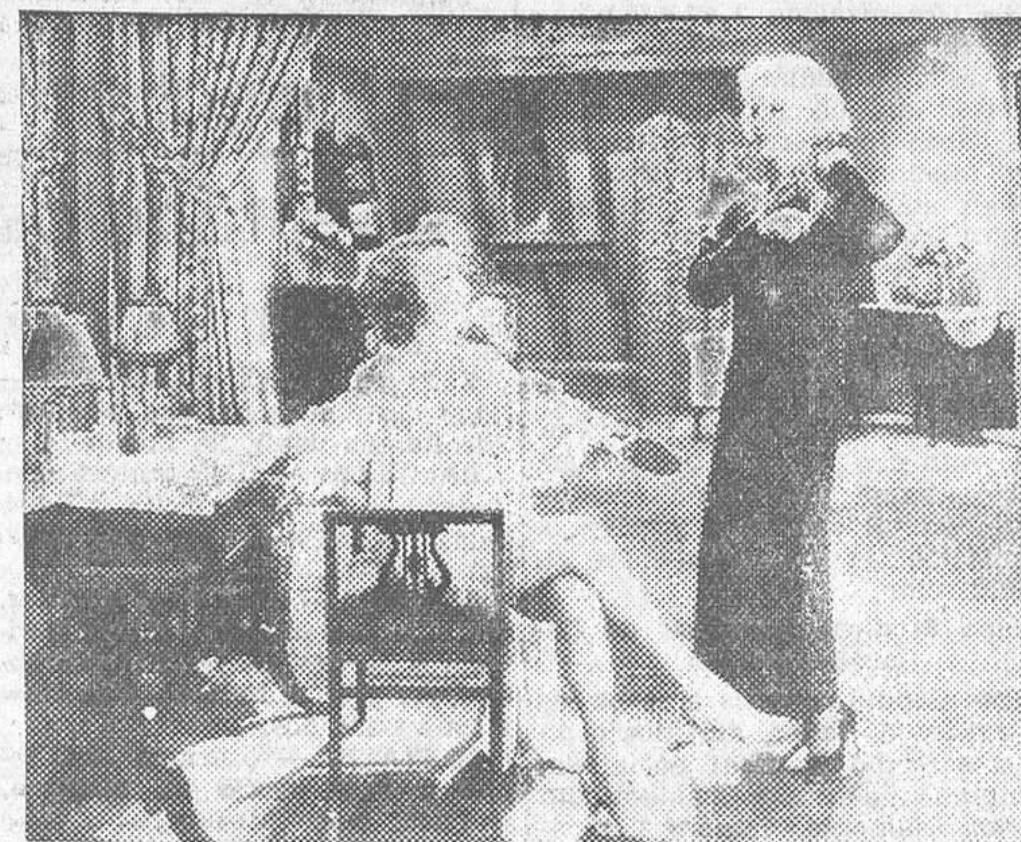
FAY WRAY Y GLEENDA FARRELL EN «LOS CRIMENES DEL MUSEO», FILM DE LA WARNER BROS QUE PROXIMAMENTE SE ESTRENARÁ EN MADRID

de cera a fin de dar expresión a aquel semblante.