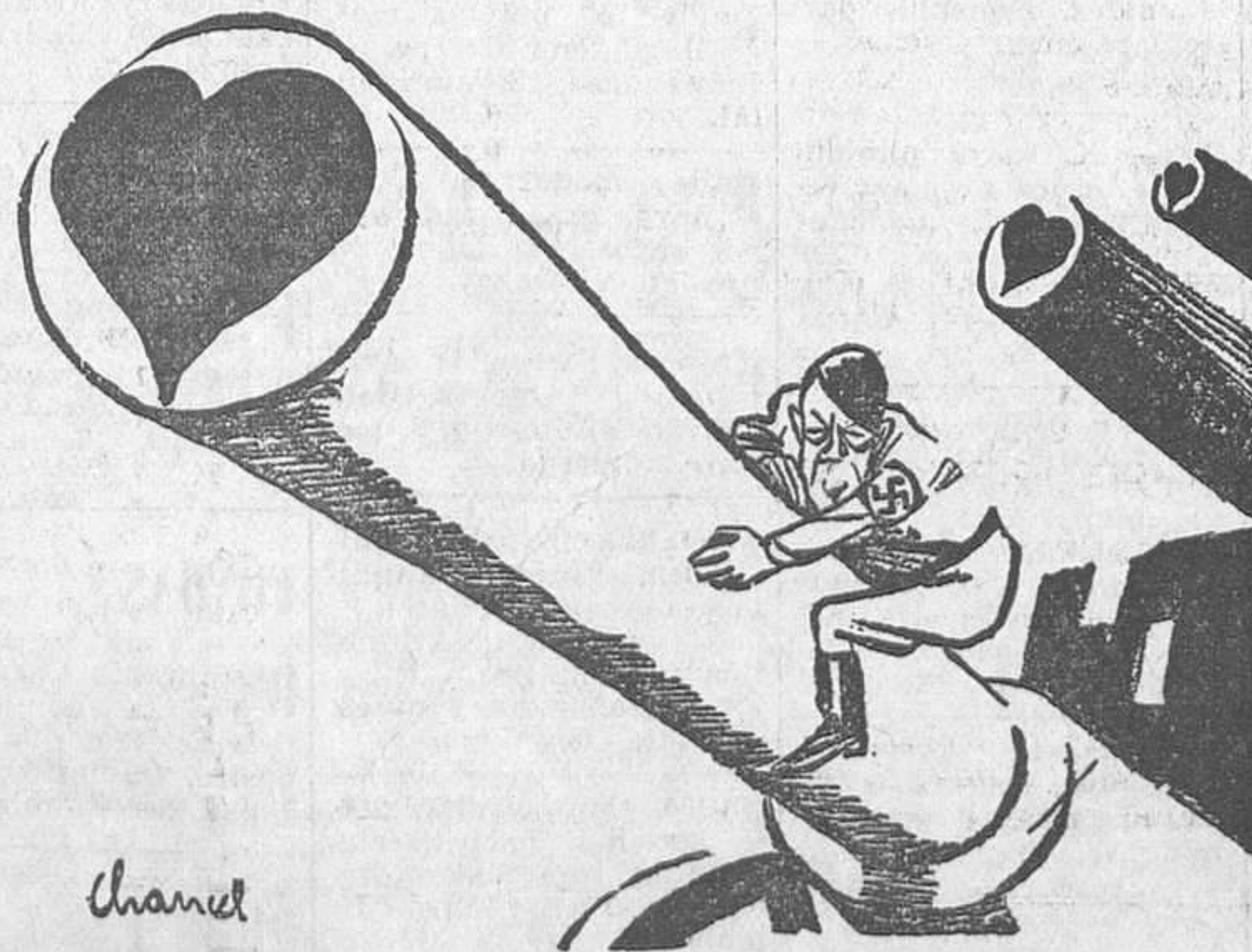
DECLARACION DE PAZ Hitler.—Nadie podrá dudar de que hablo con el corazón en la boca.