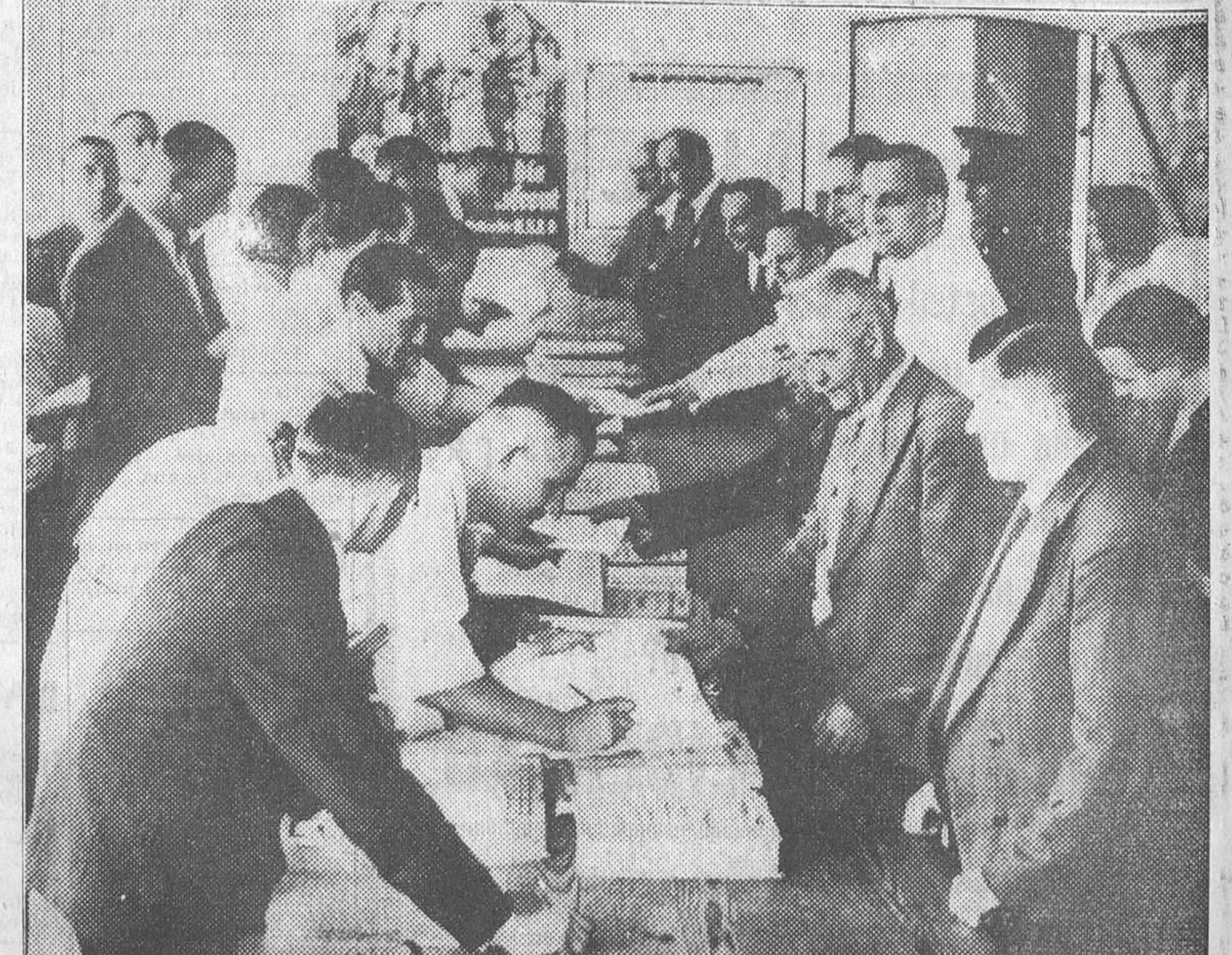
BERLIN.—Ante el plebiscito del día 19. Los votantes examinan las listas electorales para comprobar su inclusión