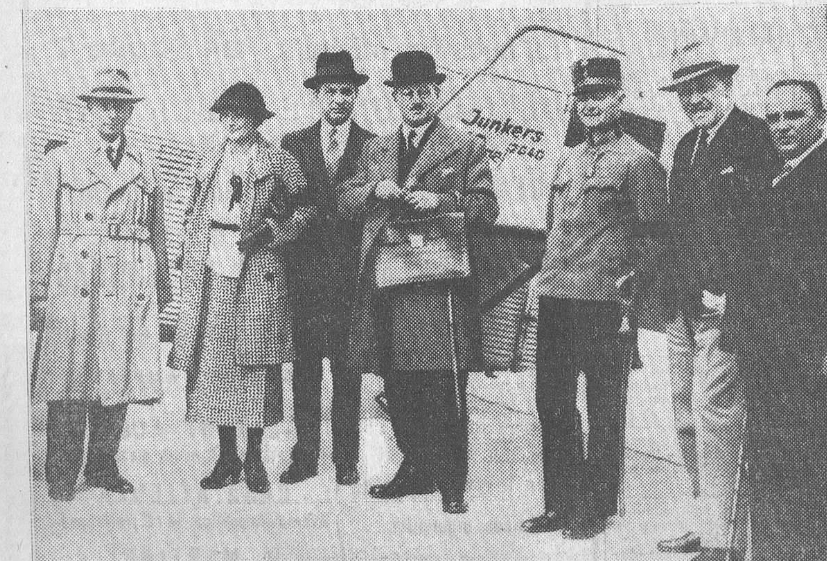
VIENA.—El canciller Schuschnigg en el momento de salir para Roma en avión para entrevistarse con Mussolini

También ha prohibido por seis meses la circulación del semanario alemán «Deutschempelt» por haber publicado artículos calumniosos contra algunos miembros de la citada Comisión de Gobierno.