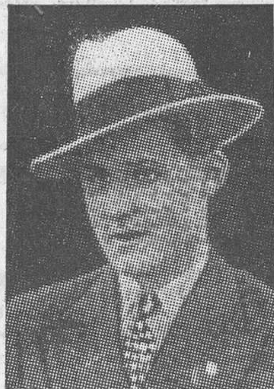
Retrato de D. Gonzalo de Borbón hecho pocos días antes del accidente que le ha costado la vida

Portschach, 14.—La ex reina de España, doña Victoria de Battemberg, y el príncipe de Asturias, D. Alfonso de Borbón, llegaron esta tarde. El funeral del ex infante don Gonzalo se verificará mañana mié-