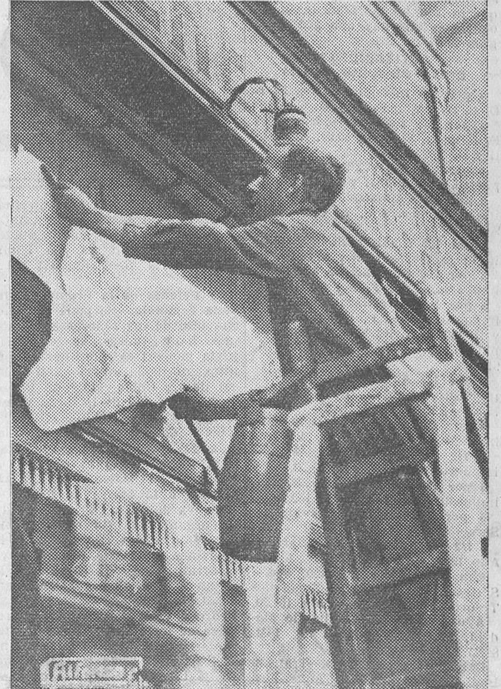
El «chico de la tienda» protesta contra el Ayuntamiento

No deja de ser curioso que cuantas veces en defensa de la pureza del idioma y de la dignidad española se le ha insinuado al Ayuntamiento de Madrid la conveniencia de imponer una medida contributiva a los letreros de las tiendas redactadas con palabras extranjeras (y no hubiera estado de más otra imposición sobre los escri-