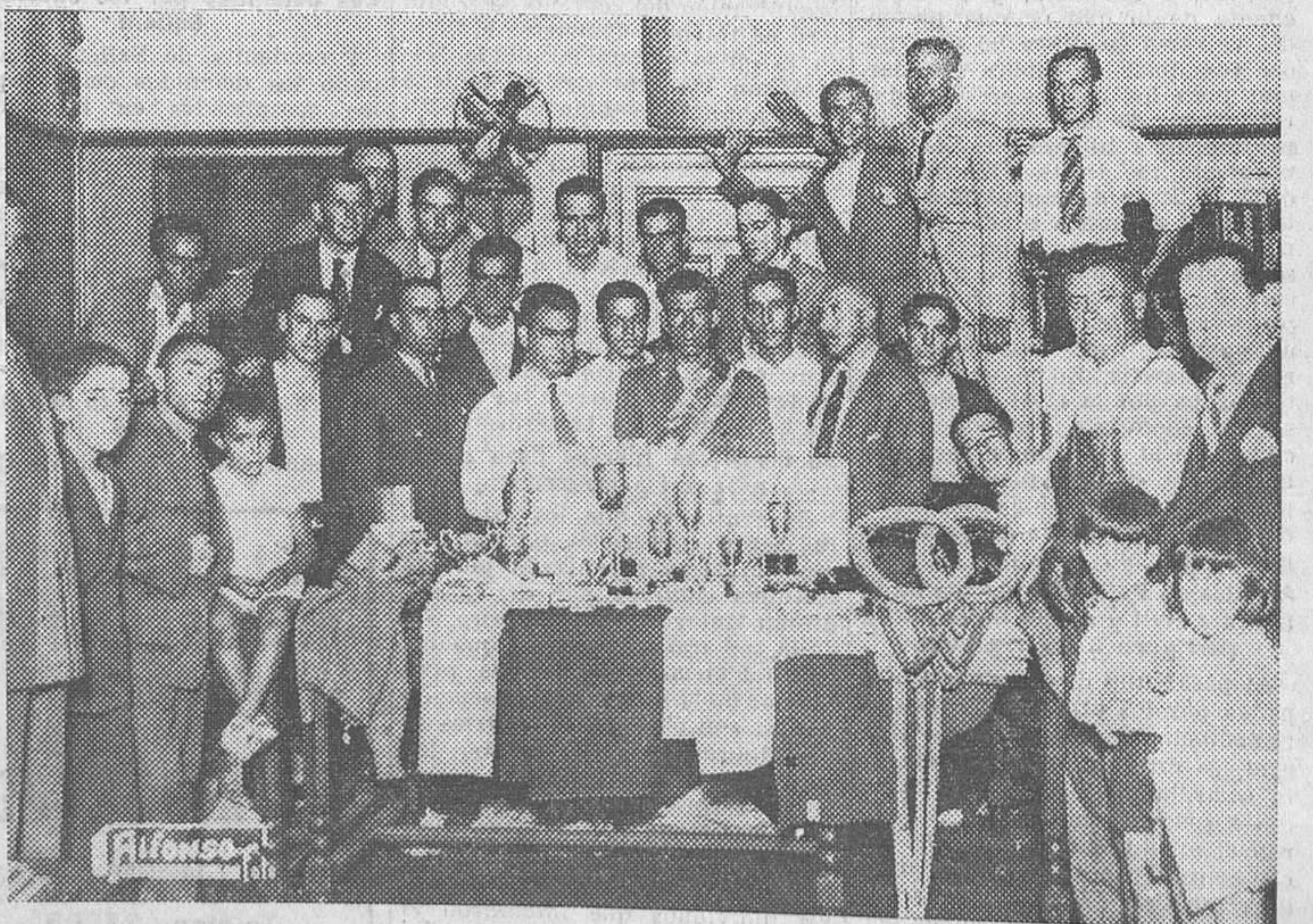
Nuestros «compañeros en la Prensa» los cuatilleros de las Redacciones de Madrid en el acto del reparto de trofeos de la carrera ciclista

Se ignoran quiénes puedan ser los autores.