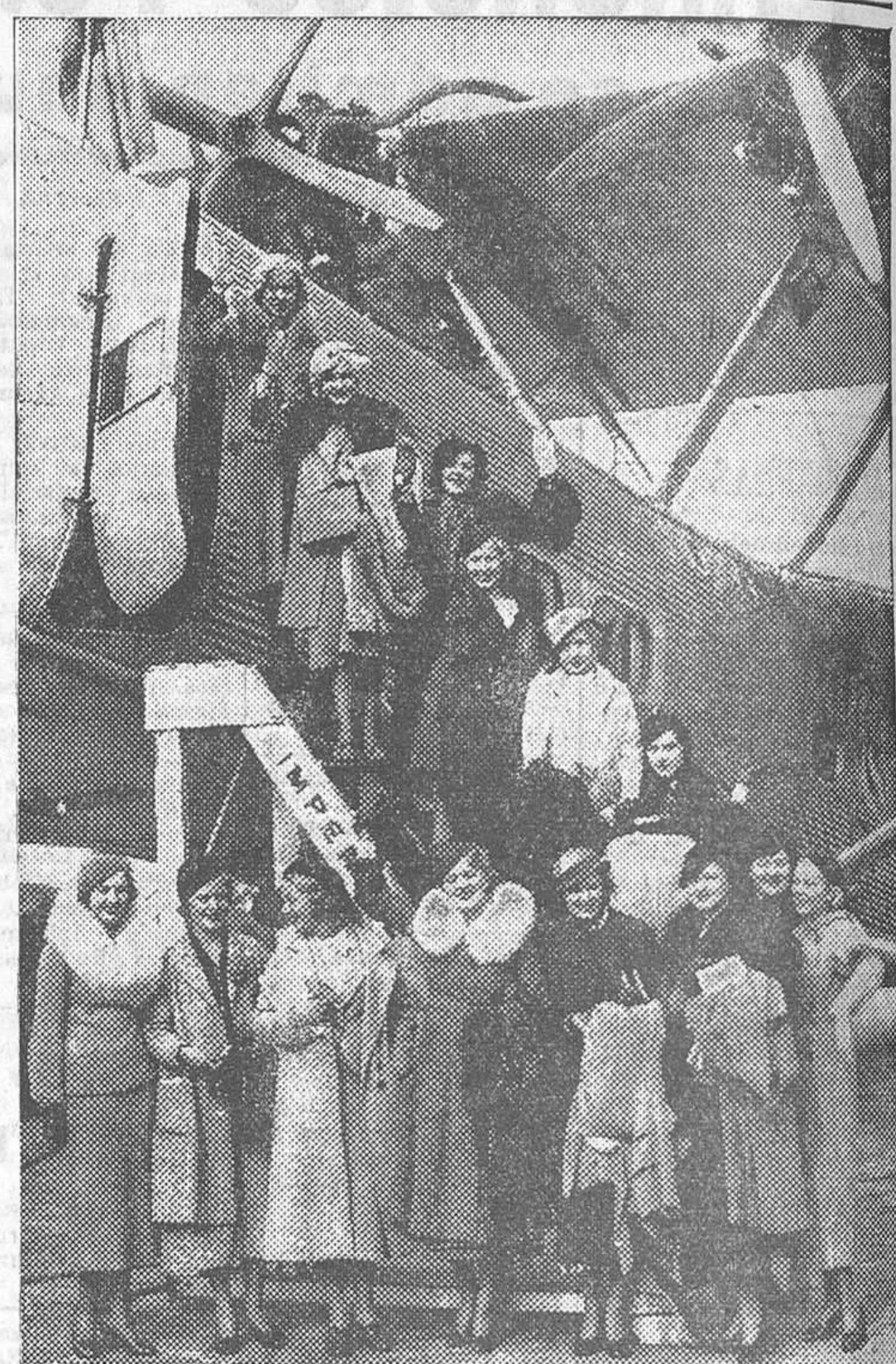
Treinta bellezas seleccionadas de los distintos teatros de Nueva York han llegado a Inglaterra, desde el continente y en avión, para tomar parte en una revista titulada «New York Midnight Folies», que se estrenará en un teatro de Piccadilly