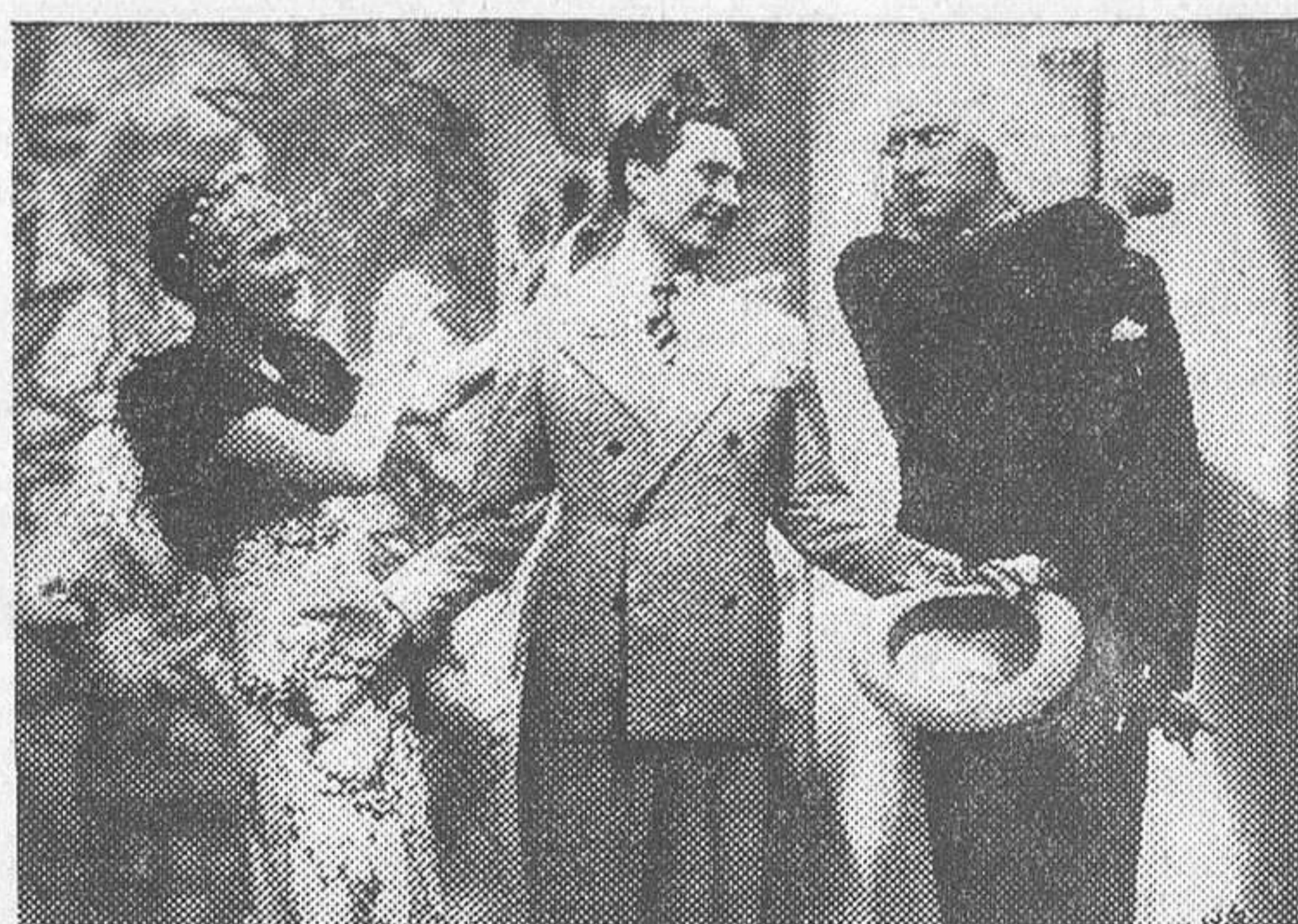
UNA ESCENA DE «RAPTEME USTED», PELICULA DE SELECCIONES FILMOFONO QUE MAÑANA VIERNES SE ESTRENARA EN LA OPERA

La colocación estratégica de las cámaras en cada avión fué estudiada cuidadosamente, llegando a la siguiente disposición: Una móvil, manejada por el piloto, situada sobre la cabina de mando, a la altura de los ojos del aviador, que tenía él mismo que enfocar. Dos cámaras más (éstas automáticas),