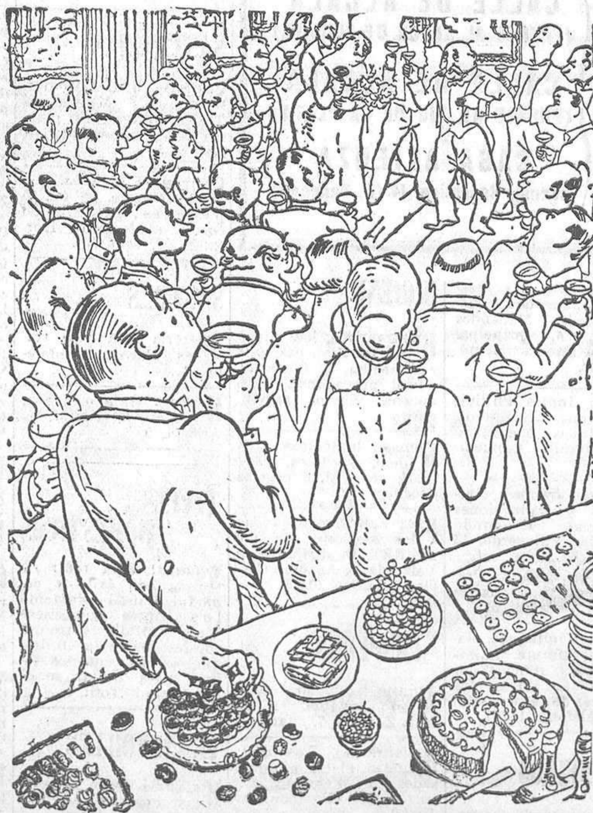
LOS VIEJOS ESPOSOS CELEBRAN SUS BODAS DE ORO El invitado visiblemente emocionado