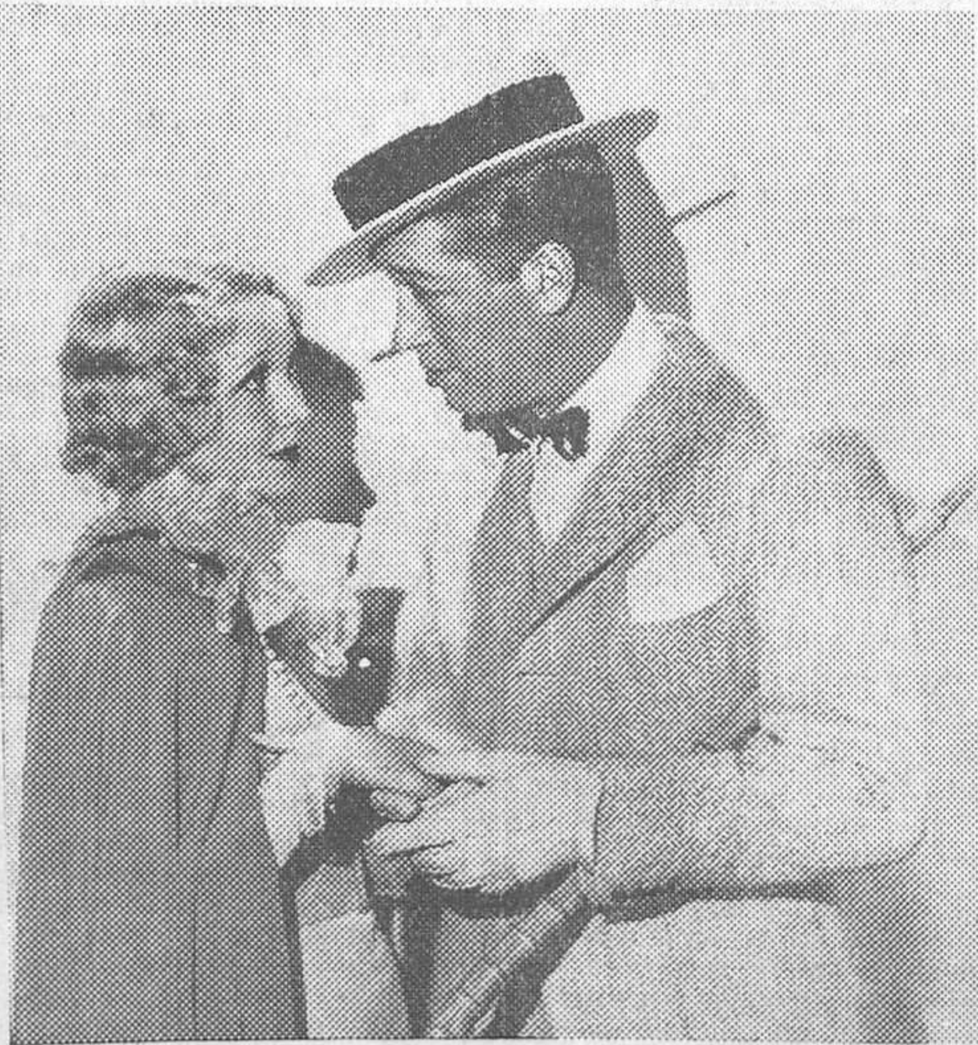
MAURICIO CHEVALIER Y HELEN TWELWETRES EN LA SUPERPRODUCCION PARAMOUNT «SOLTERO INOCENTE», FILM CON EL QUE SE INAUGURARA EL CAPITOL