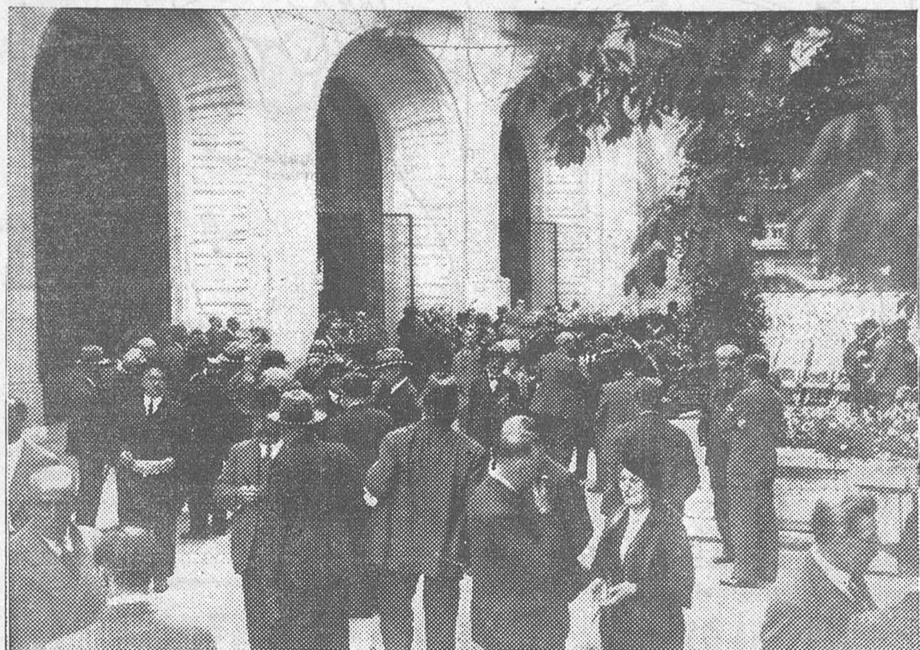
Los delegados del Congreso radical socialista que se celebra en Vichy, reunidos en el jardín del Casino