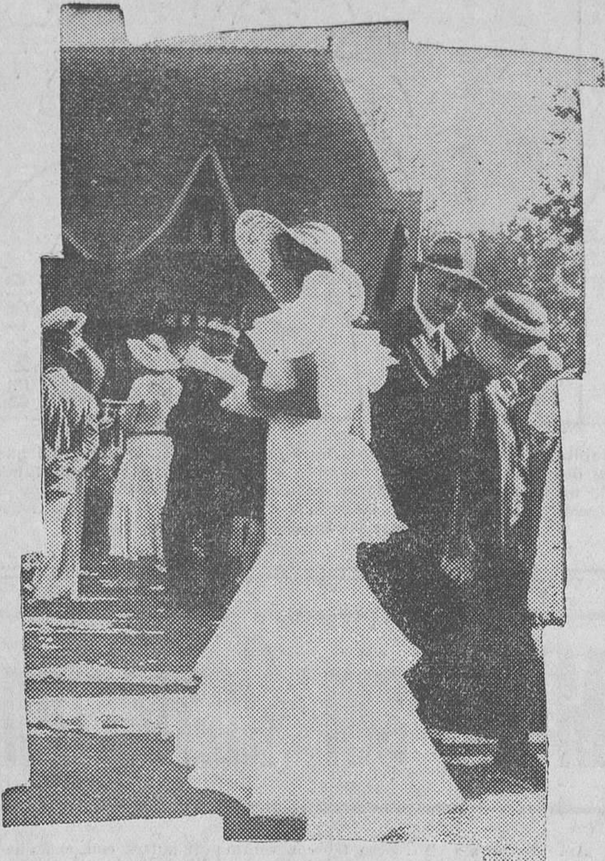
El gran premio de Deauville se ha celebrado este año con gran éxito en el hipódromo de la célebre playa. Un elegante modelo en el «pesage»