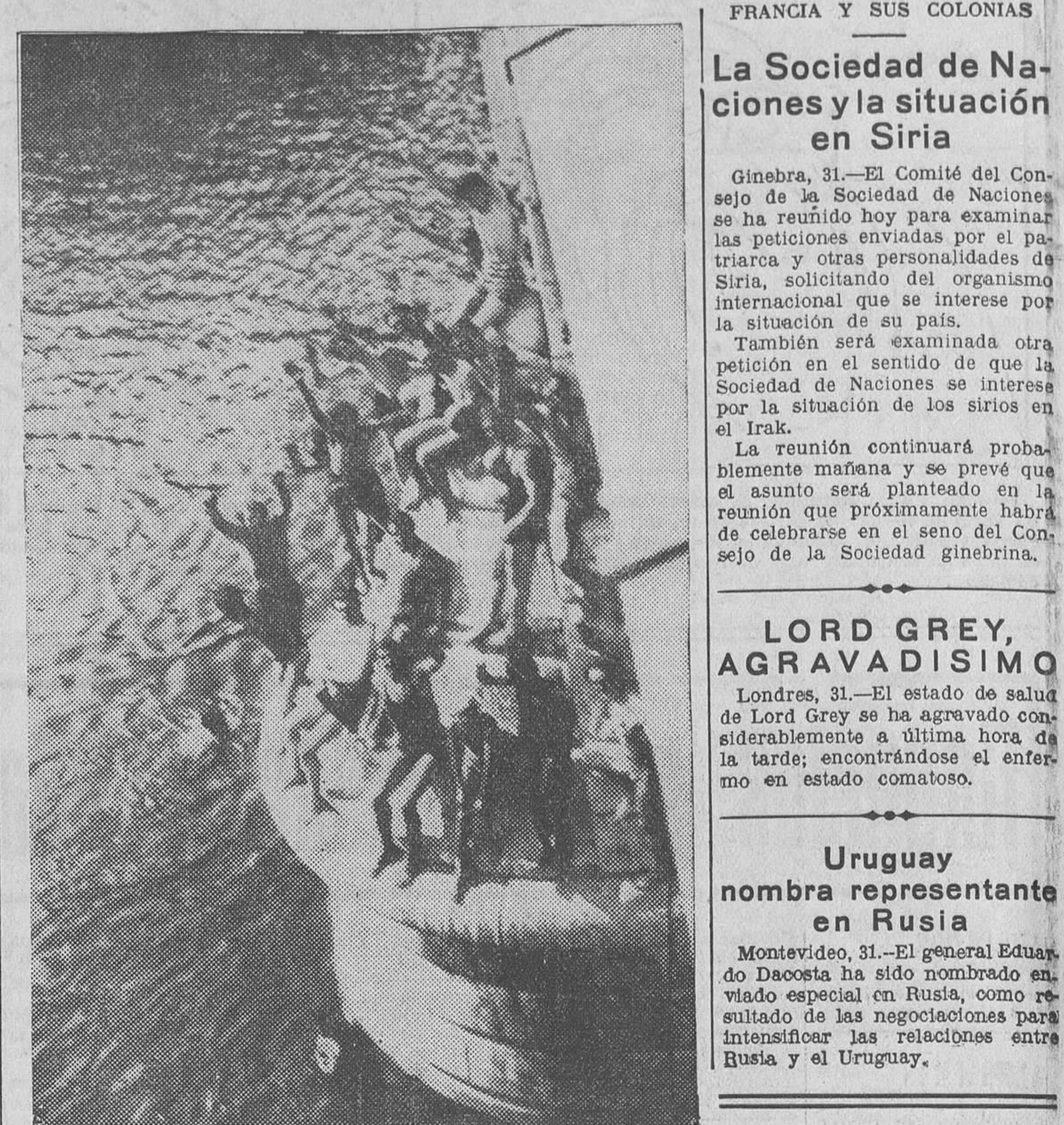
El calor asfixiante que hace en París es causa de escenas divertidas. En el Sena, los bañistas se reconfortan con la frescura de las aguas del río