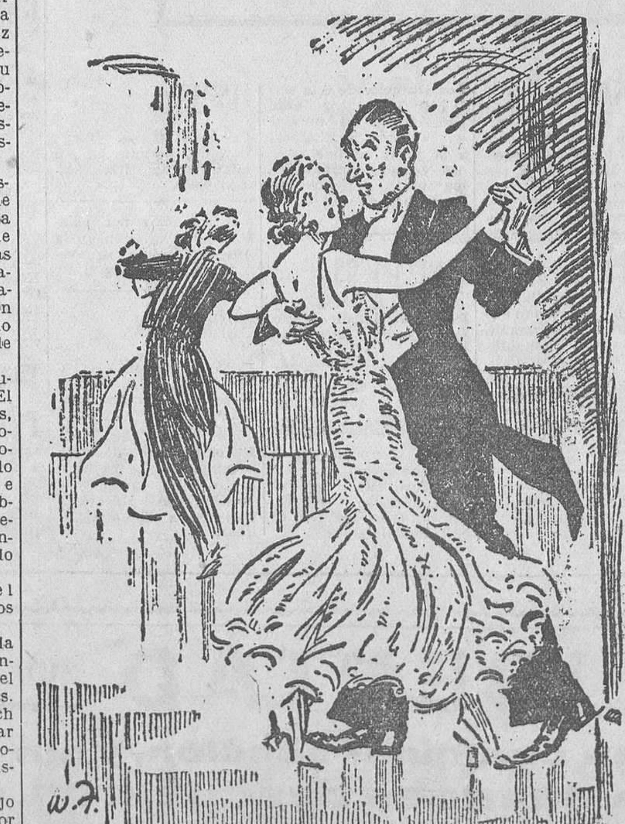
—El.—Me parece que yo he bailado con usted otras veces. Ella.—Sí, la presión de su pie de usted me es familiar. (De «London Opinions».)