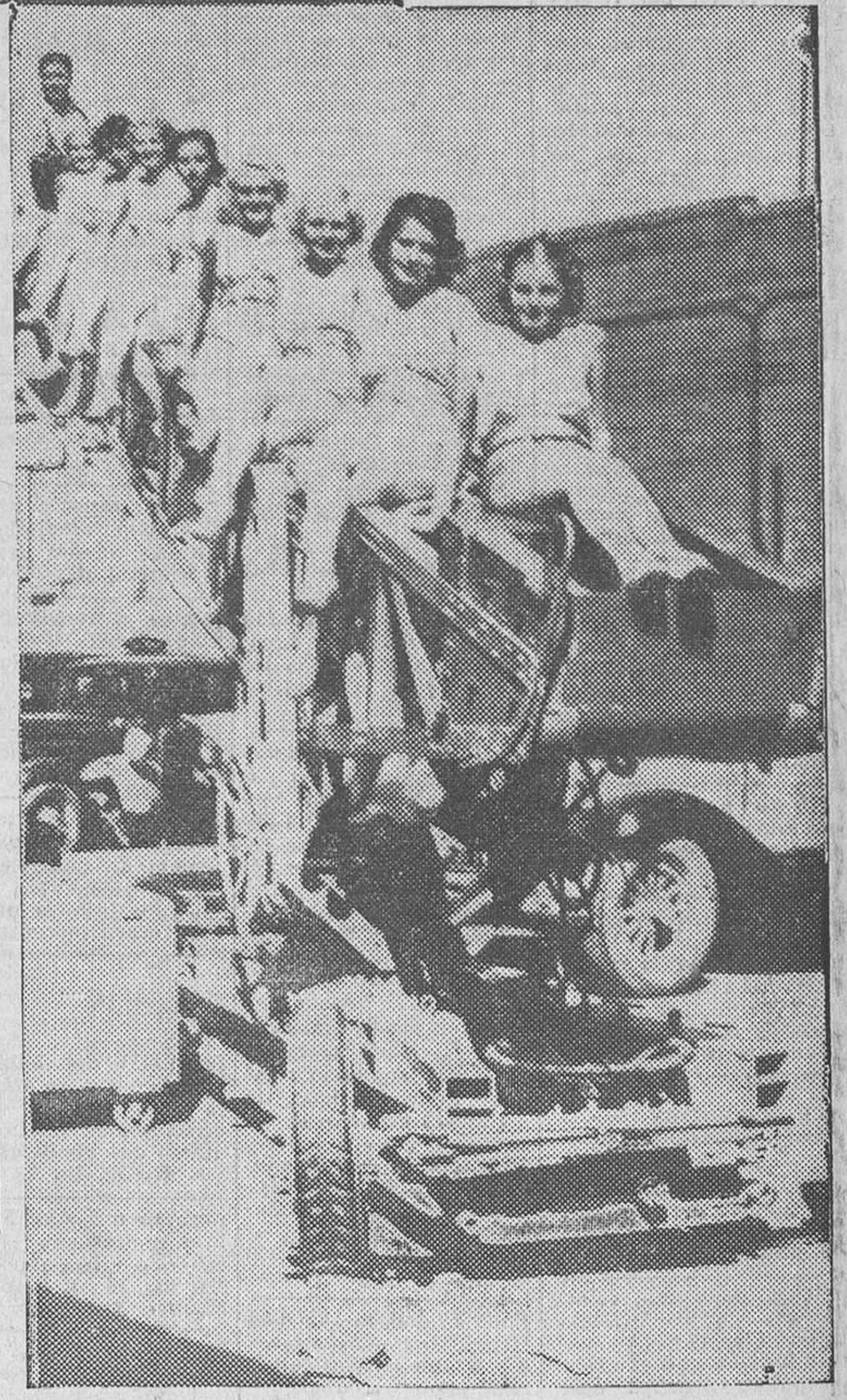
Estas simpáticas «girls» de una revista de cine se divierten, mientras se toman otras vistas, en un tobogán improvisado en el patio del estudio

Montevideo, 31.—El general Eduardo Dacosta ha sido nombrado enviado especial en Rusia, como resultado de las negociaciones para intensificar las relaciones entre Rusia y el Uruguay.