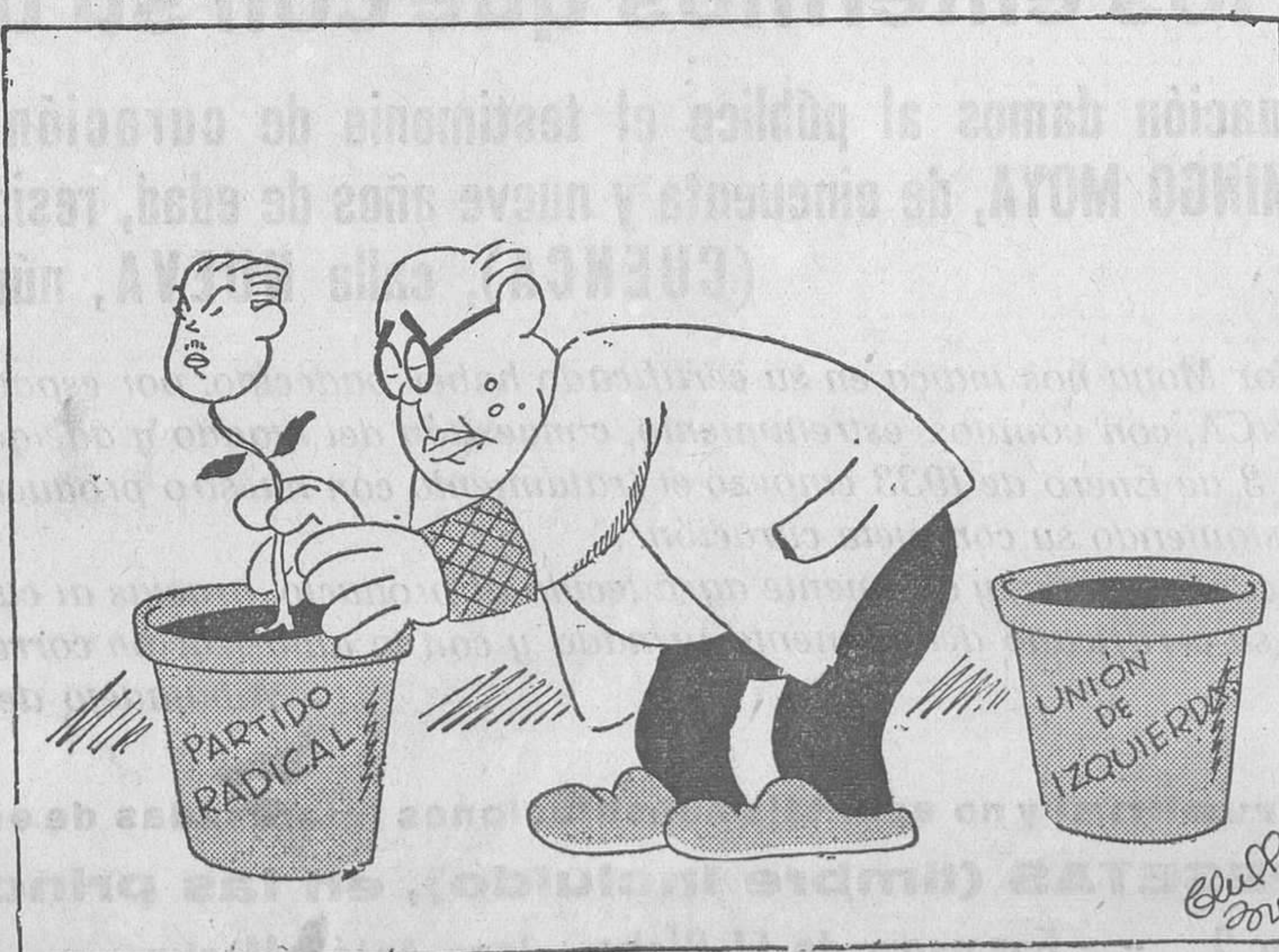
—Ya parece que le quedan pocas raíces.