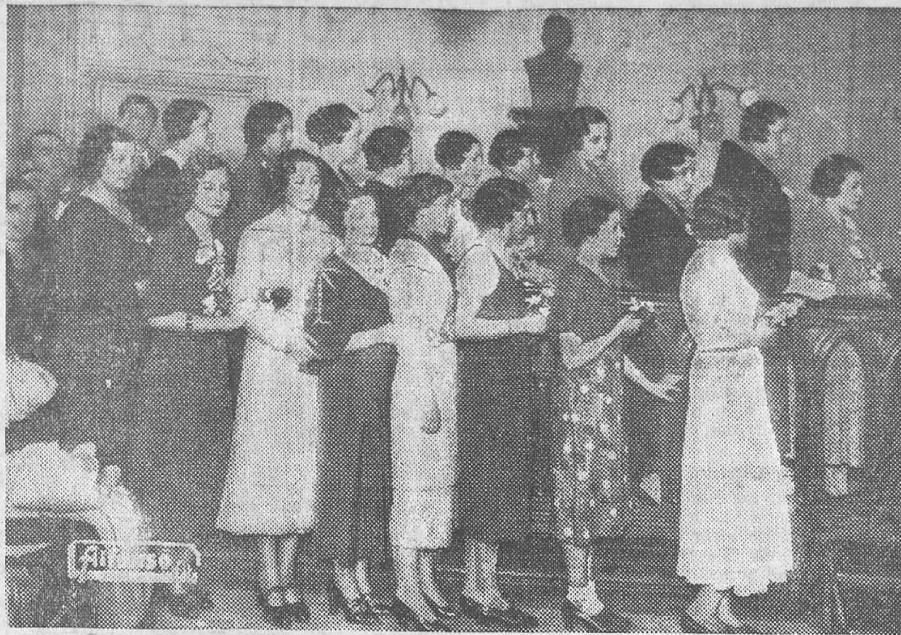
Señoritas que tomaron parte en el concurso de peinados celebrado el domingo en el domicilio de la Asociación de Patronos Peluqueros y Barberos de Madrid

Quinto.—Domingo Ortega alcanza otro éxito ruidoso con el