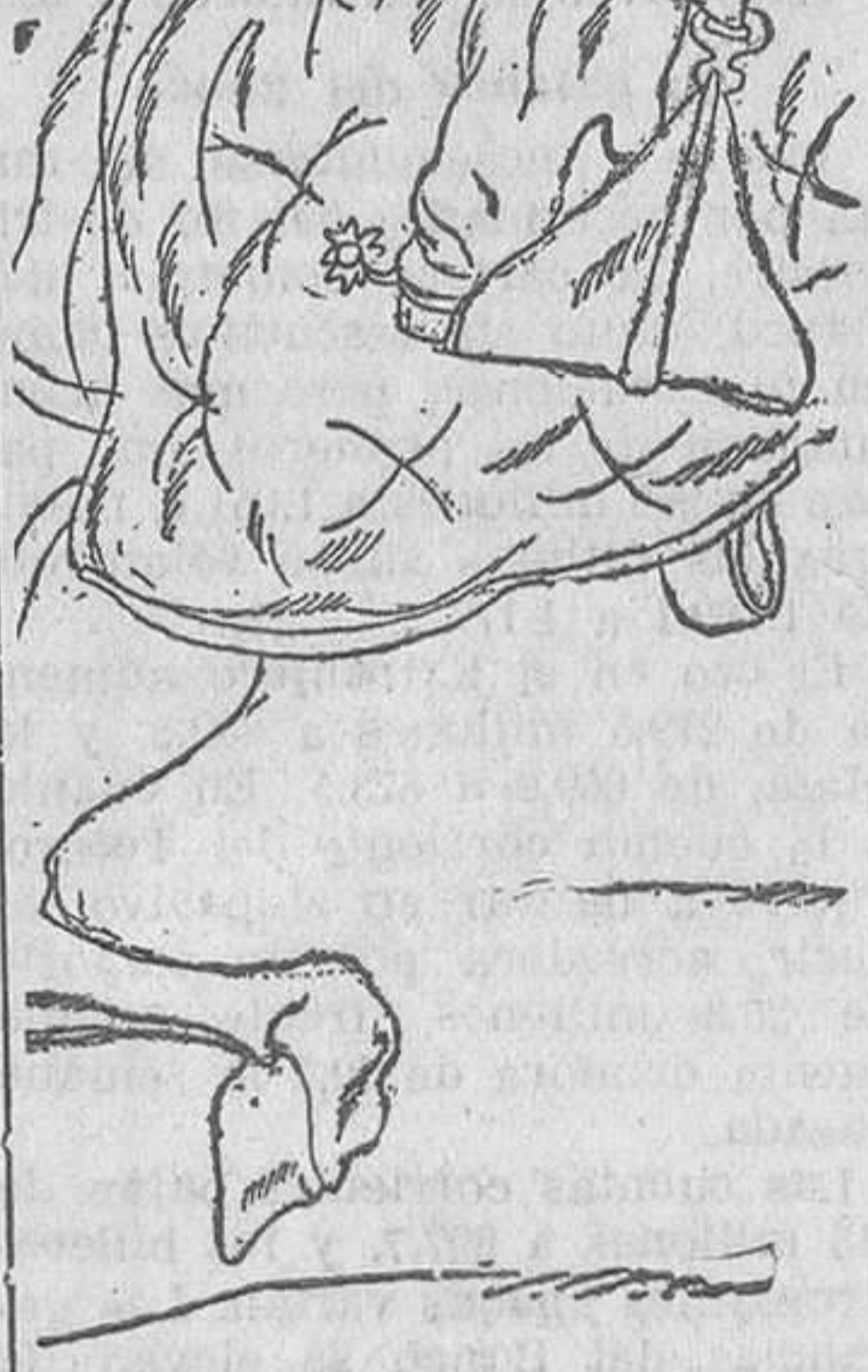
Tarde de toros (Dibujo de Sáenz de Tejada.)

Zaragoza, 2.—En el pueblo de Tosos, el vecino Manuel Barranco Lucena, jornalero, mató a su esposa, Mercedes Loras, asestandola varias cuchilladas en el cuello y otras partes del cuerpo.