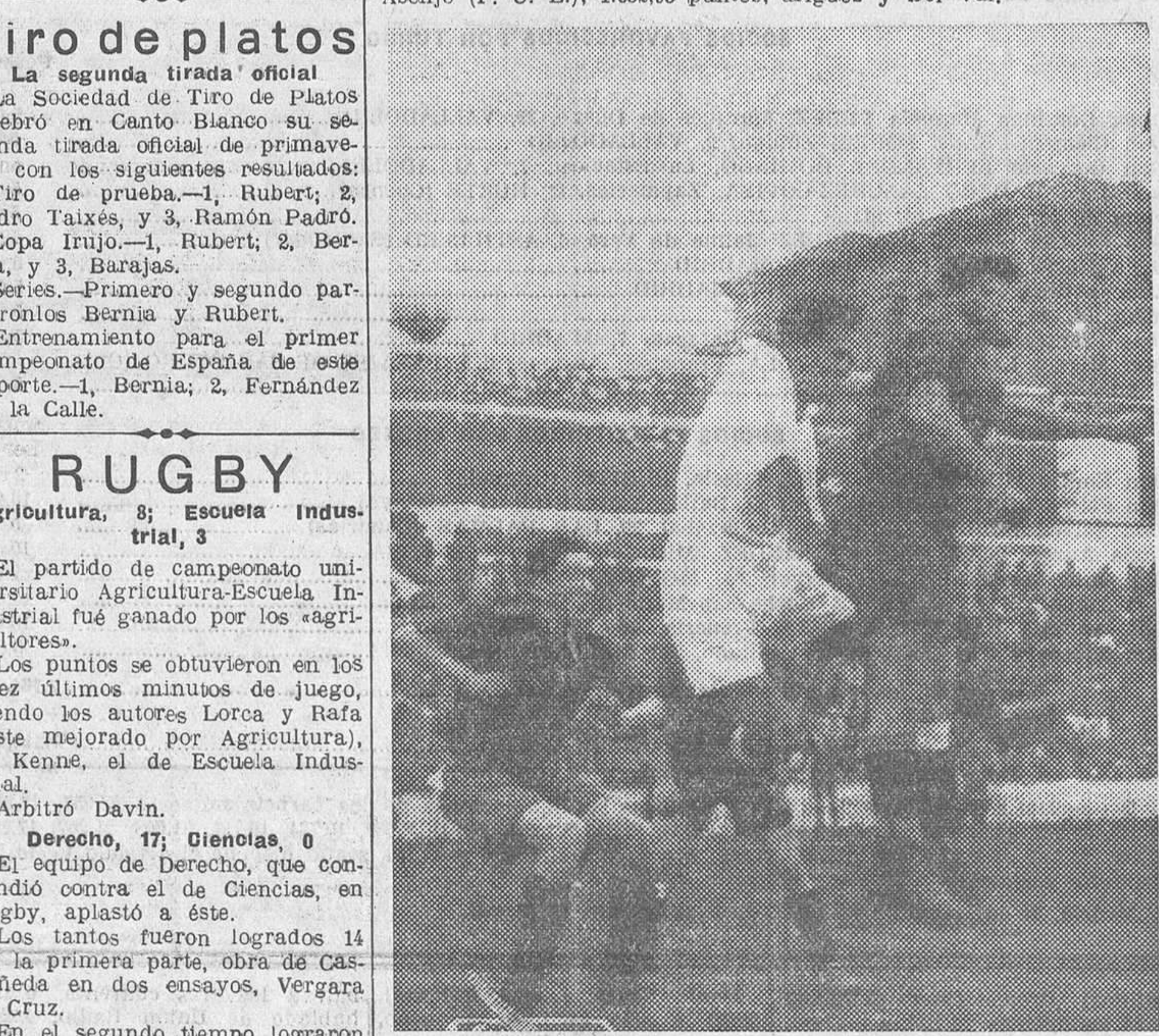
Una jugada en el encuentro de campeonato entre el Madrid y el Osasuna, de Pamplona, que resultó eliminado.

1, «Filipant» (Romera), de Francisco Cadenas; 2, «Blonde», de