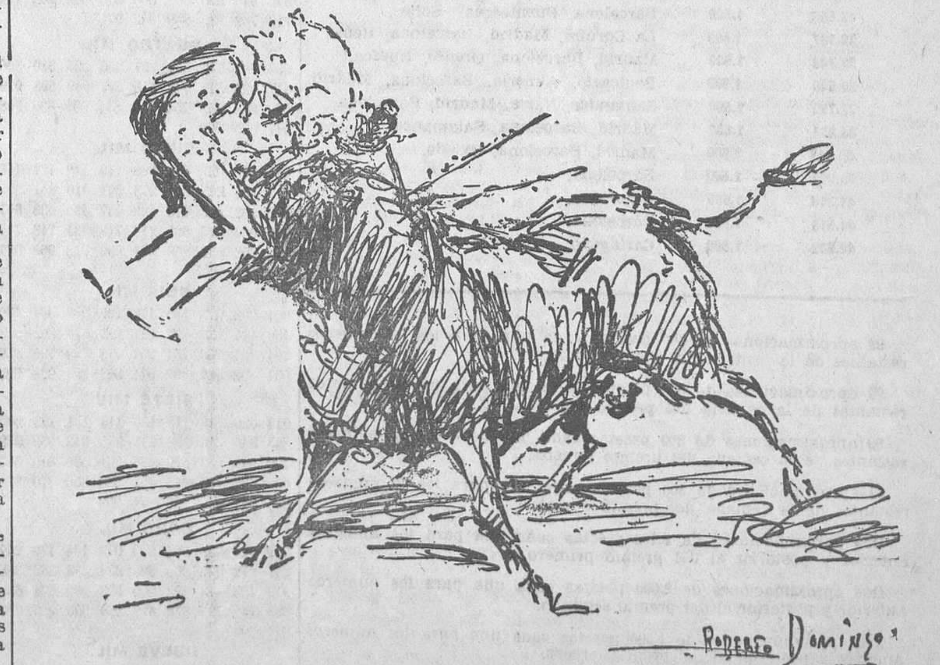
INAUGURACION DE LA TEMPORADA EN MADRID.—Cogida de Morales en el sexto toro (Apuntes del natural de Roberto Domínguez.)