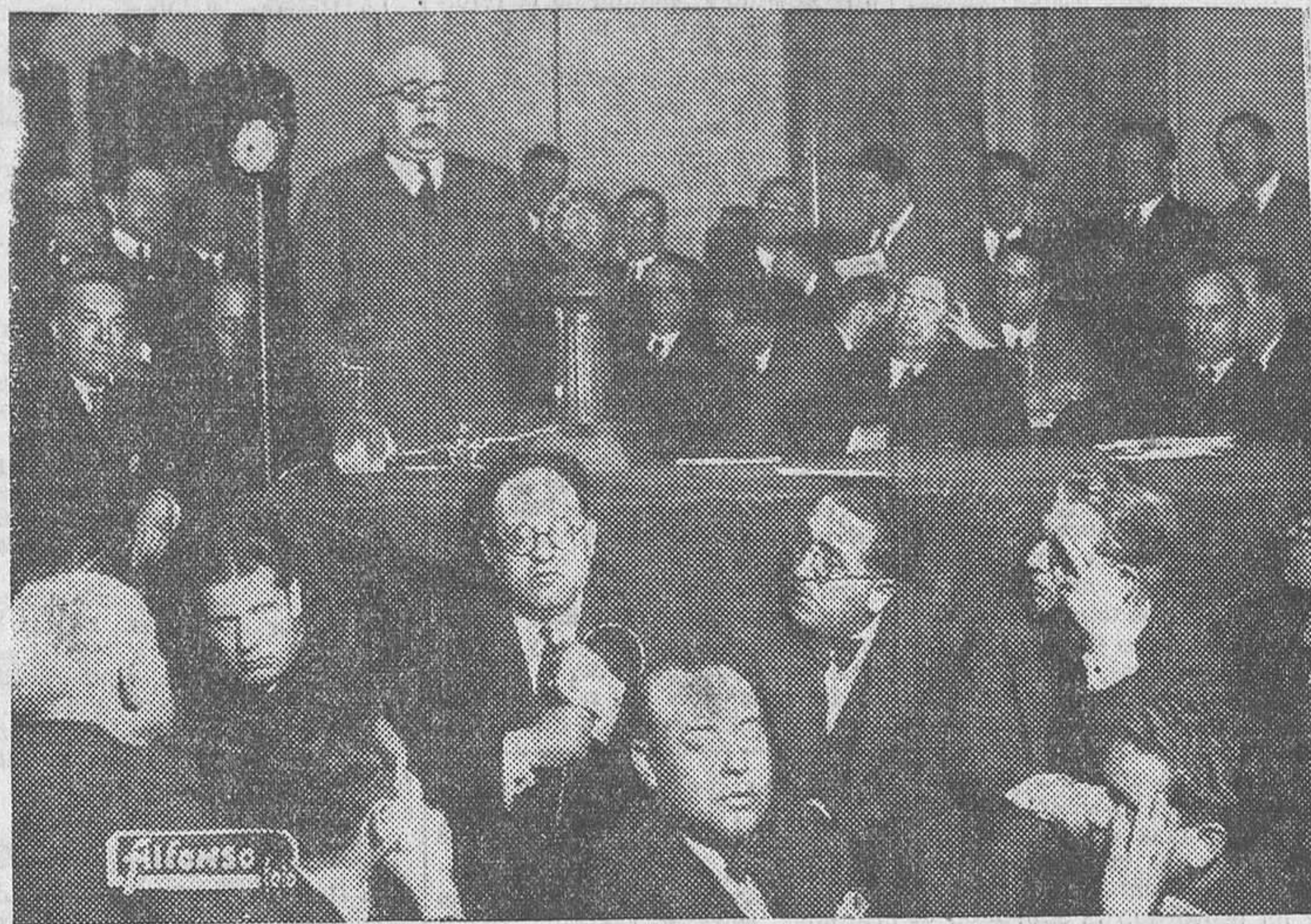
El ex presidente del Consejo Sr. Azafia pronunciando, ayer tarde, el discurso de gracias ante el nuevo partido de Izquierdas, que le eligió presidente

Y en otro aspecto del juicio que la política española me merece, en lo que se refiere a la colaboración de la clase obrera en la obra de la República, tampoco estuve mudo ni siquiera tartamudeé. Dije esa misma día 24 de Julio: