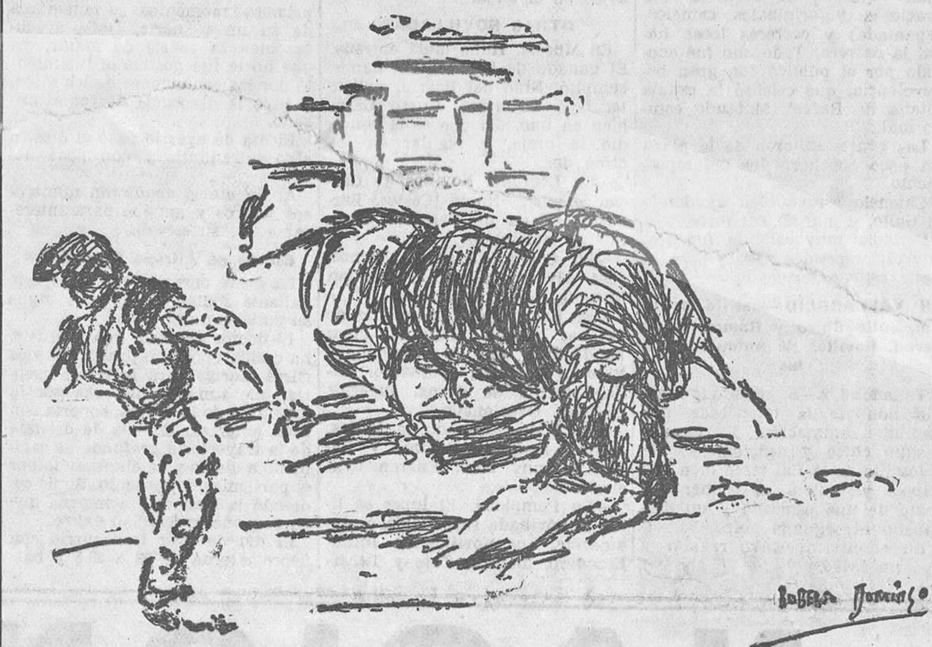
INAUGURACION DE LA TEMPORADA EN MADRID.—La salida del cuarto toro

como quiso torear el domingo, no tendría ahora el Niño de la Palma que torear por provincias las corridas que no quieren los «ases» ni se hubiera visto en este plan modestísimo de tener que venir a Madrid a la corrida de inauguración, reservada siempre a los que por no tener méritos aún o por haberlos perdido ya no alcanzan siquiera a los últimos lugares del abono.