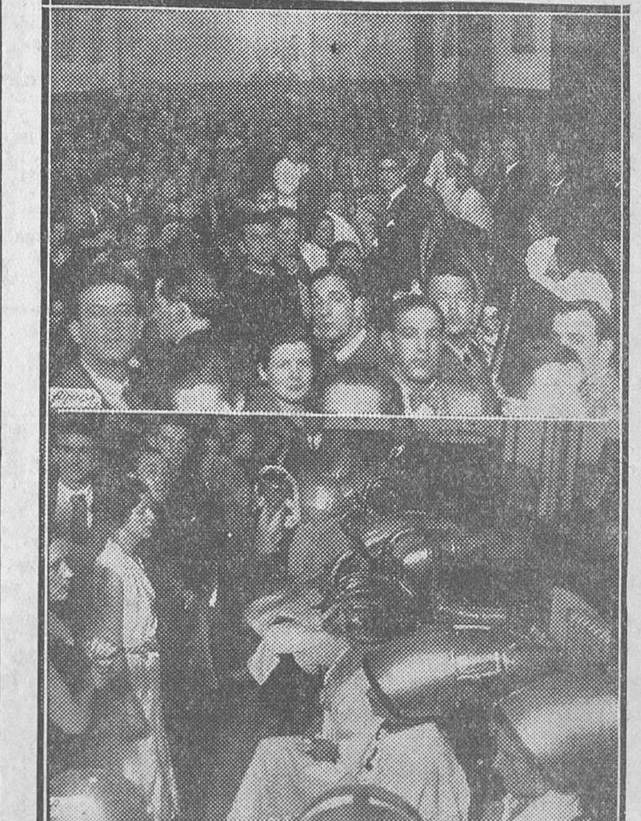
Organizado por el Congreso de Peluqueros, que actualmente se celebra en Madrid, anoche se celebró un concurso de peinados de señoras...