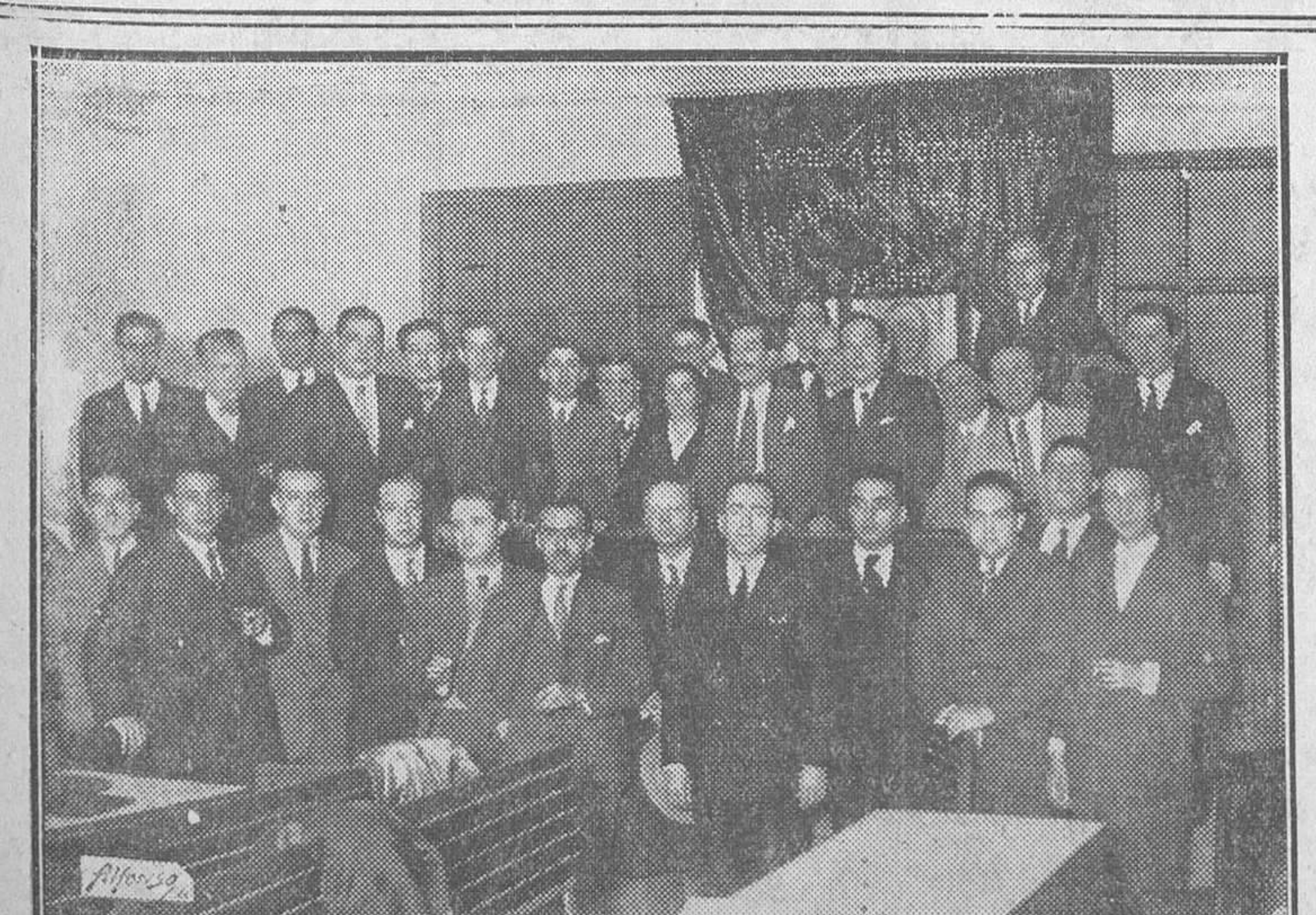
Delegados que asisten al primer Congreso ordinario de la Federación de Obreros Peluqueros y Barberos, inaugurado en el salón terraza de la Casa del Pueblo.

El Sr. Hoover no puede actuar y el Sr. Roosevelt, por su parte, estima que tampoco puede obrar con libertad.