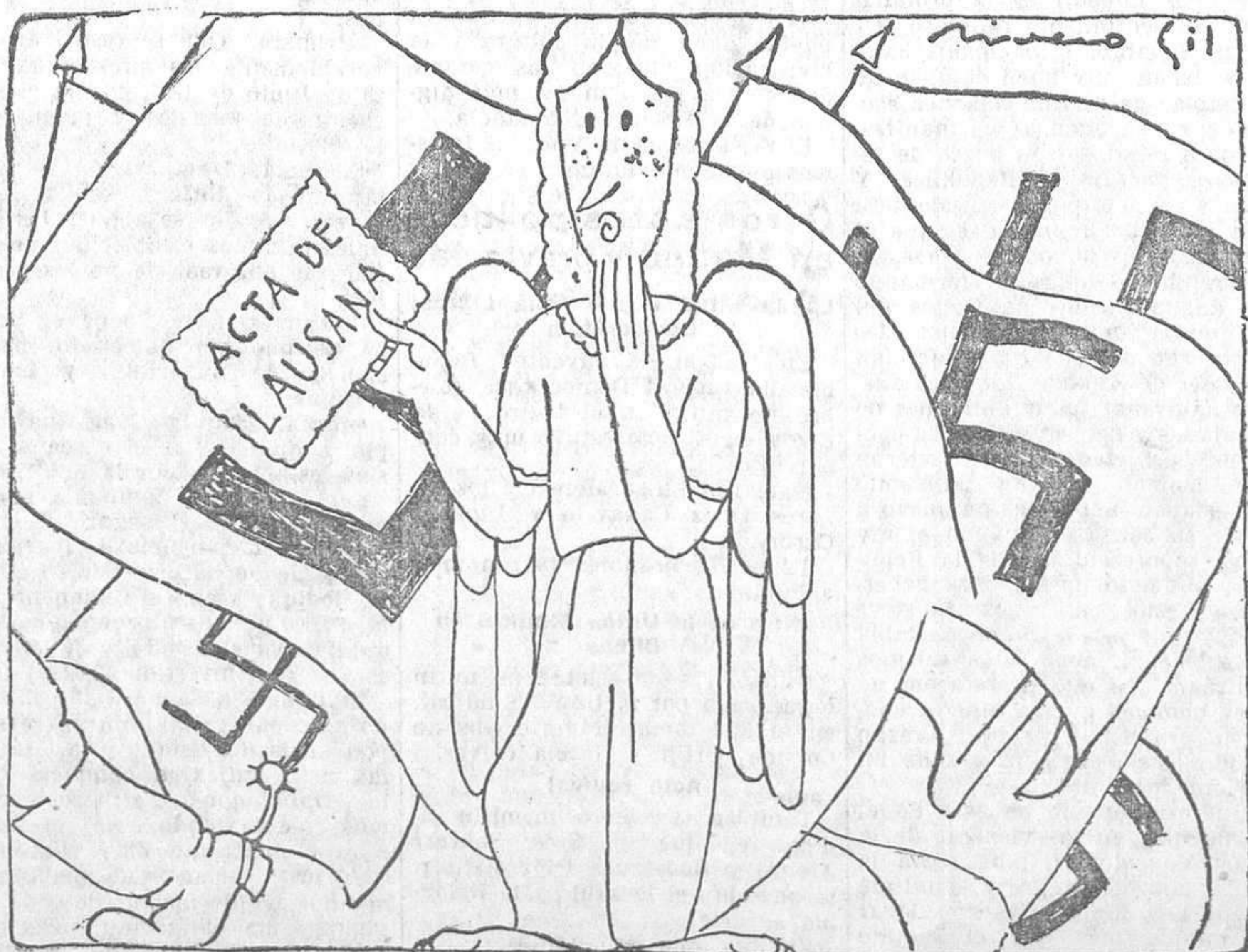
La Paz, receiosa.—¿Será un timo nuevo?

Muchos de los pasajeros, tanto hombres como mujeres y niños, se arrojaron al agua, de donde fueron extraídos por varios policías y el Servicio de bomberos y pescadores.