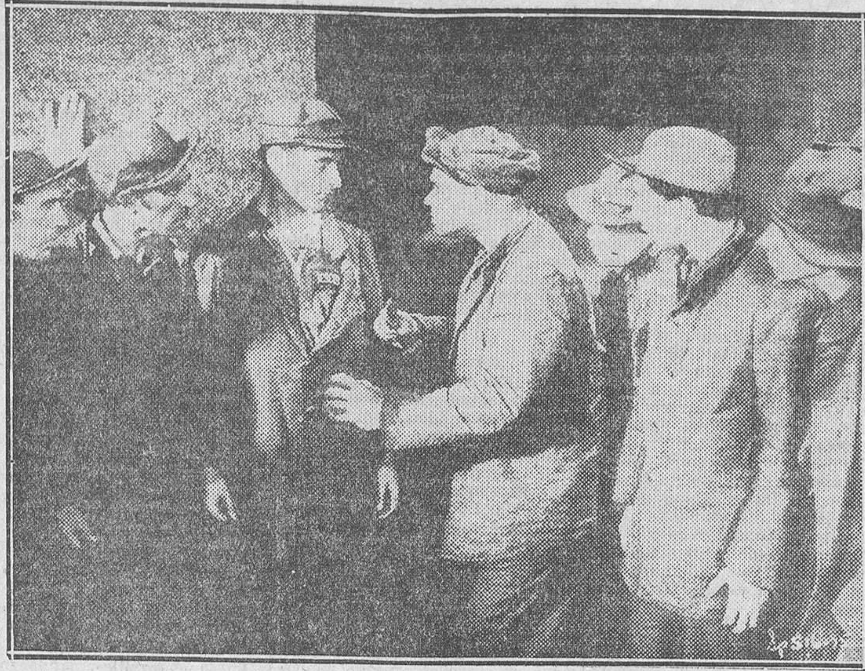
UNA ESCENA DE LA SUPER PRODUCCION METRO GOLDWYN, HABLADA EN ESPAÑOL, «EL PRESIDIO», QUE EN BREVE SE ESTRENARA EN EL CALLAO